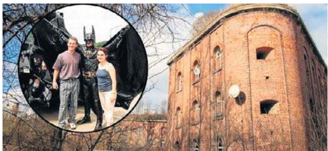
Zabytkowy Fort Jakuba nie zostanie sprzedany, ale potrzebuje naszej wspólnej troski

„Nie pytajmy więc, co ktoś może zrobić dla Fortu Jakuba, ale co my - jako społeczność - możemy zrobić dla niego” - ta dewiza przyświeca temu majowemu wydarzeniu. ©©