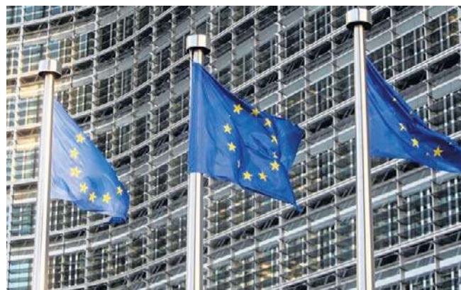
Państwa członkowskie UE wyraziły zgodę na udzielenie Ukrainie pożyczki na kwotę 90 miliardów euro