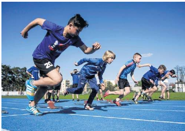
Program Klub Pro to szansa na wychowanie mistrzów sportu na Pomorzu i Kujawach

Celem ministerialnego programu „Klub Pro” jest wsparcie klubów sportowych, które uzyskały najwięcej punktów w klasyfikacji Systemu Sportu Młodzieżowego, opartym na wynikach zawodników i klubów na imprezach sportowych. Operatorem zadania jest Fundacja Lotto, która dodatkowo zasilą budżet kwotą 10 milionów złotych.