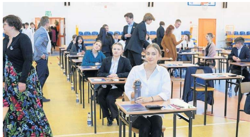
Matury - zgodnie z harmonogramem Centralnej Komisji Egzaminacyjnej - odbywać się będą od 4 do 30 maja

We wtorek, 5 maja wszyscy zdający obowiązkowo wypełnią arkusz z matematyki na poziomie podstawowym, a w środę, 6 maja przyjdzie czas na języki obce, w tym najpopularniejszy angielski, ale też nie-