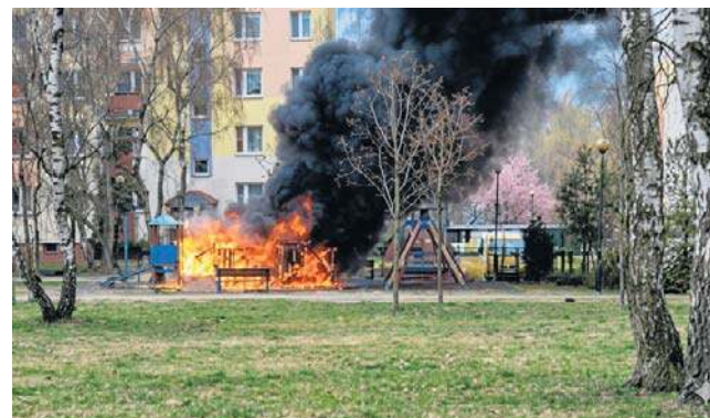
Sprawcą pożaru placu zabaw przy ulicy Wyszyńskiego 16 w Toruniu okazał się ośmioletni chłopiec

Ogień spowodował wiele zniszczeń na placu zabaw należącym do Spółdzielni Mieszka-