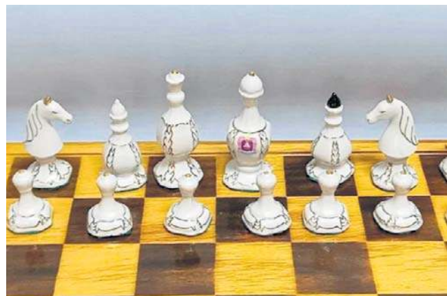
Podobne porcelanowe figury szachowe Piotr M. miał w swojej „ofercie” i wystawiał je na sprzedaż

Prokuratura Rejonowa Toruń Centrum Zachód akurat sprawę poszkodowanych klientów z Torunia poprowadziła skutecznie, łącząc także ze sprawą oszukanych z Częstochowy.