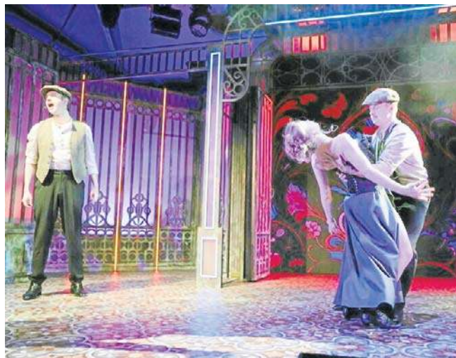
Premierę „Kelnerskiego tanga” zaplanowano na 24 kwietnia. Wczoraj odbyła się próba medialna spektaklu