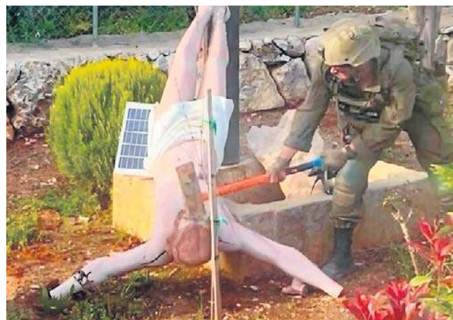
Na fotografii udostępnionej przez dziennikarzy widać żołnierza rozbijającego figurę Jezusa ciężkim młotem

Sprawę skomentował w poniedziałek na X szef MSZ Radosław Sikorski. „Dobrze, że minister Saar szybko przeprosił, było za co. Należy ukarać tego żołnierza, ale i wyciągnąć wnioski wobec sposobu, w jaki są formowani” - napisał Sikorski. PAP