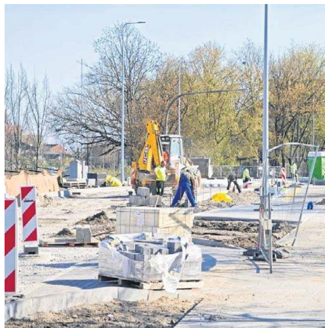
Przebudowa ulicy Sobieskiego rozpoczęła się w maju 2025 roku

Mieszkańcy ulicy Sobieskiego oraz osoby pracujące w mających tu siedziby firmach i instytucjach, już wcześniej nie ukrywali nerwów z powodu