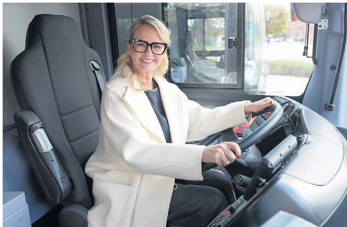
Przy okazji prezentacji w Toruniu autobusów kupionych przez spółkę Kujawsko-Pomorski Transport Samochodowy, za kierownicą jednego z nich zasiadła wicemarszałek Aneta Jędrzejewska