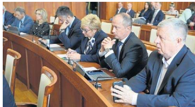
Wczoraj radni obradowali na sesji sejmiku w Kujawsko-Pomorskiem

Sejmik przyjął projekt uchwały dotyczący obszaru chronionego krajobrazu Jeziora Głuszyńskiego w gminie Topółka, obejmujący działki w Miłachówku i Głuszynku.