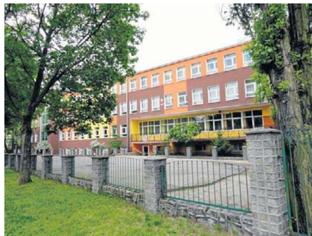
Decyzja miasta oznacza konieczność dostosowania budynku do przyjęcia najmłodszych uczniów

Planowane zmiany obejmują przede wszystkim część