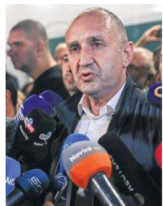
Rumen Radew udziela pierwszych komentarzy

Rok po odejściu z wojska został prezydentem Bułgarii z poparciem postkomunistycznej Bułgarskiej Partii Socjalistycznej. W drugiej turze pokonał