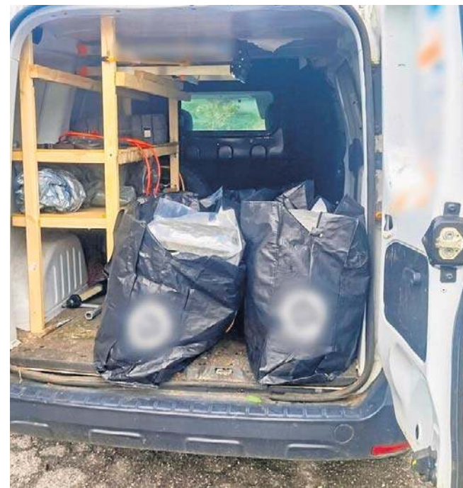
W aucie policjanci znaleźli 26 worków z marihuaną