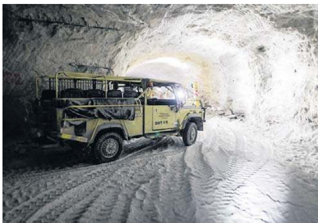
Mamy ogromne złoża soli kamiennych. Mimo to przegrywamy z zagranicznymi podmiotami, które oferują znacznie niższe ceny

– Możliwości produkcyjne kopalni w krajach UE są niewykorzystane, dlatego rynek polski narażony jest na napływ taniego produktu. Z powodu niskiego poziomu cen następuje również wypieranie polskiego „eksportu” soli do takich krajów, jak: Niemcy, Czechy, Słowacja, Węgry oraz kraje nadbałtyckie. Producenci niemieccy, K+S, SUD Salz, stanowią potężną konkurencję dla wszystkich produktów Ko-