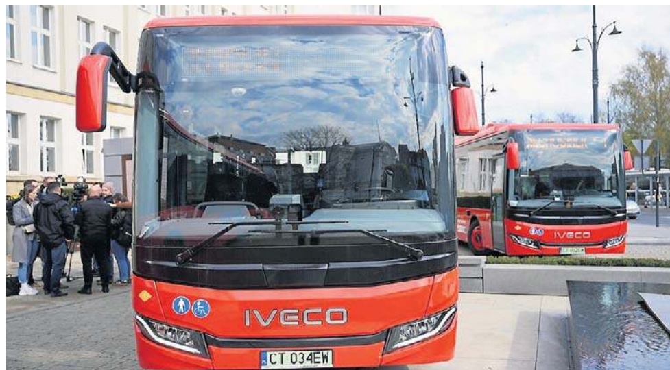
Spółka Kujawsko-Pomorski Transport Samochodowy kupiła 40 autobusów elektrycznych i hybrydowych

- W maju powinniśmy mieć komplet tych autobusów w liczącym ponad 300 pojazdów taborze - mówi Tomasz Fic, prezes K-PTS. - Sukcesywnie wypuszczamy je do obsługi połączeń. Każdy z tych autobusów pokona rocznie średnio około 70 tysięcy kilometrów. Nie ma dla przewoźników regionalnych ustawowego wymogu wymiany taboru na ni-