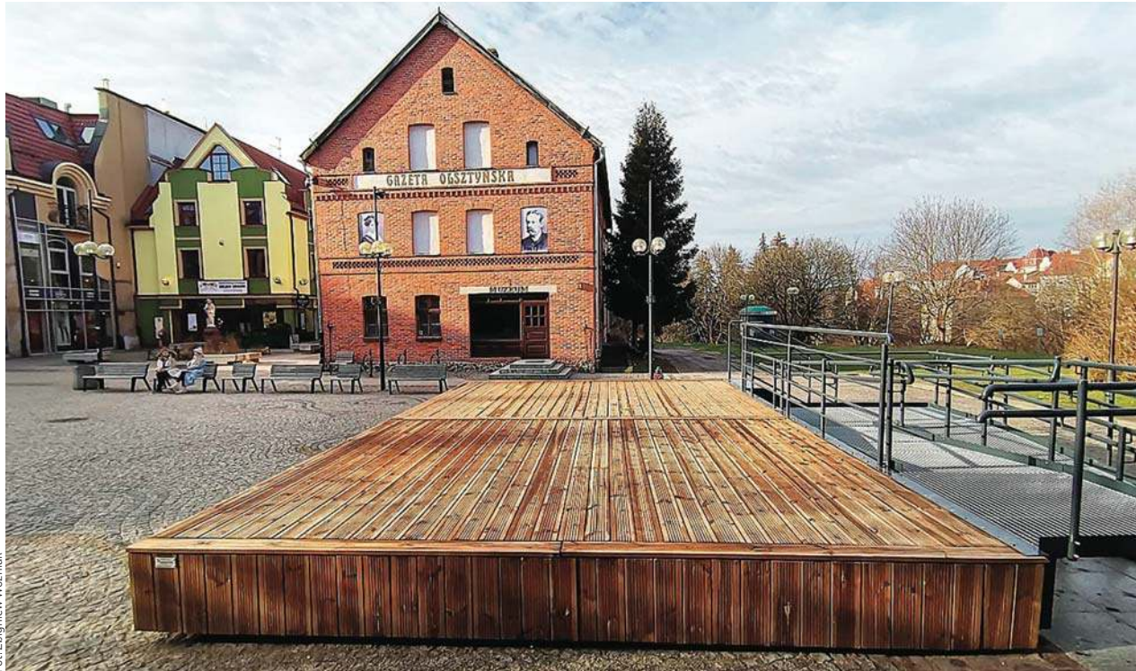
Nowa scena plenerowa na Starym Mieście

Plenerowa scena ze Starego Miasta to przykład marnowania podatków mieszkańców – tak wynika z krajowego zestawienia zawartego w „Czarnej księdze”.