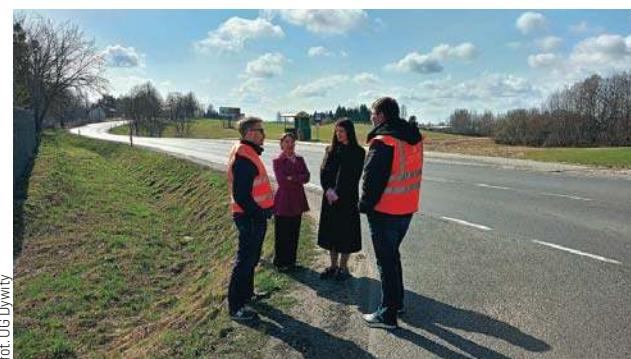
Wizja lokalna w sprawie nowego fotoradaru w Ługwałdzie

W 2025 roku stacjonarne fotoradary w naszym regionie przyłapały blisko