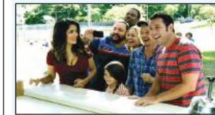
19.55 Jeszcze większe dzieci - komedia, USA, 2013, reż. Dennis Dugan, wyk. Adam Sandler, Kevin James, Chris Rock, David Spade, Salma Hayek