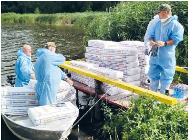
Trwa wapienie zbiornika. Prace przeprowadzają członkowie PZW

Jak czytamy w zawiadomieniu Prokuratury Rejonowej w Chełmie, 28 lipca zostało wszczęte śledztwo w sprawie „zanieczyszczenia w dniach 10-11 lipca 2025 r. w Chełmie,