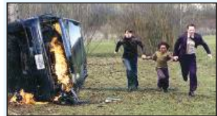
19.55 Dzień, w którym zatrzymała się Ziemia - film sci-fi, USA, 2008, reż. Scott Derrickson, wyk. Keanu Reeves, Jennifer Connelly, Kathy Bates, Jaden Smith, John Cleese, Jon Hamm - Nowa wersja filmu fantastyczno-naukowego z 1951 roku.