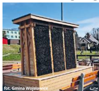
fol. Gmina Wojsławice

Wyjaśnienie tak postawionego problemu jest dosyć proste. Tężnia to drewniana konstrukcja, którą wypełniają drobne gałęzie tarniny. W jej wnętrzu montowana jest specjalna instalacja, która ma za zadanie dostarczać nasyconą solą wodę. Splywające po gałęziach strumienie wody rozpraszane są w formie niemal niewidocznej mgiełki, którą przebywający w pobliżu spacerowicze czy kuracjusze sanatoriów mogą wdychać i dzięki temu wzmacniać kondycję górnych dróg oddechowych. Wiadomo jednak, że grzyby rozwijają się zazwyczaj tam, gdzie jest nieustannie wilgotno i ciepło. Naukowcy z Uniwersytetu Rolniczego w Krakowie dowiedli niedawno, że krążąca w tężniach woda jest najczęściej zanieczyszczona mikrobiologicznie. A więc do organizmów osób, które korzystają z tego rozwiąza-