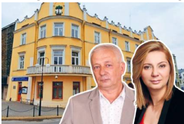
Od 1 sierpnia w Urzędzie Miasta Chełm nastąpiły istotne zmiany kadrowe w dwóch kluczowych departamentach: Komunalnym oraz Architektury, Inwestycji i Funduszy Europejskich

Od 1 sierpnia w Urzędzie Miasta Chełm obowiązują istotne zmiany kadrowe na stanowiskach kierowniczych w dwóch kluczowych departamentach: Komunalnym oraz Architektu-