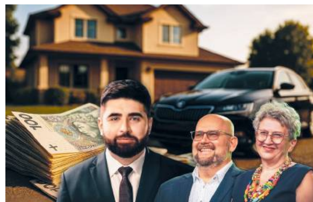
Oświadczenia pokazują, jak zarządzają prywatnym majątkiem ci, którzy zarządzają miastem

Z tytułu pracy w urzędzie miasta zarobił w 2024 roku blisko 195 tys. zł. Otrzymał też 30 tys. zł darowizny od osoby z I grupy podatkowej. Posiada dwa samochody – seata altea xl z 2012 roku (wspólnota majątkowa) oraz skodę octavię z 2011 roku (własność osobista).