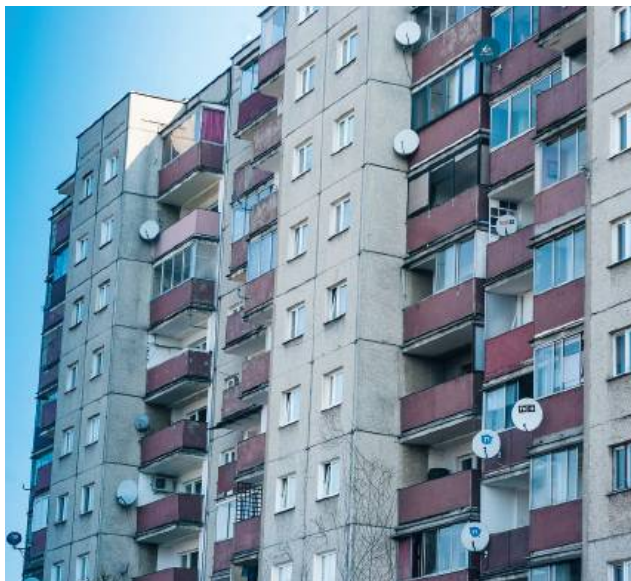
Dom z serialu „Czterdziestolatek” przypomina nam, że nieruchomości to nie tylko inwestycja, ale przede wszystkim świadectwo epoki, w której żyjemy.

● AGENT RADZI Każdy z nas ma swój ulubiony film lub serial, a w nim dom, który stał się czymś więcej niż tylko tłem dla akcji. Nieruchomości w popkulturze często odzwierciedlają marzenia, status społeczny bohaterów, a czasem nawet stają się pełnoprawnym uczestnikiem fabuły.