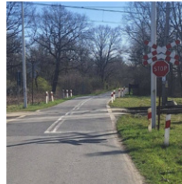
Przejazd we Wrzosach.