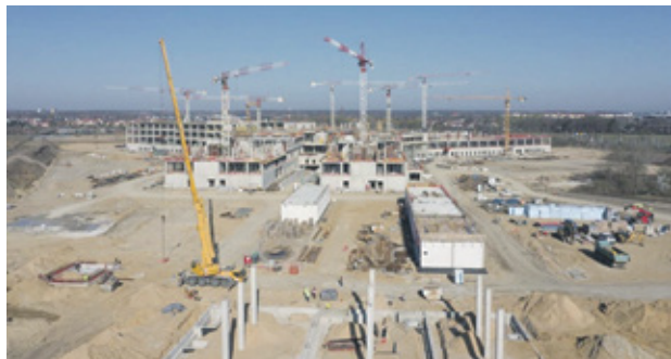
Budowa Nowego Szpitala Onkologicznego przebiega bardzo sprawnie i wyprzedza harmonogram

Nowy szpital zaoferuje pacjentom 671 łóżek w komfortowych jedno- i dwuosobowych pokojach. Blok operacyjny z 14 salami pozwoli na wykonywanie do 10 tysięcy operacji rocznie. Całość będzie zorganizowana w ramach dziewięciu unitów - kompleksowych centrów diagnostyki i leczenia, co usprawni procesy medyczne i znacząco poprawi jakość opieki nad pacjentami.