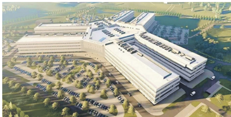
Wizualizacja Nowego Szpitala Onkologicznego