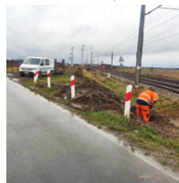
Na tym przejeździe w gminie Wińsko w 2022 roku zginął kierowca autobusu. Dopiero w ubiegłym roku zamontowano tam rogatki.