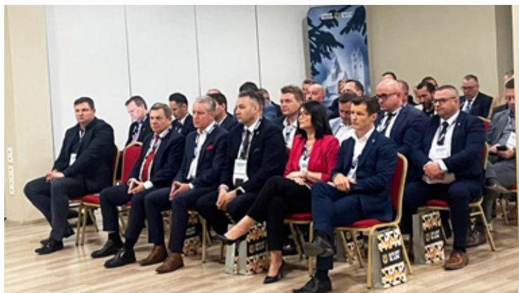
Wóldarze mieli okazję porozmawiać z przedstawicielem rządu w terenie, wojewodą Anną Żabską.