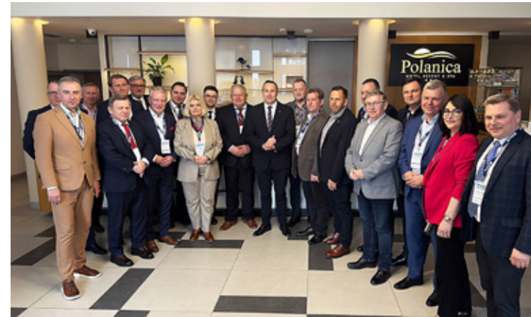
Samorządowcy z subregionu wrocławskiego na Konwencji w Polanicy Zdroju wraz z marszałkiem województwa dolnośląskiego Pawłem Gancarzem.