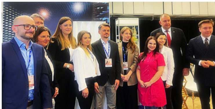
Firmy z Dolnego Śląska w Wilnie prezentowały swoje produkty na targach międzynarodowych w ramach projektu Going Global 4.0.

– Każda firma z Dolnego Śląska może zapisać się do programu „Going Global”. Należy przejść rekrutację, prowadzić działalność przejrzystą, nieskazitelną i wpisać się w tematykę targów. Jeśli firma przejdzie cały proces i udostępni wymagane dokumenty, ma szansę znaleźć się w gronie dziesięciu szczęśliwców, którzy mają sfinansowany udział w targach – tłumaczy Wojciech Wiejackski z Działu Współpracy Gospodarczej i Przedsiębiorczości Urzędu Marszał-