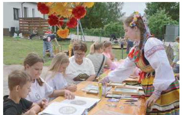
Jedną z atrakcji były warsztaty rękodzielnicze