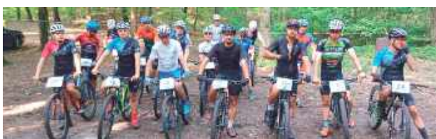
Będzie się działo. Pierwsze zmagania już 19 lipca

Organizatorem wydarzenia jest Puławskie Towarzystwo Krzewienia Kultury Fizycznej, które zaplanowało co najmniej trzy edycje wyścigu: 19 lipca, 23 sierpnia oraz 13 września. Nie wykluczone, że odbędzie się także czwarta runda na początku października. Wszystko zależy jednak od dostępnych środków finansowych.