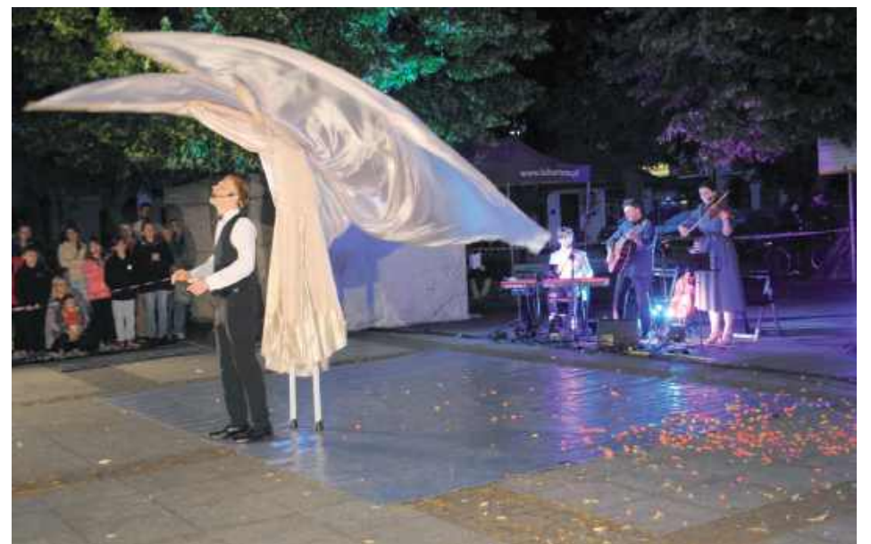
Anioł na szczydłach