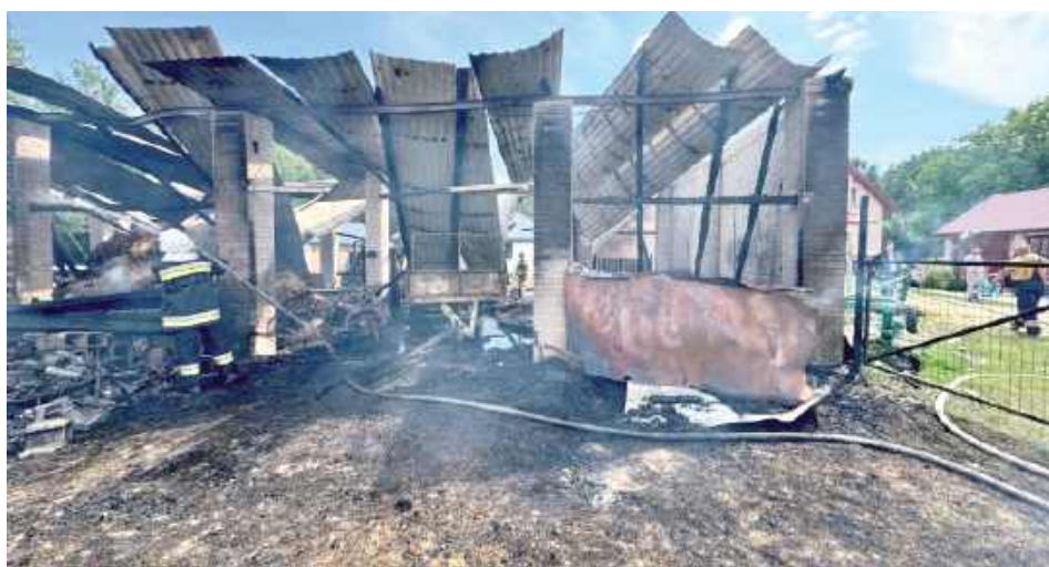
Zdjęcia ze strony zbiórki ukazują skalę zniszczeń...

Cała nadzieja w zbiórce W związku z całkowitym zniszczeniem stodoły i sprzętu rolniczego uruchomiono zbiórkę publicz-