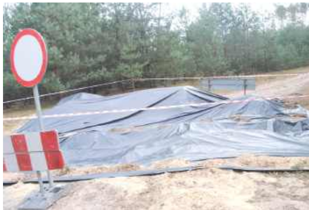
Miejsce pochówku w Tarkawicy - zdjęcie z marca br.