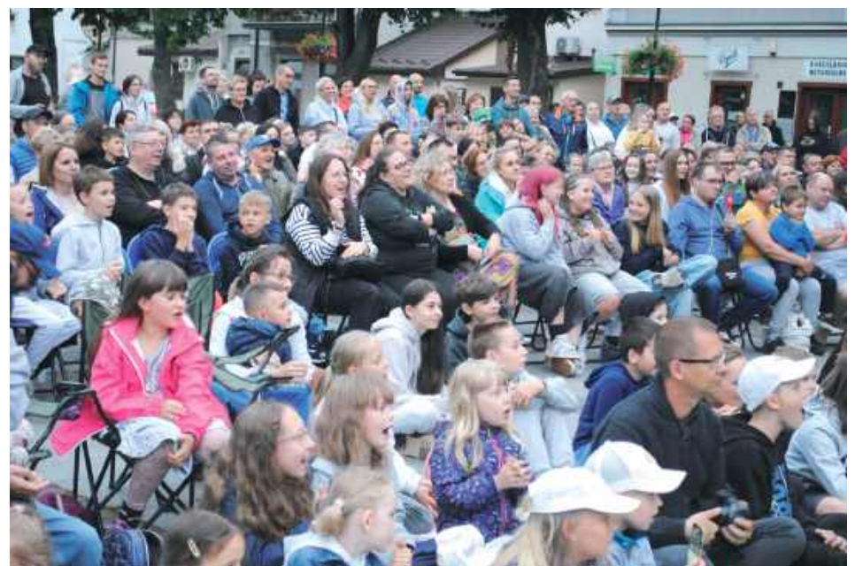
Publiczność jak co roku dobrze się bawiła