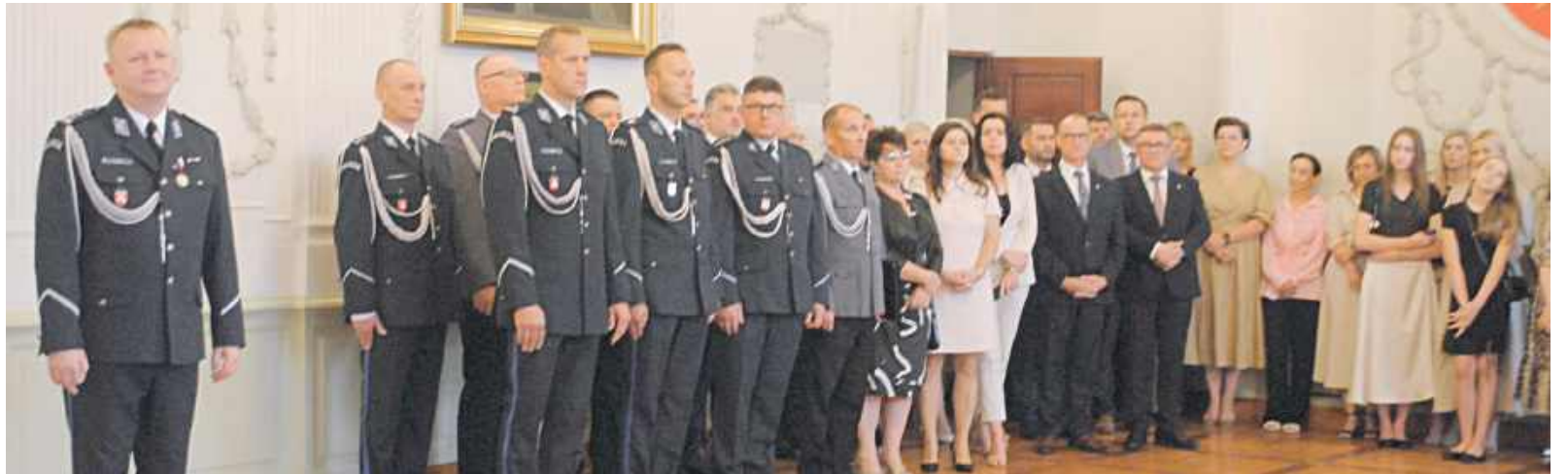
W obchodach święta policji uczestniczyli samorządowcy z powiatu lubartowskiego