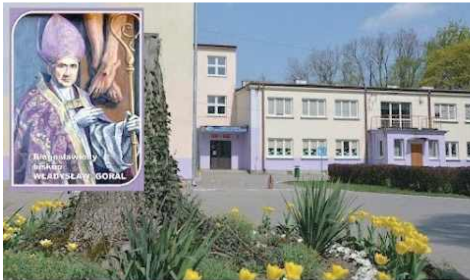
Los SP w Ciecierzynie nie jest jeszcze przesądzony. Gmina Niemce i Skarb Państwa walczą o tę niezwykle ważną placówkę. MSWiA przedłużyło czas na decyzję do 1 września

Niemce wysłały do MSWiA pismo, w którym poinformowały, że nie mogą odnieść się do toczącego postępowania, ponieważ nie znają uzasadnienia decyzji Sądu Okręgowego w Lublinie, który uchylił wyrok Sadu Rejonowego, korzystny dla Skarbu Państwa, a co za tym idzie, także gminy. Niedługo uzasadnienie będzie analizowane przez gmin-