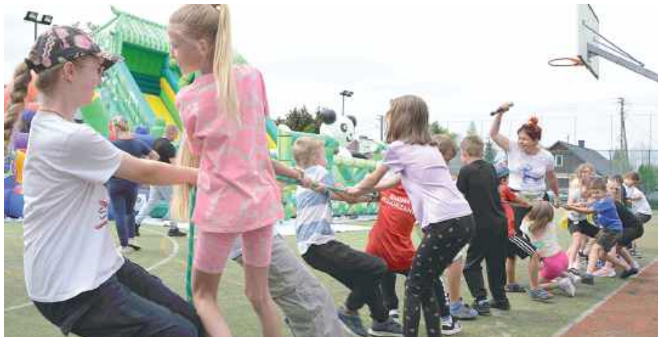
Podczas zabaw z animatorem dzieciaki m.in. rywalizowały w przeciąganiu liny