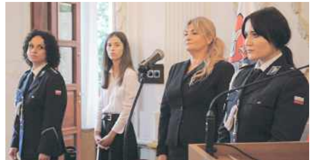
W bieżącym roku przypada stulecie służby kobiet w polskiej policji