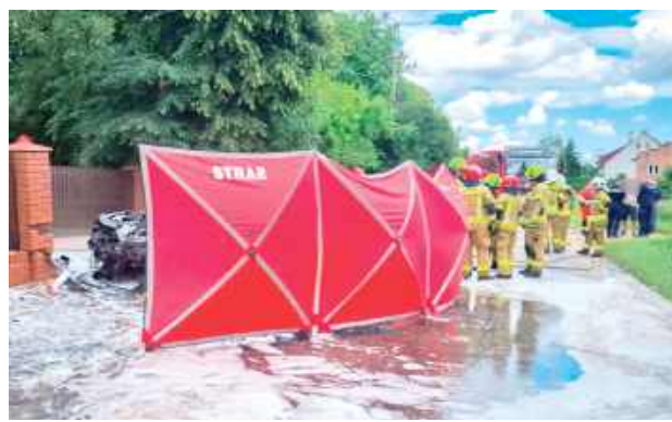
53-latką z powiatu puławskiego zginęła na miejscu. Decyzją prokuratora ciało kobiety zostało przewiezione na sekcję

Na miejsce zadysponowano nawet śmigłowiec Lotniczego Pogotowia Ratunkowego z Lublina, ale ostatecznie maszynę zawrócono. Mimo natychmiast podjętej akcji gaśniczej i ratunkowej oraz wysiłku nie zakończyła się ona sukcesem. Kierująca Renault kobieta nie przeżyła. To 53-letnia mieszkanka powiatu puławskiego.