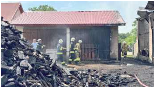
W akcji wzięło udział wiele jednostek straży pożarnej - uratowali, ile się udało

- Straty są ogromne i znacznie przekraczają nasze możliwości finansowe. Dlatego prosimy o pomoc - zbieramy środki na odbudo-