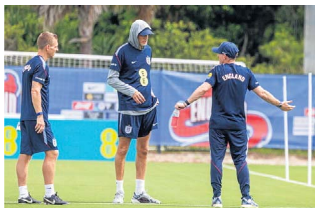
Reprezentację Anglii pod wodzą Thomasa Tuchela (w środku) odwiedzają w USA istne „plagi egipskie”

Makabryczną przygodę przeżyła reprezentacja Iranu przygotowująca się do meczów w USA w meksykańskiej bazie w Tijuanie. W pobliżu stadionu, gdzie trenują Persowie, policja odkryła w porzuconym SUV-ie rozkładające się ciało zapakowane w foliowy worek. Sprawcy morderstwa dotychczas nie namierzono.