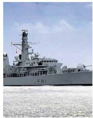
W akcji brał udział okręt HMS Sutherland

W trakcie trwającej sześć godzin operacji komandosi Królewskiej Piechoty Morskiej oraz specjalnie przeszkoleni funkcjonariusze organów ścigania z Narodowej Agencji ds. Zwalczania Przestępczości, przy wsparciu Sił Powietrznych, weszli na pokład tankowca Smyrtos.