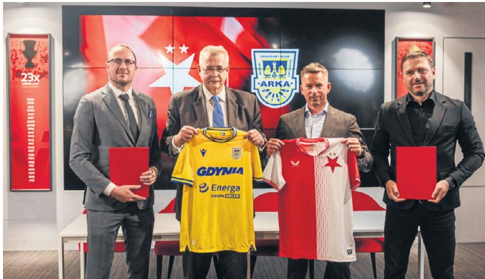
Umowa między Arką Gdynia i Slavią Praga została już oficjalnie podpisana

- Slavia Praga wydaje się idealnym partnerem dla Arki Gdynia do tego typu współpracy. Z jednej strony to klub spor-