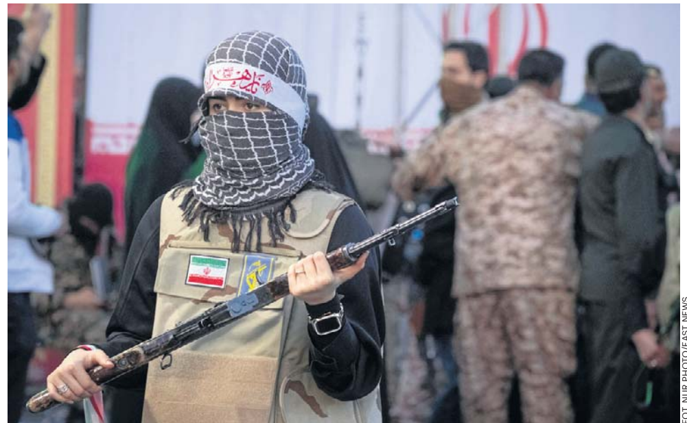
Reżim zmobilizował zwolenników do walki z krytykami republiki islamskiej. Reżim uderza wciąż w różne grupy, które uznaje za niebezpieczne

Iran Human Rights Group, organizacja z siedzibą w Norwegii, poinformowała 8 czerwca, że w tym roku co najmniej 40 więźniów, w tym 19 protestujących, zostało powieszonych na podstawie zarzutów o podłożu politycznym.