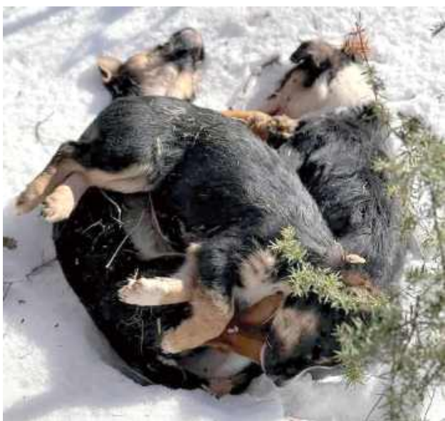
W lesie pod Łukowem znaleziono porzucone zamarznięte szczeniaki

Straż Ochrony Zwierząt Inspektorat Łuków poinformowała o dramatycznym znalezisku w miejscowości Rzymy Rzymki pod Łukowem. W lesie odnaleziono trzy nieżywe młode psy. Wygląda na to, że zwierzęta zamarzły, ale przyczynę ich zgonu wskaże prawdopodobnie dopiero sekcja zwłok