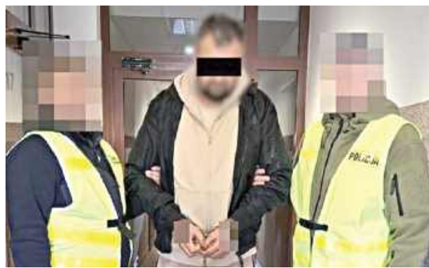
Na wniosek prokuratora Sąd Okręgowy w Lublinie rozstrzygnął kwestię dalszego aresztowania myśliwego

Gdy Sąd Rejonowy Lublin-Zachód w Lublinie decydował o aresztowaniu 50-latek w listopadzie ub.r., zażalenie na to złożył obrońca myśliwego. Zażalenie to rozpatrywał wówczas Sąd Okręgowy w Lublinie, który nie zgodził się z obrońcą i decyzję sądu podtrzymał. W przypadku przedłużania tymczasowego aresztowania, jak już wspomniano, decyzję podejmuje już sąd okręgowy. Ewentualne zażalenie rozstrzygnie tu sąd wyższej instancji,