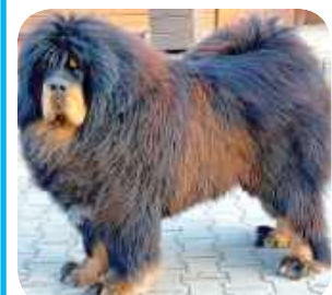
Gajana, Sławomir Ziętek, Granice

Redakcyjny pupil, Chloe, zaprasza do publikacji zdjęć swoich pupili w wersji walentynkowej!