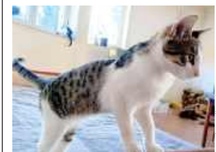
Kotki szukają domu