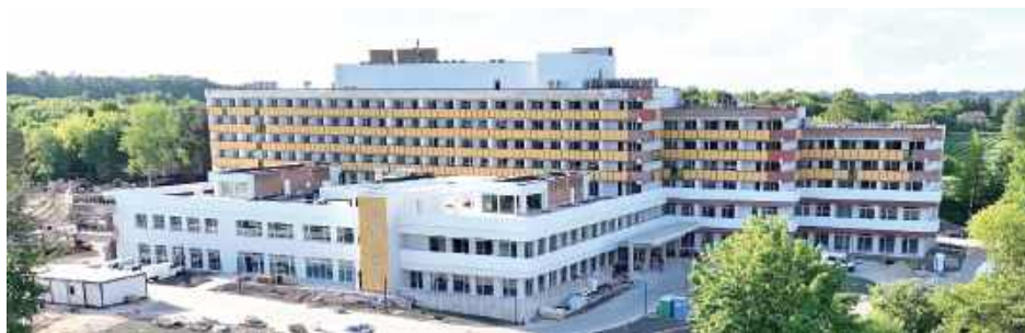
Przez lata obiekt przy ul. Spółdzielczej w Nałęczowie niszczał i straszyl swoim wyglądem. w 2028 r kupiła je grupa Arche i przebudowała na największy na Lubelszczyźnie hotel, który otwarto dla gości w połowie 2024 r.