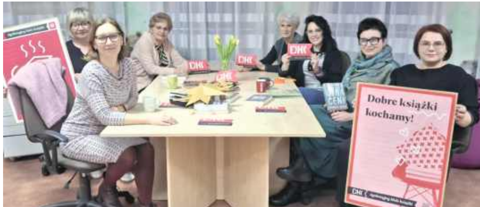
Biblioteka już zapowiada kolejne spotkanie – w lutym Dyskusyjny Klub Książki poświęcony będzie twórczości Sylwii Kubik

Uczestniczki zgodnie podkreślały, że jego książki wciągają od pierwszych stron i nie pozwalają przejść obojętnie obok trudnych tematów. Podczas rozmów zwrócono uwagę na to, jak sprawnie Moss łączy wartką akcję z aktualnymi problemami społecznymi: samotnością, przemocą, hejtem, presją otoczenia czy mechanizmami manipulacji.