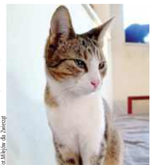
Kotki szukają domu

Stowarzyszenie Milejów Dla Zwierząt prowadzi intensywne poszukiwania stałych i odpowiedzialnych opiekunów dla dwóch młodych kotów - Gordona oraz Filemona. Zwierzęta mają obecnie pięć miesięcy i są w pełni gotowe, by stać się częścią nowych rodzin, w których będą traktowane z należytą troską i miłością.