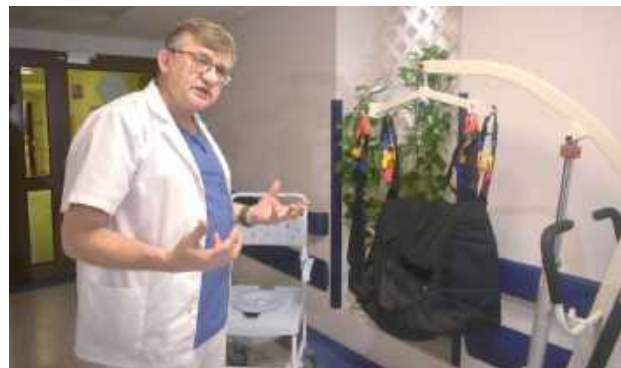
Fundacja DKMS przeznaczyła na zakup sprzętu dla COZL blisko 300 tysięcy złotych. Nie byłoby to możliwe, gdyby nie darczyńcy, którzy wpłacili te pieniądze z 1,5 proc. PIT. Tym samym szpital ma np. ciśnieniomierze, 10 nowoczesnych łóżek, sprzęt m.in. specjalistyczne krzeselka wspomagające samodzielne funkcjonowanie na oddziale

Fundacja DKMS przeznaczyła na zakup sprzętu dla COZL blisko 300 tysięcy złotych. Nie byłoby to możliwe, gdyby nie darczyńcy, którzy wpłacili te pieniądze z 1,5 proc. PIT. Tym samym szpital ma np. ciśnieniomierze, 10 nowoczesnych łóżek, sprzęt m.in. specjalistyczne krze-