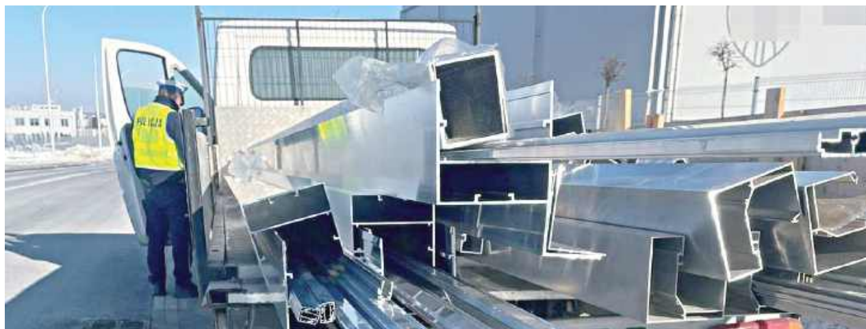
Policja z Lublina przeprowadziła działania kontrolno-prewencyjne pod nazwą „Truck&Bus”, skierowane głównie na ciężarówki, autobusy i busy

4 lutego, podczas akcji policja skontrolowała 282 uczest-