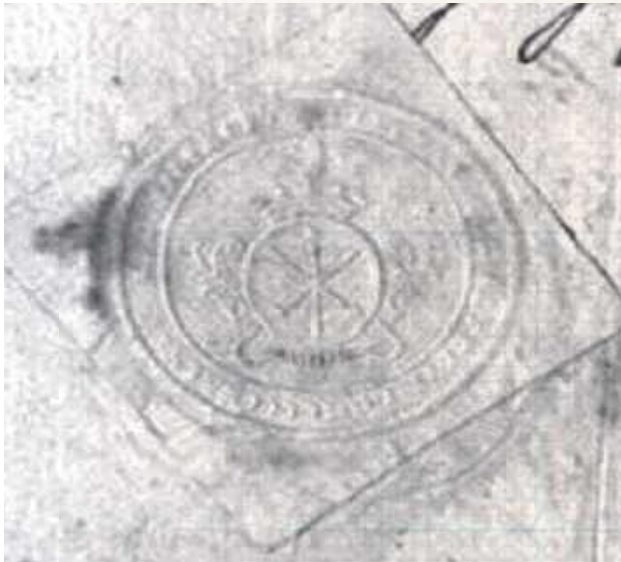
Pieczęć Dominium Radzyńskiego z okresu zaboru austriackiego. Odcisk przez papier. W zasobie Archiwum Państwowego w Radzynie Podlaskim