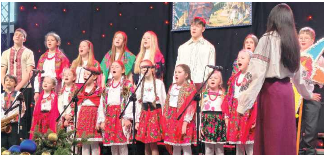
Festiwal Kolęd ubarwił występ Dziecięcej Grupy Kolędniczej MCKSiR z Terespoli

Aż 23 zespoły chóralne, muzyczne i kolędnicze wystąpiły podczas XXIX Międzynarodowego Festiwalu Kolęd Wschodniosłowiańskich w Terespolu. Przez dwa dni w odnowionej sali widowiskowej Miejskiego Centrum Kultury, Sportu i Rekreacji kilkaset widzów podziwiała, jak niektórzy mówili, kolędowy „śpiew aniołów”.