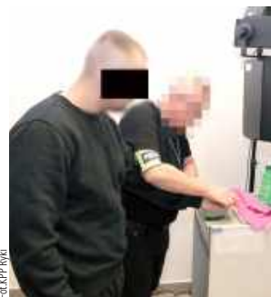
27-latek usłyszał zarzuty posiadania marihuany, posiadania znacznej ilości amfetaminy oraz podrobienia dokumentów

27-latek usłyszał zarzuty posiadania marihuany, posiadania