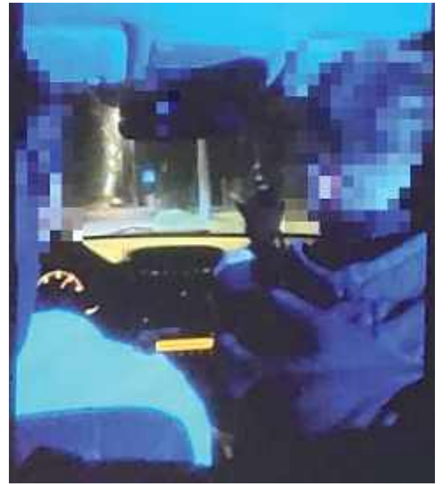
Już po złożeniu wyjaśnień przez wszystkich uczestników wypadku, sąd odtworzył w sali rozpraw nagrania zarejestrowane przez nich telefonami w aucie na niedługo przed tragedią. I rzeczywiście - jest wesoło. Mężczyźni krzyczą, dopingują kierowcę, żartują. Są wyraźnie rozentuzjzmowani

„I rura, kur...! Daj kur... miodu!” - krzyczano w aucie.