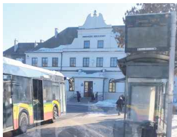
Po wprowadzeniu autobusów elektrycznych wskazane byłoby także zadbanie o informację elektroniczną w Białej Podlaskiej

Chłodny umysł jest dobry u ludzi. Elektronika jednak fiksuje na mrozie. Tablice elektroniczne na białskich przystankach najczęściej nie wyświetlały żadnych danych. Na jednej