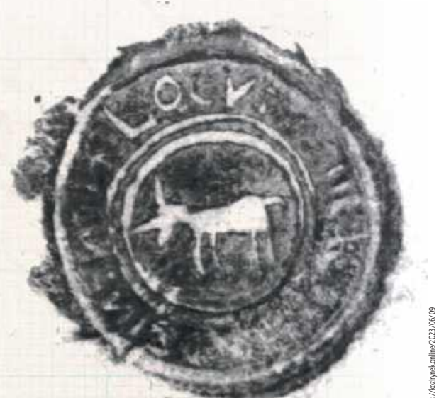
Pieczęć Radzyna z XVIII wieku