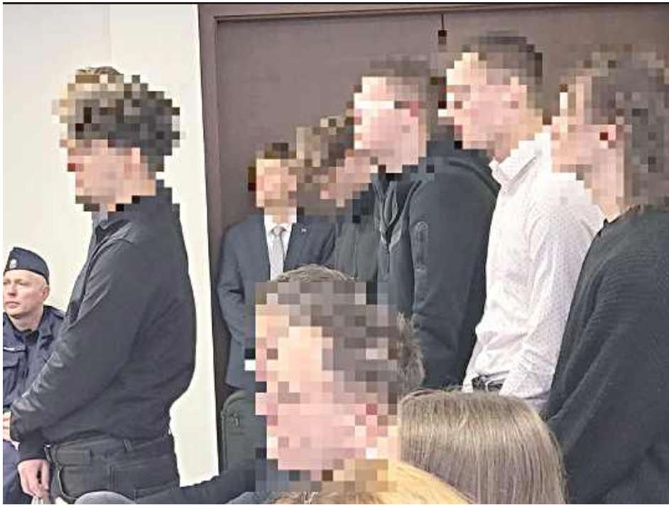
Sędzia zatrzymywał nagranie i kolejno wypytywał uczestników - „kto to powiedział?”, a mężczyźni kolejno się przyznawali

marca ub.r. bawili się na zakrapianej imprezie urodzinowej jednego z nich, który kończył 17 lat. Po opuszczeniu mieszkania solenizanta zdecydowali, że wszyscy naraz wyruszą w drogę należącą do matki Szymona C. toyotą avensis. Do mającego homologację na przewożenie maksymalnie pięciu osób auta wsiedła dziesiątka młodych mężczyzn.