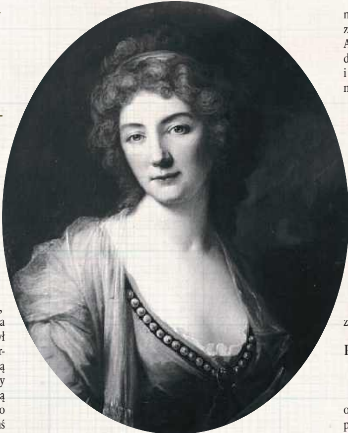
Portret Marynki Czartoryskiej (Marii Wirtemberskiej) pędzla Lampiego

Józef II-gi, będąc w Lwowie, parokrotnie rzekł publicznie do