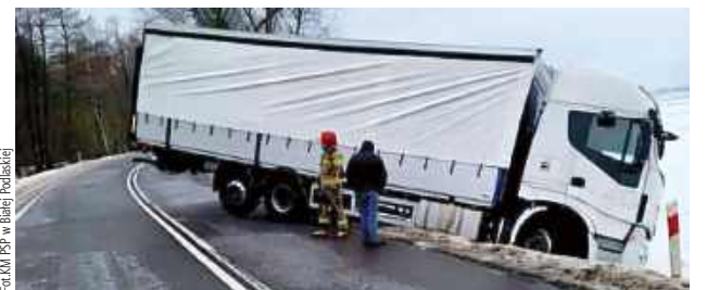
Zdarzenie miało miejsce na drodze nr 806 na wysokości Jelnicy

Na drodze 806 występowały w weekend utrudnienia drogowe. Ciężarówka częściowo wylądowała w rowie.