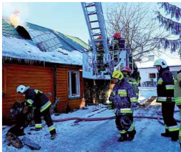
W pożarze drewnianego budynku mieszkalnego w Janowie Podlaskim brało udział 11 zastępów Państwowej i Ochotniczej Straży Pożarnej w sile 32 strażaków, w tym mundurowi z OSP KSRG Janów Podlaski oraz zespół ratownictwa medycznego. Temperatura powietrza wynosiła – 18 st. C