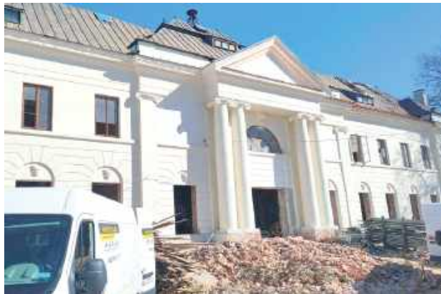
Dworzec PKP jest w remoncie, a pasażerowie nie mają gdzie się schronić przed zimnem

Jedna z czytelniczek napisała: - Czy ktoś może mi wyjaśnić „fenomen” organizacji remontu dworca PKP w Łukowie. Rok 2024 - był kontener pełniący funkcję poczekalni. Przełom roku 2025/2026 zima - kontenera brak. Zimą, gdy wcześniej trzeba wyruszyć na stację, nie ma gdzie się schować przed wiatrem, no chyba, że w toalecie TOI-TOI. Pracownik w biurze firmy remontującej dworzec powiedział, że inspektor nakazał usunięcie kontenera z powodu braku zezwolenia. Jakie barany tworzą plany remontu i jakie barany akceptują je? Władzom miasta też się dziwię, bo nie dbają absolutnie o mieszkańców. Infrastruktura PKP jest na obszarze miasta i ob-