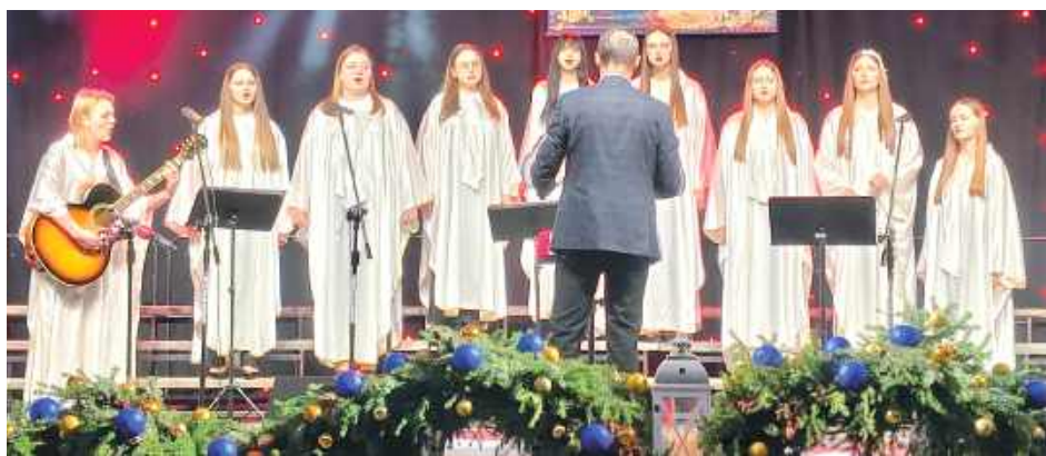
Oryginalnie zabrzmiał występ Scholi Uratowani z Sanktuarium Matki Bożej Kodeńskiej z Kodnia

Uczestnicy zaprezentowali bogactwo stylistyczne repertuaru kolędowego, obejmujące tradycyjny śpiew cerkiewny i chóralny, interpretacje ludowe oraz wykonania w technice białego głosu. Publiczność miała okazję usłyszeć dawne kolędy i pastorałki obrządku wschodniego, które niegdyś dominowały na tych terenach – podsumowało Miejskie Centrum Kultury,