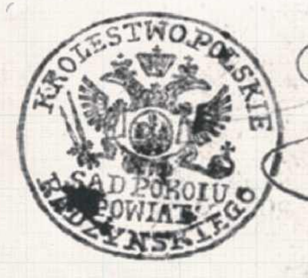
Pieczęć Sądu Pokoju powiatu radzyńskiego z czasów Królestwa Polskiego