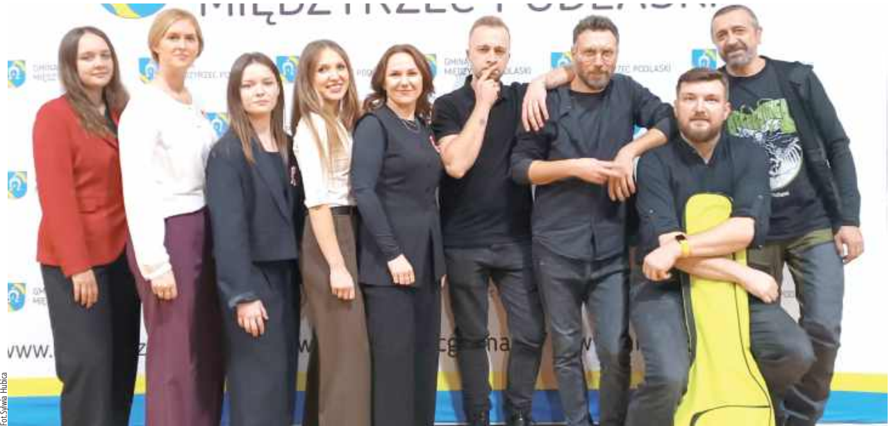
Pamiątkowe zdjęcie zespołu GOK (w niepełnym składzie) z członkami zespołu Two&amp;Teraz. Krzewica 2025