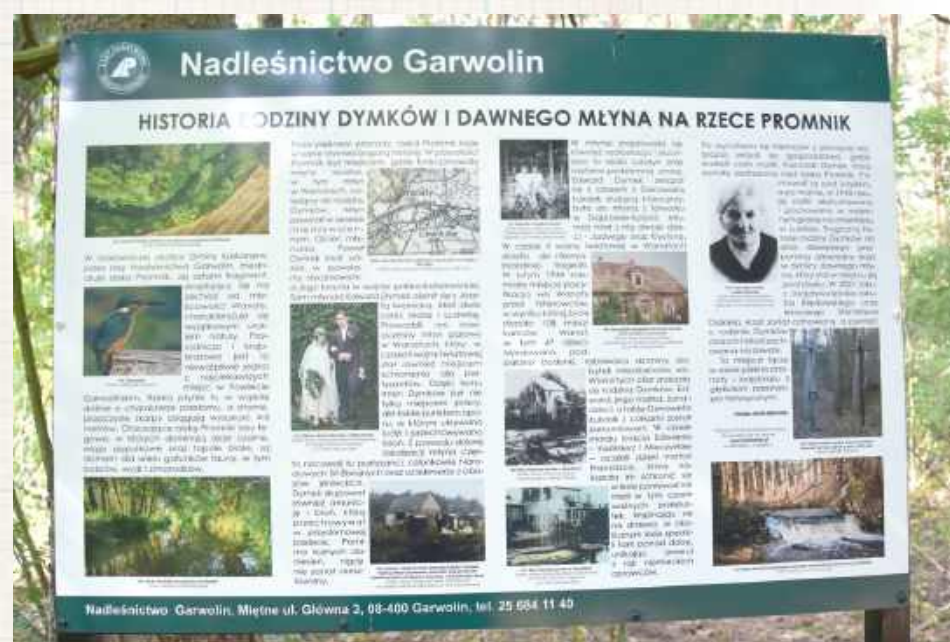
Nad rzeką w ostatnim czasie stanęła okolicznościowa tablica przygotowana przez Nadleśnictwo Garwolin, ukazująca historię rodziny Dymków i dawnego młyna na rzece Promnik

28 lutego 1944 roku Niemcy przy pomocy swoich ukraińskich