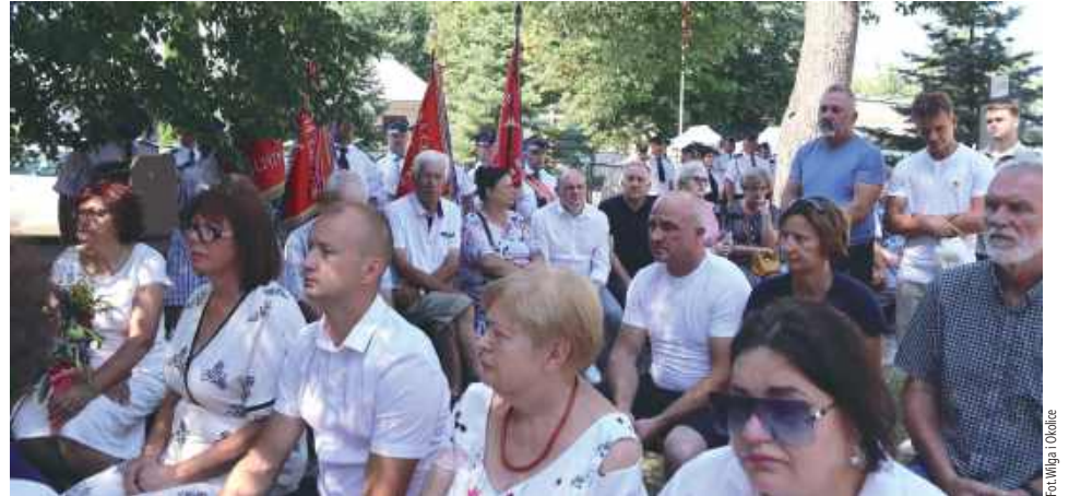
W uroczystości wzięło udział wielu parafian