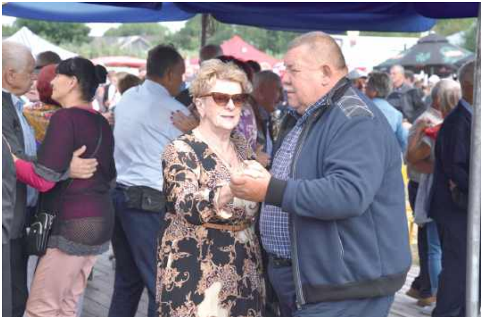
Obok części obrzędowej bardzo ważną była część artystyczna. Ci bardziej odważni wkraczali na parkiet taneczny

W niedzielę, 24 sierpnia, w miejscowości Wróble Wargocin odbyły się Dożynki i Święto Gminy Maciejowice.