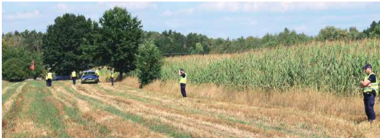
Pole kukurydzy z miejscem upadku i szczątkami drona obstawiali policjanci i żołnierze

Wszyscy byli poruszeni. I samym zdarzeniem, bo wybuch wiele osób przeraził, i przyjazdem znanych stacji telewizyjnych. Słychać było głosy: „jest Republika, jest TVN”. Wiele osób przyjeżdżało przez cały dzień, zobaczyć, co się dzieje. Do stanowisk mediów w zasadzie każdy mógł podejść.