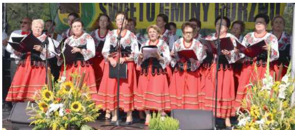
O godzinie 15 na scenie pojawiły się Koła Gospodyń Wiejskich z Górzna, Łąk, Goździka i Piasków