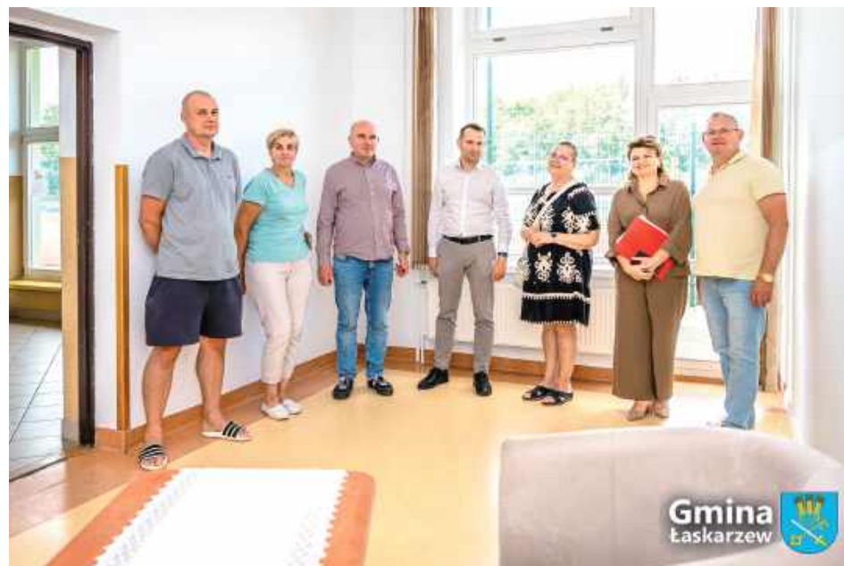
1 sierpnia nastąpił odbiór prac modernizacyjnych w pomieszczeniach Szkoły Podstawowej w Krzywdzie

Wykonawcą prac był Zakład Usługowy Pana Zbigniewa Salamonińczyka z Woli Miastkowskiej, który bardzo szybko i sprawnie zrealizował roboty. Ich koszt to blisko 65 tys. zł.