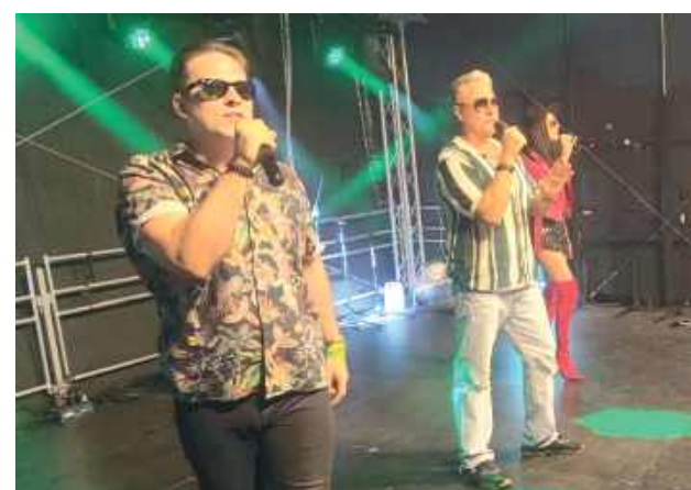
Całość zakończyła się wspólną zabawą taneczną, która trwała do północy