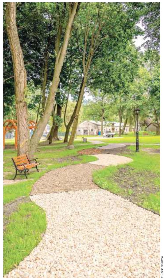
Zabytkowy park w nowej odsłonie prezentuje się okazale