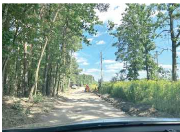
Trwają prace budowlane na ulicy Polnej w Trąbkach