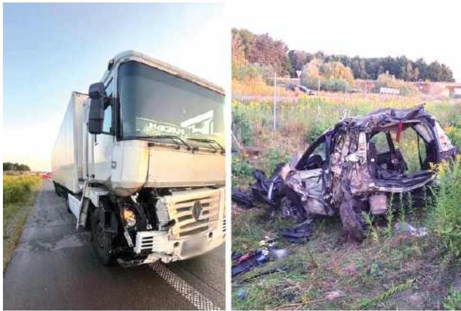
Auto zostało całkowicie zniszczone

- Droga w kierunku Lublina była całkowicie zablokowana. Trwały szczegółowe czynności mające ustalić przyczyny i prze-