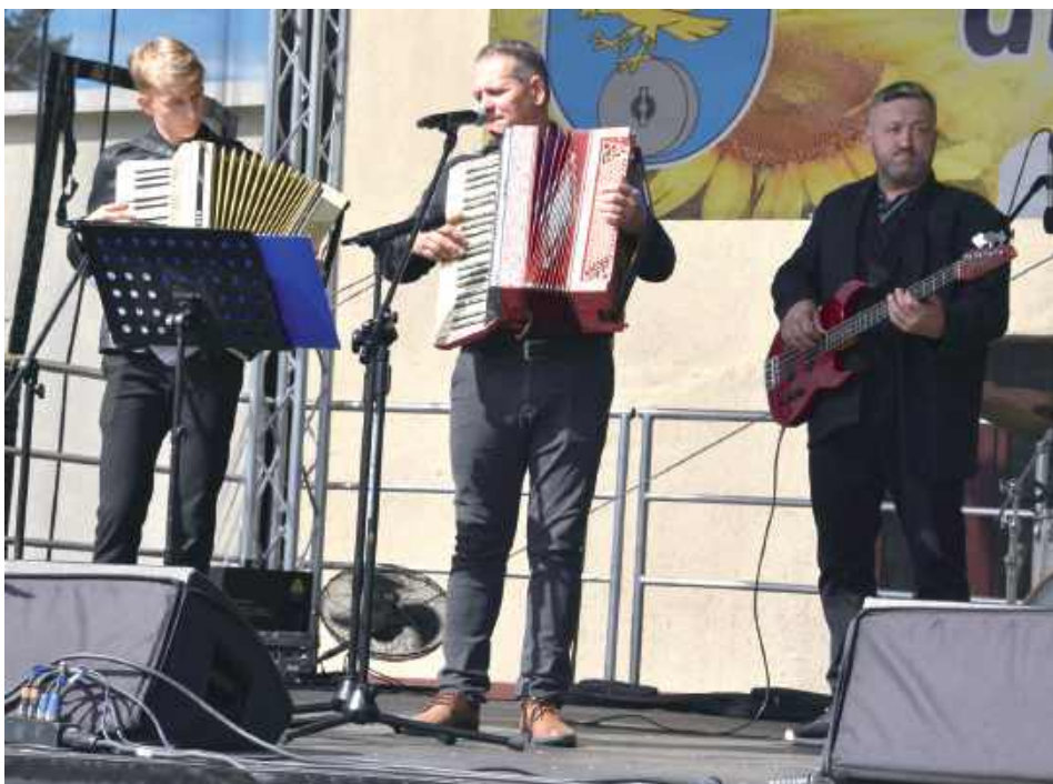
Program artystyczny obejmował występy rozmaitych formacji – od rytmicznych aranżacji Ronald Band poprzez baletową choreografię w wykonaniu Dance Now i Zespołu Złote Nutki, aż po folkowe brzmienia zespołu Milano