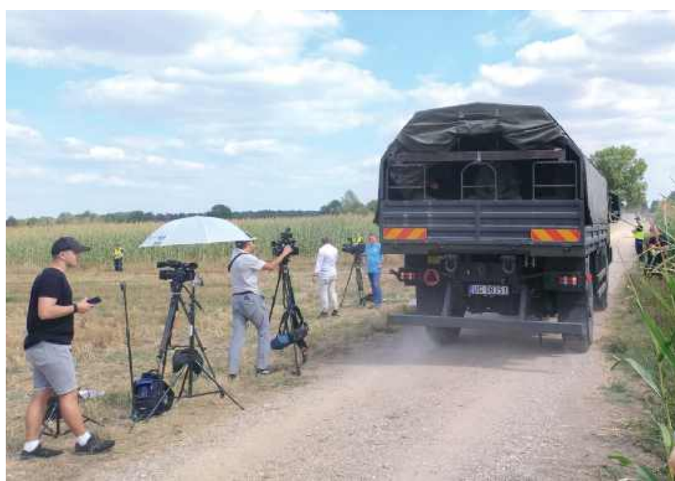
Policja oraz wojsko i Żandarmeria Wojskowa zabezpieczyły teren, odnajdując porozrzucone, nadpalone fragmenty silnika, metalu, plastiku, a także śmigło