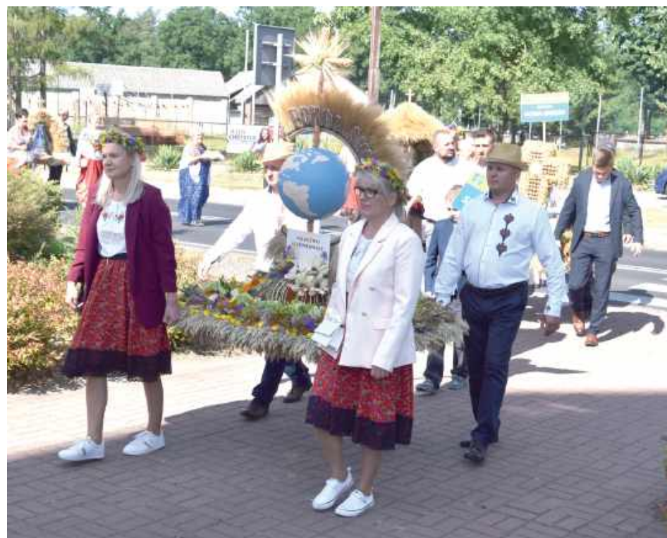
Uroczystość rozpoczęła się o godzinie 11 mszą świętą w miejscowym kościele pw. Trójcy Świętej