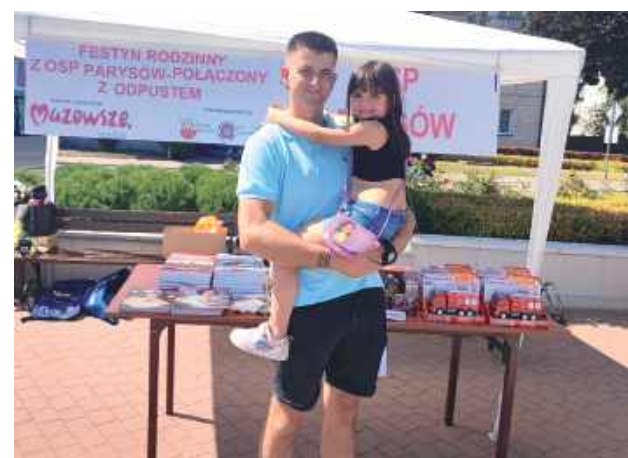
Na uczestników czekały liczne atrakcje o charakterze edukacyjnym, rekreacyjnym i kulturalnym

Partnerem wydarzenia był Samorząd Województwa Mazowieckiego.