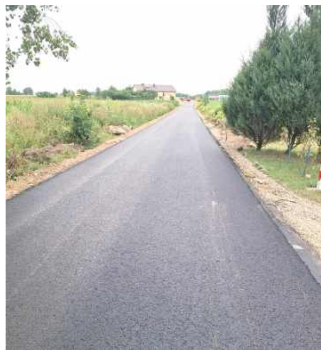
ok Gmina Żelechów remontuje kolejną drogę

Inwestycja została dofinansowana środkami z budżetu Województwa Mazowieckiego na budowę i modernizację dróg dojazdowych do gruntów rolnych w kwocie 250 tys. zł.