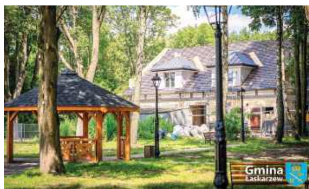
To duży krok w celu przywrócenia dawnej świetności parku Zespołu Folwarcznego, wpisanego do Gminnej Ewidencji Zabytków

Warto wspomnieć, że w ubiegłych latach na terenie parku powstało nowe oświetlenie i plac zabaw dla dzieci. Jeszcze w tym roku gmina zamierza przeprowadzić dalszy etap zagospodarowania poprzez wykonanie nasadzeń i remontu piwnicyziemiarki.