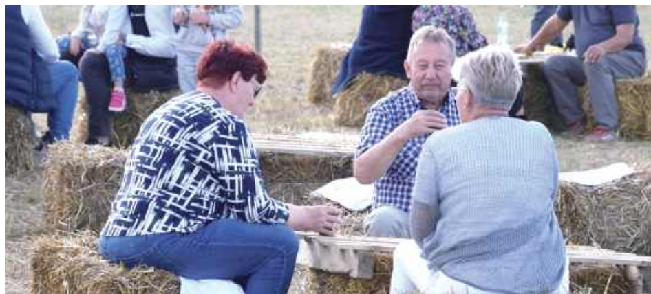
Obok części obrzędowej i artystycznej przygotowane zostały również stoiska kulinarne, punkty rękodzielnicze oraz strefa rekreacyjna

Koło Gospodyń Wiejskich „Kobylanki” z Kobylnicy: Jesteśmy Kołem Gospodyń Wiejskich, które zamieszkuje niedaleko Wisły więc naszymi specjami są: pyzy, pierogi, ryby, żurek, bigos z kaszą gryczaną i z grzybami. Staramy się gotować tradycyjnym sposobem, raczej nie używamy jakichś bardzo nowoczesnych przypraw. Bazujemy na przepisach z dawnych, dawnych lat