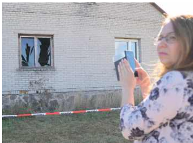
W wyniku eksplozji w pobliskich domach wybite zostały szyby okienne, uszkodzone futryny i połacie dachowe

Teren zdarzenia wizytowali pracownicy Wydziału Polityki Społecznej Lubelskiego Urzędu Wojewódzkiego. Odwiedzili uszkodzone gospodarstwa i przeprowadzili wstępne szacunki strat. Jedna z rodzin zgłosiła potrzebę wsparcia psychologicznego dla