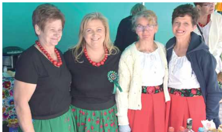
Koło Gospodyń Wiejskich z Nowej Brzuzy: Polecamy pyzy z mięsem, pierogi z mięsem, krokiety, ciasto bardzo pyszne, orzeszki. Zapraszamy na degustację babki ziemniaczanej, zapraszamy też na pyszne kanapeczki z pysznym smalczykiem oraz bardzo, bardzo pyszny bigos z kwaszonej kapustki i oczywiście mamy też frytki, hot-dogi i hamburgerki. Dodajmy, że mamy także coś na poprawę humoru. Serdecznie zapraszamy