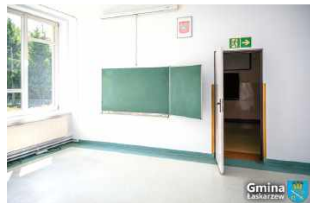
W ramach prac remontowych były m.in. podłogi, ściany, zamontowano nowe drzwi wewnętrzne