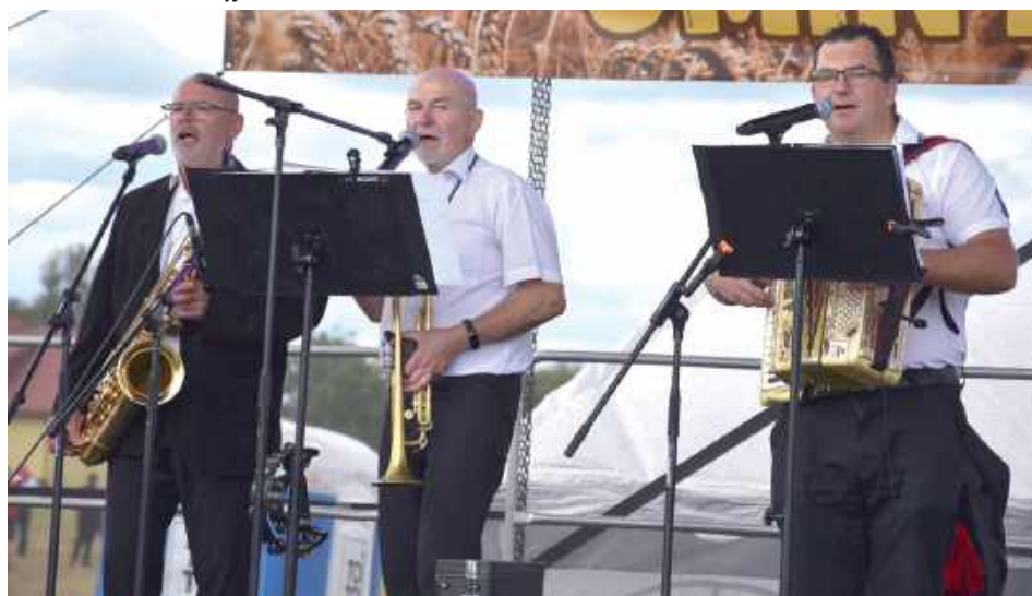
Około godziny 15.30 na scenie ze swoim koncertem pojawiła się Kapela Staręgów