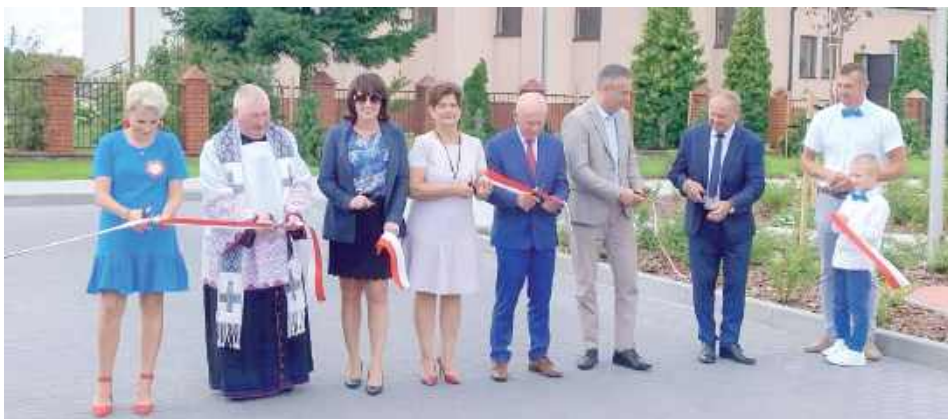
W uroczystości wzięło udział wielu gości

W sobotę, 2 sierpnia w Woli Starogrodzkiej odbyła się uroczystość poświęcenia i oficjalnego oddania do użytku nowo wybudowanego placu rekreacyjnego.