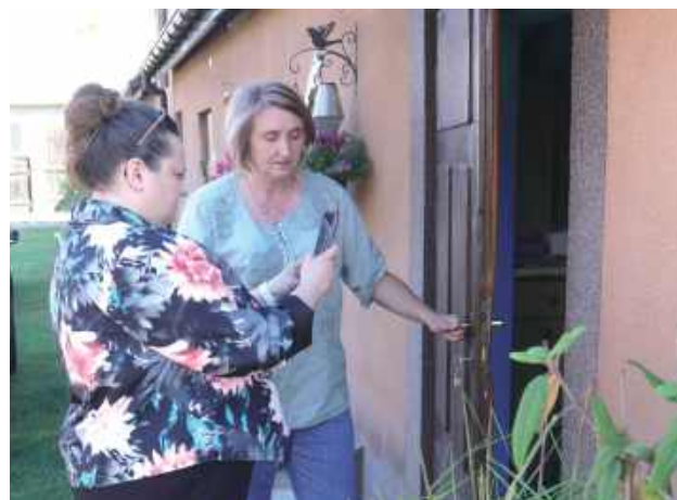
Mieszkańcy Kolonii Osiny pokazali pracownikom Lubelskiego Urzędu Wojewódzkiego uszkodzenia w domach na skutek wybuchu drona

dziecka. Inny z mieszkańców tymczasowo przeniósł się do bliskich w sąsiedniej miejscowości. Jedno z uszkodzonych gospodarstw pozostaje niezamieszkałe.