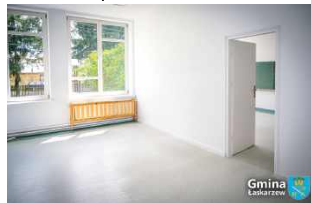
Wartość inwestycji to blisko 65 tys. zł