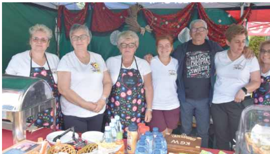
Koło Gospodyń Wiejskich „Uninianki” z Unina: Nasze koło przygotowało pierogi z kapustą i grzybami, pierogi z mięsem, pajdę chleba ze smalcem i z ogórkiem, ciasto własnego wyrobu i lemoniadę