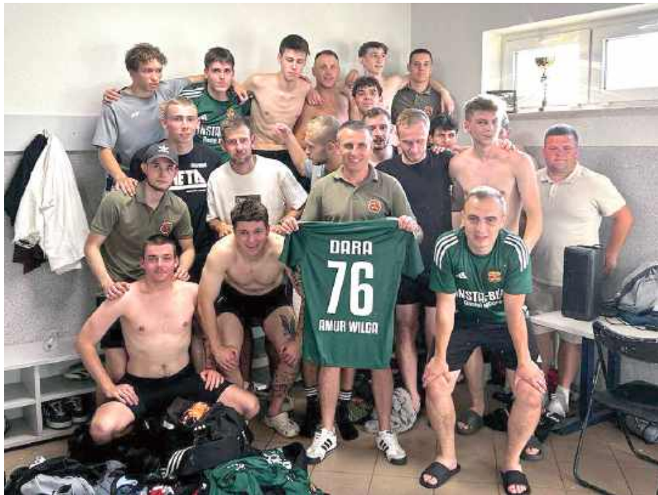
Derby dla Amura! Zespół z Wilgi kompletnie rozbił Promnik Łaskarzew 0:4