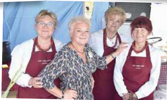
Gmina Maciejowice: Koło Gospodyń Wiejskich „Kobylanki” z Kobylnicy