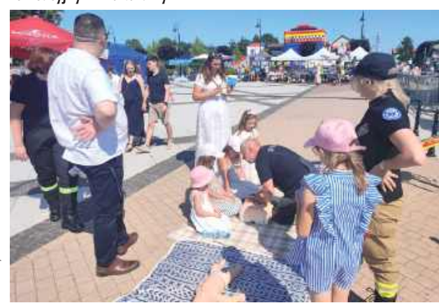
Na Rynku w Parysowie odbył się Festyn Rodzinny z OSP Parysów