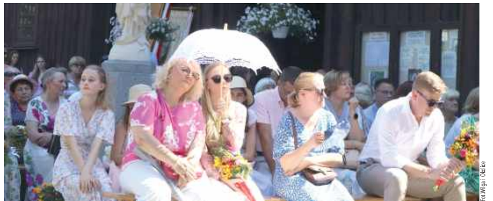
Nie zabrakło pocztów sztandarowych OSP Gminy Wilga, radnych i sołtysów miejscowej parafii