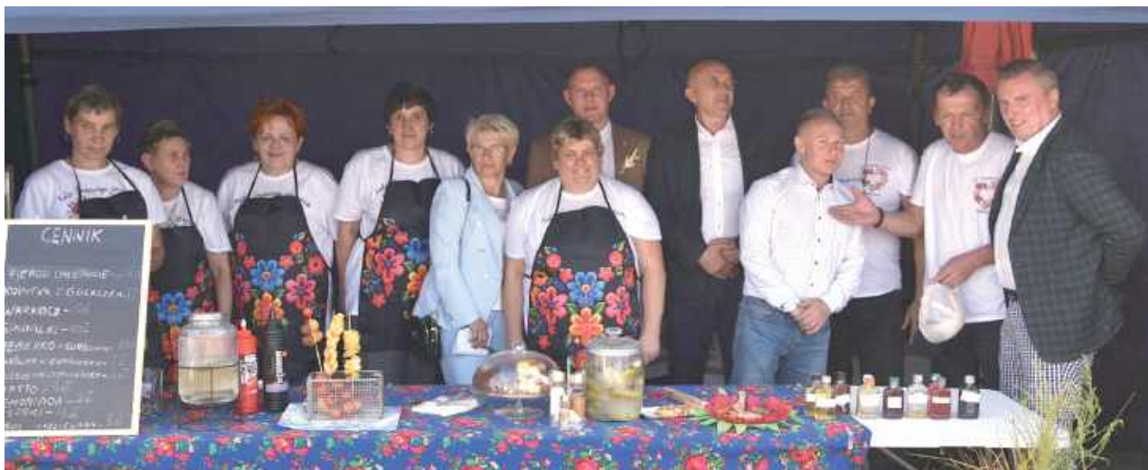
Na stoiskach przygotowanych przez lokalne Koła Gospodyń Wiejskich nie zabrakło regionalnych przysmaków

Wydarzenie miało charakter otwarty. Organizatorzy przewidzieli atrakcje zarówno dla starszych, jak i młod-