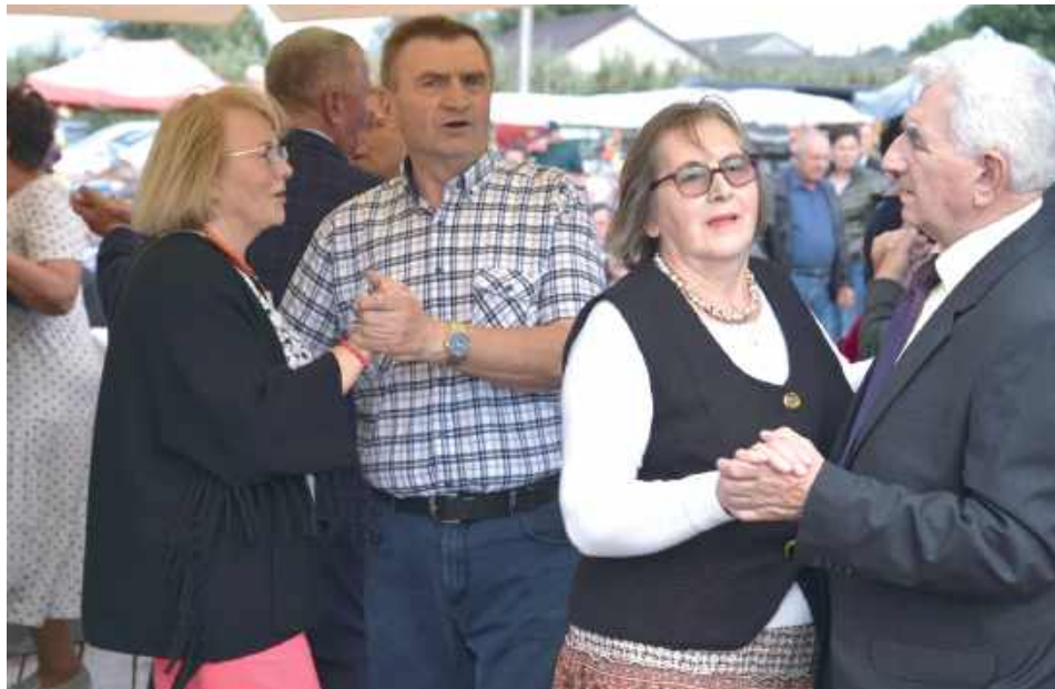
Wydarzenie miało charakter otwarty. Organizatorzy przewidzieli atrakcje zarówno dla starszych, jak i młodszych uczestników