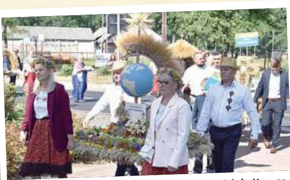
Gm. Borowie: Uroczystość rozpoczęła się o godzinie 11 mszą świętą w miejscowym kościele pw. Trójcy Świętej

Dożynki gmin Borowie, Górzno i Maciejowice. Tak się bawiliśmy