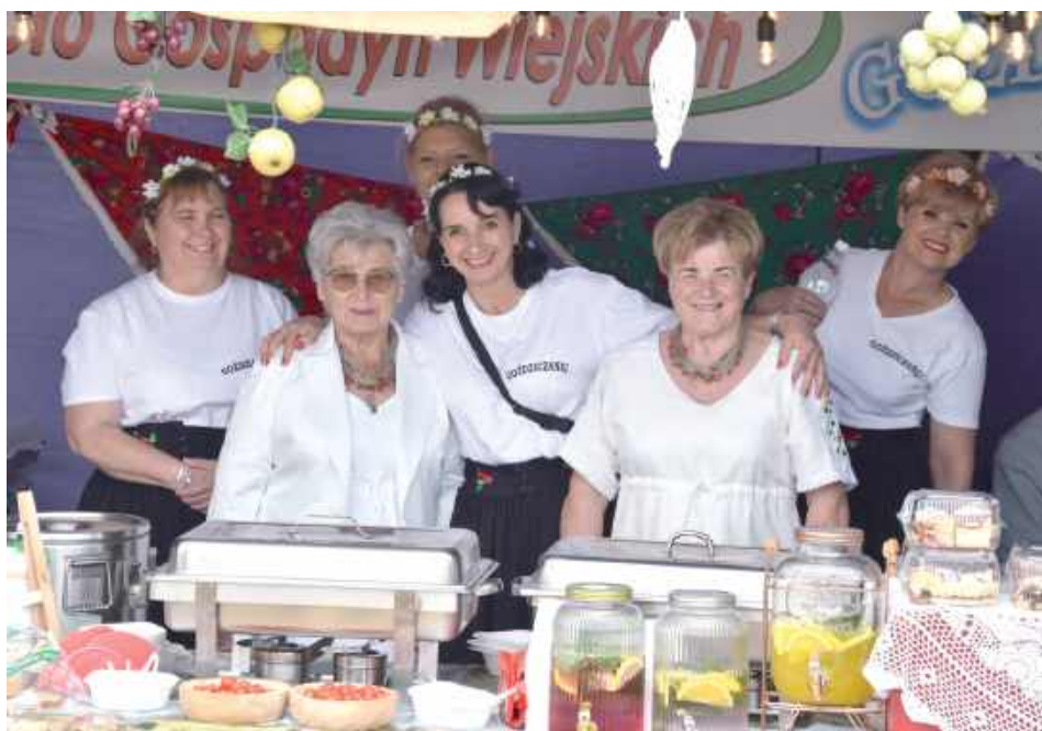
Na miejscu dostępne były stoiska gastronomiczne prowadzone przez Koła Gospodyń Wiejskich i MODR