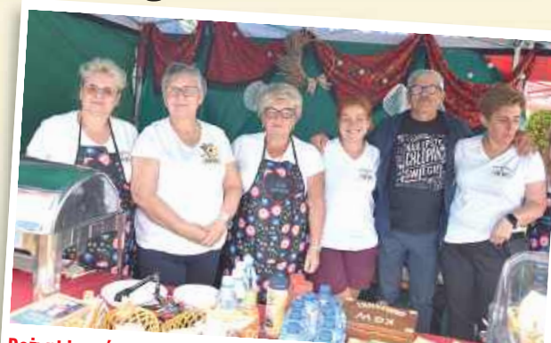
Dożynki w Górznie: Koło Gospodyń Wiejskich „Unianki” z Unina