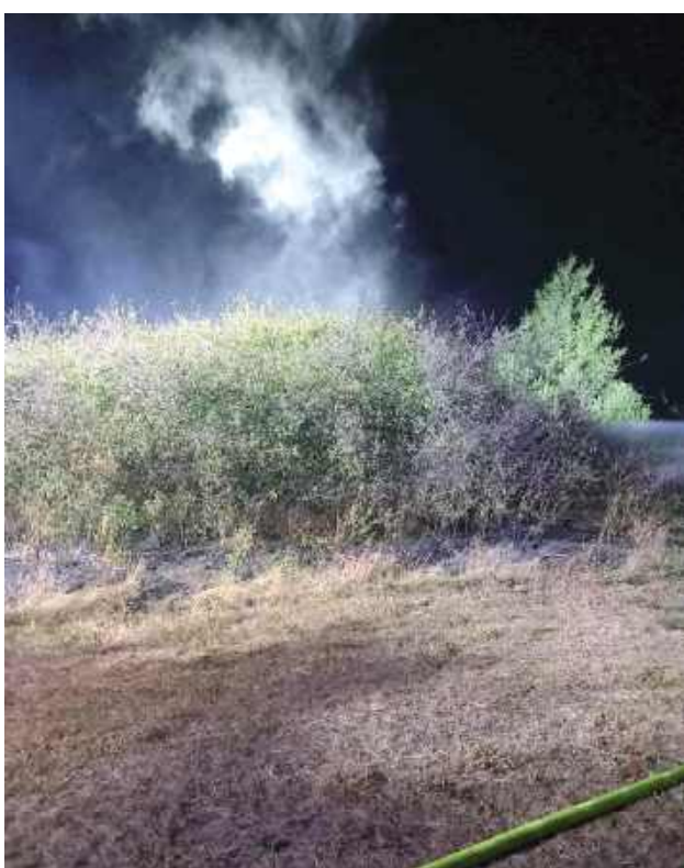
Synoptycy w miniony weekend prognozowali bardzo wysokie, miejscami ekstremalne zagrożenie pożarowe w południowej części Mazowsza

Na moment publikacji brak oficjalnych komunikatów