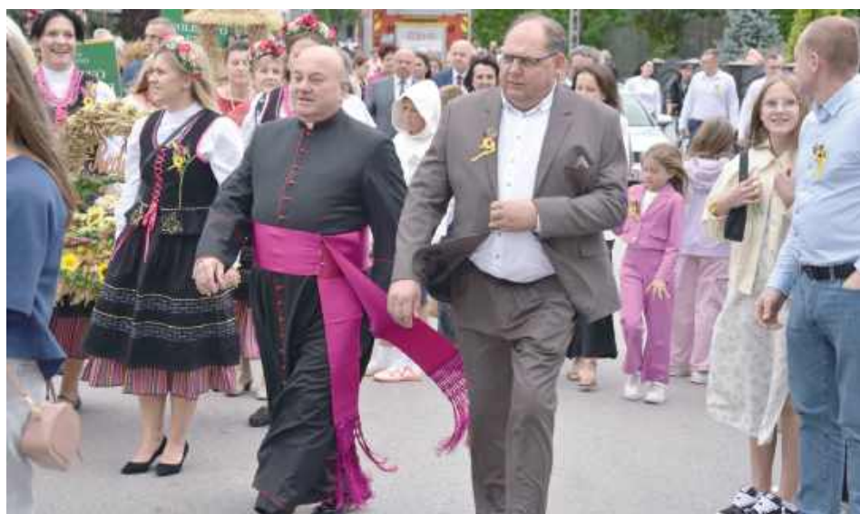
Święto plonów w Górznie obejmowało zarówno elementy tradycyjne, jak i rozrywkowe