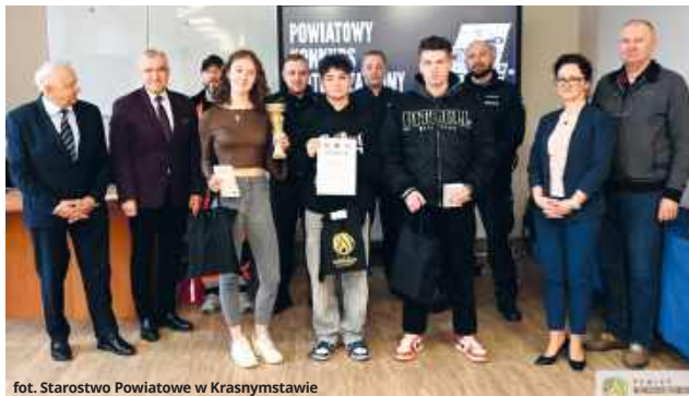
Starostwo Powiatowe w Krasnymstawie

● POW. KRASNOSTAWSKI Pasja do motoryzacji, wiedza i praktyczne umiejętności spotkały się w jednym miejscu - podczas powiatowych eliminacji Ogólnopolskiego Młodzieżowego Turnieju Motoryzacyjnego w Krasnymstawie. Uczniowie szkół średnich z całego powiatu zmierzili się w wymagających konkurencjach, walcząc nie tylko o zwycięstwo, ale i awans do etapu wojewódzkiego.