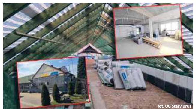
fol. UG Stary Brus

kie roboty przebiegają zgodnie z przyjętym harmonogramem. W najbliższych tygodniach wykonawca przejdzie do kolejnej fazy projektu, polegającej na unowocześnieniu systemu grzewczego. Budynek zyska całkowicie nowe, proekologiczne rozwiązania instalacyjne. Głównym źródłem ogrzewania stanie się pompa ciepła, a zapotrzebowanie na energię elektryczną pokryją dodatkowe panele fotowoltaiczne. Pozwoli to lokalnemu samorządowi nie tylko uniezależnić się od rosnących cen energii, ale także zre-