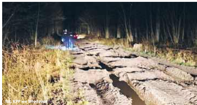
fol. KPP we Włodawie

w aucie znajdowała się dwójka kilkuletnich dzieci, noc była chłodna, a telefon systematycznie tracił zasięg. Na szczęście policjantom udało się zlokalizować zgubionych podróżników na grząskim, trudno dostępnym terenie.