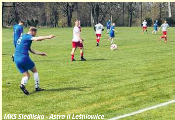
MKS Siedliska - Astra II Leśniowice