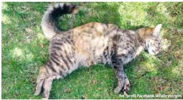
Zdjęcie martwego kota opublikowano na jednej ze społecznościowych grup 13 kwietnia.

Ktoś truje koty? To niepokojące pytanie rozgrzewa lokalną opinię publiczną od kilku tygodni. Na trawnikach i w pobliżu budynków na osiedlu Wschód w Rejowcu Fabrycznym znajdują się kolejne padłe zwierzęta i nie wiadomo do końca, jakie czynniki decydują o ich nagłej śmierci. Jedni uważają, że są systematycznie podtruwane przez osoby, którym z kotami nie po drodze. Ale są i tacy, którzy twierdzą, że za dobrostan zwierząt, a właściwie jego brak, odpowiada samymi mieszkańcy tej części miasta.