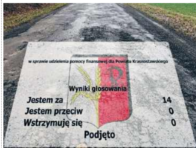
w sprawie udzielenia pomocy finansowej dla Powiatu Krasnostawskiego

Wyniki głosowania Jestem za 14 Jestem przeciw 0 Wstrzymuję się 0 Podjęto