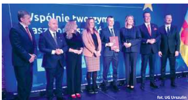
fol. UG Urszulín

Pozyskane fundusze pozwolą na realizację prac budowlanych w dwóch miejscowościach. Zgodnie z założeniami projektu, w samym Urszulín – na terenach położonych za miejscowym stadionem – wybudowana zostanie nowa sieć wodociągowa o długości 637 metrów oraz infrastruktura kanalizacyjna wraz z prze-