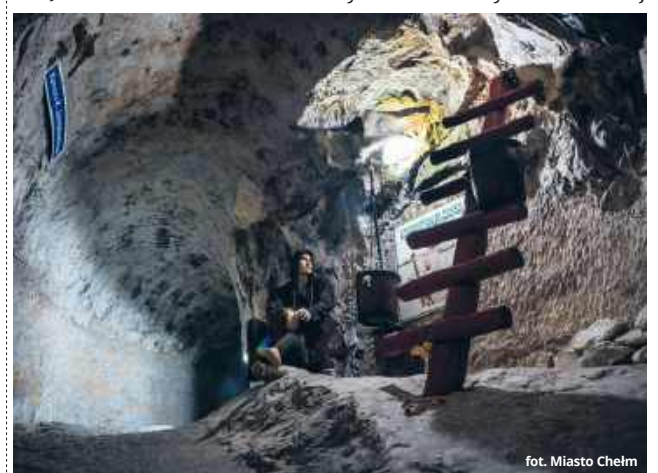
fol. Miasto Chełm

Od 10 kwietnia uruchomiona została sprzedaż biletów online. To zmiana, na którą czekali zarówno mieszkańcy, jak i turyści. Zakupu można dokonać przez platformę abilet.pl, co pozwala zaplanować wizytę z wyprzedzeniem i uniknąć nerwowego sprawdzania dostępności na miejscu.