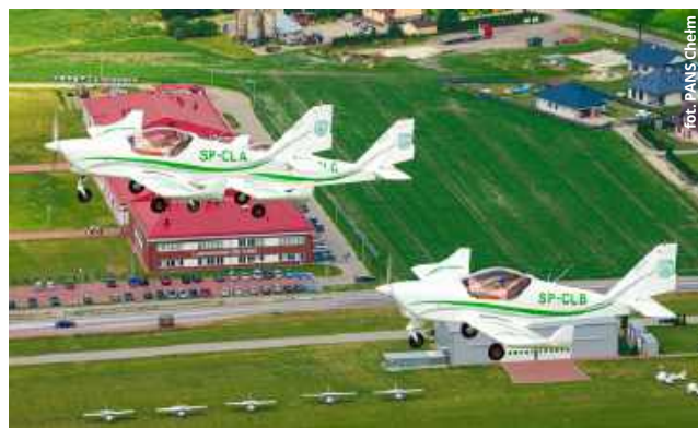
Lotnisko PANS w Deputyczach Królewskich z roku na rok rośnie w siłę. Rozbudowa infrastruktury ma wzmocnić jego pozycję jako jednego z najważniejszych ośrodków szkolenia lotniczego w Polsce.

Pierwsze efekty już widać. Niedawno uczelnia wypuściła pierwszych absolwentów kursu kontrolerów ruchu lotniczego, a na terenie kampusu działa także jednostka egzaminacyjna Urzędu Lotnictwa Cywilnego – jedyna poza Warszawą.