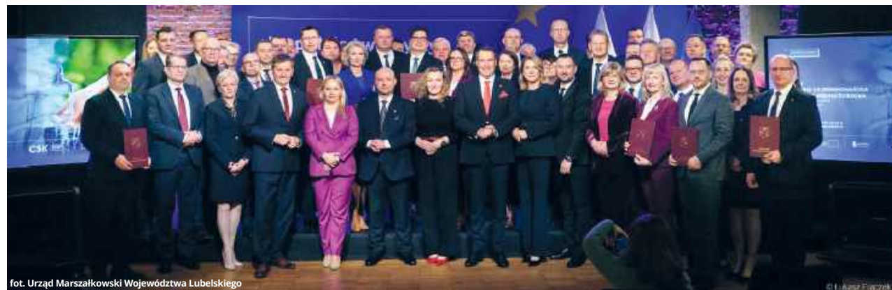
Uradz Marszalkowski Wojewodztwa Lubelskiego

lały się również samorządy z powiatu krasnostawskiego, w tym gminy: Gorzków, Fajstawice i Rudnik. To właśnie tam planowane są konkretne inwestycje poprawiające jakość życia mieszkańców oraz zwiększające bezpieczeństwo dostaw wody.