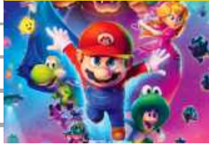
Przygodowy, Animacja, Komedia

Po tym jak Mario i Luigi udaremnił plan Bowsera na poślubienie Księżniczki Peach, muszą teraz zmierzyć się z nowym zagrożeniem ze strony jego syna. Bowser Jr. jest zdeterminowany, by uwolnić swojego uwięzionego ojca i przywrócić potęgę swojej rodziny. Z pomocą starych i nowych sojuszników bracia wyruszają w międzygwiazdową podróż, przemierzając kolejne planety, aby powstrzymać ambitnego dziedzica i jego niebezpieczną misję.