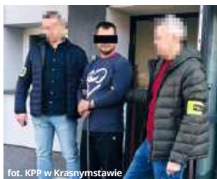
fol. KPP w Krasnymstawie

- Policjanci niezwłocznie po pozyskaniu informacji o zdarzeniu rozpoczęli intensywne czynności zmierzające do zatrzymania sprawcy. W działania zaangażowani byli funkcjonariusze wszystkich pionów Komendy Powiatowej Policji w Krasnymstawie. Wsparcia udzielili także kryminalni z Komendy Wojewódzkiej Policji w Lublinie. Już po