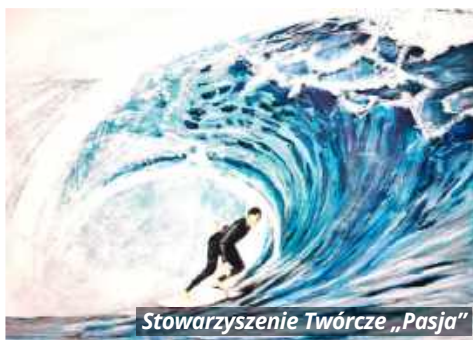
Stowarzyszenie Twórcze „Pasja”

Wernisaż zaplanowano na godzinę 17:00, a ekspozycja „Na fali” będzie dostępna dla widzów do 31 maja. MŁ