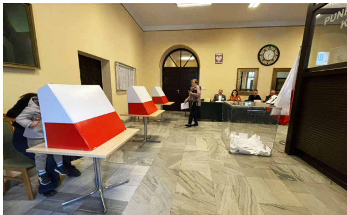
Wołów. Obwodowa Komisja Wyborcza w Ratuszu.