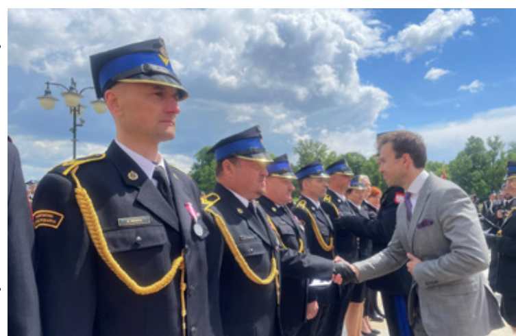
Fot. Marita Ringart