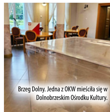
Brzeg Dolny. Jedna z OKW mieściła się w Dolnobrzeskim Ośrodku Kultury.