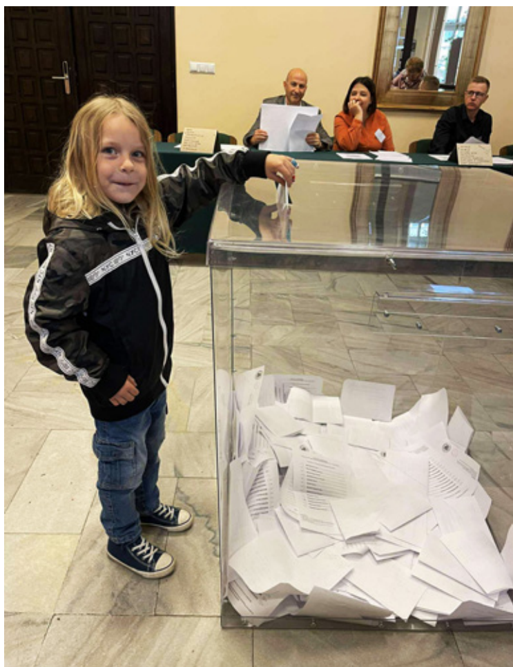
W Urzędzie Miejskim w Wołowie wyjęto z urny 673 kart. 2 głosy były nie ważne.