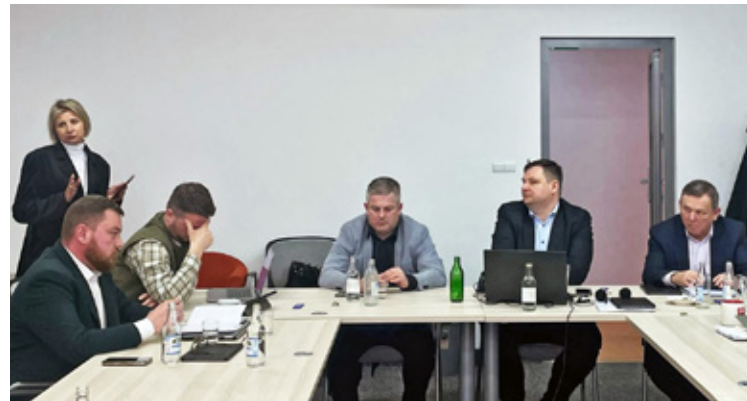
Radni dotrzymali słowa. Droga będzie remontowana.

Do przetargu zgłosiło się ośmiu wykonawców. - 6 na 8 ofert mieści się w założonym budżecie - informuje Powiat Wołowski. Oferty wahają się od 7,2 mln zł do prawie 9,8 mln zł: Nr Wykonawca Cena brutto Gwarancja