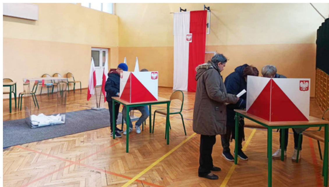
W Szkole Podstawowej w Pogalewie Wielkim wydano 575 kart do głosowania i oddano 573 ważne głosy.