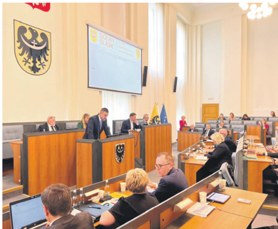
Wicemarszałek Michał Rado podczas sesji Sejmiku Województwa Dolnośląskiego

Zarząd Województwa w 2024 roku nie tylko skutecznie zrealizował zadania bieżące, ale też kontynuował projekty długofalowe, jak rewitalizacja linii kolejowych, modernizacja dróg wojewódzkich, ochrona środowiska i promocja regionu na arenie krajowej i międzynarodowej.