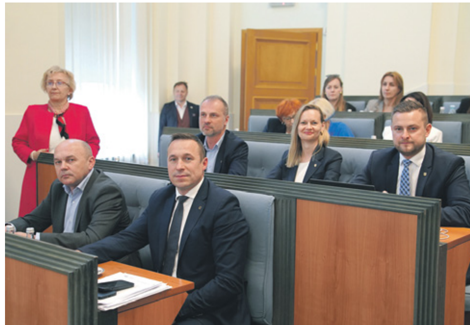
Zarząd Województwa Dolnośląskiego z absolutorium za 2024 rok

Sejmik Województwa Dolnośląskiego udzielił Zarządowi wotum zaufania oraz absolutorium za wykonanie budżetu za 2024 rok. To wyraz uznania dla odpowiedzialnego i przejrzystego zarządzania finansami regionu, którego efektem są rekordowe dochody, zrównoważone wydatki oraz kontynuacja kluczowych inwestycji dla Dolnego Śląska.