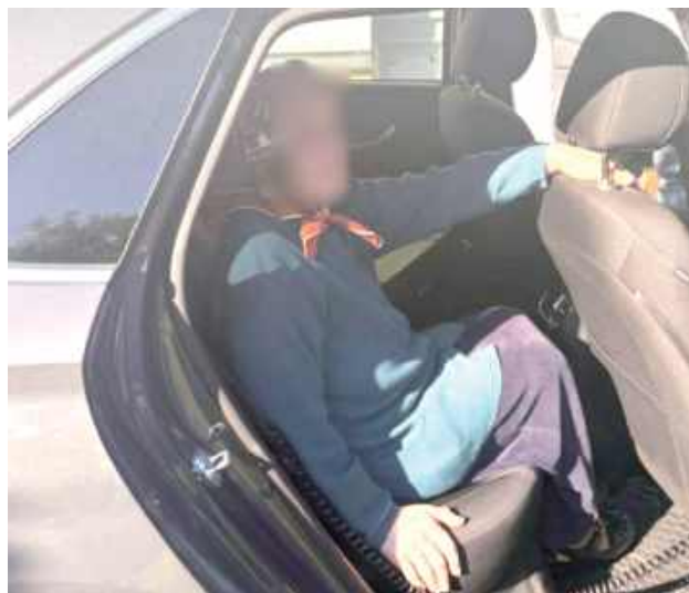
Dzięki cierpliwości i doświadczeniu funkcjonariuszy udało się ustalić tożsamość kobiety oraz miejsce jej zamieszkania

OPOLE LUBELSKIE: Dzięki czujności mieszkańców i sprawniej interwencji policjantów z opolskiej drogówki 85-letnia mieszkanka powiatu bezpiecznie wróciła do domu. Seniorka, która w upalny dzień samotnie spacerowała ulicami Opola Lubelskiego, była zdezorientowana i nie potrafiła wskazać miejsca zamieszkania.