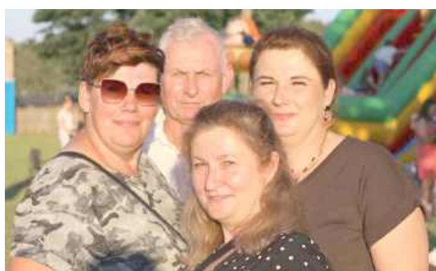
Uśmiechy i wspólne zdjęcie na pamiątkę Powiatowej Biesiady „Jak za dawnych lat”