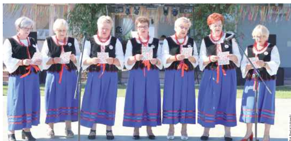
Panie śpiewały, publiczność oklaskiwała