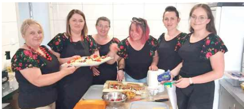
Organizatorami imprezy były panie z KGW Charlejowianki przy wsparciu życzliwych osób