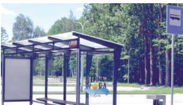
Od 27 czerwca mieszkańcy Łukowa ponownie będą mogli korzystać z sezonowej linii autobusowej Ł1, która zapewni dojazd do zalewu Zimna Woda

To jedna z kilku zmian w funkcjonowaniu komunikacji miejskiej wprowadzanych na okres wakacji. Zmodyfikowany zostanie również rozkład jazdy linii Ł2, a kursowanie linii Ł4 i Ł5 zostanie czasowo zawieszane.