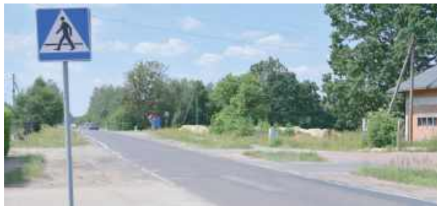
Wąsko, nierówno - niebezpiecznie, ale za 20 miesięcy już tak nie będzie

26 czerwca na parkingu w Wandowie podpisano umowę na realizację inwestycji obejmującej około 4-kilometrowy odcinek drogi wojewódzkiej nr 807 Maciejowice – Łuków. Zadanie jest częścią większego projektu rozbudo-