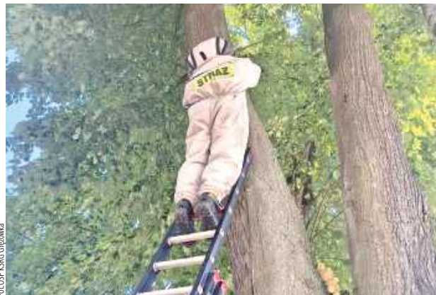
Jeden ze strażaków wyposażony w specjalny kombinezon ochronny przeznaczony do pracy z niebezpiecznymi owadami wspiął się po drabinie i zlikwidował gniazdo

Działania ratowników polegały na zabezpieczeniu miejsca zdarzenia oraz sprawnym usunięciu zagrożenia - poinformował mł. bryg. Paweł Szyszkowski z KP PSP w Łukowie.