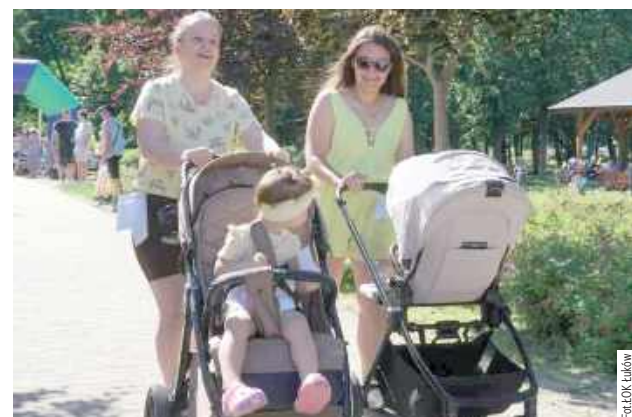
W kategorii „mama z wózkiem” rywalizowały mamy z małymi dziećmi

W sobotę, 20 czerwca w Parku Miejskim odbyły się VIII Łukowskie Wyścigi Wózków w Chodzie – Buggy Gym.