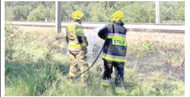
W działaniach brał udział zastęp z OSP KSRG Krzywda

Strażacy z OSP Krzywda interweniowali w sobotę, 20 czerwca przy pożarze traw w pobliżu torowiska na terenie swojej miejscowości.