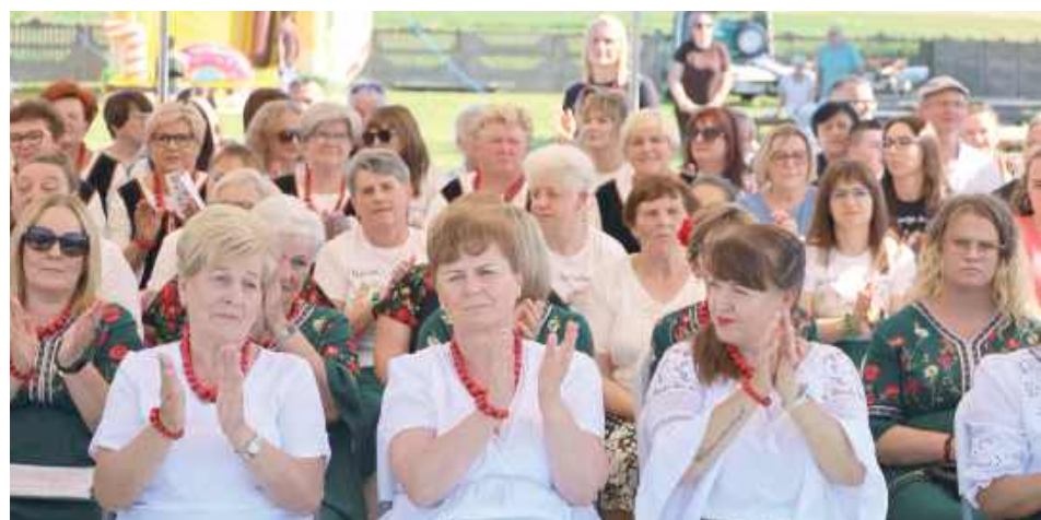
Wszyscy dobrze się bawili