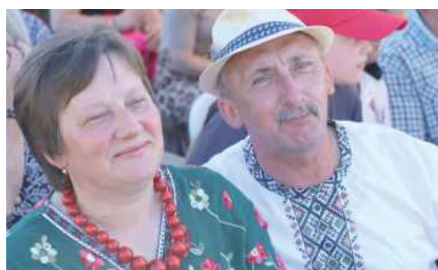
Dobra zabawa i sąsiedzka integracja towarzyszyły uczestnikom przez cały dzień