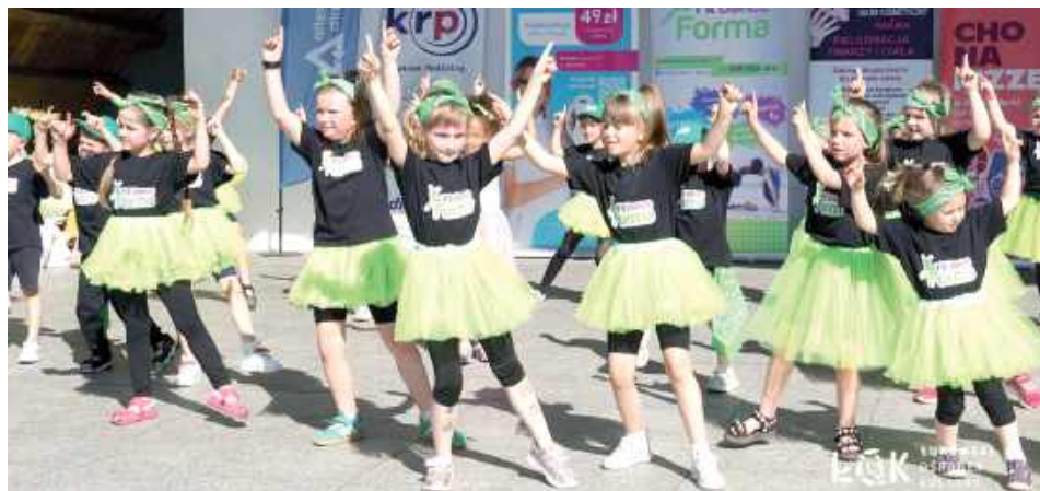
Chwila rozgrzewki przed zawodami