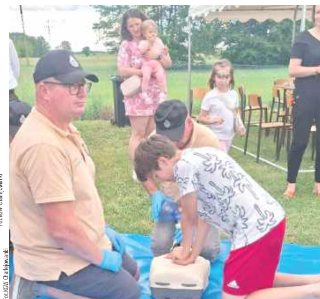
Druhowie OSP Charlejów przeprowadzili pokaz pierwszej pomocy

- Szczególne słowa uznania kierujemy do wszystkich uczestników festynu. To dzięki Waszej obecności, otwartości i wspólnej zabawie wydarzenie miało wyjątkowy charakter i na długo pozostanie w naszej pamięci – dodają panie z KGW.