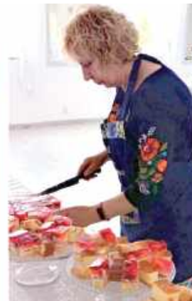
Członkinie KGW przygotowały dla uczestników zdrowe i smaczne potrawy, które cieszyły się dużym uznaniem gości