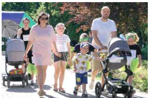
VIII Łukowskie Wyścigi Wózków w Chodzie zgromadziły całe rodziny, które wspólnie spędziły aktywne sobotnie popołudnie