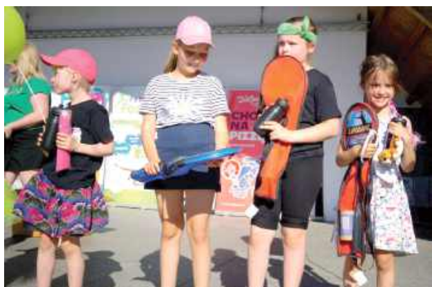
Najmłodsi cieszyli się z nagród