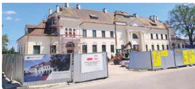
Remont zabytkowego budynku łukowskiego dworca PKP trwa i trudno dokładnie określić, kiedy będzie mogła ruszyć sala widowiskowo-teatralna na piętrze

- Tam nie przewidujemy takich powierzchni, ponieważ by się nie zmieściły. Prze-