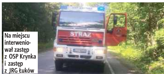
Na miejscu interweniował zastęp z OSP Krynce i zastęp z JRG Łuków

Po przybyciu na miejsce potwierdzono, że na asfalcie znajduje się rozlana substancja.