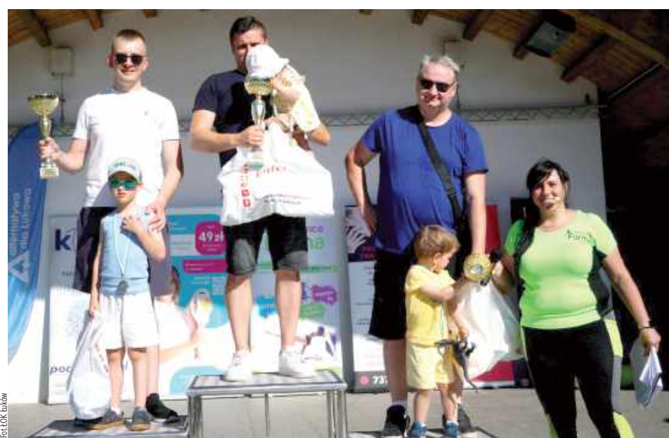
W kategorii „tata z wózkiem” ojcowie rywalizowali w biegu z wózkami dziecięcymi, walcząc o jak najlepszy czas i miejsca medalowe, za które przyznano nagrody