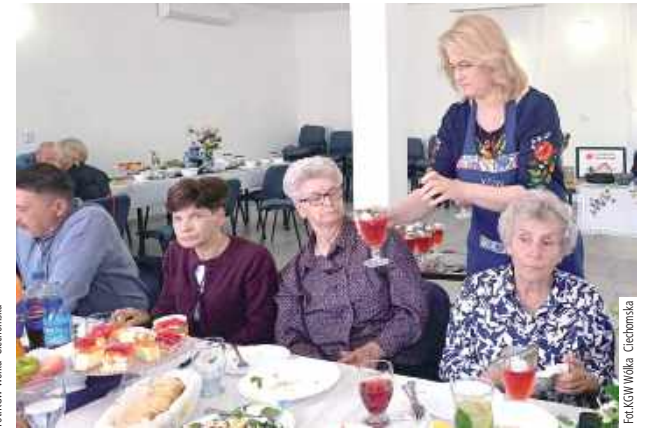
Na stole pojawiły się same pyszności

stu spędzić miło czas w gronie wszystkich za obecność, zaangażowanych osób. Dziękujemy wszystkim za obecność, zaangażowanie i podzielenie się swoimi