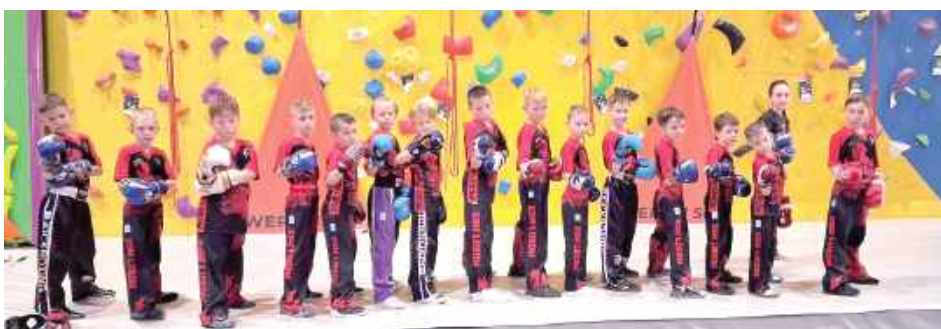
Pamiątkowe zdjęcie naszych mistrzów!

Aż 24 medale wywalczyli zawodnicy KSW Łuków podczas Letniego Grand Prix Polski w kickboxingu, które odbyło się w Mińsku Mazowieckim.