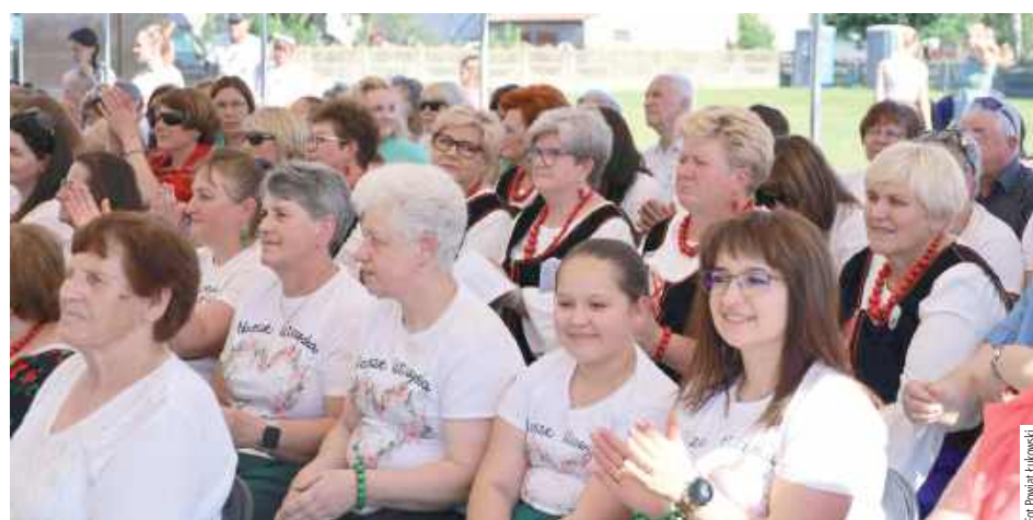
Biesiada była okazją do integracji mieszkańców i wspólnego spędzenia czasu