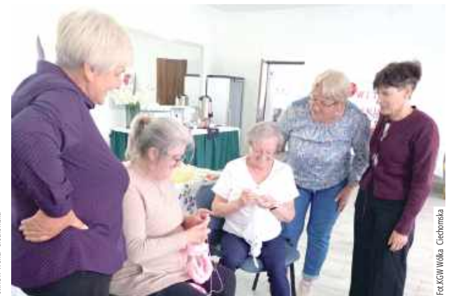
Seniorzy zaprezentowali swoje pasje i talenty, m.in. piękne prace wykonane na szydełku i drutach

wość wyjścia z domu, spotkania się z innymi ludźmi, rozmowy i oderwania się od codziennej samotności.