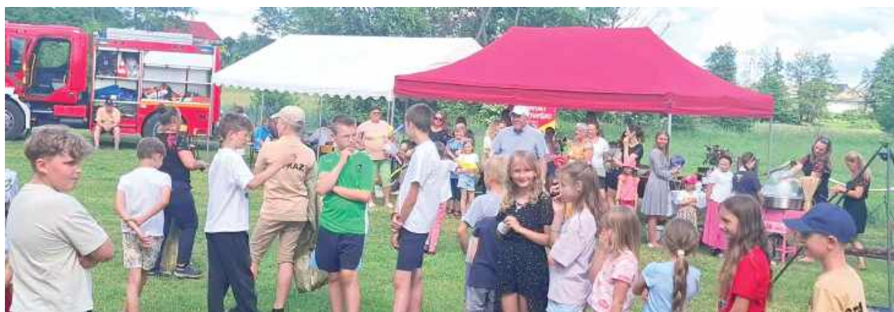
Mieszkańcy Charlejowa i okolic wspólnie bawili się podczas festynu integracyjnego