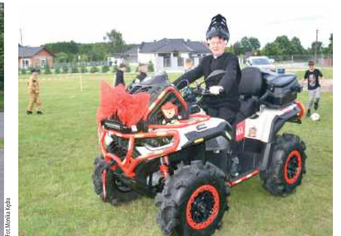
Był też czas, żeby bliżej poznać nowy pojazd ratowniczy