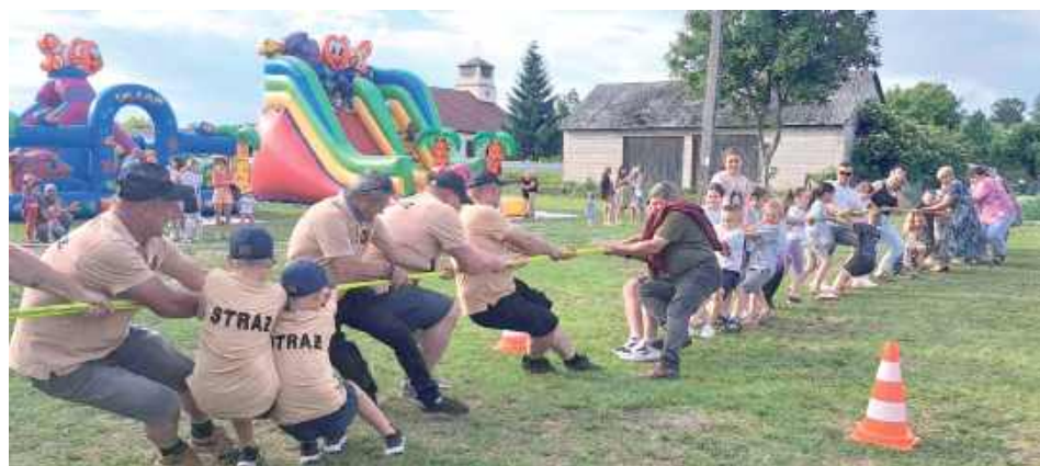
To dopiero były zawody w przeciąganiu liny!