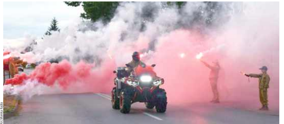
Nowy quad został uroczystie powitany przez druhow i mieszkańców przy efektownej oprawie z racami

- Dziękujemy również władzom samorządowym za obecność oraz życzliwość okazywaną naszej jednostce, a także wszystkim osobom zaangażowanym w realizację tego przedsięwzięcia. Szczególne podziękowania składamy Księdzu Proboszczowi za poświęcenie pojazdu oraz modlitwę o bezpieczną służbę i szczęśliwe powroty z każdej akcji. Dziękujemy wszystkim mieszkańcom oraz osobom wspierającym naszą jednostkę. To również dzięki Waszemu zaangażowaniu, udziałowi w naszych inicjatywach oraz okazanemu wsparciu mogliśmy