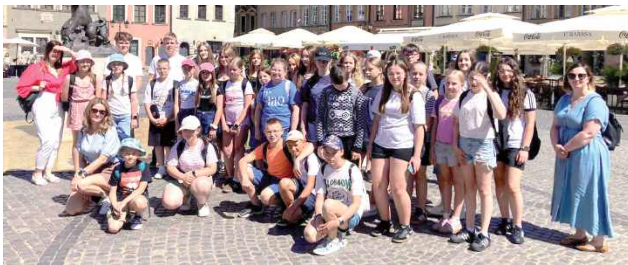
Podczas wycieczki uczniowie zwiedzili warszawską Starówkę oraz spacerowali Krakowskim Przedmieściem