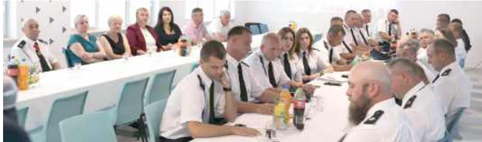
W wydarzeniu uczestniczyli strażacy, samorządowcy i zaproszeni goście

Po przedstawieniu sprawozdań z działalności delegacji udzielili ustępującemu Zarządowi absolutorium.