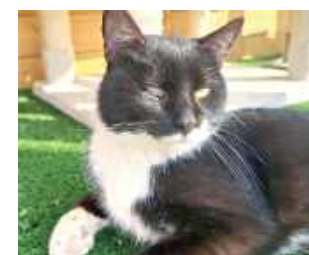
Niezlomny Filemon wygrał walkę o życie i szuka nowego domu

Opiekunowie opisują Filemona jako niezwykle łagodnego, spokojnego i towarzyskiego kota, który uwielbia bezpośredni kontakt z człowiekiem, chętnie wchodzi na kolana i domaga się głaskania. Zwierzę bezproblemowo odnajduje się w towarzystwie innych kotów i nie wykazuje