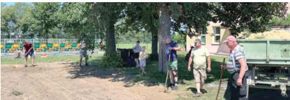
Przeprowadzono rozbiórkę starego budynku, który od lat nie pełnił żadnej funkcji, a jego stan techniczny był zły

Teren przy Szkole Podstawowej w Oszczepalinie Drugim ponownie stał się miejscem intensywnych prac porządkowych. Dzięki zaangażowaniu wielu osób udało się wykonać kolejne ważne zadania, które poprawią bezpieczeństwo oraz estetykę otoczenia szkoły.