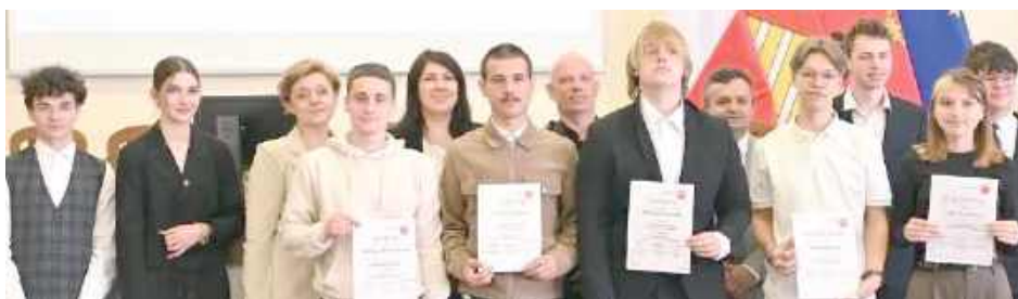
W dwuetapowych zmaganiach wzięło udział ponad 100 uczniów ze szkół średnich powiatu łukowskiego

Finał konkursu odbył się 19 czerwca podczas sesji Młodzieżowej Rady Powiatu Łukowskiego. W tegorocznej edycji, która miała dwuetapową formułę,