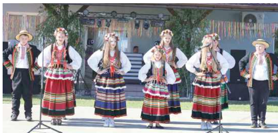
W pięknych ludowych strojach zaprezentowała się również młodzież