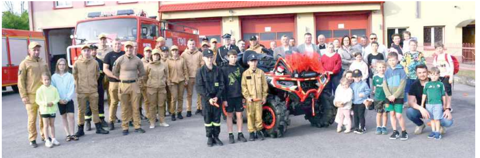
W wydarzeniu uczestniczyli strażacy, mieszkańcy oraz zaproszeni goście

- To kolejny krok w rozwoju naszej OSP i dowód na to, że dzięki wytrwałości, determinacji oraz wspólnej pracy można osiągnąć nawet najbardziej ambitne cele. Mimo wcześniejszych przeciw-