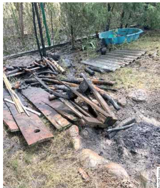
Pożarem objęte były nieużytki na powierzchni około 30 m2 oraz składowane w pobliżu drewno opałowe

W czwartek, 25 czerwca, przed godziną 13 wpłynęło zgłoszenie o pożarze w miejscowości Zabieli (gmina Stoczek Łukowski).