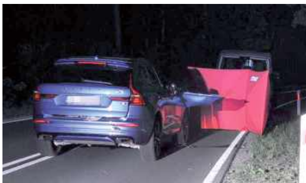
Mężczyzna poruszał się bez elementów odblaskowych. Do wypadku doszło poza terenem zabudowanym, na nieoświetlonym odcinku drogi

Jak wynika ze wstępnych ustaleń policji, kierujący samochodem Volvo 20-letni mieszkaniec Puław, na prostym, nieoświetlonym odcinku drogi poza terenem zabudowanym, potrącił poruszającego się