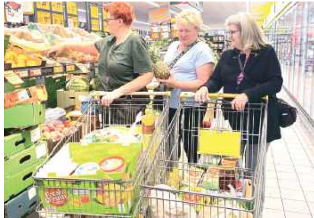
Przed spotkaniem panie udały się na zakupy do Biedronki

- To wszystko jest możliwe dzięki programowi „Danie Wspólnych Chwil” z Fundacją Biedronki, która po raz kolejny obdarzyła nas zaufaniem i pozwoliła zorganizować to wyjątkowe spotkanie. Jesteśmy wdzięczni za wsparcie i możliwość tworzenia miejsca, w którym nasi seniorzy mogą czuć się potrzebni, docenieni i po pro-