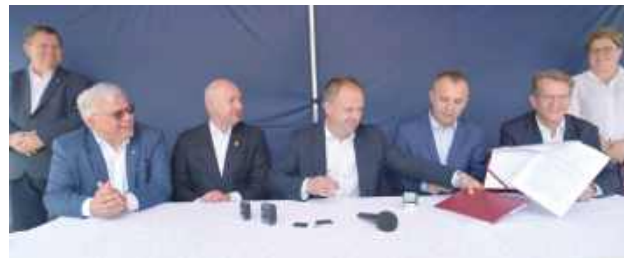
W Wandowie 26 czerwca w obecności łukowskich samorządowców podpisano umowę z firmą Strabag

Zakres prac przewiduje kompleksową rozbudowę drogi. Wykonana zostanie nowa konstrukcja jezdni wraz z nową nawierzchnią asfaltową i wzmoc-