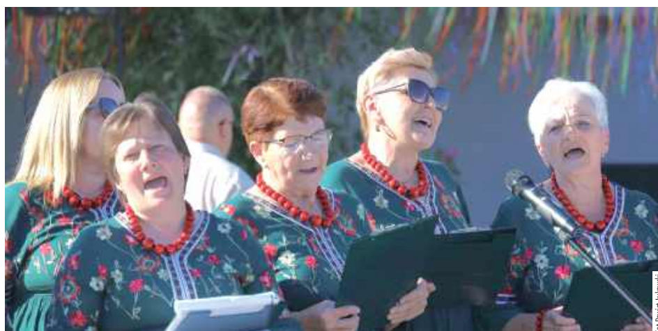
Wspólne śpiewanie w wykonaniu Kół Gospodyń Wiejskich