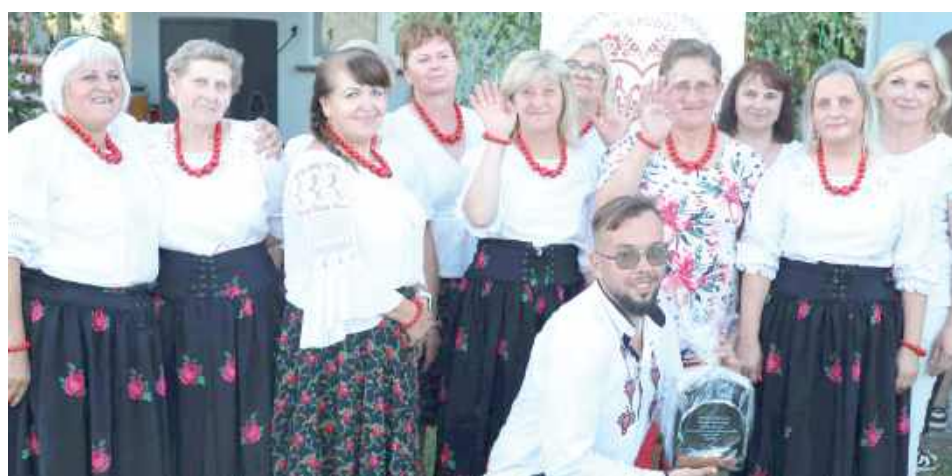
W wydarzeniu udział wzięły Koła Gospodyń Wiejskich z wielu miejscowości powiatu łukowskiego