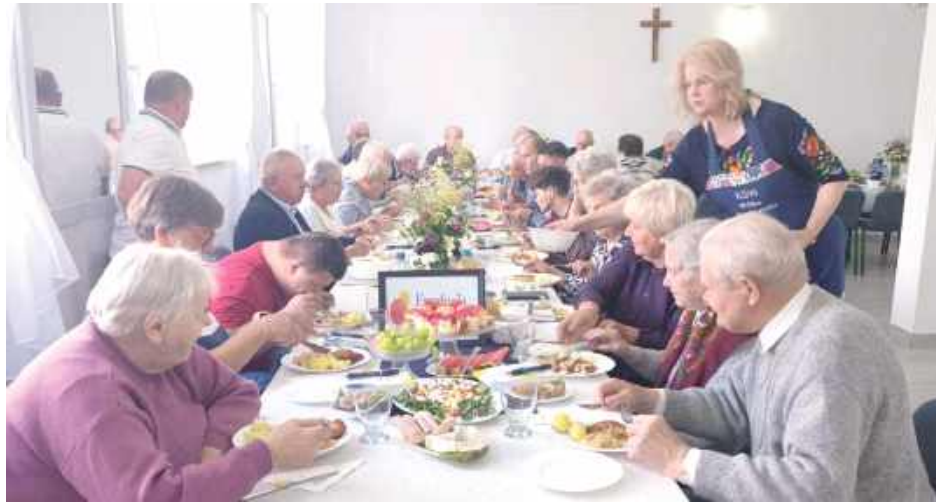
Spotkanie było okazją do wspólnych rozmów, integracji oraz spędzenia czasu w serdecznej atmosferze

Spotkanie przebiegło w niezwykle serdecznej atmosferze. Był czas na rozmowy, wspomnienia, wymianę doświadczeń i wspólne spędzenie czasu. Takie chwile są bardzo ważne, ponieważ dają seniorom możli-