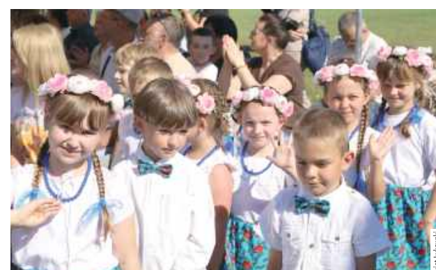
Podczas wydarzenia wystąpiły również dzieci