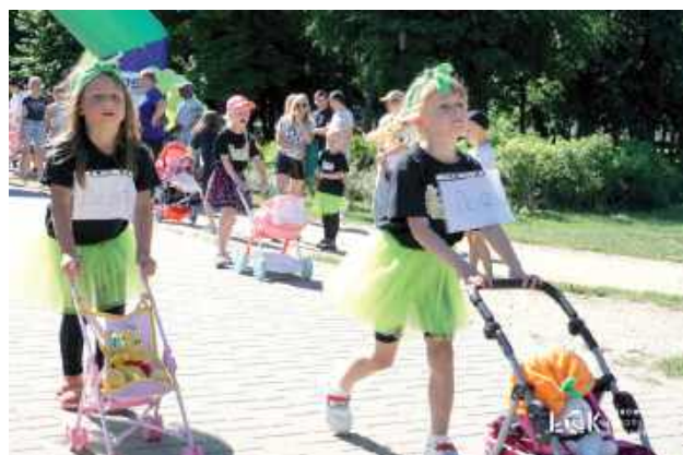
Dla najmłodszych przygotowano wyścigi wózków z lalkami