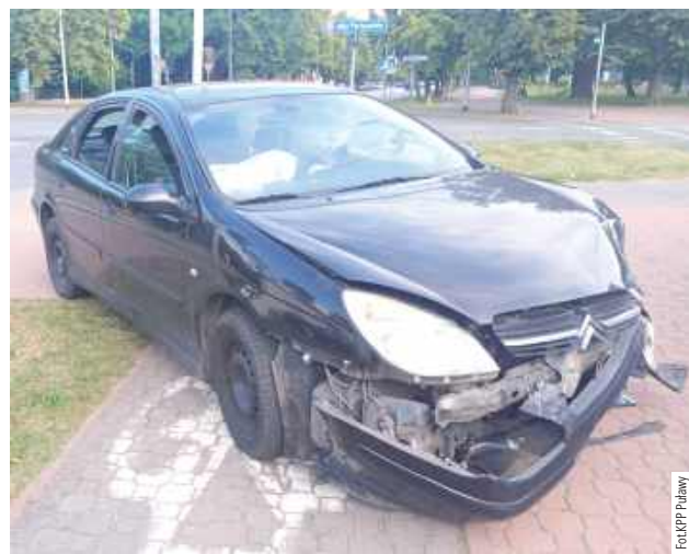
28-letni mieszkaniec gminy Przytyk prowadził auto, mając 2,5 promila alkoholu w wydychanym powietrzu

2,5 promila miał kierowca Citroena, który na jednym ze skrzyżowań, nie zważając na samochody jadące z naprzeciwka, z impetem skręcił w lewo, doprowadzając do zderzenia z BMW. Teraz 28-latek będzie tłumaczył się przed sądem.