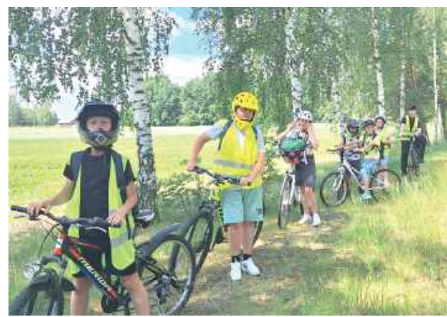
Uczniowie klasy IV Zespołu Szkół w Okrzei wyruszyli na rowerową wycieczkę do Lasu Gułowskiego