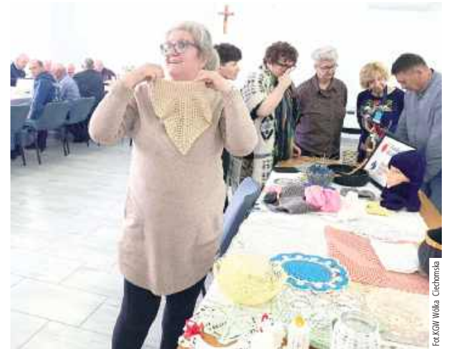
Przepiękne rękodzieło wzbudziło zainteresowanie