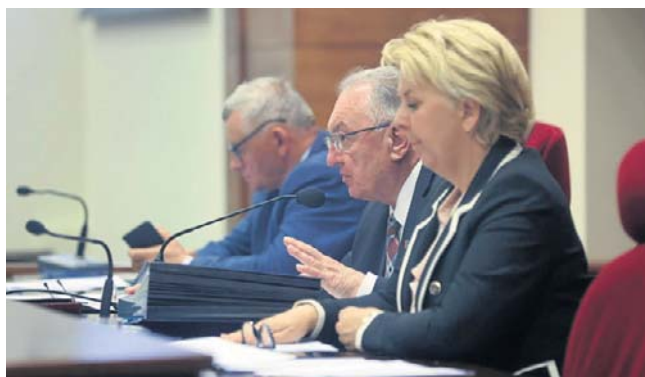
Radni przedstawili siedem żądań w sprawie zagrożenia ze strony niedźwiedzi. Zostaną wysłane do premiera

- Dotychczasowe działania mają charakter wyłącznie doraźny. Chcemy zwrócić uwagę właściwych organów na konieczność pilnego wdrożenia