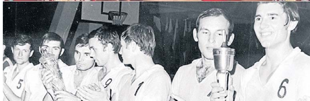
Mistrzowie Polski 1975 i 2012. Dwie zupełnie inne Resovie. Tylko zwycięstwa smakowały tak samo i kibice zachowywali się jednakowo fantastycznie

Natchnieni Bieszczadem - organizatorem wydarzeń sportowych i kulturalnych na Podkarpaciu. W sobotę, 30 maja o godz. 17 w Auli Politechniki Rzeszowskiej odbędzie się Gala 80-lecia Podkarpackiej Siatkówki z udziałem około 400 gości z siatkarskiego środowiska regionu. Galę poprowadzą Patrycja Zahorska - dziennikarka sportowa Telewizji Polsat, była mistrzyni bikini fitness oraz Bartosz Gajda - znany artysta kabaretowy, stand-uper i konferansjer zwią-