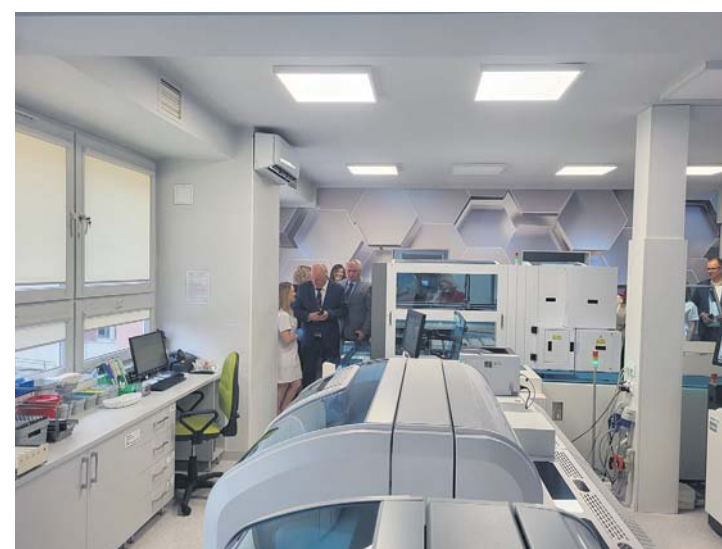
Wizyta studyjna w Zakładzie Diagnostyki Laboratoryjnej szpitala wojewódzkiego w Przemyślu.