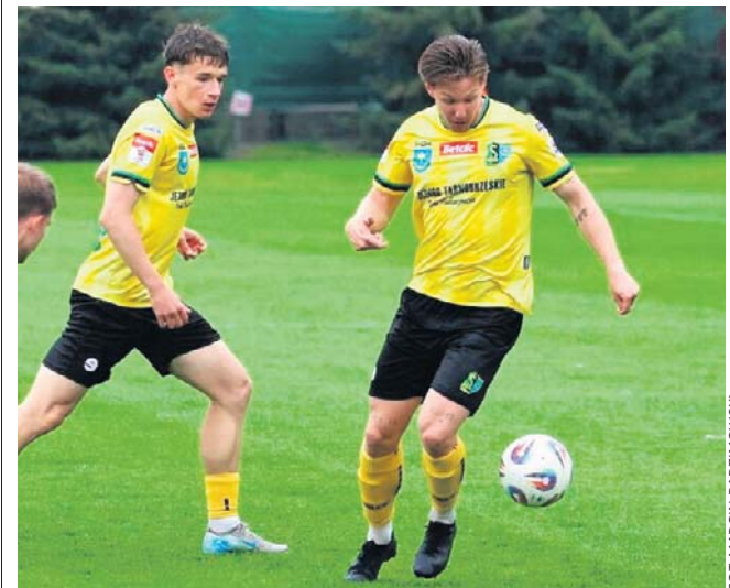
Piłkarzom Siarki nie wiedzie się ostatnio najlepiej - czy będą w lepszych humorach po meczu pucharowym?

Ponadto odbędą się również dwa inne spotkania - w klasie okręgowej (grupa dębicka) rezerwy Stali Mielec podejmą Sokoła Kolbuszowa Dolna - początek o godz. 19. Wcześniej, bo o godz. 16 na sztucznym boisku okręgowym piłkarze z Wiązownicy niespodziewanie pokonali Pogoń-Sokół Lubaczów, która przecież wystę-