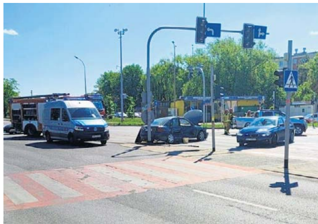
Do wypadku doszło na skrzyżowaniu ulic Obrońców Poczty Gdańskiej z Ofiar Katynia w Rzeszowie

Funkcjonariusze sprawdzili stan trzeźwości obu kierujących. Jak ustalono, kobiety były trzeźwe.