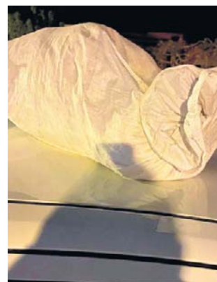
Położył worki z gruzem na trzech samochodach

Tę bulwersującą sprawę opisywaliśmy w Nowinach. Przypomnijmy. Do zdarzenia doszło pod koniec kwietnia przy ulicy Szwoleżerów w Rzeszowie. Dyżurny miejski otrzymał zgłoszenie dotyczące podejrzanego worka pozostawionego na dachu jednego z pojazdów.