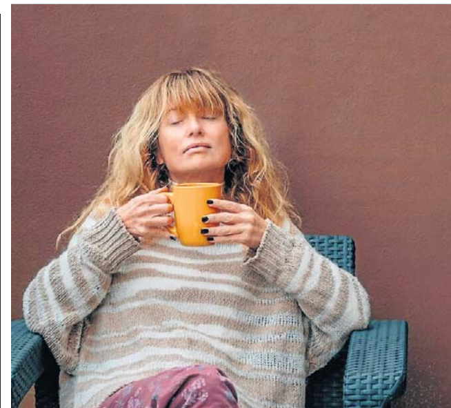
Nie trzeba wierzyć w moc ćwiczeń oddechowych, by czerpać z nich korzyści

Jeśli potrzebujesz prawdziwego odpoczynku, zamiast modnych kurortów wybierz tę spokojną, górską wieś. Może właśnie tutaj odnajdziesz swoje własne źródło sił - dosłownie i w przenośni.