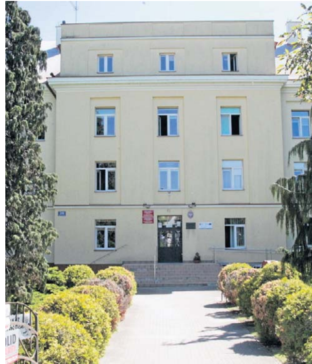
Zespół Szkół nr 3 im. Tadeusza Ryłskiego w Rzeszowie znajduje się w bardzo atrakcyjnej części miasta

Nieruchomości, na których funkcjonuje szkoła wraz z całym kompleksem dydaktycznym, są dzierżawiona nieodpłatnie od tej spółdzielni przez miasto. Dzierżawa dobiegnie końca 10 sierpnia 2027 r., jednak właściciele chcą odsprzedać miastu na zasadzie pierwokupu za kwotę księgową 7 mln zł cały teren. Mimo wstępnych chęci kupna ze strony władz miasta, sprawa utknęła w miejscu na 3 lata. Stąd decyzja o możliwości sprzedaży na wolnym rynku za o wiele wyższą ceną. Jeżeli miasto nie podejmie decyzji o kupnie do 30 czerwca tego roku, to nieruchomość będzie mógł kupić każdy. Wtedy najprawdopodobniej trafi do deweloperów, gdyż jest to bardzo atrakcyjne miejsce w mieście, a w sąsiedztwie szkoły stoją już wieżowce.