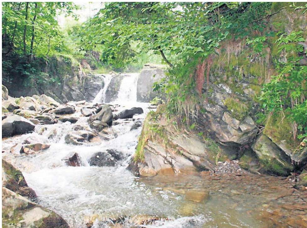
Ukryta wśród beskidzkich wzgórz Łomnica-Zdrój urzeka ciszą i spokojem

Wody Łomnicy to szczyt - lekko gazowane źródła bogate w wapń, magnez i wodorowęglany. Piją je zarówno turyści, jak i miejscowi, wierząc w dobroczynny wpływ na układ pokarmowy i odpor-