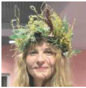
Mał wokalistka zespołu Chrust

Godny patrona był następnie koncert światowej klasy sakso-