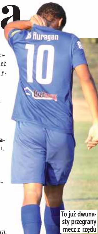
To już dwunasty przegrany mecz z rzędu

Janowianka Janów Lubelski - Orleća Spomlek Radzyń Podlaski 0:2 (1:3) Powrót na ligowe podium