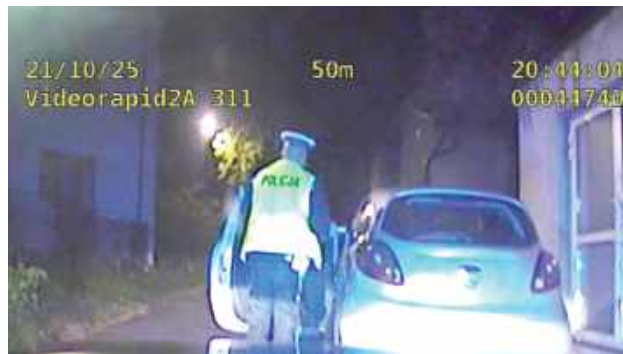
Podczas rozmowy z kierowcą wyculi od niego silną woń alkoholu, a badanie alkomatem potwierdziło jego nietrzeźwość, miał ponad 1,5 promila alkoholu w organizmie

60-letni mieszkaniec powiatu ryckiego, 21 października, wsiadł za kierownicę swojego samochodu, mając ponad 1,5 promila alkoholu w organizmie i nie zastosował się do znaku „STOP” na skrzyżowaniu ulic Warszawskiej i Wyczółkowskiej w Rykach.