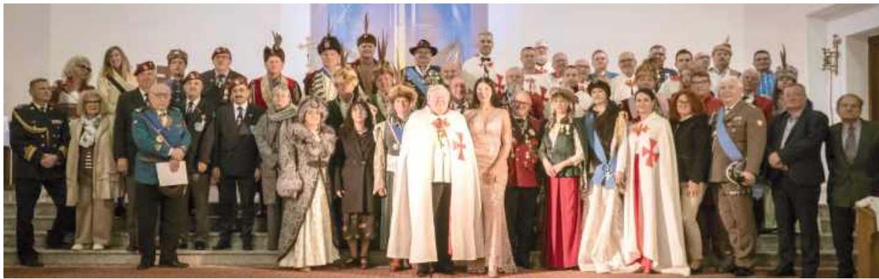
Podczas pielgrzymki bractw i współczesnych templariuszy w terespolskim kościele pw. Trójcy Świętej