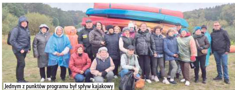
Jednym z punktów programu był spływ kajakowy

Wyprawa odbyła się 10 października, w towarzystwie wolontariuszy, którzy wspierali uczestników zarówno na wodzie, jak i podczas dalszych części dnia. Pogoda i humory dopisały, a malownicze krajobrazy Podlasia sprawiły, że spływ stał się niezapomnianą przygodą.