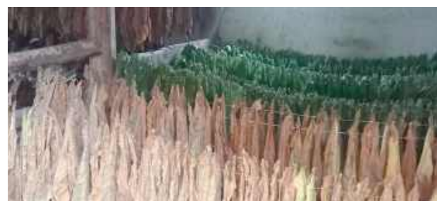
Z ustaleń funkcjonariuszy wynikało, że zamieszkujący ją 60-latek posiada tytoń, z którego domowym sposobem wytwarza papierosy, nie mając na to zezwolenia

Przed weekendem (18-19 października) kryminalni terespolskiego komisariatu weszli na jedną z posesji w gm. Terespol. Z ustaleń funkcjonariuszy wynikało, że zamieszkujący ją