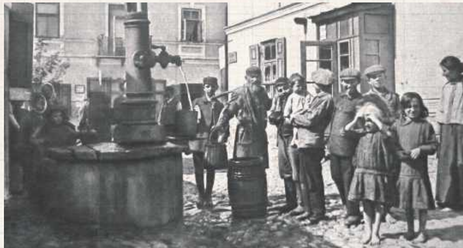
Żydowskie dzieci i nosiwoda przy nieistniejącej miejskiej studni na placu Szkolny Dwór. Fotografia z ok. 1907 roku