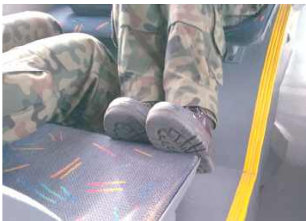
Za mundurem panny sznurem. Gorzej z butami...

Dziewczyny z klasy wojsko- wej jechały właśnie do swojej szkoły autobusem miejskim w Białej Podlaskiej. Jedna spo- kojna, nie wadziła nikomu, druga najdziksze wymyślała swawole z nogami. Chociaż jeszcze nie było późno, rap- tem godz. 10.30, ale bardziej