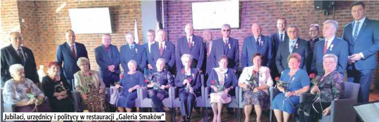
Jubilaci, urzędnicy i politycy w restauracji „Galeria Smaków”

Trzyście par małżeńskich zamieszkałych na terenie miasta Terespol zostało odznaczonych w 2024 roku przez Prezydenta RP Andrzeja Dudę medalami „Za Długoletnie Pożycie Małżeńskie”. Wręczenie mogło jednak zostać zorganizowane dopiero w październiku 2025, niestety, nie wszystkie pary doczekały do tej chwili.