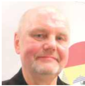
J twórca i dyrektor Podlasie Jazz Festival

fonisty Henryka Miśkiewicza ze Special Quartet z kompozy- cjami Ptaszyna. Muzycy, któ- rzy przez lata grali w kwartecie Jana Ptaszyna Wróblewskiego, w Białej Podlaskiej, występując obok dużego portretu mistrza, oczarowali publiczność jazzem na żywo, bez wspomagań elek- tronicznych. Duch patrona, przywoływanego kilkakrotnie, gościł na tej imprezie, która zaprezentowała różne odmiany jazzu.