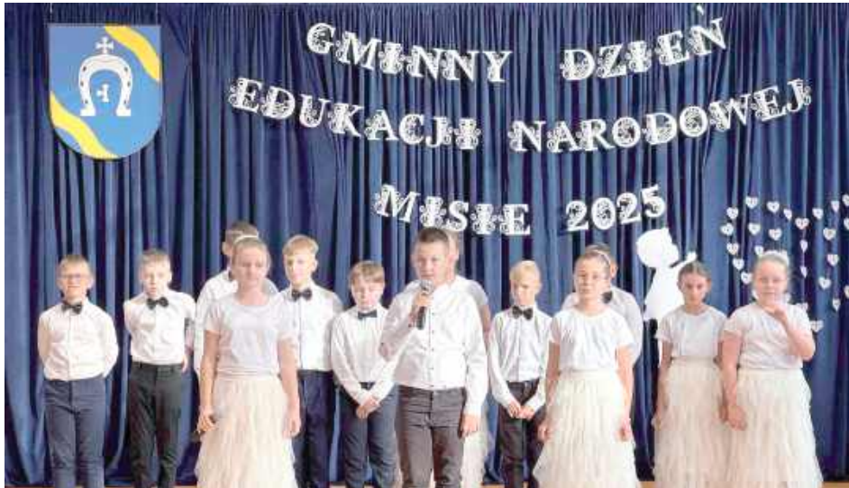
Po części oficjalnej uczniowie zaprezentowali przygotowany z sercem i zaangażowaniem program artystyczny