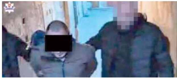
Zatrzymanie poszukiwanych mężczyzn

Dwóch mieszkańców Łęcznej, poszukiwanych listami gończymi, wpadło w ręce „łowców głów” z Komendy Wojewódzkiej Policji w Lublinie. Mężczyźni w wieku 29 i 31 lat ukrywali się w jednym z mieszkań w centrum Lublina.