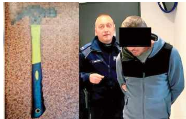
41-latek został doprowadzony do Prokuratury, gdzie usłyszał zarzuty, do których się przyznał

Z jego relacji wynikało, że kiedy przebywał na w rejonie swojej posesji, podszedł do niego jego były pracownik. Doszło pomiędzy nimi do wymiany zdań odnośnie wypłaty zaległej gotówki za powierzone prace pomocowe. Mężczyzna wyjaśnił, że