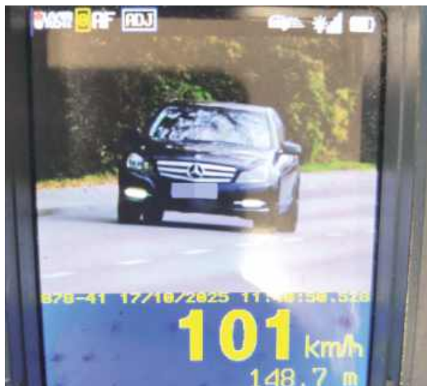
Młody mężczyzna miał już na swoim koncie 12 punktów za korzystanie z telefonu w czasie jazdy. Po przekroczeniu dopuszczalnej liczby punktów karnych zostanie skierowany na ponowny egzamin sprawdzający kwalifikacje do kierowania pojazdami

Policyjny pomiar prędkości na ulicy Spacerowej w Dęblinie zakończył się dla młodego kierowcy z powiatu ryckiego bardzo kosztownie. Mężczyzna jechał za szybko w miejscu, gdzie obowiązuje ograniczenie do 50 km/h.