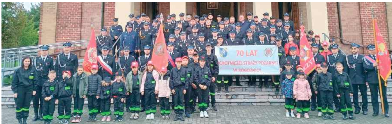
Uroczystości rozpoczęła uroczystą Mszą Świętą w kościele pw. Matki Boskiej Nieustającej Pomocy w Maniach

Obchody, zorganizowane 11 października, rozpoczęły się od mszy świętej w intencji strażaków, po której odbył się uroczysty apel. W obecności władz samorządowych, przedstawicieli służb mundurowych, duchowieństwa oraz mieszkańców wręczono liczne odznaczenia i wyróżnienia zasłużonym druhom.