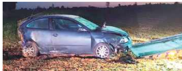
Kierująca samochodem osobowym marki Seat Ibiza 21-letnia mieszkanka gminy Wołyń straciła ponownie nad autem, zjechała do rowu, a następnie dachowała

Radzyń Podlaski: Niemal 1,5 promila alkoholu w organizmie miała kierująca Seatem Ibiza. Straciła panowanie nad autem i zjechała do rowu, po czym dachowała.