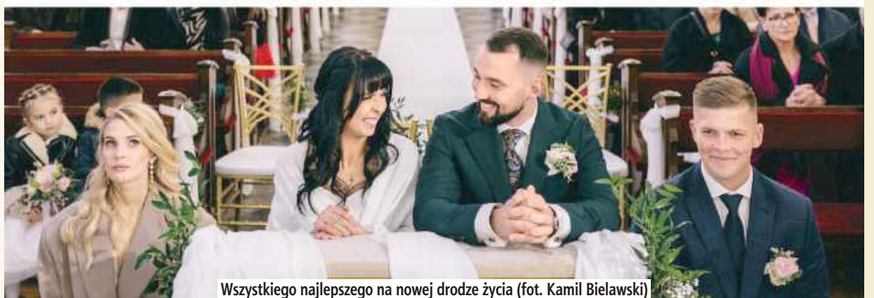
Wszystkiego najlepszego na nowej drodze życia