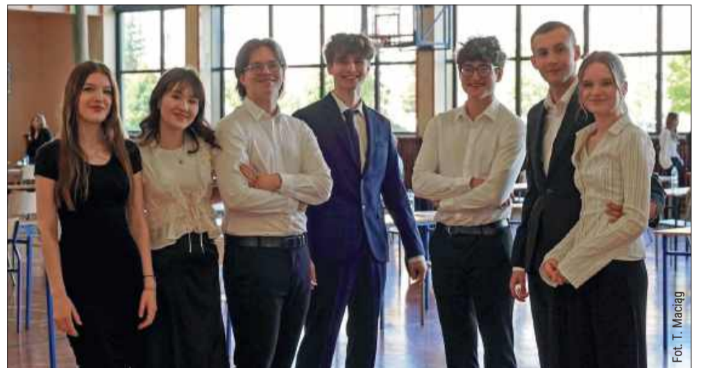
Licealistów nie opuszczał uśmiech.