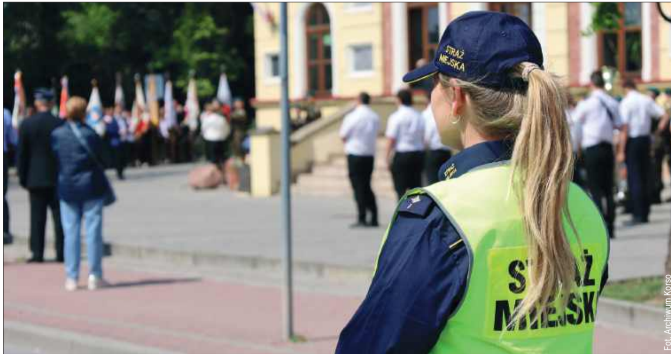
Widok strażników miejskich na ulicach Kolbuszowej, mimo likwidacji Straży Miejskiej był tematem obrad podczas sesji.