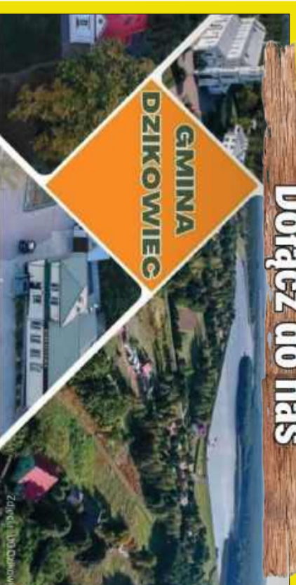
Zdjęcie: 100 Dzikowiec