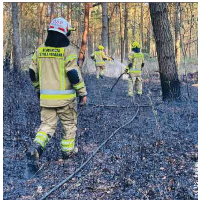
Do dwóch pożarów lasu doszło w Porębach Kupieńskich.

morowie, gdzie pomagali policji oraz pogotowiu ratunkowemu. Następnie, o 14:27, w sąsiedztwie obwodnicy od Zarębek w stronę Raniżowa doszło do pożaru suchej trawy i nieużytków. kz