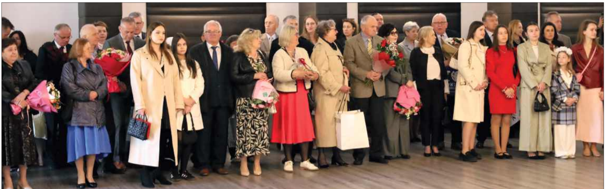
Wśród gości znaleźli się członkowie rodzin oraz władze.

A kiedy na sali wybrzmiewało gromkie „200 lat”, wszyscy chyba byli zgodni, że w tym przypadku to wcale nie była przesada.