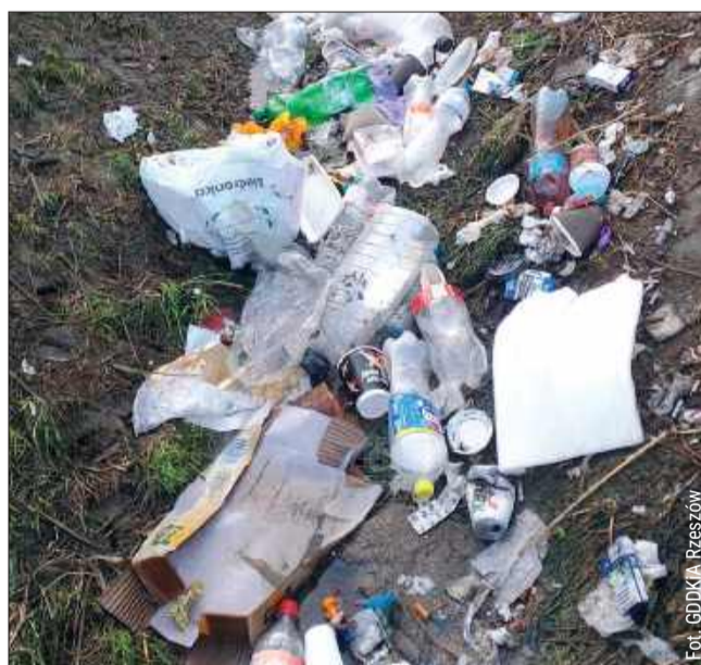
Taki widok nadal możemy spotkać przy drogach na Podkarpaciu.

Niebezpieczne są także resztki rozerwanych opon, połamane