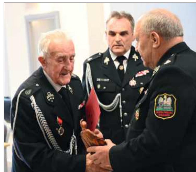
Druhowie za dotychczasową działalność otrzymali pamiątkowe statuetki.