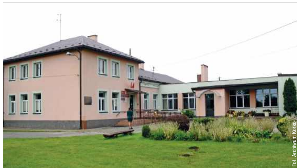
Od września szkołę specjalną czekają zmiany.

Największy niepokój budzi obecnie kwestia zatrudnienia. Ponieważ stare placówki są likwidowane, a powiat tworzy nowe, konieczny jest nowy nabór pracowników. Obecnie w szkole pracuje 26 nauczycieli oraz 11 pracowników obsługi.