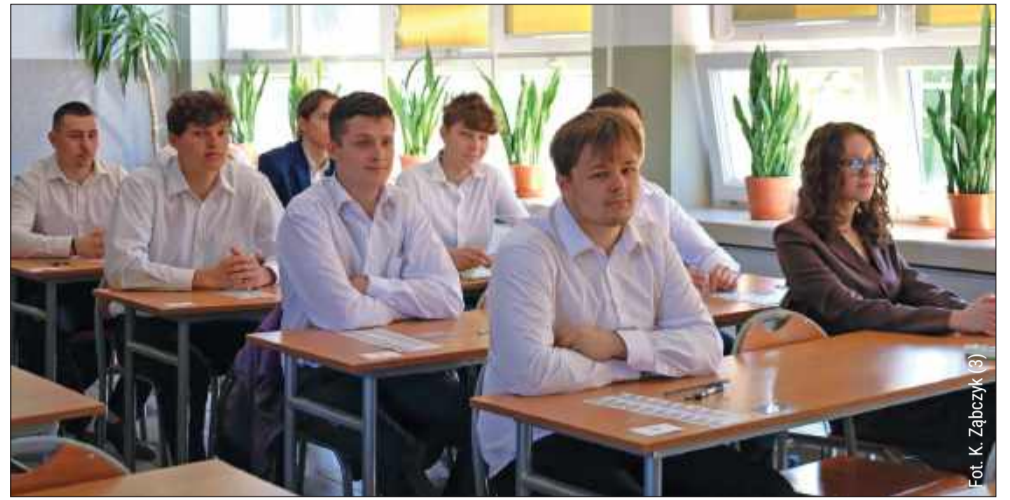
To jeden z najważniejszych egzaminów w życiu.