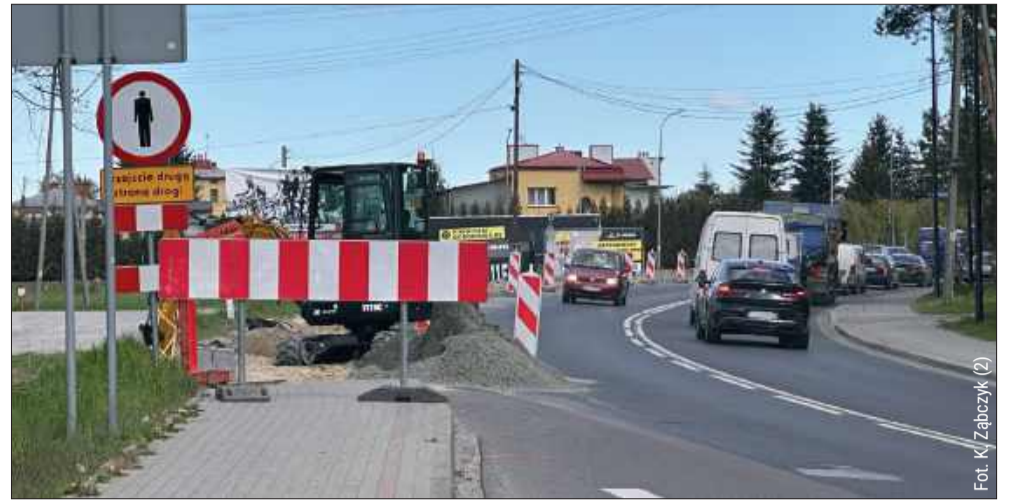
Piesi muszą korzystać z chodnika po przeciwnej stronie.

Najbardziej prawdopodobny scenariusz to wprowadzenie ruchu wahadłowego na tym odcinku krajowej „dziewiątki”, stero-