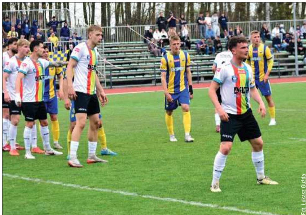
Piłkarze z Kolbuszowej Dolnej postawili się faworytowi.

W drugiej części obraz gry się nie zmienił. Podopieczni