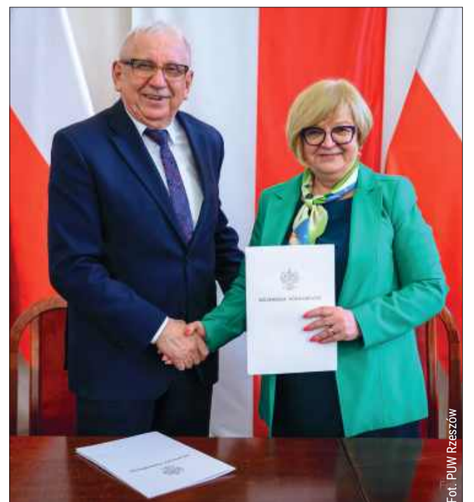
Podpisanie umowy w Podkarpackim Urzędzie Wojewódzkim w Rzeszowie na realizację zadania w ramach Programu Ochrony Ludności i Obrony Cywilnej.