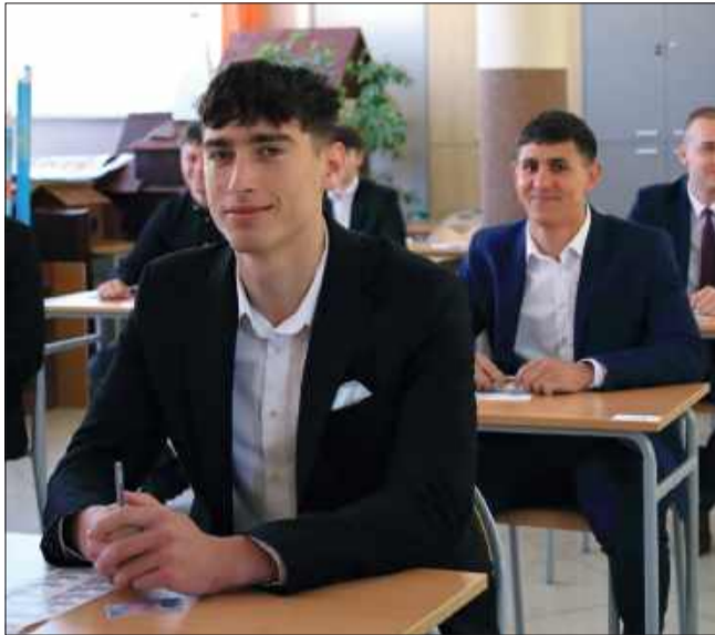
Absolwenci ZST na chwilę przed maturą.

Łącznie daje to 279 maturzystów, którzy w tym roku walczyli o świadectwo dojrzałości.