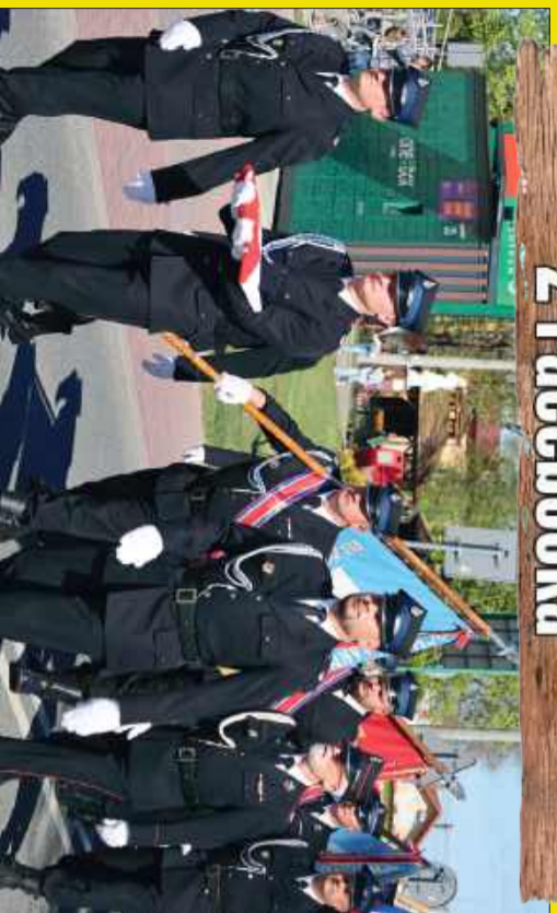
Nagranie z uroczystego przemarszu z okazji 150-lecia OSP w Ranitowie wzbudziło duże zainteresowanie naszych Czytelników. Do obejrzenia na naszym Facebooku.