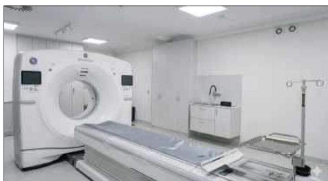
Pierwszy krok do uruchomienia Pracowni Tomografii Komputerowej w Szpitalu Powiatowym w Kolbuszowej został wykonany. Nowoczesny tomograf jest już na miejscu.

Przedsięwzięcie realizowane w Szpitalu Powiatowym w Kolbuszowej dotyczące doposażenia Oddziału Urologii Ogólnej i Onkologicznej, Bloku Operacyjnego oraz jednostek współpracujących w najnowocześniejszy sprzęt medyczny wchodzi w kluczową fazę.