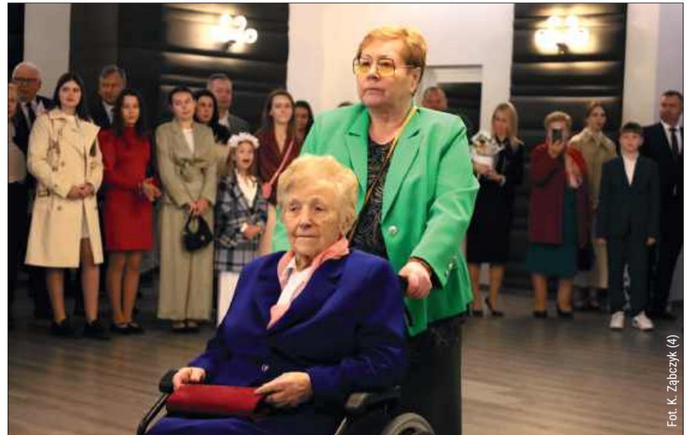
Jubilatce nie brakowało pogody ducha.

W czasie okupacji pracowała u Niemców w gospodarstwie rolnym w Raniszowie. To pokolenie ludzi, którzy nie mieli łatwego życia, ale mimo trudnych doświadczeń potrafili budować coś trwałego dla kolejnych pokoleń.