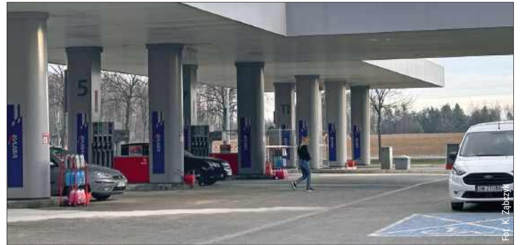
Na jednej ze stacji w Widelce policjanci interweniowali w sprawie kradzieży paliwa.

Jak tłumaczy policjant, pracownicy stacji są zobowiązani zgłosić taki przypadek, bo nie są w stanie ocenić, czy ktoś zrobił to celowo, czy po prostu się zagapił. Najczęściej jednak taka osoba sama wraca po krótkim czasie, kiedy spojrzy na paragon albo zorientuje się, że coś się nie zgadza.