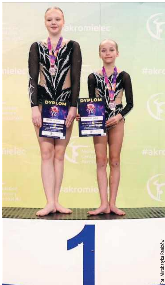
Akrobátky z Raniżowa przywiozły z Mielca worek medali