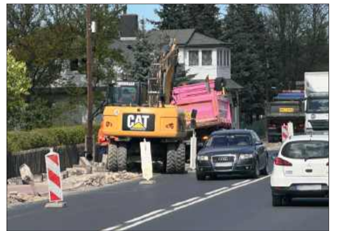
Aktualnie rozbierany jest chodnik.

Jak zapowiada GDDKiA, nocne zamknięcia ronda będą trwały od 6 do 8 godzin. Dla wielu kierowców oznacza to konieczność wcześniejszego planowania trasy i szukania alternatywnych dojazdów.