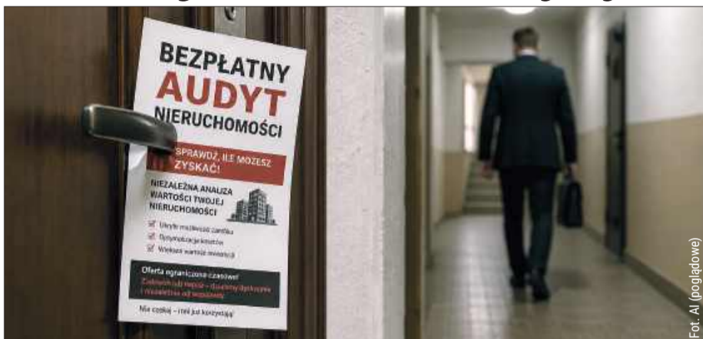
Tak może wyglądać przykładowa ulotka. Nie dajmy się oszukać!

Do mieszkańców trafiają ulotki zachęcające do skorzystania z rzekomo darmowych audytów nieruchomości. Urząd Gminy w Dzikowcu wydał w tej sprawie ważny komunikat i apeluje o ostrożność.