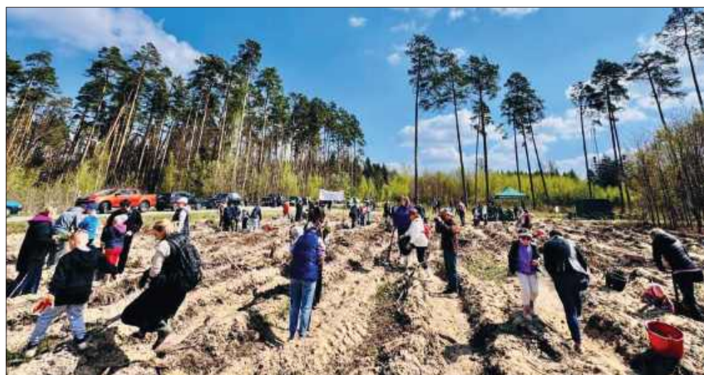
Frekwencja jak co roku dopisała, pogoda również.