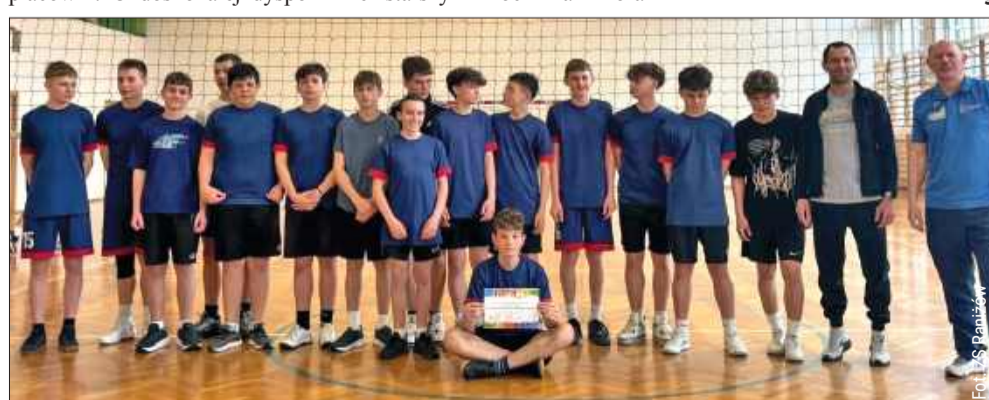
Szkoła z Raniszowa będzie gospodarzem turnieju wojewódzkiego.

Sukces ten jest owocem dwuletnich, rzetelnych treningów. Na ten rezultat złożyły się dodatkowe zajęcia realizowane w ramach ogólnopolskiego programu „Aktywna szkoła”, sparingi ze starszymi rocznikami oraz