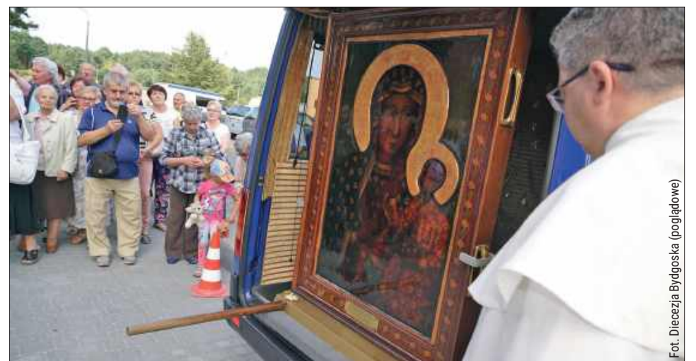
Przygotowania do peregrynacji już trwają.