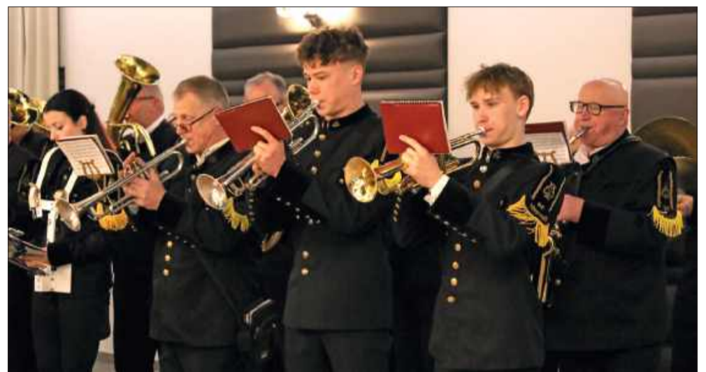
Orkiestra zagrała specjalnie dla 100-latki.