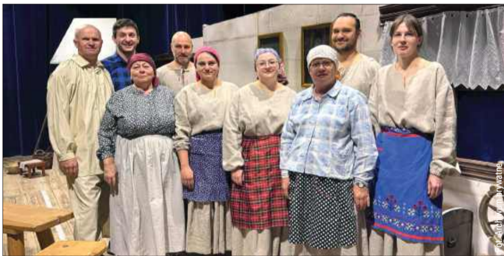
„Górniacy” zaprezentowali się w odświeżonym składzie.

To pokazuje, że nawet stosunkowo niewielkie środki mogą realnie wspierać lokalną aktywność i pozwalać na realizację pomysłów, które bez dofinansowania często musiałyby poczekać. kz