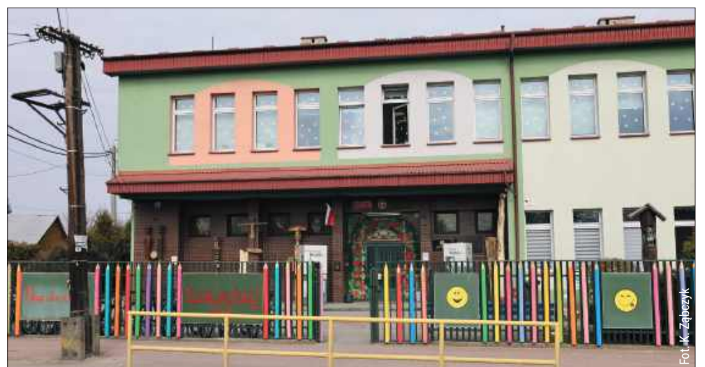
Szkoła znalazła się w ścisłej elicie 30 najlepszych szkół podstawowych na całym Podkarpaciu.