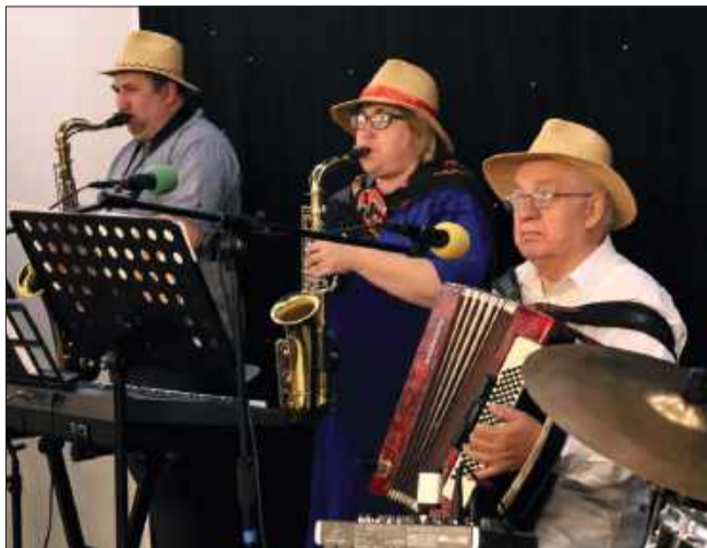
Nie zabrakło też lokalnej kapeli.

Były kwiaty, prezenty, życzenia i mnóstwo uśmiechów. Rodzi-