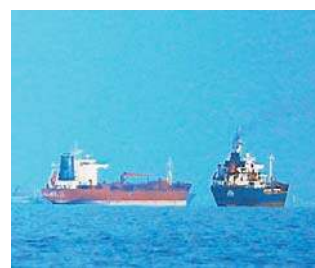
Porty nad Zatoką Perską muszą być dostępne albo dla wszystkich, albo dla nikogo

Rzecznik dodał, że porty nad Zatoką muszą być dostępne albo dla wszystkich, albo dla nikogo. Ostrzegł także,