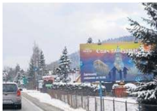
Zniknąć mają wielkie płachty promujące zewnętrzne korporacje czy usługi oddalone o wiele kilometrów

W projekcie przewidziano również wprowadzenie opłaty reklamowej, jednak dotyczyć ona będzie jedynie nośników niestanowiących szyldów. W praktyce, ze względu na rygorystyczne ograniczenia dotyczące lokalizacji takich reklam, możliwości ich legalnego postawienia będą w Zakopanem znikome. Urząd planuje również przeprowadzenie pełnej inwentaryzacji reklam w mieście, jednak nastąpi to dopiero po prawomocnym przyjęciu uchwały przez Radę Miasta.