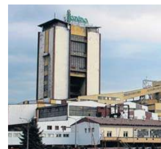
Pogotowie strajkowe ogłoszono w kopalni w Libiążu, w całym Południowym Koncernie i innych spółkach górniczych

Związki domagają się jasnej strategii dla branży. Najbliższe tygodnie będą kluczowe dla rozwoju sytuacji. Zapowiedziano kolejne rozmowy strony rządowej ze związkami zawodowymi na 20 kwietnia. ©