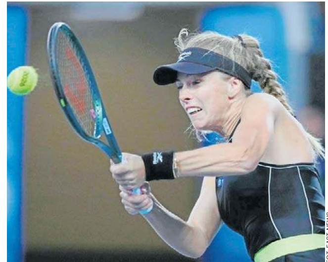
W najnowszym notowaniu światowego rankingu tenisistek Magdalena Fręch utrzymała 39. miejsce