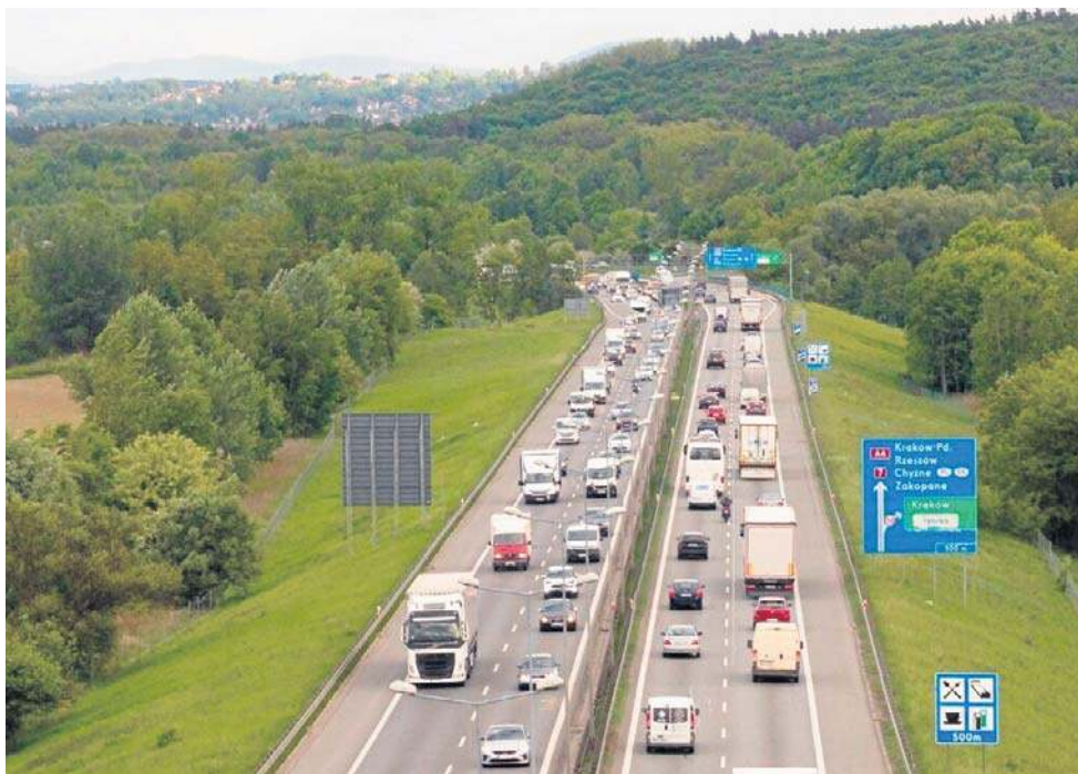
Rozbudowa obwodnicy Krakowa jest niezbędna – z tym wszyscy się zgadzają