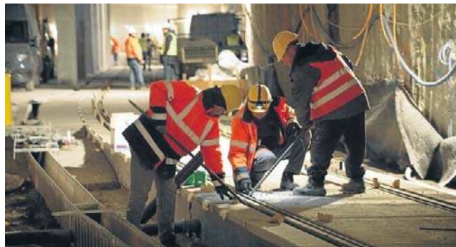
FOT. TRAMWAJ DO MISTRZEJOWIC

Wykonawca linii tramwajowej do Mistrzejowic prowadzi prace wykończeniowe w nowym tunelu pod rondem Polsadu. Linia ma być udostępniona do 30 czerwca 2026 r.