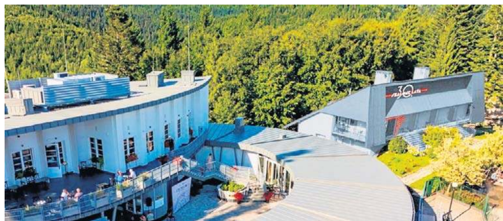
Trwają prace na Górze Parkowej. Nowa atrakcja was zaskoczy