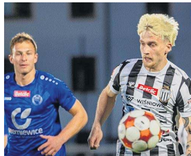
Piłkarze Sandecji Nowy Sącz kolejny raz udowodnili w meczu z Unią w Skiermiewicach, że grają do samego końca

Radość z punktu zmniejsza fakt, że ukarani kartkami Pleśnierowicz i Kasprzak nie zagrają w kolejnym spotkaniu. Powróci za to nieobecny w Skiermiewicach z tego samego powodu Simeon Oure. ©©