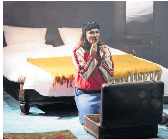
Premiera „Martwych natur” w Starym Teatrze w Krakowie

Hotelowy pokój, w którym urządzane jest miejsce pamięci poświęcone osobie pracującej w nim w czasie II wojny światowej, staje się przestrzenią, gdzie spotykają się przeszłość i teraźniejszość. Pokój zmienia swoje role i tożsamości: bywa miejscem policyjnego śledztwa, planem filmowym, intymną przestrzenią relacji, wnętrzem getta z 1942 roku, wreszcie muzeum ustanowionym przez państwową narrację. Każda z tych odsłon zostawia ślad, każda nadpisuje poprzednią. - Próbujeśmy zdekonstruować to, jak działa obraz - sprawdzamy, jak powstaje i działa. Impulsem były dzienniki Racheli Auerbach z getta warszawskiego, w któ-