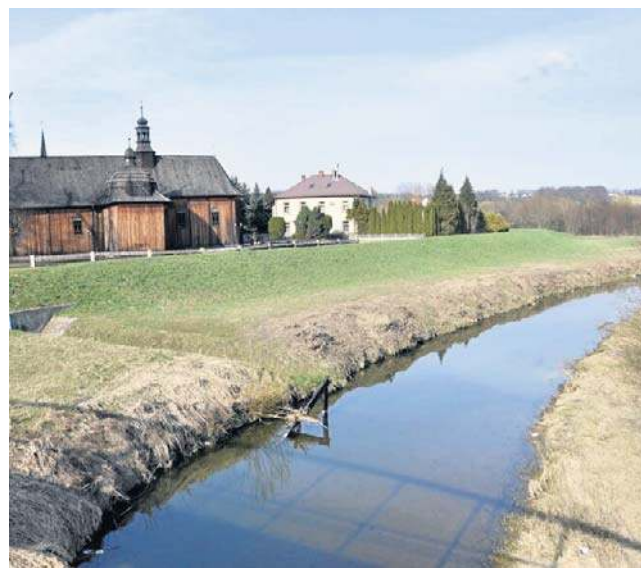
Łapanów. Rzeka Stradomka na co dzień wygląda niepozornie, ale potrafi zmienić się w niszczycielski żywioł