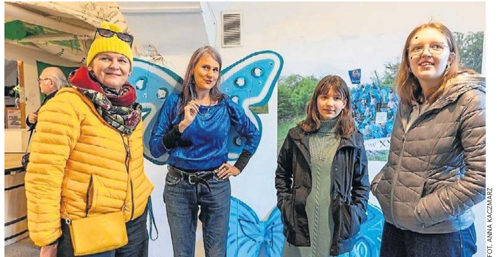
FOT. ANNA KACZMARZ

Kto pamięta, jak na sesję Rady Miasta przyleciał rój motyli? Tak Modraszek Kolektyw w 2011 roku bronił unikatowych owadów z Zakrzówka. W Centrum Sztuki Współczesnej Wiewiórka w Składzie Solnym otwarta została wystawa „Zakrzówek bez cegłówek”. Złożyły się na nią fotografie i filmy dokumentujące happeningi oraz protesty w obronie Zakrzówka. AP