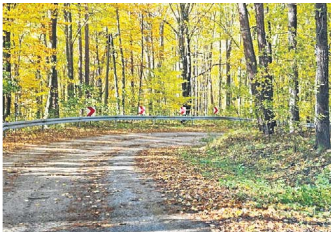
Kręta i stroma droga, prowadząca w kierunku wzgórza pod klasztorem, co roku jest zamykana na okres zimowy

Służby drogowe sukcesywnie usuwają zalegający piasek, jednak - jak podkreślają - cały proces wymaga czasu. Kierowcy i piesi powinni uzbroić się w cierpliwość, zanim wszystkie drogi i chodniki zostaną dokładnie uprzątnięte.