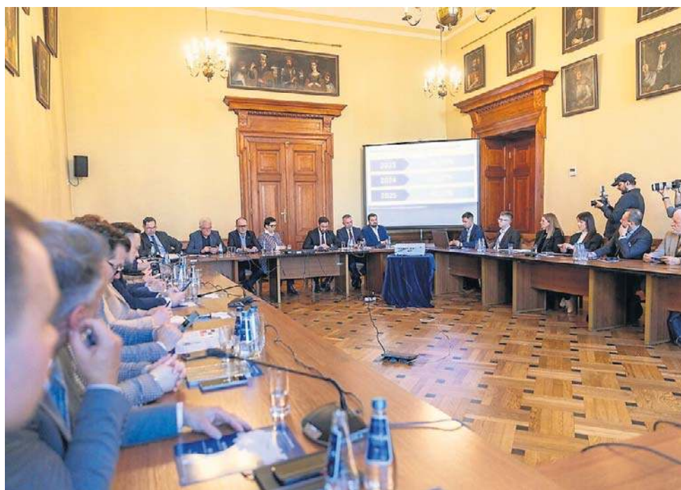
Wyjazdowe posiedzenie sejmowej Komisji Infrastruktury

Parlamentarzystom zaprezentowano też listę zadań kolejowych niezbędnych do realizacji do 2030 roku przez spółkę PKP. Są na niej m.in. dodatkowe tory na linii kolejowej nr 8 w kierunku Warszawy, budowa bezkolizyjnej łącznicy na Żabińcu