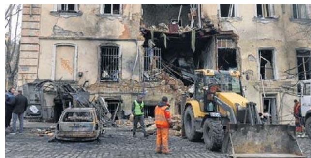
W nocy z poniedziałku na wtorek armia rosyjska użyła w atakach 34 rakiet i 392 dronów

Według wstępnych informacji armia rosyjska wykorzystała do ataku dron typu FPV,