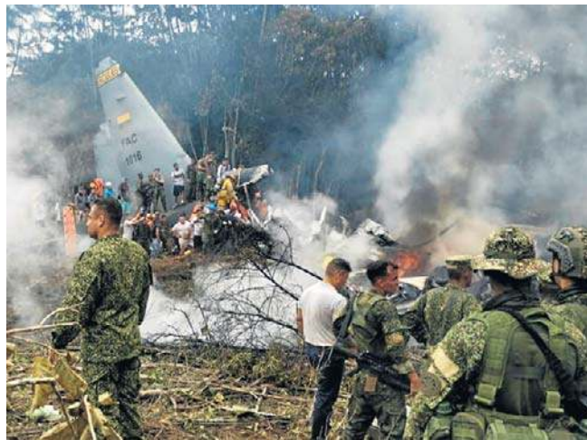
Do katastrofy doszło wkrótce po starcie samolotu z lotniska w Puerto Leguizamo