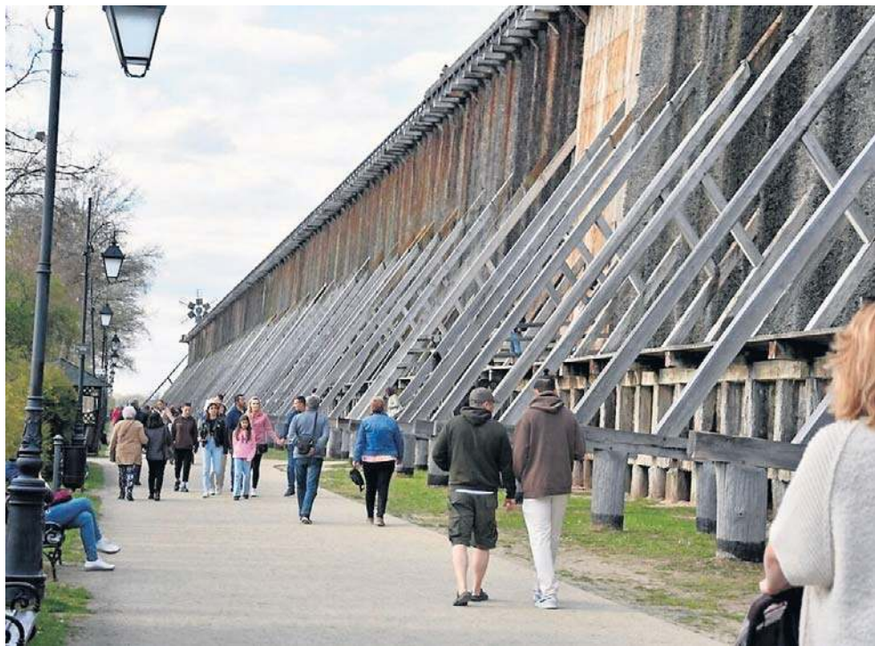
Kuracjusze często rezygnują z wymarzonego pobytu w sanatorium

W przypadku rezygnacji ze skierowania na leczenie uzdrowskie należy w trybie natychmiastowym pisemnie powiadomić o tym fakcie NFZ oraz odesłać oryginał skierowania. Ocena zasadności rezygnacji dokonana zostanie na podstawie pisemnego i udokumentowanego uzasadnienia pacjenta oraz przedstawionej dokumentacji medycznej. Nieuzasadniony bądź nieudokumentowany zwrot skierowania na leczenie uzdrowskie będzie traktowany jako rezygnacja z leczenia.