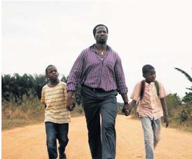
W Kinie Pod Baranami zobaczymy m.in. film „W cieniu mojego ojca”