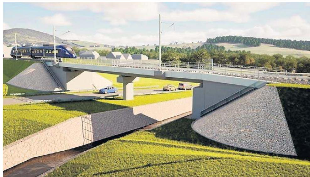
Tak będzie wyglądał nowy most kolejowy w przysiółku Fornale w Kasinie Wielkiej (wizualizacja)

Dzięki budowie nowego odcinka linii, który połączy Kraków ze zmodernizowanymi odcinkami linii 104 do Zakopanego i Nowego Sącza, znacznie skróci się czas przejazdu do stolicy województwa. Samorządowcy i mieszkańcy liczą na rozwój gospodarczy i społeczny, a także zwiększenie atrakcyjności turystycznej Sądecczyzny i Limanowszczyzny. Po zakończeniu prac najszybsze pociągi dojadą z Krakowa do Nowego Sącza w około 60 minut, do Limanowej w ok. 40 minut, a do Zakopanego w 90 minut.