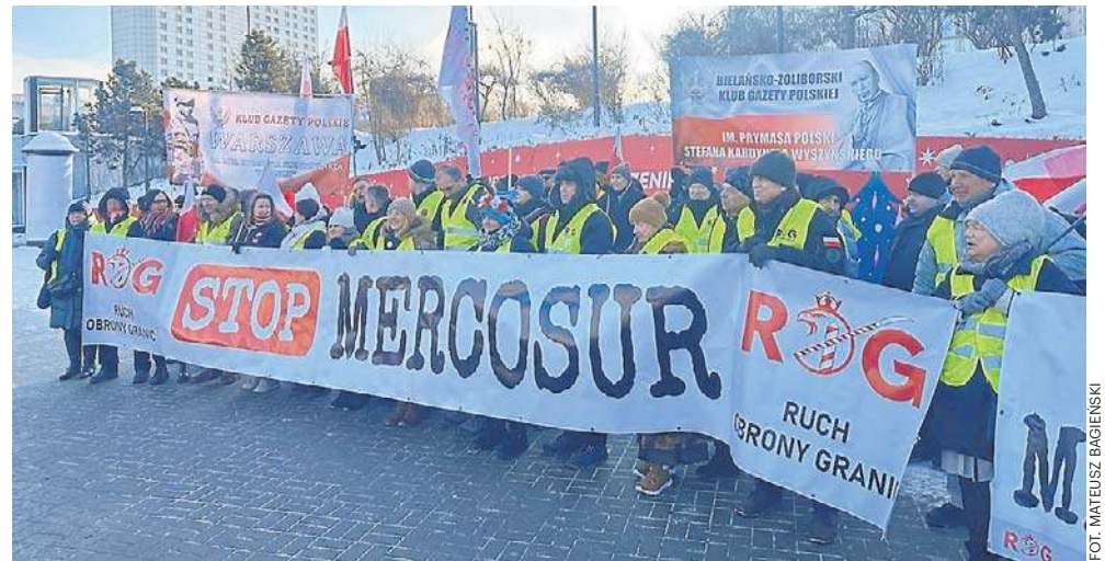
Do zatwierdzenia umowy doszło mimo protestów rolników w całej Europie, w tym w Polsce

W tym przypadku potrzebna będzie ratyfikacja Parlamentu Europejskiego i państw członkowskich. Parlament Europejski z powodu stwierdzo-