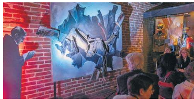
„Kłęska wrześniowa” Tadeusza Kantora w Muzeum Armii Krajowej

Wymowne dzieło przedstawia polskiego żołnierza rozpiętego krzyżu. Tłem jest mapa II Rzeczypospolitej, rozdarta przez dwóch najeźdźców - hitlerowskie Niemcy i sowiecką Rosję.