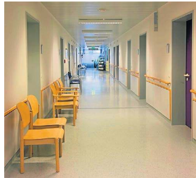
Niepojawienie się pacjenta na umówionej wizycie to zmosfera wielu placówek medycznych

Należy pisemnie (listownie lub przez e-mail) powiadomić oddział wojewódzki NFZ o rezygnacji z pobytu w sanatorium. Trzeba też podać uzasadnienie. NFZ jako dobre uzasadnienie uznaje: ● chorobę i pobyt w szpitalu, ● nagłe wypadki losowe, nieprzewidziane w chwili składania wniosku o leczenie sanatoryjne (ślub, pogrzeb).