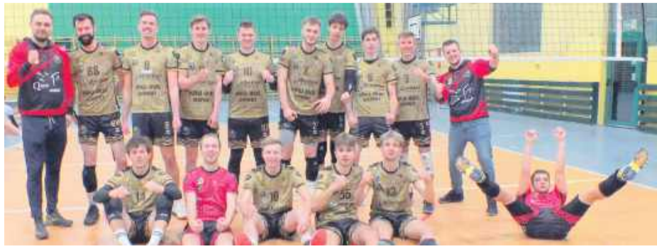
Siatkarze ze Strzelina wywalczyli trzecie miejsce