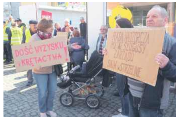
W proteście wzięło udział ponad 60 osób