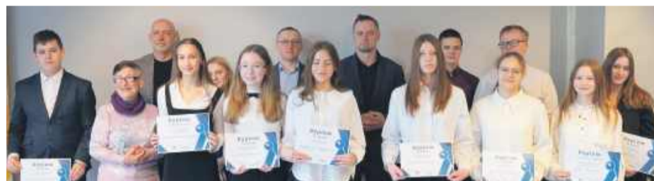
Laureaci konkursu w kategorii uczniów kl. VII-VIII.