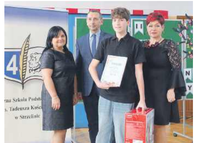
Jeden z ponad 25 laureatów odbierający dyplom i nagrodę od sekretarza gminy i organizatorów konkursu

byłaby możliwa bez wsparcia instytucji i sponsorów wydarzenia. Nagrody dla uczestników ufundowali: