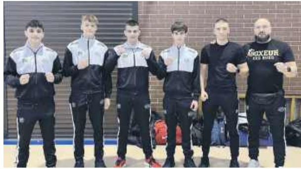
Pięściarze ze Strzelina podczas Mistrzostw Dolnego Śląska

Wróciła z tych prestiżowych zawodów z medalami!