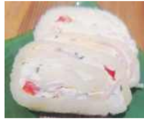
Rolada świetnie sprawdzi się jako przystawka na wiele okazji

Ser, najlepiej w oryginalnym foliowym opakowaniu (jeśli