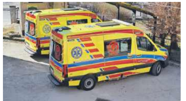
Nowy ambulans (widoczny na pierwszym planie) będzie służył strzelińskim ratownikom medycznym

ją więc dwoma pojazdami, spełniającymi wszystkie najnowsze standardy. MZ