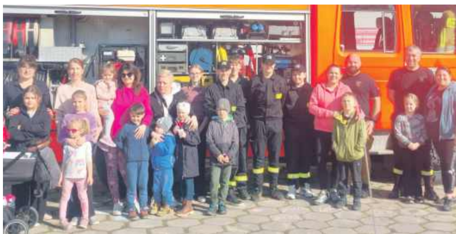
Druhowie z Ochotniczej Straży Pożarnej w Jegłowej zaprezentowali dzieciom wóz bojowy