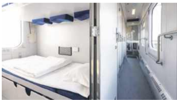
Od połowy kwietnia pasażerowie pociągu Baltic Express będą mogli skorzystać z wagonu sypialnego

Dziękuję za rozmowę. Wojciech Cerkowniak