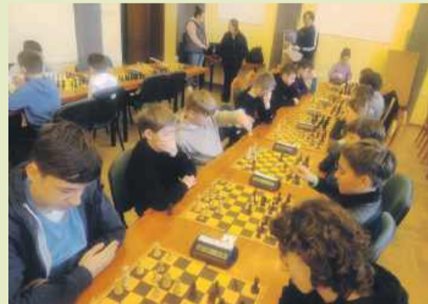
Do rywalizacji przystąpiło blisko stu uczniów z powiatu strzelińskiego