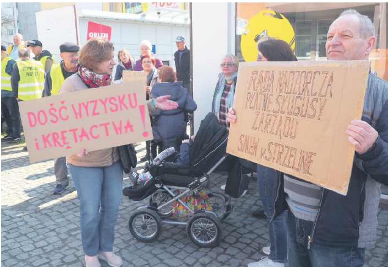
W proteście pod siedzibą spółdzielni mieszkaniowej w Strzelinie wzięło udział około 60 osób

Ponad 60 osób wzięło udział w pikiecie pod spółdzielnią mieszkaniową przy ulicy Kościuszki w Strzelinie. Lokatorzy zarzucają kierownictwu arogancję i nierozliczanie się z faktur za wodę. Zarząd ma utrudniać też dostęp do kotłowni i stanu liczników. To nie koniec.