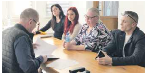
W posiedzeniu Komisji Skarg, Wniosków i Petycji uczestniczyli rodzice dzieci, uczęszczających do Szkoły Podstawowej w Wawrzyszowie