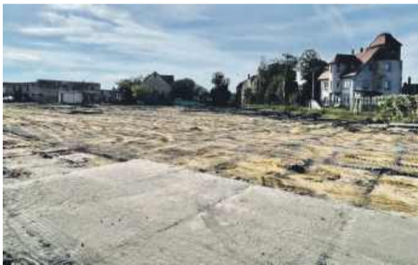
Trwa postępowanie, dotyczące wydania decyzji środowiskowej, o którą wystąpiła firma Orlen na działce przy ul. Strzelińskiej w Wiązowie

szef gminy. Wygląda więc na to, że zagospodarowanie placu staje się coraz bardziej realne. Oczywiście, budowa stacji paliw będzie możliwa po wypełnieniu wszystkich formalności. MZ