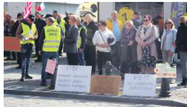
Pikieta pod spółdzielnią przy ulicy Kościuszki w Strzelinie

wyodrębnionych wspólnot. W budynkach administrowanych przez wspólnoty, zarządy powoływane są przez mieszkańców budynku. Wszystkie gromadzone pieniądze przeznaczone są na konkretny blok. W budynkach administrowanych