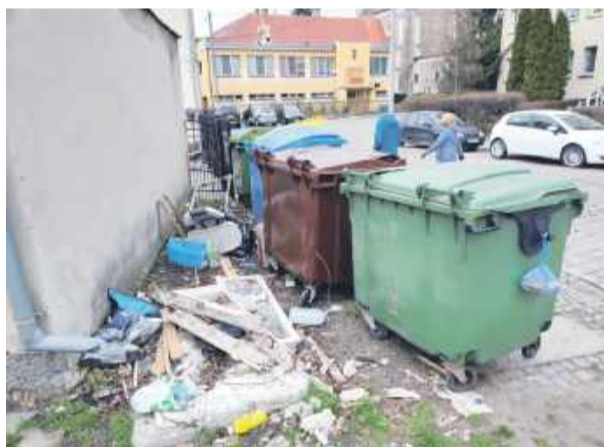
Tak od wielu dni wygląda miejsce obok śmietników przy ul. Floriana w Strzelinie