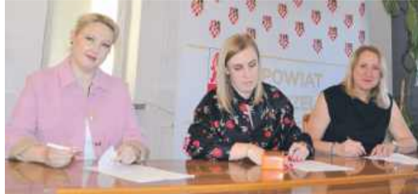
Powiat strzeleński podpisał umowy na wsparcie inicjatyw kulturalnych, muzycznych i sportowych.