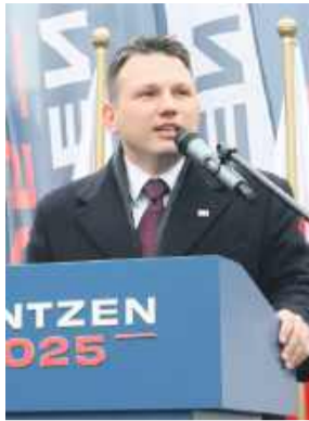
Kandydat Konfederacji na prezydenta Sławomir Mentzen spotka się z mieszkańcami powiatu strzeleńskiego.

„Są chwile i ludzie, których się nie zapomina”