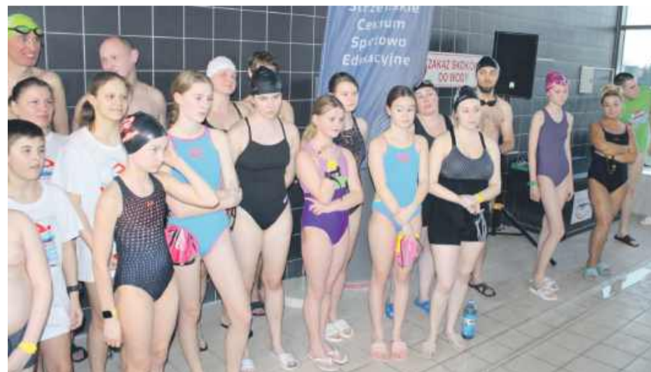
Łącznie na strzelińskiej pływalni uczestnicy przepłynęli 391,25 km