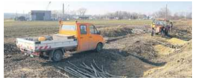
Kilka tygodni temu rozpoczęły się prace związane z budową ścieżki rowerowej. Krzaki, chwasty i jednoroczne samosiewy zostały już wykarczowane.

Zaplanowana trasa rowerowa o nawierzchni bitumicznej rozpoczyna swój przebieg od ulicy Oławskiej (istniejącego ciągu pieszo-rowerowego Strzelin-Chociwel) w kierunku Krzpic i przebiega w ciągu nieczynnej linii kolejowej. MZ