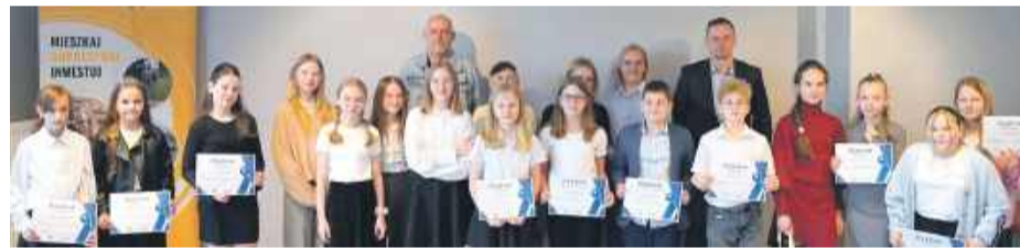
Laureaci konkursu w kategorii uczniów kl. IV-VI.