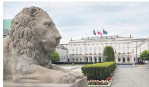
Wybory coraz bliżej, a kampania kandydatów do objęcia najważniejszego urzędu w Polsce trwa.

wiadomo kogo. Skoro ma rządzić Polską, to powinien myśleć o Polakach i mieć bezkonfliktowe układy z sąsiadami. Słuchać, co do powiedzenia mają obywatele. W jego gestii powinno być również rozwiązywanie różnych konfliktów społecznych. Jeszcze nie mamy swojego kandydata, ale na wybory z pewnością pójdziemy.