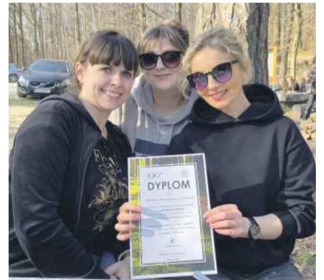
Uczestnicy akcji otrzymali pamiątkowe dyplomy.