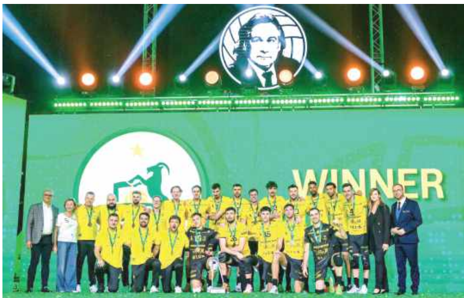
W Lublinie rozegrano Bogdanka Volley Cup im. Tomasza Wójtowicza!

W sobotę, 11 i niedzielę, 12 października w hali Globus odbył się Bogdanka Volley Cup im. Tomasza Wójtowicza, legendarnego siatkarza, którego imieniem nazwana jest również lubelska hala. Zmagania w sobotę otworzyli siatkarze Bogdanki LUK Lublin i JSW Jastrzębskiego Węgla. Lepszy w tym spotkaniu okazali się