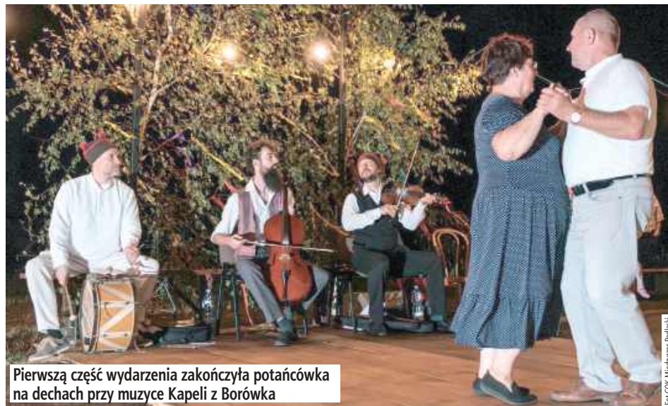
Pierwszą część wydarzenia zakończyła potańcówka na dechach przy muzyce Kapeli z Borówka

Po południu można było zwiedzić pałacowe wnętrza z przewod-