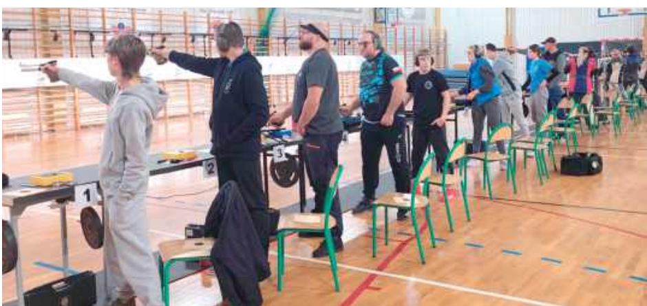
Zawody zorganizował Klub Sportowy „VIS” Międzyrzec Podlaski, a odbywały się one w hali sportowej Szkoły Podstawowej im. Unitów Drelowskich w Drelowie

Kolejnym znaczącym punktem w kalendarzu będą Ogólnopolskie Zawody Strzeleckie o Puchar Międzyrzeczy, zaplanowane na 26 października w nowo otwartej hali widowiskowo-sportowej MOK w Międzyrzec Podlaskim. Organizatorzy przewidują udział 150–170 zawodników, w tym