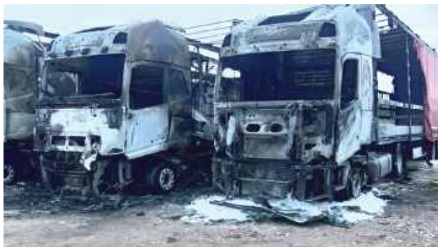
Według krewnego właściciela firmy pożar zaczął się od dwóch skrajnych ciężarówek. Jest pewien, że to było podpalenie

- To był dorobek życia, który właściciel budował latami razem z trzema braćmi i dwoma bratanekami, kierowcami pomagającymi w prowadzeniu firmy. Na szczęście ogień nie zajął pobl-