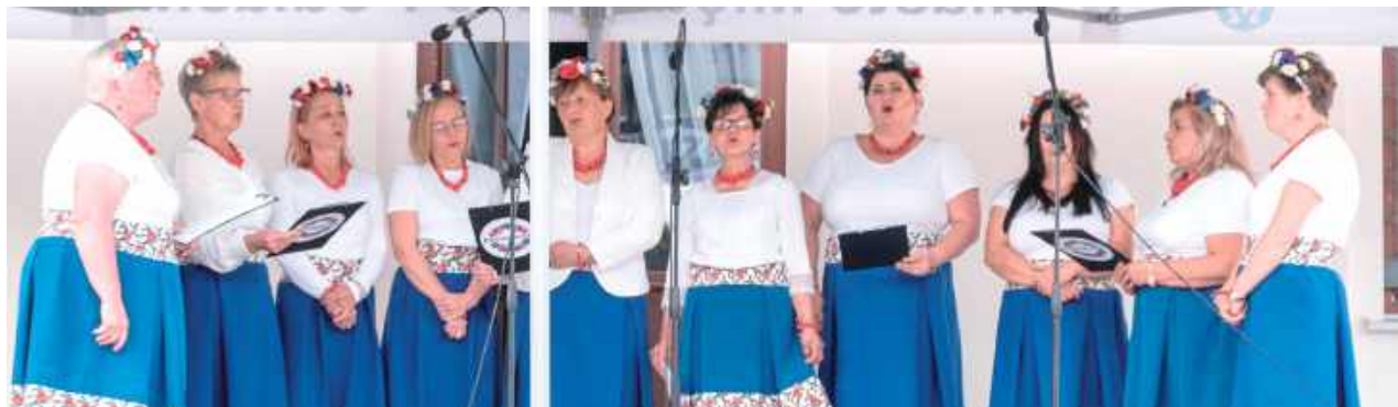
Na scenie nie mogło zabraknąć Łuniewianek, które zaprezentowały pieśni bojarskie