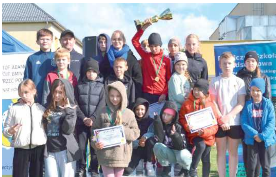
Pierwsze miejsce w klasyfikacji drużynowej zajęła Publiczna Szkoła Podstawowa w Tulitowie