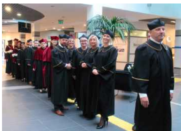
Chwila czekana na paradne wejście władz na aulę uczelni

W szczególnym roku 25-lecia Akademii Bialskiej im. Jana Pawła II klasyczne, czarne togi akademickie i birety przydadzą się wielokrotnie. Przed miesiącem zostały użyte podczas jubileuszu 25-lecia Akademii Bialskiej.