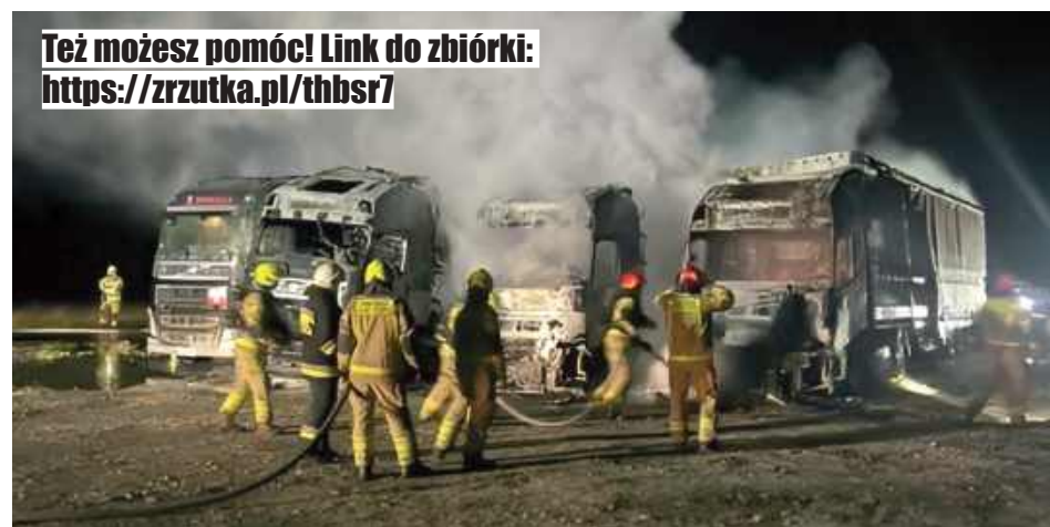
Też możesz pomóc! Link do zbiórki: https://zrzutka.pl/thbsr7