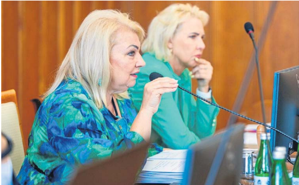
Najdłuższa debata sesji dotyczyła dwóch filii Wojewódzkiej i Miejskiej Biblioteki Publicznej im. dr. Witolda Bełzy w Bydgoszczy