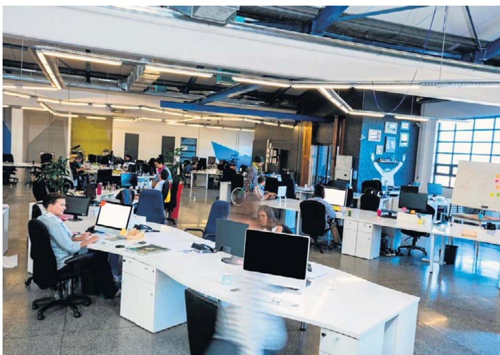
Przedsiębiorcy w badaniu wskazali, że produktywność ich firm ograniczają przede wszystkim problemy kadrowe

- Przez lata optymalizacja oznaczała przede wszystkim redukcję kosztów. Ten model się wyczerpuje, coraz częściej widać, że dalsze cięcia nie zwiększają efektywności, ale obniżają stabilność firm i jakość