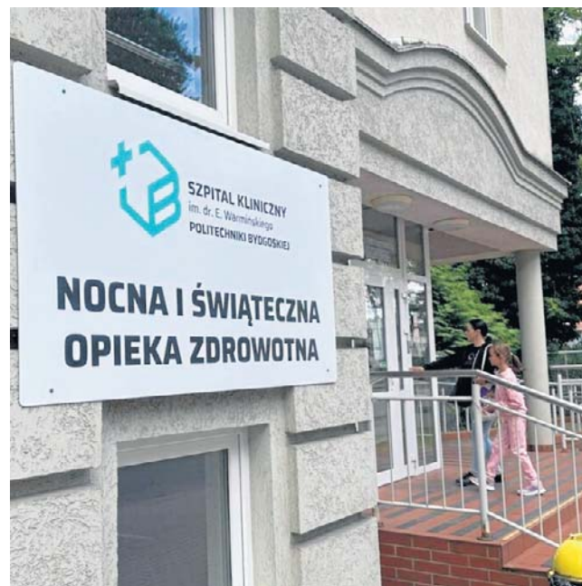
Szpital Kliniczny PBŚ pozyskał z Ministerstwa Zdrowia grant w wysokości ponad 690 tysięcy złotych

Szpital zakupi też ponad 30 kozetek z elektryczną regulacją wysokości, specjalistyczny fotel ginekologiczny dostosowany do potrzeb pacjentek z niepełnosprawnościami oraz bariatrycznych, fotel urologiczny z regulowaną wysokością, wózek inwalidzki, wózek dla pacjentów bariatrycznych, skanery żył, wagę najazdową dla osób poruszających się na wózkach, a także podnośnik podłogowy służący do bezpiecznego podnoszenia i transferu osób z ograniczoną sprawnością ruchową.