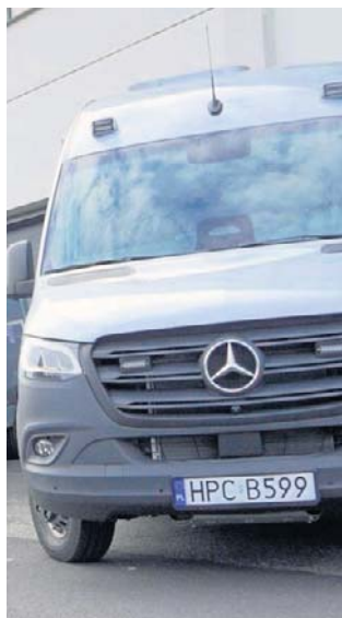
Nowe policyjne „wieźniarki” w bydgoskiej policji

Zakup nowoczesnego sprzętu transportowego jest kolejnym elementem procesu modernizacji policji. ©