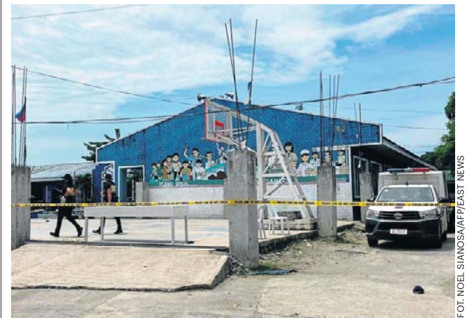
Do szkoły wysłano dodatkowe siły policyjne, aby zapewnić bezpieczeństwo uczniom i pracownikom