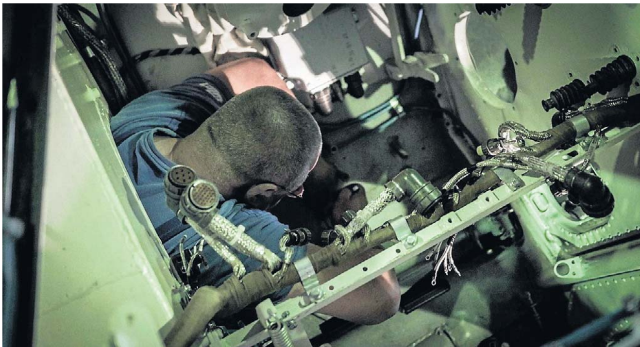
Pracowników na różne stanowiska szuka obecnie PIT-Radwar

Wygląda na to, że popyt na pracowników będzie tylko rósł. Na stronach PGZ znajdziemy obecnie 219 aktywnych ofert pracy. W tym wiele dla