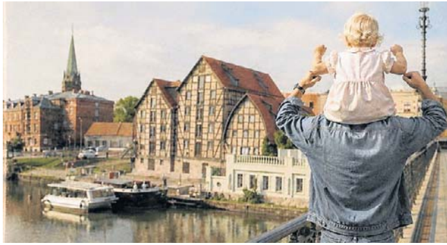
Z okazji Dnia Ojca dziennikarki „Expressu Bydgoskiego” wracają do swoich wspomnień związanych z ojcami

Dla mnie takim miejscem jest giełda samochodowa. Motoryzacja zawsze była pasją mojego taty, dlatego właśnie ona najmocniej kojarzy mi się ze wspólnie spędzonym cza-