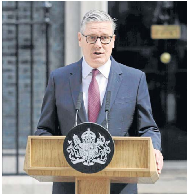
Premier Wielkiej Brytanii Keir Starmer spotkał się z mediami przy Downing Street 10. Oświadczył, że pozostanie szefem rządu do czasu wyłonienia jego następcy

Wcześniej Starmer podsumował swoje osiągnięcia, prze-