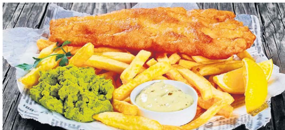
Smażalnie kuszą ofertą, ale niektóre ryby mogą być mrożone

Wrzecz z końcem maja skończył się okres ochronny sandacza, wędkarze mogą go bez przeszkód łowić. Choć nie jest to ryba morska, można ją dostać w nadbałtyckich knajpach. Rybacy pozyskują ją z okolicznych wód śródlądowych. W sierpniu