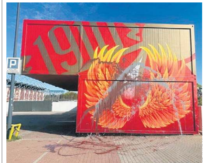
Tak wygląda nowy sklep Widzewa. Kontenerowy punkt sprzedaży przed stadionem oblano farbą