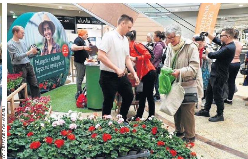
W sobotę w Galerii Łódzkiej można było dostać wiosenne kwiatki w zamian za elektrośmieci

Organizatorzy podkreślają, że akcja ma nie tylko wymiar praktyczny, lecz także edukacyjny.