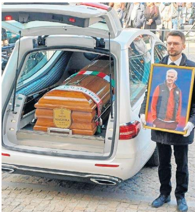
Samochód z trumną podjechał pod wejście do katedry

Po odejściu z Rakowa Jacek Magiera przez dziewięć lat reprezentował Legię Warszawa. W 1997 roku zdobył z nią Puchar Polski i wicemistrzostwo kraju, w kolejnym roku Superpuchar Polski. Potem grał m.in. w Widzewie Łódź i Cracovii. Pracę trenerską zaczynał jako