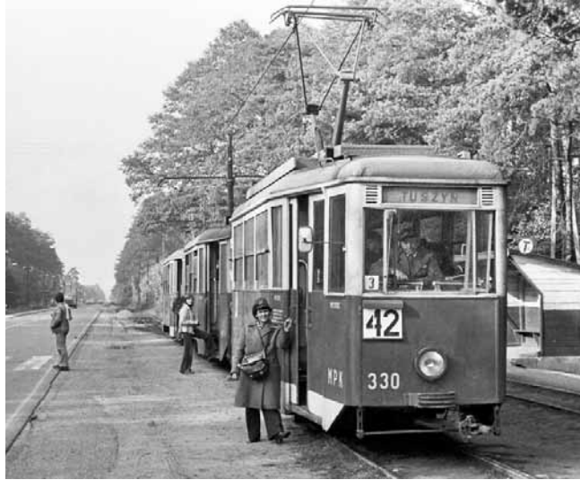
Ostatni tramwaj do Tuszyna - czerwiec 1978

Linia do Rudy była najkrótszą z podmiejskich tras, tymczasem niewiele dalej znajdowały się dwa duże ośrodki miejskie - Rzgów i Tuszyn, które mogły dostarczyć kolejnych robotników łódzkim fa-