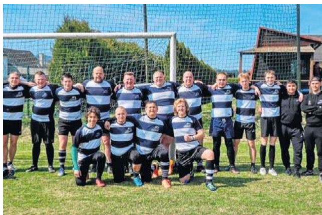
Drużyna Cedrus Sroki Łódź ucieszyła swojego nowego sponsora i świetnie zaprezentowała się w Czechach