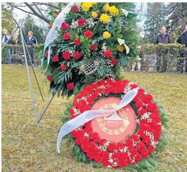
Piękny wieniec z herbem Widzewa Łódź. Liczna delegacja klubu żegnała zmarłego