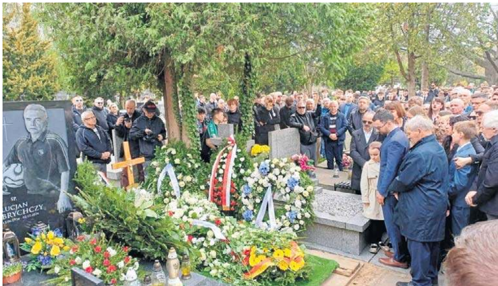
Jacek Magiera spoczął na Cmentarzu Wojskowym na Powązkach. Został pochowany obok grobu Lucjana Brychczego byłego reprezentanta Polski i legendy Legii