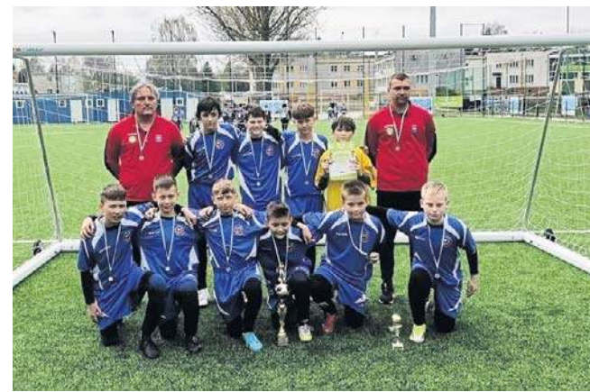
W kategorii U12 w finale w Pabianicach wygrali chłopcy z SP Dłutów