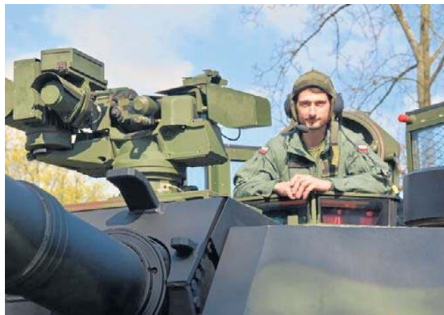
W Sieradzu odbyły się Wojskowe Targi Służby i Pracy. Można było zapoznać się ze specyfiką pracy w wojsku

- To bardzo ważne przedsięwzięcie dla całego województwa łódzkiego i sił zbrojnych naszego regionu - mówi płk Łukasz Łącki z 15. Sieradzkiej Brygady Łączności. - Przygotowaliśmy się pod kątem wszystkich mieszkańców województwa łódzkiego tłumnie się stawili.