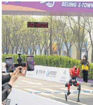
Robot humanoidalny Shandian zdecydowanie pokonał ludzi w pekińskim półmaratonie

Rezultat zwycięskiego robota wskazuje na skokowy postęp technologiczny pod wzglę-