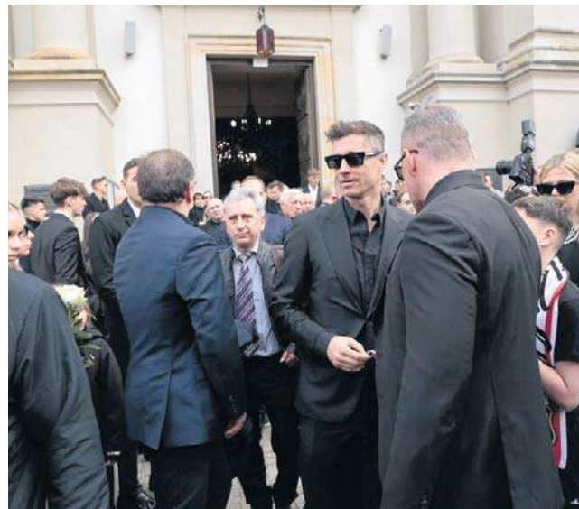
Na pogrzebie pojawił się piłkarz reprezentacji Polski i FC Barcelona Robert Lewandowski