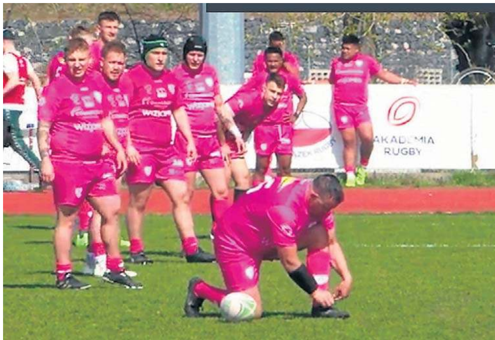
Do kolejnej akcji przygotowują się rugbiści drużyny Wizja Med Grot Budowlani Łódź

Gospodarze nie zamierzali się jednak poddawać. Zaliczyli przyłożenie i podwyższenie i zmniejszyli przewagę Ło-