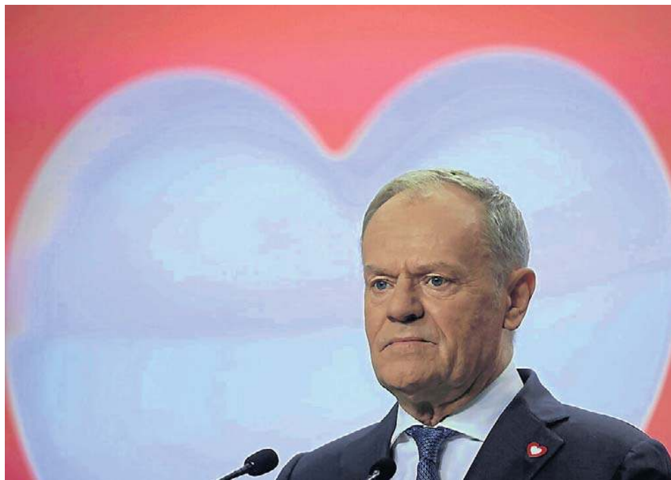
Konarski: Tuska i Magyara dzieli różnica wieku, ale ich pomysły na politykę jest bardzo podobny

On ma charakter amalgamatu politycznego. W jego skład wchodzi różnego rodzaju elementy ideologiczne, także lewicowe - to jeden z powodów praktycznego zaniku dawnych socjalistów. Sam skrót TISZA rozszyfruje się jako Partia Szacunku i Wolności. Już ta nazwa to inteligentne odwołanie się do aspiracji Węgrów jako społeczeństwa. Węgrzy po prostu nie chcieli być identyfikowani z państwem,