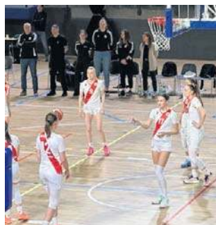
Fragment derbowego meczu koszykarek