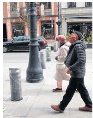
Słupki na Piotrkowskiej - jednych wkurzają, inni je chwala...

zydentem Tomaszem Piotrowskim i urzędnikami odpowiedzialnymi za projekt oraz montaż słupków radni podnieśli wiele wątpliwości pod adresem przyjętych rozwiązań. Pytano m.in. o to, czy