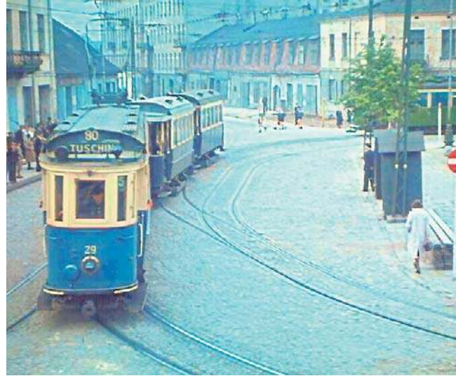
Komunikacja tramwajowa na trasie Łódź - Rzgów - Tuszyn zmieniała się na przestrzeni lat

Parowe lokomotywy od początku sprawiały sporo kłopotów. Przy torach często wybuchaly pożary traw i lasów, a po roku eksploatacji doszło do prawdziwej tragedii. Prawdopodobnie od iskry z komina parowozu 20 czerwca 1917 roku w Rzgowie doszło do pożaru o niespotykanej skali. Tak opisywała to ówczesna prasa łódzka: „O godzinie wpół do szóstej po południu, zaraz po przejściu przez Rzgów pociągu podjazdowej kolejki podmiejskiej [...] wybuchł ogień w domu przy ulicy Tuszyńskiej. Ogień wybuchł z żywiołową siłą, roznosząc snopy iskier i płonących żagwi [...] zaczęły się palić domy przy rynku [...] starożytny kościół katolicki, oraz z drugiej strony rynku poczęły się palić gmach, w którym mieści się rzgowski sąd gminny. Pożar szalał przez całą noc. Dokładny obraz zniszczeń nie da się od razu objąć w całej rozciągłości, oprócz zgłiszcz przy rynku cała prawa połowa Rzgowa, ja-