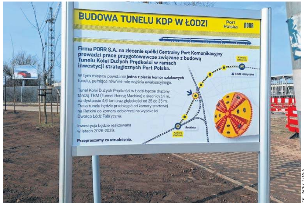
Budowa obok Atlas Areny to część wielkiego przedsięwzięcia, jakim jest Kolej Dużych Prędkości w Polsce

Diabeł tkwi w szczegółach - tak można by podsumować tę dyskusję. Radni w zdecydowanej większości są za uporządkowaniem ruchu na Piotrkowskiej, a dokładniej jego zminimalizowaniem. Ale co do sposobu nie ma jedności. Na spotkaniu z wicepre-