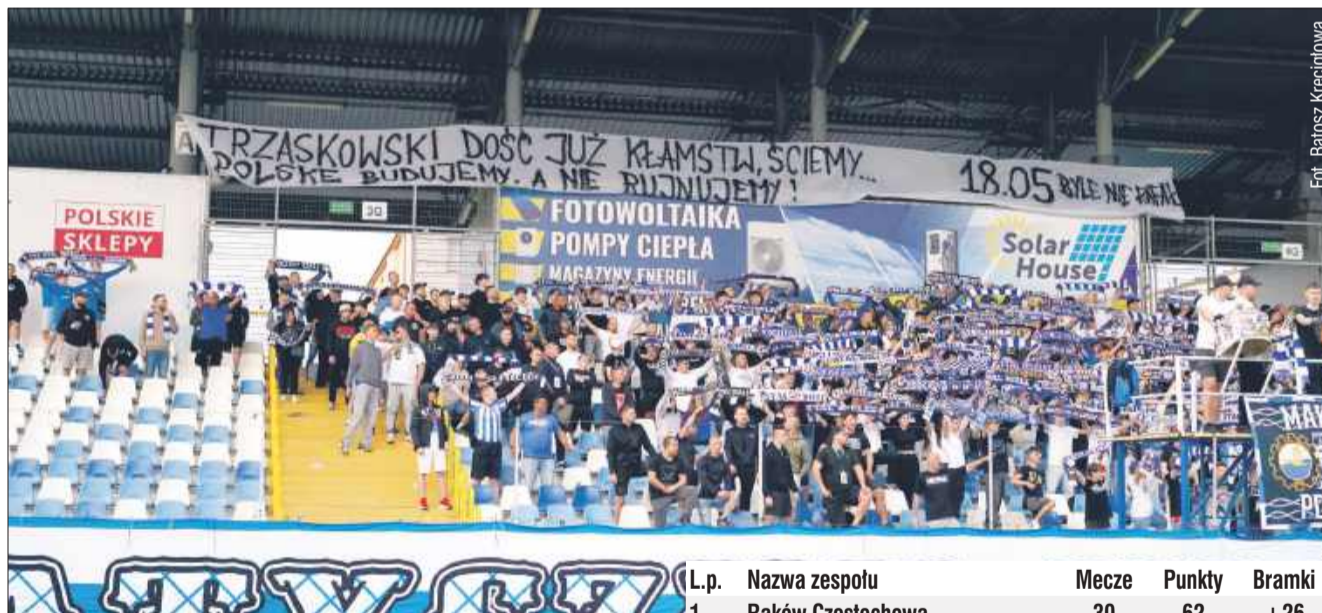
Z trybun spotkanie oglądało 4943 osoby.