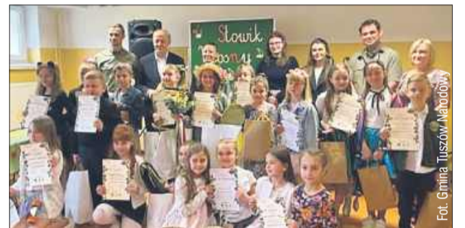
Fot. Gmina Tuszów Narodowy