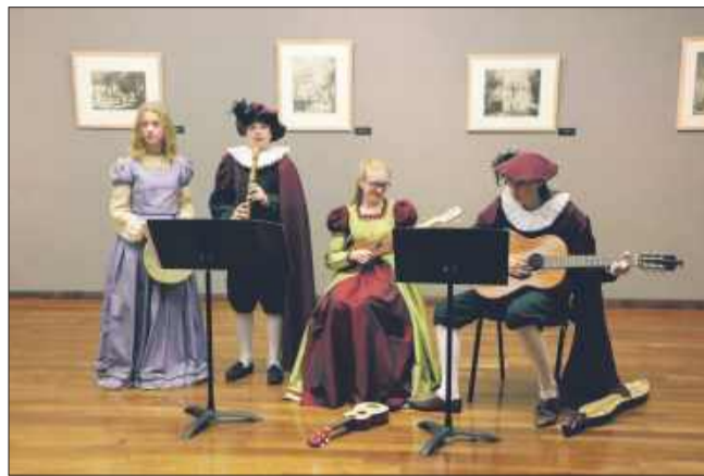
Wydarzenie zainaugurował koncert Zespołu Muzyki Dawnej Hortus Musicus.

Wystawa w Galerii ESCEK prezentuje Rembrandta w jego mniej znanej, ale równie mistrzowskiej odsłonie – jako grafika. Akwaforty zgromadzone na ekspozycji ukazują różnorodne oblicza holenderskiego artysty: od intymnych portretów, przez pejzaże i scenki rodzajowe, aż po poruszające