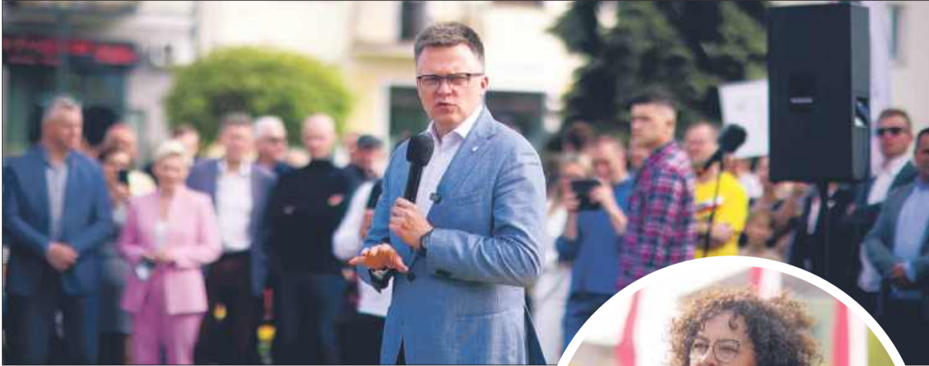
Szymon Hołownia podczas przemówienia na mieleckim rynku.

Szymon Hołownia, kandydat na prezydenta RP, odwiedził Mielec we wtorek, 22 kwietnia. W ramach wizyty zorganizował briefing prasowy, a następnie spotkał się z mieszkańcami na miejskim rynku, gdzie przedstawił założenia swojego programu oraz odpowiedział na pytania zebranych.