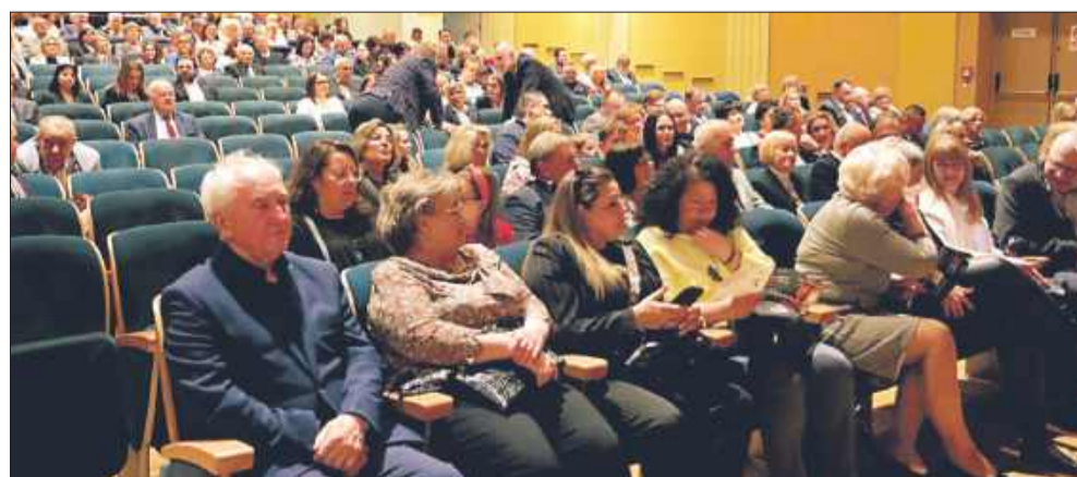
Sala widowiskowa Domu Kultury SCK w Mielcu wypełniła się po brzegi.