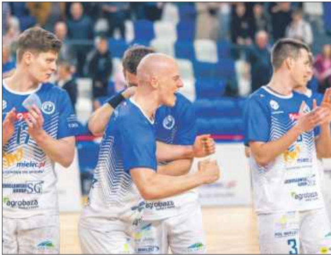
Mieleccy szczypiornicy mają aż 21 punktów przewagi nad drugą drużyną

Pierwsze trafienie meczu padło ze strony gospodarzy, a początkowe minuty były bar-