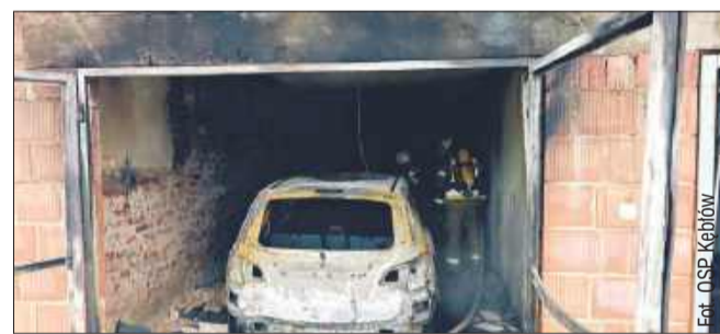
W wyniku pożaru całkowitemu spaleniemu uległ samochód osobowy.

W wyniku pożaru całkowitemu spaleniemu uległ samochód