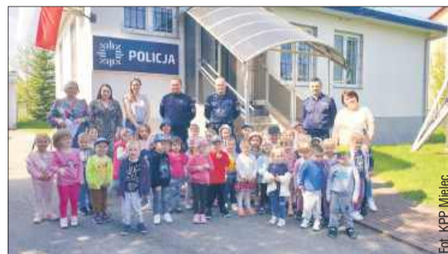
Nie zabrakło pamiątkowych zdjęć.

Posterunek Policji w Wadowicach Górnych odwiedziły dzieci z przedszkola w Wadowicach Górnych. Mali goście mieli okazję z bliska przyjrzeć się pracy policjantów, poznać ich codzienne obowiązki oraz dowiedzieć się, jak dbać o swoje bezpieczeństwo.