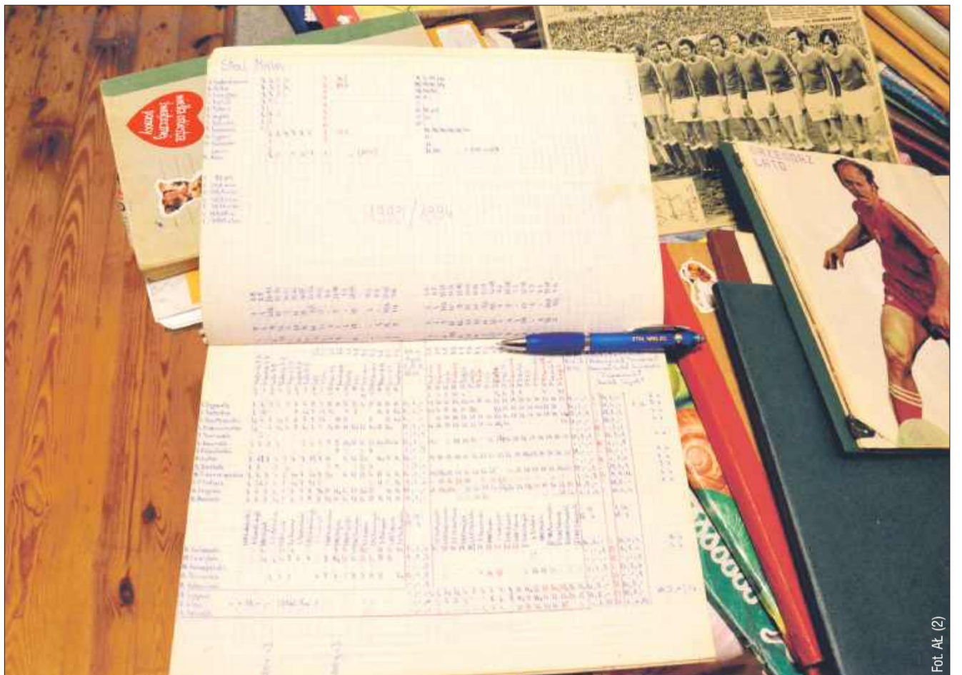
To jeden z przykładowych zapisów, jakie znajdowały się w 43 zeszytach.

Czasem miewam takie chwile zwątpienia. Siadę nad zeszytem, to czasem myślę, że dzisiaj nie będzie pisanie, ale za dwa dni siadam i piszę. To oznacza, że Zbigniew nadal będzie zapi-