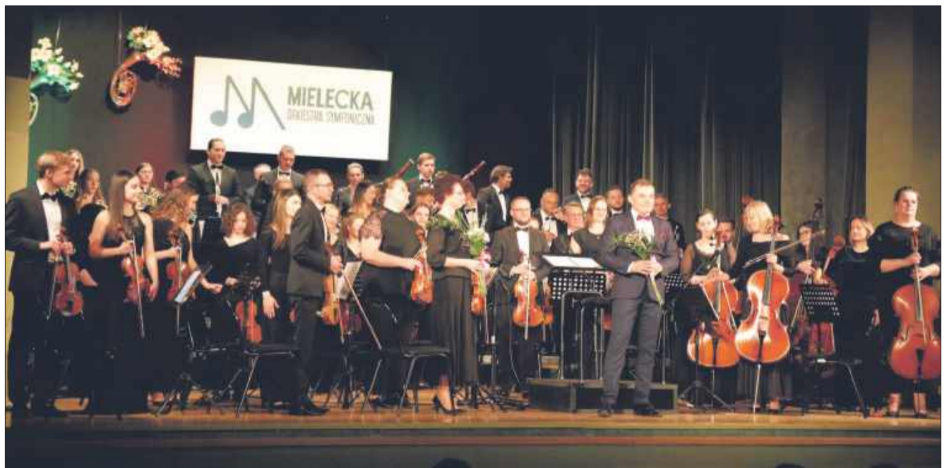
Sala SCK była świadkiem znakomitej współpracy dyrygenta Piotra Wyzgi z orkiestrą.