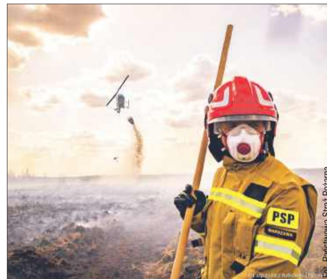
Akcję wspierał śmigłowiec Black Hawk należący do Polskiej Policji.

Na miejscu pozostawały jedynie lokalne siły pożarnicze, które nadal czuwały nad bezpieczeństwem i monitorowały sytuację. PK