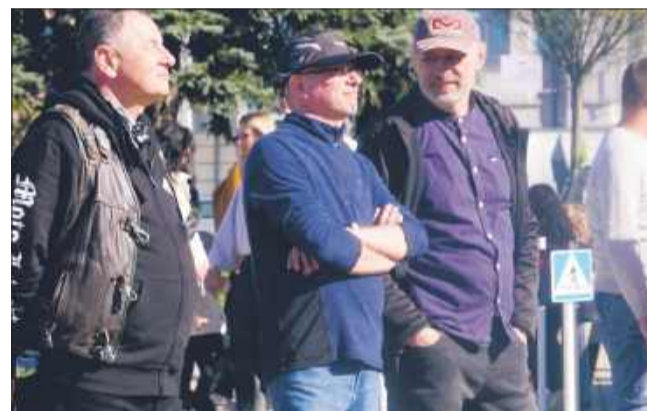
MW Miłośnicy rocka bawili się pod sceną.