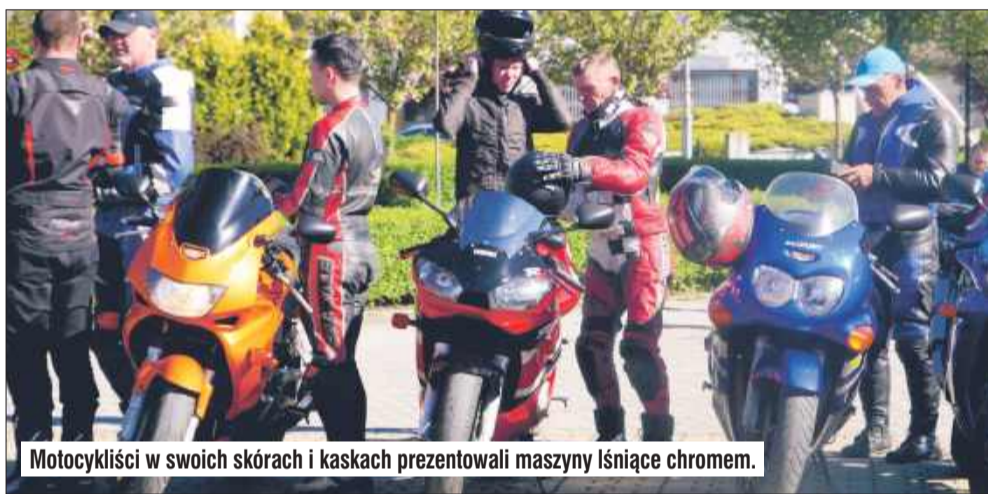
Motocykliści w swoich skórach i kaskach prezentowali maszyny lśniące chromem.