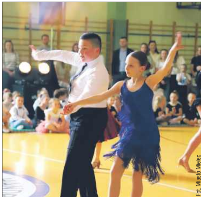
Taniec towarzyski na mieleckich parkietach.