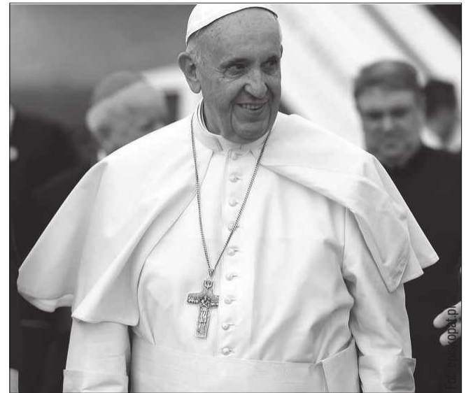
Franciszek, pierwszy papież z Ameryki Południowej, został wybrany na Stolicę Piotrową w 2013 roku.

W sobotę, 26 kwietnia, dokładnie o godzinie 10.00 – gdy w Watykanie rozpoczęły się uroczysto-