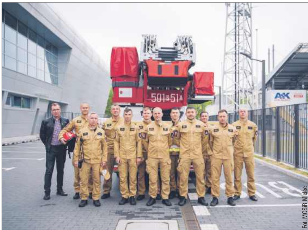
Strażacy mieli okazję szczegółowo przeanalizować układ budynków.

Przez ostatnie dni strażacy z Komendy Powiatowej Państwowej Straży Pożarnej w Mielcu odbyli wizytę w Miejskim Ośrodku Sportu i Rekreacji, aby dokładnie zapoznać się z infrastrukturą obiektów, w tym halą i basenami odkrytymi.