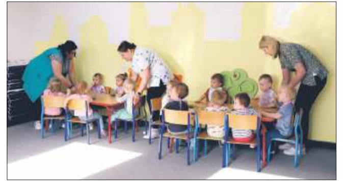
Dzieci szybko zaaklimatyzowały się w nowym miejscu.

W Żłobku Miejskim nr 5 przy ul. Konopnickiej 2 trwają intensywne prace modernizacyjne. Zakres inwestycji obejmuje nie tylko kompleksową modernizację placówki, ale również utworzenie dodatkowych miejsc opieki dla najmłodszych mieleczan.