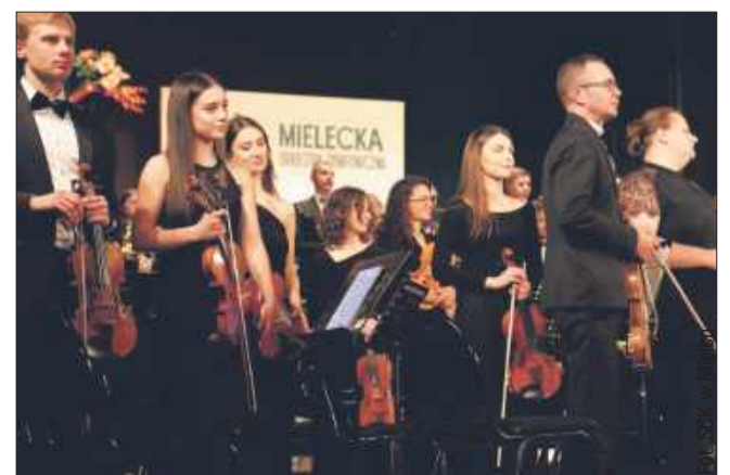
Koncert doskonale odzwierciedlał wiosenne przebudzenie przyrody.