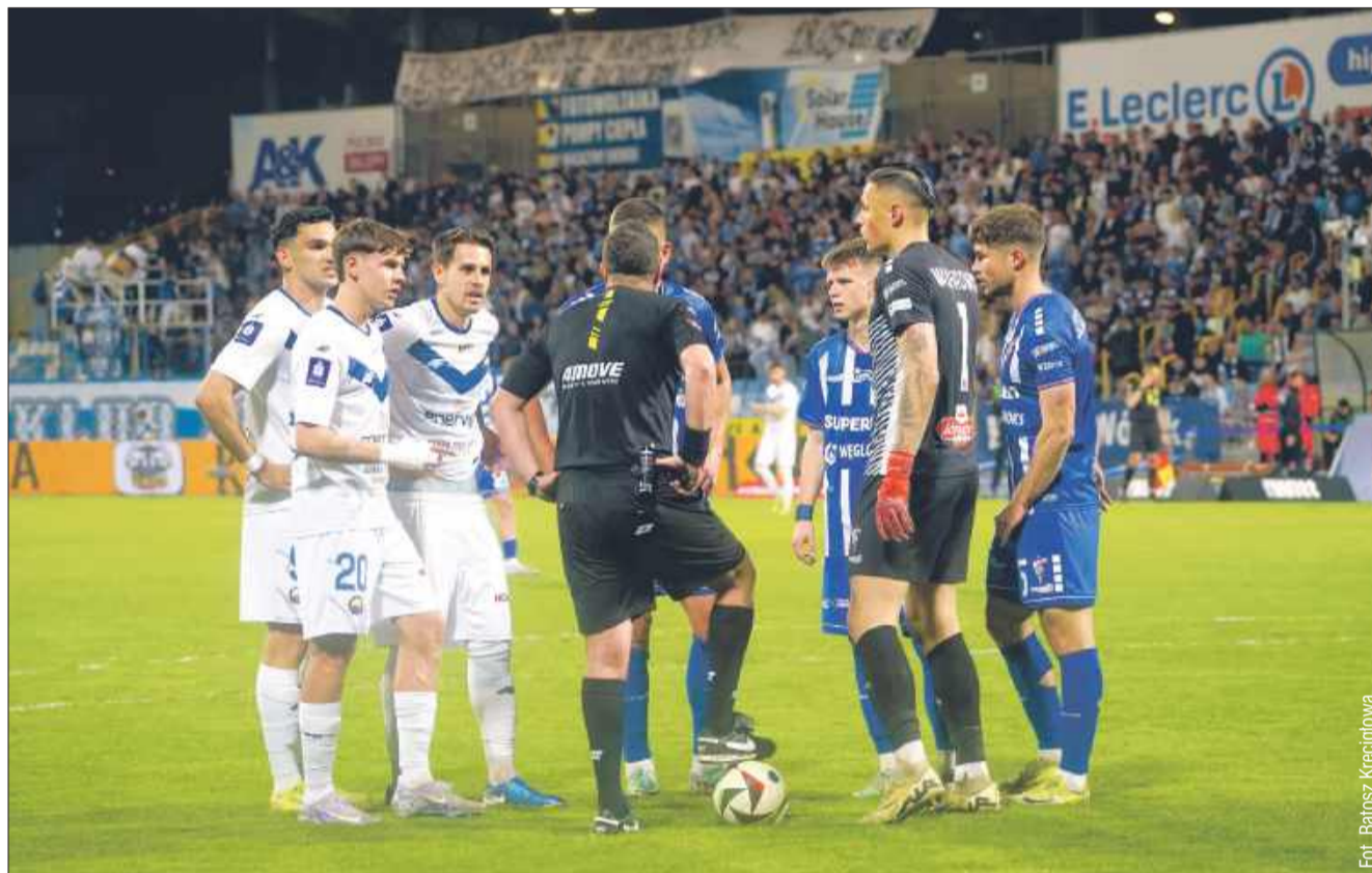
Remis w Mielcu nie poprawił sytuacji w tabeli.

Trener zespołu z Mielca wyraził także optymizm, mimo