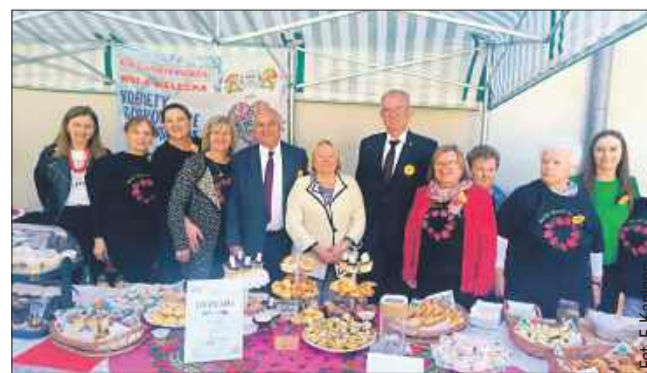
Dzień Dobra w Trześni.