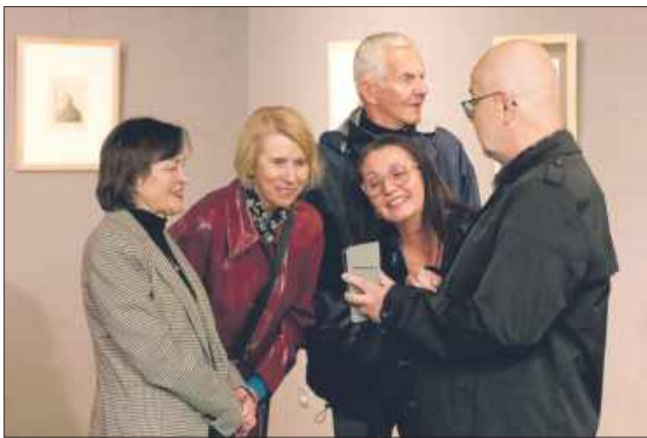
Akwaforty zgromadzone na ekspozycji ukazują różnorodne oblicza holenderskiego artysty.