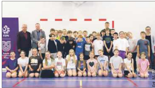
Szkoła przyjazna piłce.