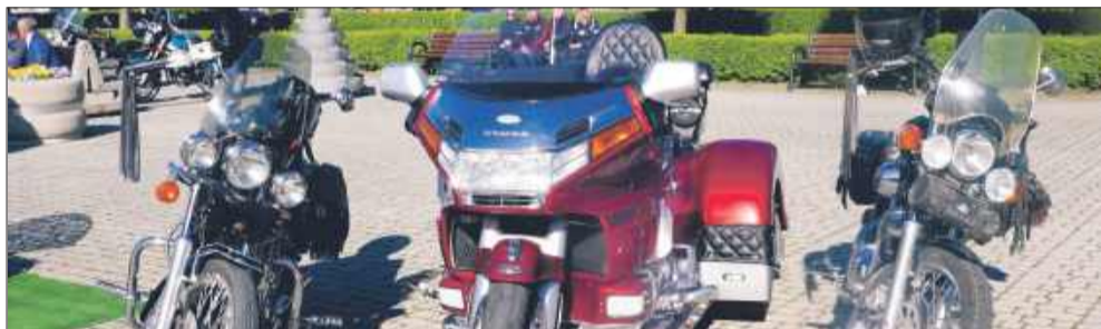
Radomyński rynek zamienił się w parking dla wielu pięknych maszyn.