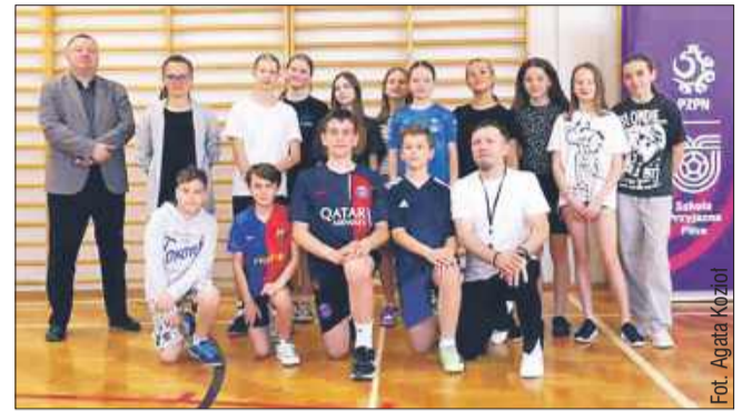
Wyjątkowe spotkanie z wyjątkowym gościem.

Projekt „Szkoła Przyjazna Piłce” wystartował pod koniec stycznia i potrwa do czerwca. Jego misją jest nie tylko promowanie zdrowego stylu życia i aktywności fizycznej, ale przede wszystkim zachęcenie dzieci do częstszego sięgania po piłkę zarówno podczas lekcji wychowania fizycznego, jak i dodatkowych zajęć SKS.