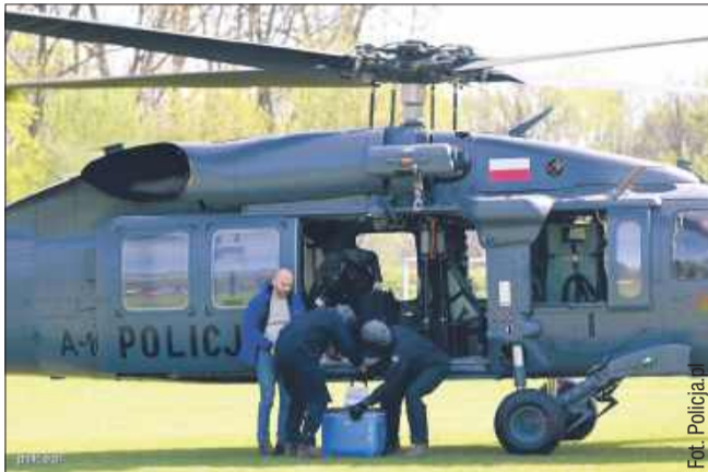
Policyjny śmigłowiec Black Hawk przetransportował serce z jednego z województw położonych w północno-wschodniej części kraju do Śląskiego Centrum Chorób Serca w Zabrze.

Policyjny Black Hawk, na co dzień służący do zadań specjalnych, dzięki swojej niezawodności i możliwościom technicznym, odgrywa coraz ważniejszą rolę w systemie ratownictwa medycz-