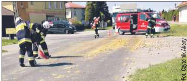
Strażacy jak zwykle stanęli na wysokości zadania.

We wtorek po południu kierowcy jadący w okolicy OSP Zdzierzec mogli przecierać oczy ze zdumienia. Zamiast spokojnej jazdy – slalom między ziemniakami! Na jezdnię wysypało się trochę kartofli.