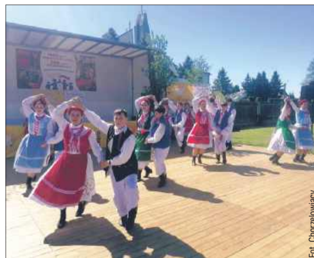
Zespół Tańca „Chorzelowiaczy”

„Dzień Dobra” to radosne Święto Pomagania - wyjątkowy czas dla wolontariuszy i wszystkich, którzy uczestniczą w dziełach miłosierdzia Caritas. To dzień, w którym szczególnie dostrzegamy, że dobro jest w nas i że jest go coraz więcej. Dzień Dobra przy Parafii Św. Wojciecha w Trześni jest wydarzeniem wiodącym w Diecezji Tarnowskiej i odbywa się pod Patronatem Caritas Diecezji Tarnowskiej.