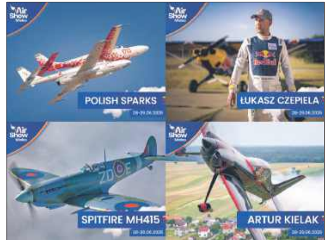
Air Show Mielec zapowiada się wyjątkowo spektakularnie.

To wyjątkowy hołd dla tradycji polskiego lotnictwa – i nie lada gratka dla fanów