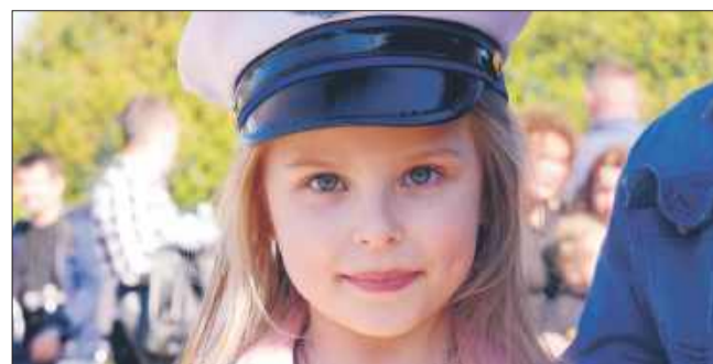
Dzieci mogły na chwilę wcielić się w rolę policjantów.

Motocykliści w swoich skórach i kaskach prezentowali maszyny lśniące chromem, a miłośnicy rocka bawili się pod sceną. To było wydarzenie, które nie tylko symbolicznie otworzyło sezon motocyklowy, ale też pokazało, jak wielką siłę ma wspólna pasja.