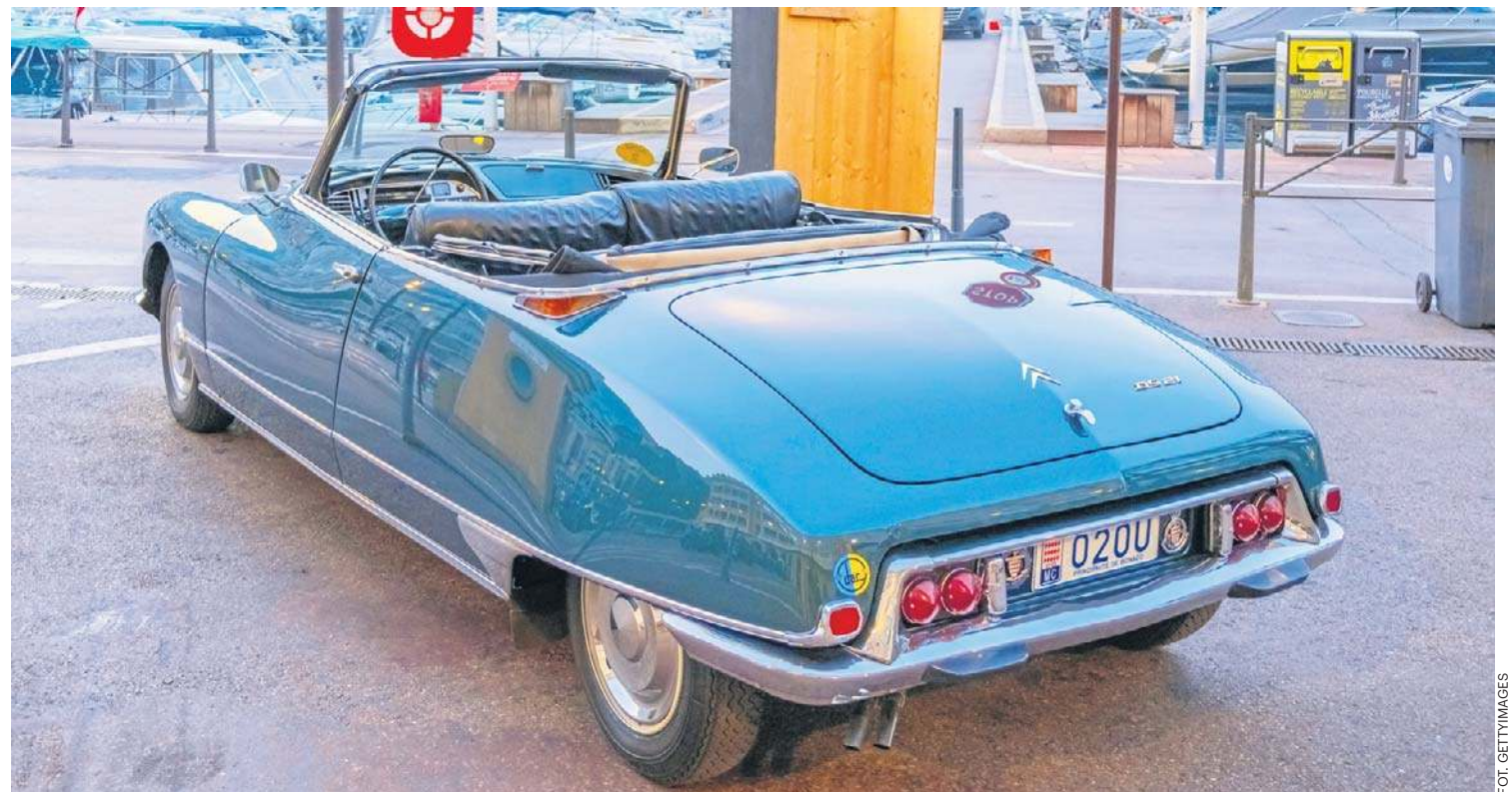
Zaparkowany w porcie w Monako Citroën DS Decapotable, ekskluzywna wersja kabrio produkowana przez firmę Henri Chapron. Powstało jedynie 1400 egzemplarzy, co czyni go jednym z najrzadszych i najbardziej pożądanych Citroënów

Na użytek sportu fabryka stworzyła własne, dwudrzwiowe coupé. Z kolei Michelin zbudował w 1972 r. 10-kołowe monstrum PLR, będące ruchomym laboratorium do testowania opon do ciężarówek przy dużych prędkościach. Napędzane było dwoma amerykańskimi silnikami V8 z Chevroleta i przy wadze 10 t osiągało 180 km/h.