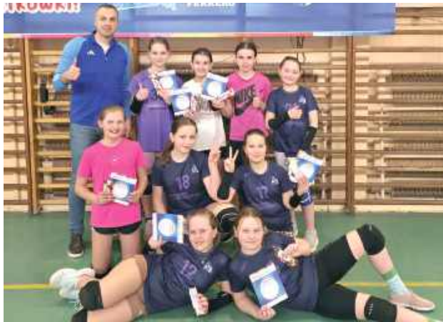
Wielkie brawa. Siatkarki Dragonu zostały mistrzyniami!

W kategorii „dwójek” rywalizowało 18 zespołów, w tym drużyny z Białej Podlaskiej, Międzyrzecza Podlaskiego i Łukowa. W gronie uczestników znalazły się także cztery pary reprezentujące klub z Wojcieszkowa.