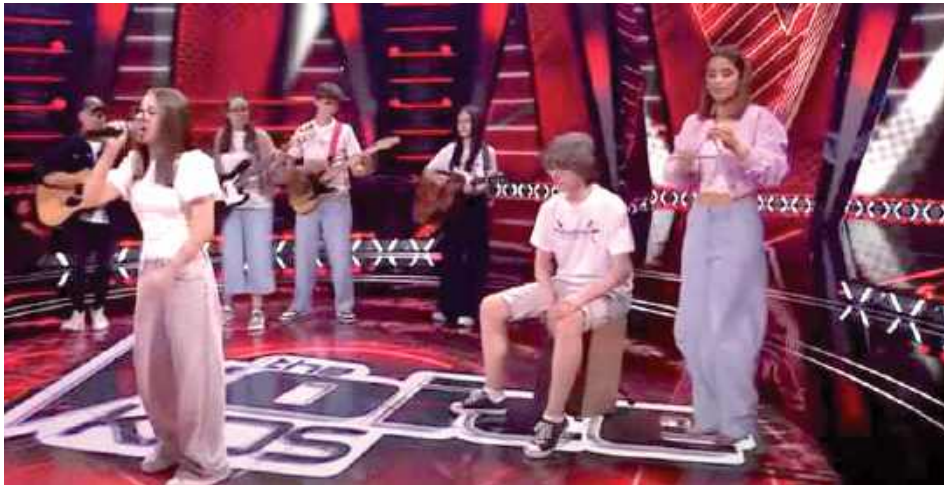
Maja wystąpiła z zespołem, który przyjechał z nią do studia

- Mi się podobał twój występ. Były momenty, kiedy miałam