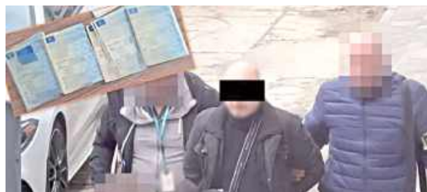
Sprawa prowadzona pod nadzorem Prokuratury Okręgowej w Lublinie jest rozwojowa i planowane są kolejne zatrzymania

- Z ustaleń wynika, że pracujący na stacji diagnostycznych w Lublinie i w powiecie białskim 67-latek potwierdzał wykonanie badania technicznego w dowodach rejestracyjnych oraz dokonywał wpisów do ogólnopolskiego systemu informatycznego,