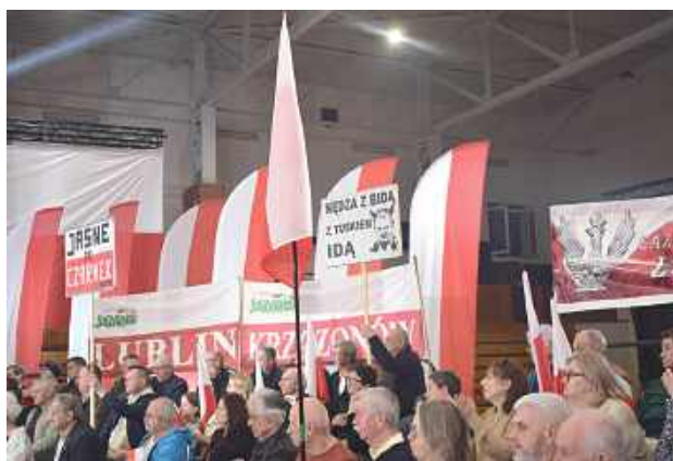
Uczestnicy spotkania przynieśli transparenty z hasłami: „Jasne, że Czarnek” czy „Nęcza z bidą z Tuskiem idą”