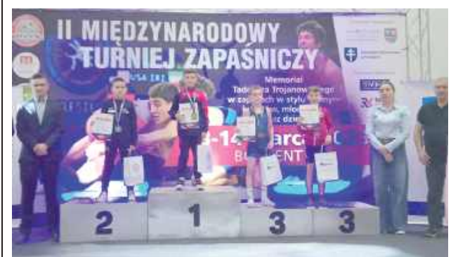
Nasi przedstawiciele raz za razem wchodzili na podium. Brawo!

W minioną sobotę w Boddzentyńcu odbył się Międzynarodowy Turniej Zapaśniczy im. Tadeusza Trojanowskiego.