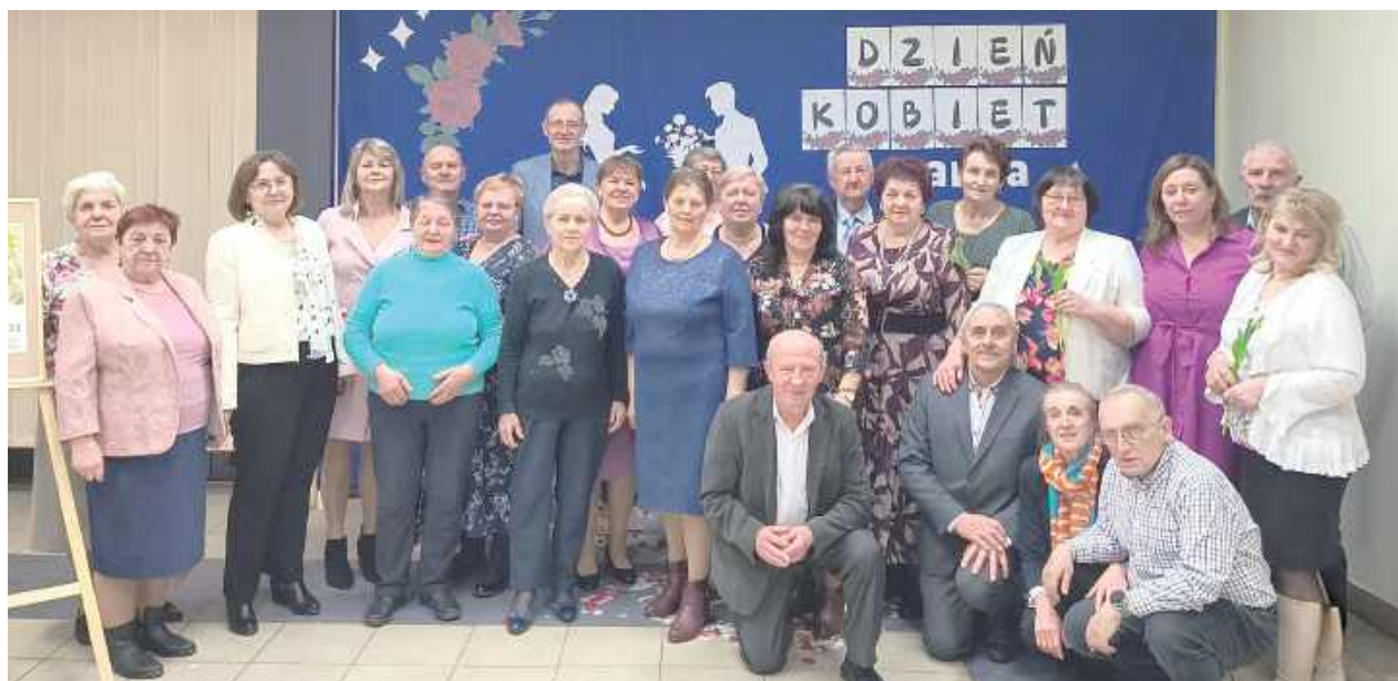
W Klubie Seniora „Teraz Pora na Seniora” w Klimkach odbyło się wyjątkowe spotkanie z okazji Dnia Kobiet