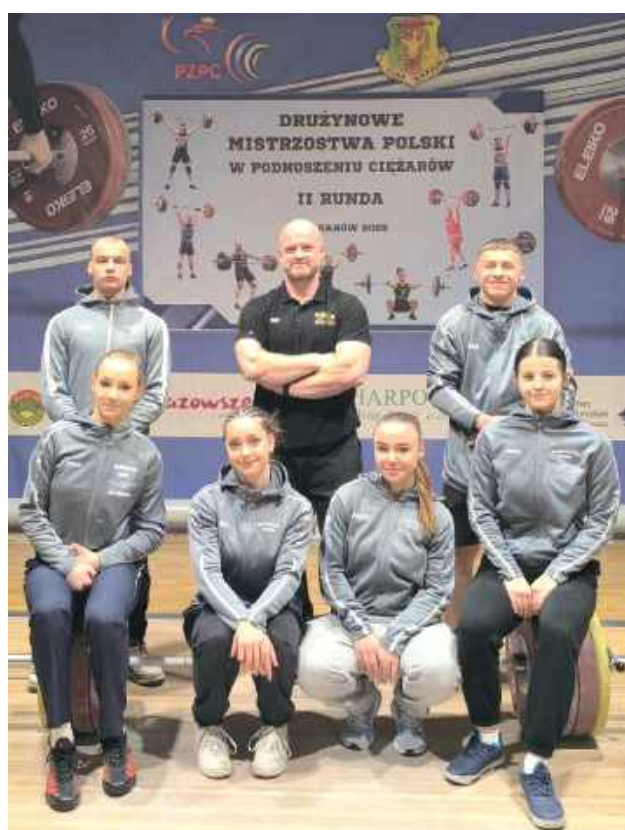
Szósta drużyna w Polsce - Olimpijczyk Łuków!

- To był bardzo dobry występ całego zespołu. Cieszy mnie szczególnie liczba rekordów życiowych i zaangażowanie zawodników. Wynik 1793,26 punktu to rekord klubu w rywalizacji drużynowej, więc mamy powody do satysfakcji - podkreśla trener Robert Dołęga.