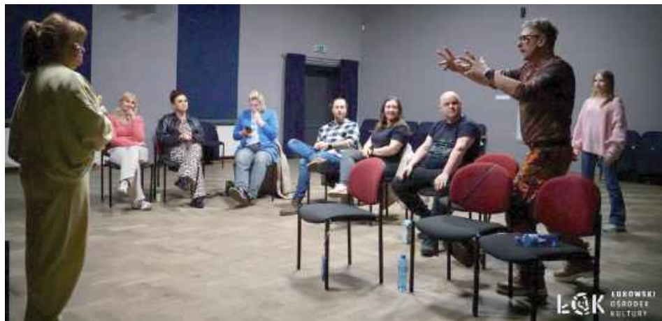
Prowadzący warsztaty w Łukowie ma doświadczenie sceniczne zdobywane podczas pracy teatralnej i projektów artystycznych

Od miesiąca w Łukowskim Ośrodku Kultury działa grupa teatralna przeznaczona dla osób, które ukończyły 16 lat. Spotkania odbywają się w każdy czwartek o godzinie 18 w siedzibie instytucji. Zajęcia mają charakter warsztatów aktorskich i są skierowane do młodzieży oraz dorosłych zainteresowanych rozwijaniem umiejętności scenicznych.