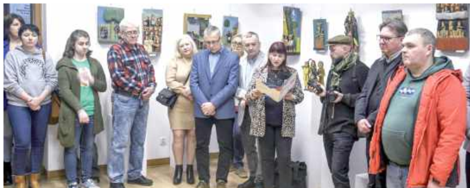
Na wystawę licznie przybyli zaproszenie goście, wielbicielowie twórczości naszych artystów i mieszkańcy Łukowa oraz okolic