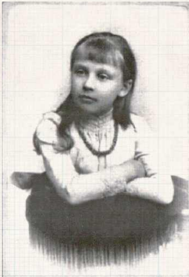
Z tej siedmioletniej dziewczynki z Milanowa wyrosnie dama, o której z szacunkiem będą pisać nawet hitlerowscy oficerowie