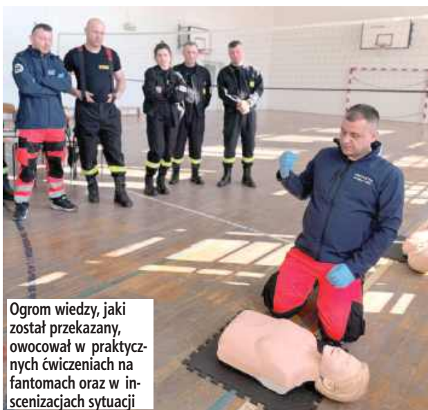
Ogrom wiedzy, jaki został przekazany, owocował w praktycznych ćwiczeniach na fantomach oraz w inscenizacjach sytuacji