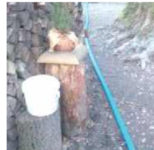
Mieszkańcy mogą korzystać z wody poprowadzonej węzłem, nie wiadomo jednak, jak długo potrwa ten luksus...

Lubelskie Centrum Innowacji i Technologii informuje więc, że po stwierdzeniu nieprawidłowości podjęto decyzję o wyłączeniu zasilania w budynku. O sprawie poinformowano wójta gminy Milejów, wskazując na potrzebę objęcia mieszkańców wsparciem