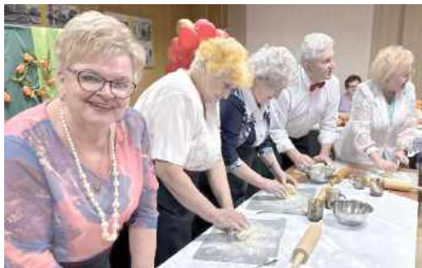
Panie i panowie zmagali się w różnych konkurencjach

Było dużo śmiechu, a momentami także sporo emocji, szczególnie gdy seniorzy brali udział w różnych konkurencjach. Rywalizacja była zacięta, ale - jak podkreślali uczestnicy - najważniejsza była dobra zabawa. Czasami trudno było nawet stwierdzić, kto bardziej walczy o zwycięstwo: panie czy panowie.