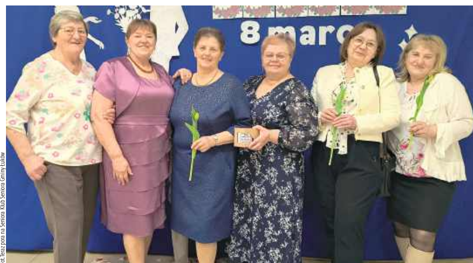
Nie zabrakło serdecznych życzeń skierowanych do pań, kwiatów oraz drobnych upominków przygotowanych przez organizatorów

Uczestnicy podkreślali, że takie spotkania są nie tylko okazją do obcowania z kulturą, ale także ważnym elementem integracji i aktywnego spędzania czasu. Poetycki charakter wydarzenia sprawił, że tegoroczny Dzień Kobiet w Klubie Seniora w Klimkach miał szczególnie uroczysty i nastrojowy wymiar.