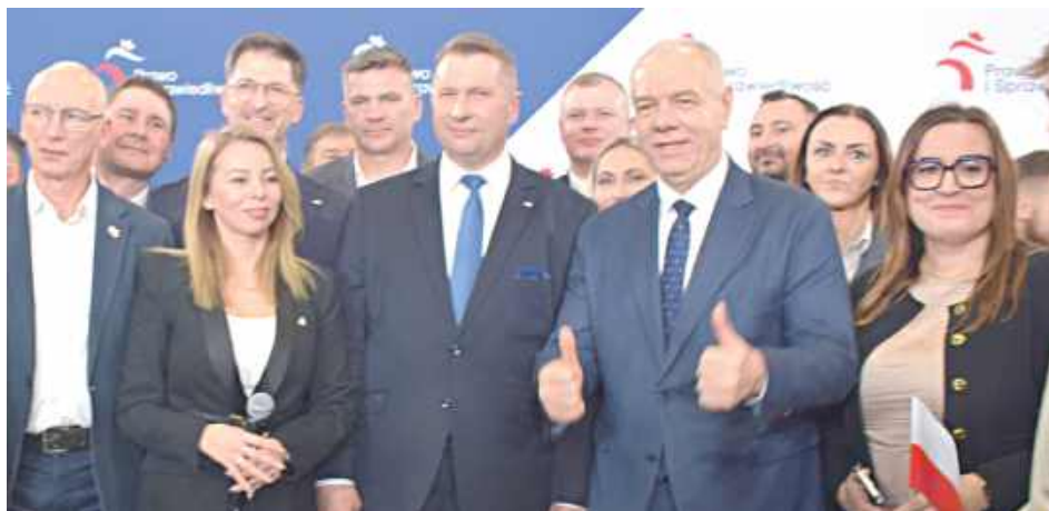
Przemysław Czarnek wśród polityków PiS na spotkaniu w Lubartowie

Po raz pierwszy w Lubartowie jako kandydat na premiera. A z nim cała świat