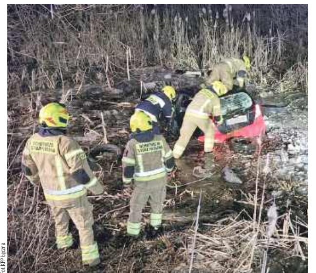
Jak się okazało, był wcześniej prawomocnie skazany za prowadzenie pojazdu w stanie nietrzeźwości, a decyzją starosty ma cofnięte uprawnienia do kierowania

- Jak się okazało, w pojeździe zanurzonym do połowy w wodzie znajdowały się dwie osoby, 46-letni mieszkaniec gminy Ludwin oraz 45-letnia mieszkanka gminy Cyców. W wydostaniu kobiety z pojazdu niezbędna była pomoc strażaków - przekazała aspirant sztabowy Magdalena Krasna z KPP w Łęcznej.