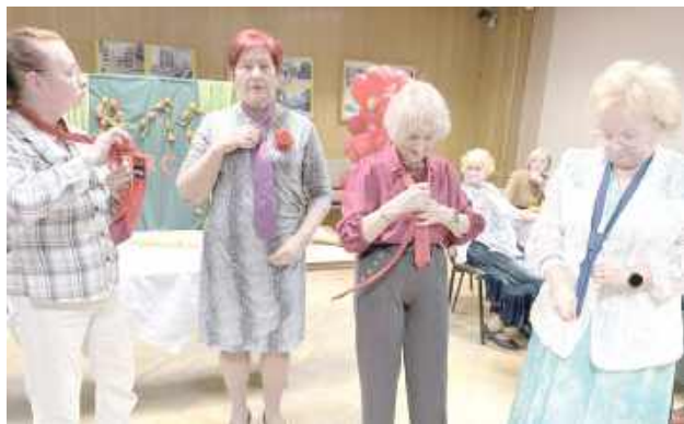
Tym paniom nawet z krawatami jest do twarzy