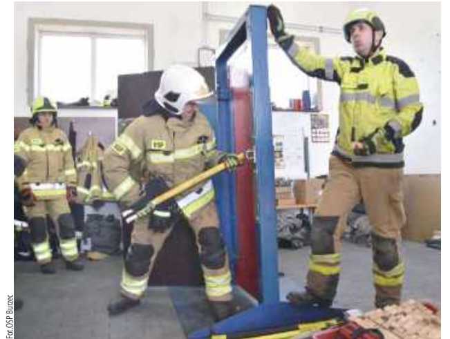
Każdy uczestnik na specjalnie przygotowanym trenażerze mógł sprawdzić swoje umiejętności i wykorzystać zdobytą wiedzę w praktyce