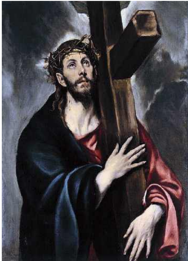
„Christus niosący krzyż” El Greco

■ Skoro mowa o przemijaniu i kruchości życia – czy ten czas jest przede wszystkim momentem refleksji nad sobą, czy raczej zaproszeniem do realnej