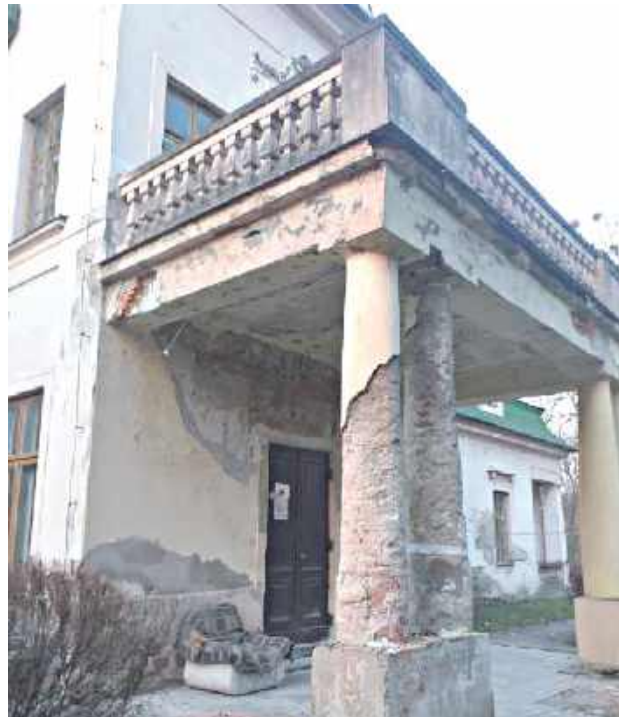
Aktualny wygląd dworku - dla wielu niemożliwym byłoby mieszkanie w budynku. Wyobraźmy sobie, jak mieszkańcy spędzili zimę...

Zarządcą nieruchomości jest Lubelskie Centrum Innowacji i Technologii. Instytucja w odpowiedzi na nasze pytania potwierdziła, że zleciła odcięcie prądu do wspomnianych mieszkań. Tłumaczy to tym, że w zajmowanych lokalach doszło do działań naruszających prawo własności Województwa Lubelskiego: w jednym z mieszkań dokonano samowolnej ingerencji w instalację elektryczną. Podczas przeglądu technicznego stwierdzono m.in. połączenie przewodów miedzianych i aluminiowych bez odpowiednich złączek ochronnych oraz montaż