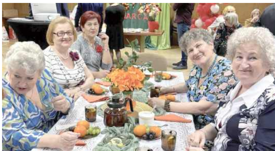
Nie zabrakło wspólnych rozmów i żartów przy herbacie

Podczas spotkania nie zabrakło też humoru. Seniorzy opowiadali zabawne anegdotki, pojawiły się krótkie wierszyki, a w pewnym momencie wszyscy dali się wciągnąć we wspólne śpiewanie. Jak żartowali uczestnicy, repertuar piosenek o kobietach