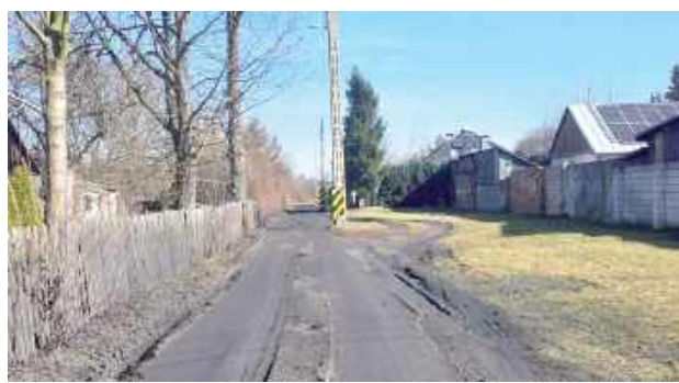
Gruntowa ulica Kondrackiego w Łukowie zyska nową, asfaltową nawierzchnię

- Na to zadanie miasto otrzymało ponad 1,5 mln zł dofinansowania. Powstanie nowa nawierzchnia z kostki granitowej wraz z konstrukcją