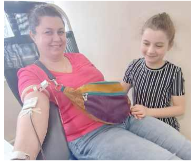
Nie wszystkie panie mogły oddać krew, bo np. były za młode, ale przynajmniej kibicowały dawczyniom