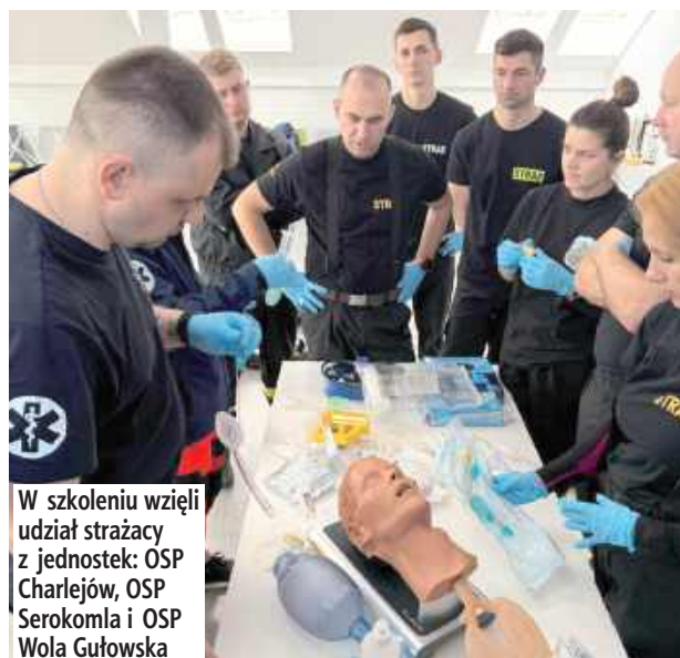
W szkoleniu wzięli udział strażacy z jednostek: OSP Charlejew, OSP Serokomla i OSP Wola Gułowska

Strażacy z OSP Charlejew, KSRG OSP Serokomla i OSP Wola Gułowska uczestniczyli w szkoleniu z zakresu kwalifikowanej pierwszej pomocy (KPP), prowadzonym przez profesjonalnych instruktorów.