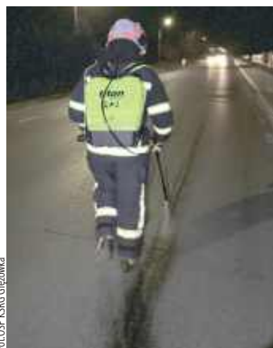
Strażacy specjalnym środkiem usunęli z jezdni zanieczyszczenie

Na szczęście w wyniku zdarzenia nie doszło do żadnych poślizgów ani kolizji.