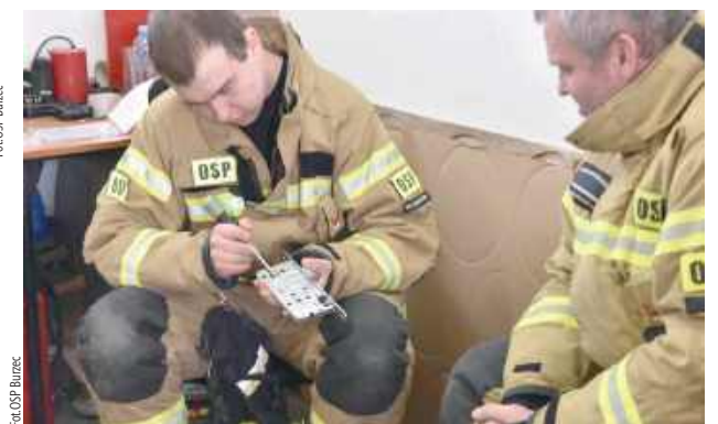
Była nauka otwierania zamków