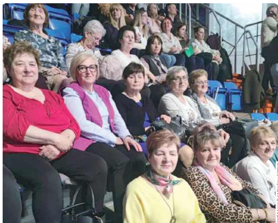
Nie brakowało śmiechu i gromkich braw, które wywoływali znani artyści kabaretowi

Członkowie Klub Seniora „To jest Nasz czas” z Gołębek w wyjątkowy sposób postanowili uczcić tegoroczny Dzień Kobiet oraz Dzień Mężczyzn. Z tej okazji seniorzy wybrali się na wspólny wyjazd do Lublina, gdzie wzięli udział w wydarzeniu Polska Noc Kabaretowa 2026.