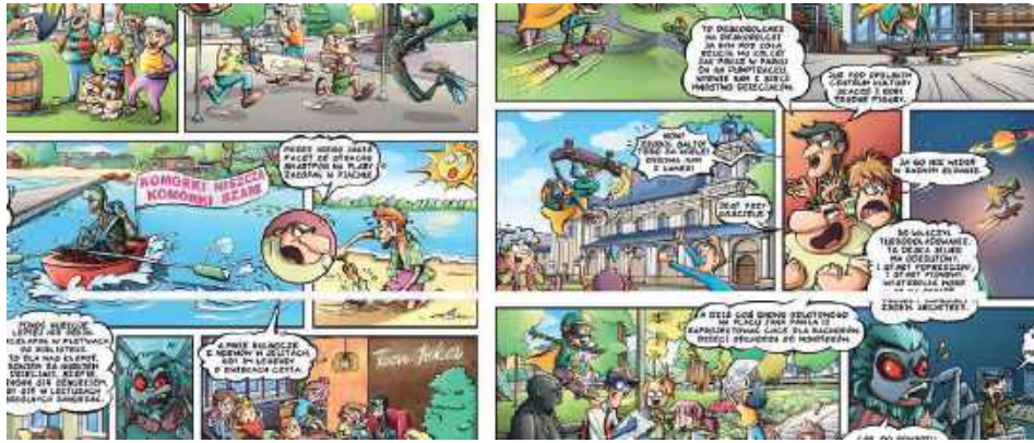
Komiks można pobrać ze strony internetowej Urzędu Miejskiego w Opolu Lubelskim

Historia ma charakter sensacyjno-przygodowy. W komiksie Internet znajduje się pod kontrolą złego Pajaka i jego bandy, którzy próbują uzależnić od urządzeń elektronicznych jak najwię-