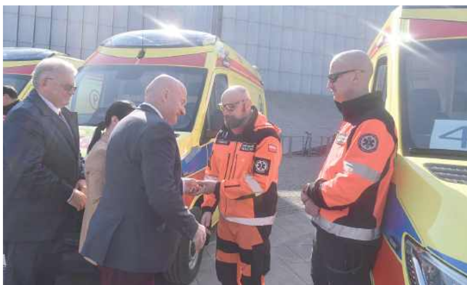
Uroczyste przekazanie pojazdów i wręczenie odznaczeń pod CSK w Lublinie

Nowe pojazdy zostały zabudowane na bazie samochodu Mercedes Sprinter i wyposażone w automatyczną skrzynię biegów, co znacząco ma zwiększać komfort pracy zespołów ratownictwa medycznego oraz efektywność eksploatacji pojazdów podczas interwencji. Ambulanse typu C - najbardziej zaawansowane w systemie ratownictwa medycznego - zastąpią najbardziej wysłużone karetki znajdujące się dotychczas w taborze jednostki. Wyposażenie medyczne ambulansów spełnia wszystkie wymogi Narodowego Funduszu Zdrowia. Wartość