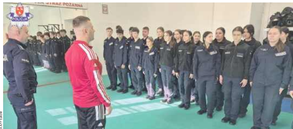
W oddziale o profilu mundurowym przygotowującym do służby w Policji i Straży Granicznej, który wraz z rozpoczęciem nowego roku szkolnego został otwarty w Zespole Szkół im. Władysława Tatarkiewicza w Radoryżu Smolanym, odbyły się kolejne zajęcia z przedstawicielami tych formacji mundurowych

doświadczonego instruktora mieli możliwość zapoznania się z praktycznymi aspektami służby w Policji i przeciwczenia taktyki i technik in-