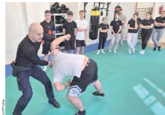
Policjant przeprowadził zajęcia dotyczące taktyki i technik interwencji policyjnych

osób, prowadzenia interwencji i reagowania na różne, groźne sytuacje. Młodzież poznała też procedury legitymowania, przeszukiwania osób i przed-