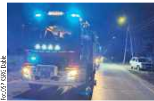
Tuż przed godziną 21 do straży wpłynęło zgłoszenie o podejrzeniu obecności tlenu węgla i rozszczelnieniu instalacji CO

7 marca o godzinie 20.55 właściciel jednej z posesji w miejscowości Żdźary zawiadomił straż pożarną o rozszczelnieniu instalacji centralnego ogrzewania oraz podejrzeniu obecności tlenu węgla w budynku.