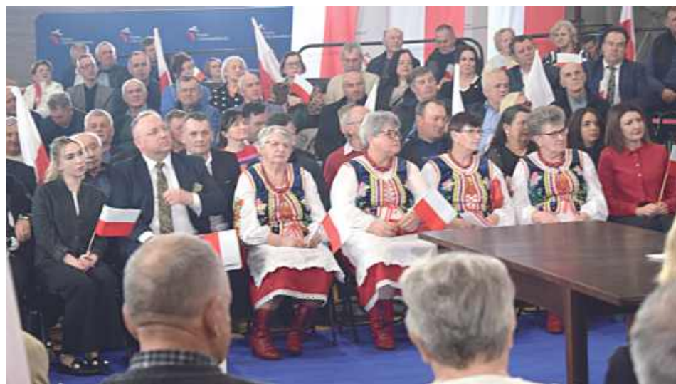
Przybyła grupa w strojach ludowych

prezydenta Rzeczypospolitej Polskiej – mówił kandydat na premiera.