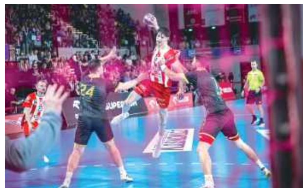
Ostrowia nie miała problemów z zespołem z Puław. Wygrała różnicą 15 trafień

Pierwsza połowa zakończyła się wynikiem 18:13 dla Ostro-