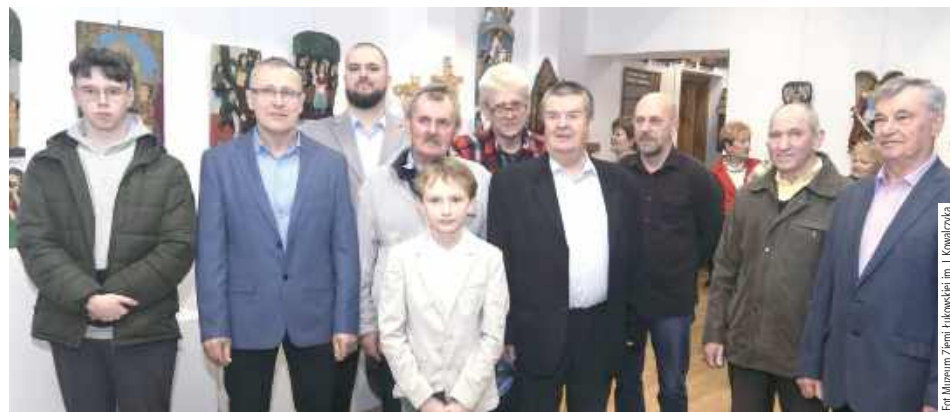
Na wystawę przybyli także młodzi fani łukowskiej rzeźby ludowej