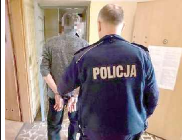
Zarzuty, które mu postawiono, dotyczą znęcania się nad rodzicami oraz kierowania gróźb wobec brata. Jak podała policja, mężczyzna był wcześniej karany