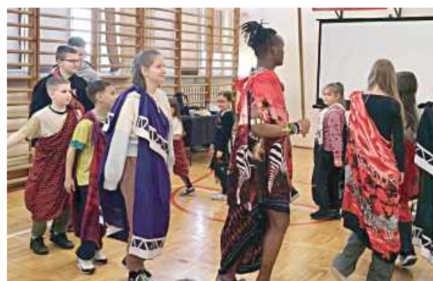
Uczniowie zatańczyli z gościem tradycyjny masajski taniec

Podczas spotkania uczniowie dowiedzieli się, jak wygląda codzienność w Tanzanii, czym zajmują się mieszkańcy, jakie mają obowiązki oraz z jakimi trudnościami muszą się mierzyć. Szczególnie zainteresowanie wzbudził temat dostępu do wody, która w wielu regionach jest dobrem trudno dostępnym.