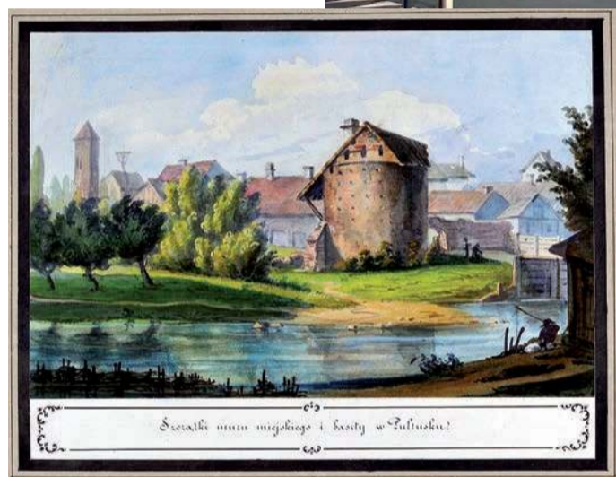
Dawna baszta pułtуска w połowie XIX wieku

w tych miastach pozostałości owych bram czy baszt miejskich, uwiecznionych w godłach herbowych.