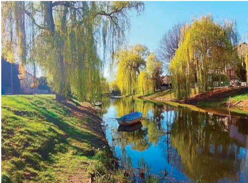
Kanały B i C już po etapie oczyszczania i pogłębienia

Niestety, skala robót wymaga tymczasowych wyrzeczeń. Kanały B i C zostały wyłączone z użytkowania dla jednostek pływających, o czym poinformował Wydział Inwestycji Urzędu Miejskiego w Pułtusku. W zbliżającym się sezonie turystycznym miłośnikom wypoczynku na wodzie muszą wystarczyć dobrodziejstwa rzeki Narew oraz część kanału A. Przewidywany termin zakończenia robót w tym obszarze to 30 listopada 2026 r.