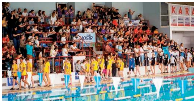
W zawodach wzięło udział blisko 600 zawodników

chanowa, co pokazuje skalę zaangażowania lokalnej społeczności.