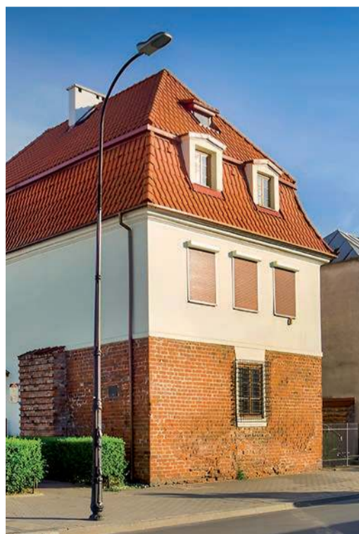
Baszta przy ulicy Zduńskiej w Płocku

Również Płock ma do dziś zachowaną basztę miejską na rogu ulic Zduńskiej i Okrzei. Co prawda baszta ta jest znacznie starsza od pułtuskich, gdyż pochodzi jeszcze z połowy XIV wieku, kiedy miasto zostało otoczone murami przez króla Kazimierza Wielkiego, ale zachowały się jedynie jej pozostałości. Są to ceglane mury o grubości ponad 2 metrów i wysokości około 9 metrów, zachowane w części piwnicznej oraz w ścianie zewnętrznej budynku z XVIII wieku, sięgające ponad strop parteru. Pierwotnie była