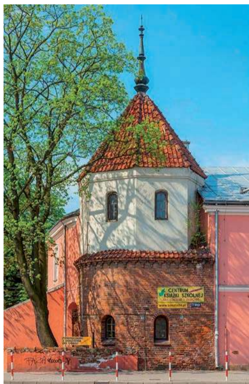
Baszta przy dawnym szpitalu w Pułtusk

W większości dawnych miast średniowiecznego Mazowsza jedyne ślady wspomnianych budowli (fundamenty) ukryte są zazwyczaj w ziemi i tylko podczas prac archeologicznych stają się one medialną sensacją. Tak było na przykład w Pułtusk, gdzie w 2020 r. podczas prac przy ulicy Świętojańskiej natrafiano na fundamenty bramy miejskiej wzniesionej wraz z murami obronnymi na początku XVI wieku z polecenia ówczesnego właściciela tego miasta, biskupa płockiego Erazma Ciołka. Po renowacji ulicy zarys fundamentów tej bramy uwidocznił w specjalnie ułożonej kostce brukowej, a o samej bramie, której budowę w 1509 r. biskup Erazm polecił mistrzowi Janowi z Płocka, przypomina pamiątkowa tablica. Nawiąsem mówiąc Pułtusk ma pod względem architektury municypalnej znacznie więcej szczęścia. Do dziś bowiem zachowały się jeszcze dwa inne elementy dawnego systemu obronnego miasta z XVI wieku, mianowicie dwie baszty. Pierwsza z nich, związana