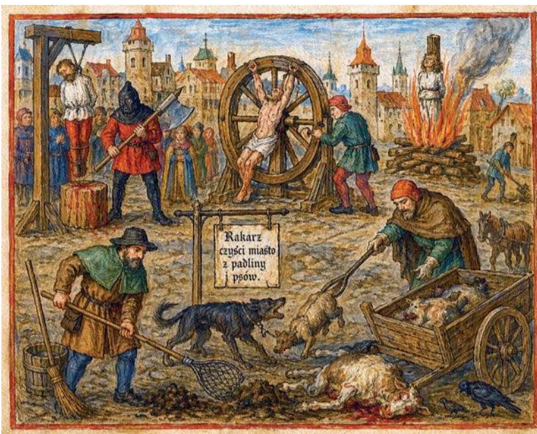
W Średniowieczu kat zajmował się karaniem, leczeniem, rozrywką, oczyszczaniem miasta...

Od początku XIX wieku zagadnienia sanitarne regulowały odpowiednie przepisy prawa, na podstawie których władze miejskie zatrudniały do tych prac czyścicieli miast, bawiących się uprzątnięciem ulic od wszelkiej padliny. Ludzi takich (od tradycji katowskich) zwano dosyć pogardliwie hyclami, rakarzami lub oprawcami, chociaż ich praca była niezbędna. Czyściciel musiał mieć co najmniej jednego konia, furgon czyli kryty i okuty wóz, skrzynie oraz pomocników, mógł także – po uzyskaniu wymaganego zezwolenia – posiadać broń palną. Do podstawowych obowiązków czyściciela należało sprzątnięcie padliny z terenu miasta, także z terenów posesji prywatnych – natychmiast po powzięciu wiadomości o tym fakcie. Z padłych