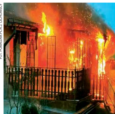
Pożar domu w Szlasach Burych

- Pomóżmy odbudować to, co strawił ogień rodzinie ze Szlas