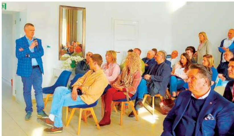
Konsultacje społeczne zgromadziły liczne grono mieszkańców i samorządowców

Organizacje pozarządowe w sytuacjach kryzysowych