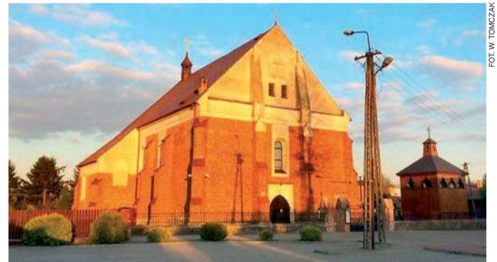
Kościół w Nowym Mieście

Kiedy będziecie państwo zwiedzać Nowe Miasto, ale także Ciechanów (farę), Płońsk (parafia św. Michała) czy Krajkowo, warto zwrócić uwagę na bardzo ciekawy sposób układania cegieł. Ściany są dekorowane za pomocą zendrówek (czyli