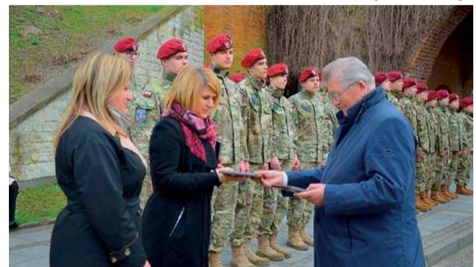
Obchody były również okazją do uhonorowania osób dbających o lokalne miejsca pamięci

wtedy jednostki inżynieryjne to udział w walce z kłeskami żywiołowymi, w tym powodzi w Pułtusku w 1979 r. Pułtuscy saperzy ewakuowali wielu mieszkańców z zagrożonych zalaniem miejscowości, pomagali mieszkańcom z inwentarzem żywym, wspierali mieszkańców za pomocą wodnych tramwajów, odbudowując uszkodzone w wyniku powodzi fragmenty wałów itp. I Batalion Saperów - przypomniał kustosz Muzeum Regionalnego w Pułtusku.