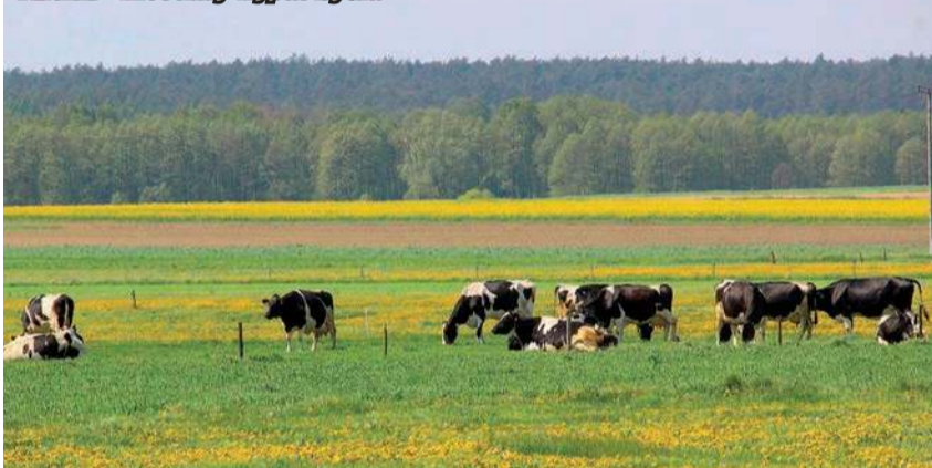
Kliczki – wiosenny wypas bydła

krowy przez całe lato będą „zbierały śmietanę”, bo mleko będzie tłuste, a dla leniwych kobiet – które później wygonią krowy – zostanie co najwyższej serwatka. W wielu regionach gospodynie w tym dniu nikomu nie nie pożyczają, nie wolno było nawet częstować biedaków i wędrownych dziadów, ponieważ mogło to być wykorzystane przez czarownice na szkodę domowników.