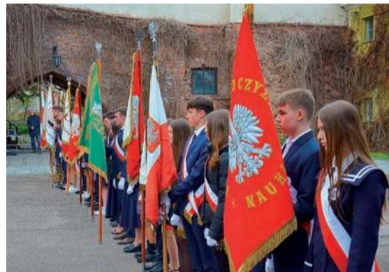
Uroczystość pod tablicami upamiętniającymi żołnierzy I Batalionu Saperów rozpoczęła się z pełnym ceremoniałem wojskowym, wprowadzeniem pocztów sztandarowych

- Oznacza to, że praca saperów wciąż jest niezbędna nawet w czasach pokoju. Działania, jakie podejmują