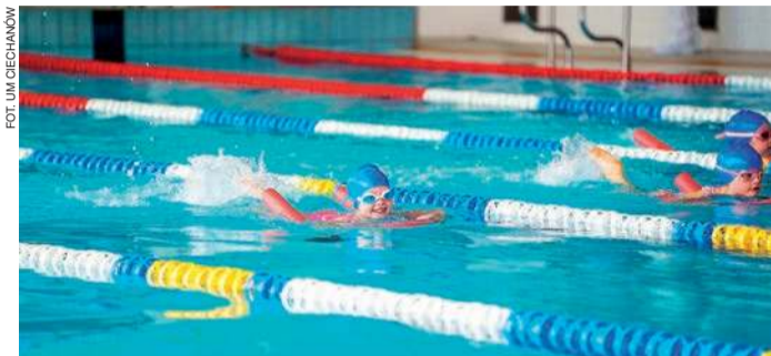
Najmłodszy płynęli z tzw. makaronem

reprezentowało aż 46 uczniów klas 1-8. Łącznie w wydarzeniu wzięło udział 74 młodych pływaków z Cie-