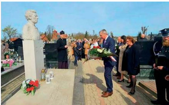
Pomnik, pod którym złożono kwiaty, odsłonięto dwa lata temu

Niedzielną uroczystość, 12 kwietnia rozpoczęła się mszą świętą w kościele pw. Stanisława Biskupa Męczennika w Starej Wronie. W uro-