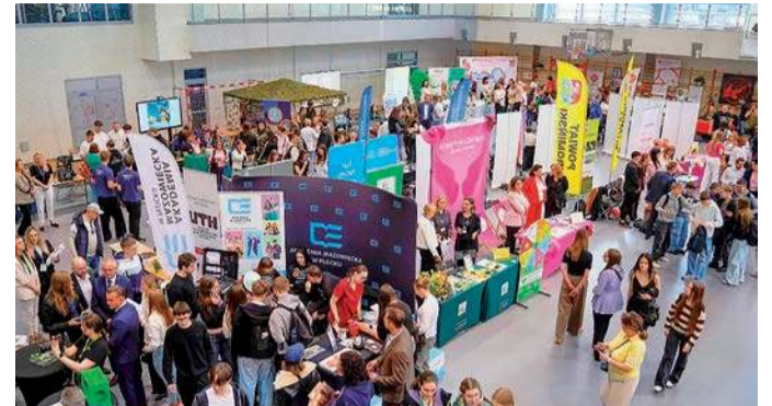
W targach brało udział kilkudziesięciu wystawców

Targi były dobrą okazją, aby w jednym miejscu sprawdzić oferty pracy,