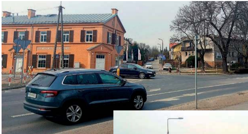
Ostatni Grosz obecnie