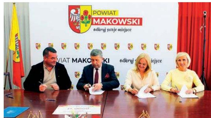
Kolejne NGO otrzymały wsparcie z budżetu powiatu

Dodajmy, że z pierwszej puli dofinansowania otrzymały następujące organizacje: Stowarzyszenie „Radość Rozwoju” (8 tys. zł i 6 tys. zł), Stowarzyszenie Przyjaciół ZSP Karniewiaczek (3 250 zł i 3 tys. zł), Stowarzyszenie Na Rzecz Edukacji Dzieci i Młodzieży „Maciuś” (2 750 zł), Stowarzyszenie Przyjaciół Przedszkola w Starym Szelkowie (2 tys. zł), Koło Gospodyń Wiejskich „Młodzianowianki” (3 tys. zł), Ochotnicza Straż Pożarna w Gąsewie (5 tys. zł), Stowarzyszenie Pomocy Liceum im. Marii Curie Skłodowskiej (6 tys. zł), Stowarzyszenie Na Rzecz Rozwoju