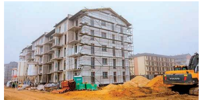
Nowe bloki w ramach SIM powstaną w Głinojecku przy ulicy Płockiej