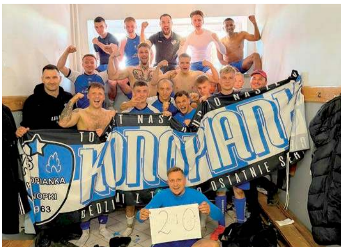
Konopianka Konopki pokonała u siebie Opie

23. kolejka (25-26 kwietnia): Wkra R. - Oldaki, Rzekunianka - Sona, Korona - Ostrovia, Krysztal - Konopianka II, Opia - Mławianka II, Wkra Ż. - Narew II, Kurpik - Gladiator, Wkra B. - Strzegowo.