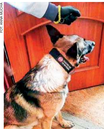
Pies służbowy Szron w akcji

Zgromadzony materiał dowodowy pozwolił prokuratorowi na przedstawienie 40 letniemu mieszkańcowi powiatu makowskiego zarzutów posiadania znacznej ilo-