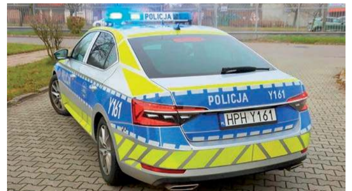
Policjanci ścigali kierowcę przez trzy powiaty

Prokurator wystąpił z wnioskiem do Sądu Rejonowego w Mławie o zastosowanie środka zapobiegawczego w postaci tymczasowego aresztowania na okres trzech miesięcy, do którego sąd się przychylił i we wtorek, 14 kwietnia 2026 r., mężczyzna trafił za kraty. W.D.