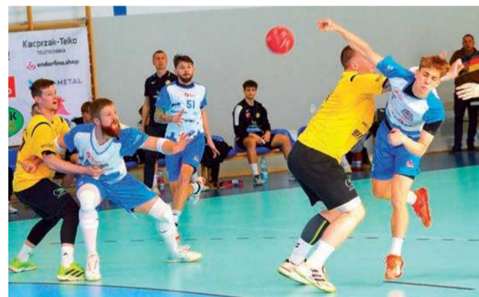
Ostatecznie w Ciechanowie triumfowali gospodarze

23. kolejka: Padwa Zamość - Śląsk Wrocław 26:32 (14:17), Anilana Łódź - Pogoń Szczecin 28:33 (12:21), Gwardia Koszalin - AZS UW Warszawa 38:31 (23:16), Miedź Legnica - SMS ZPRP Kielce 31:31 ((16:18) k. 4:5, Stal Gorzów - AZS AGH Kraków 26:27 (12:13).