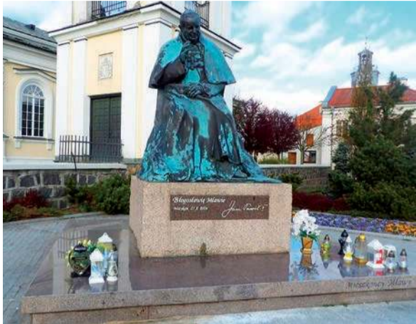
Pomnik św. Jana Pawła II w Mławie

Nieznany sprawca wylał oleisty płyn na postument pomnika św. Jana Pawła II na Starym Rynku w Mławie.