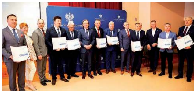
Rządowe dofinansowanie otrzymało 12 samorządów z regionu ciechanowskiego