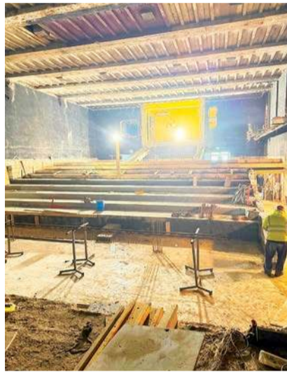
Tak wygląda plac budowy PCKiSz przy ulicy Strażackiej

Całkowity koszt przedsięwzięcia wynosi ponad 27,3 mln zł. Projekt jest współfinansowany z budżetu Powiatu Ciechanowskiego, Rządowego Funduszu Polski Ład: Program Inwestycji Strategicznych, środków Urzędu Marszałkowskiego Województwa Mazowieckiego oraz Funduszy Europejskich dla Mazowsza.