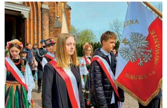
W uroczystości wzięły udział poczty sztandarowe