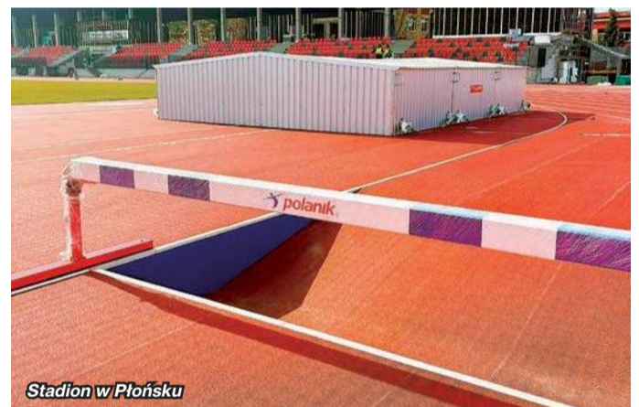
Stadion w Płońsku