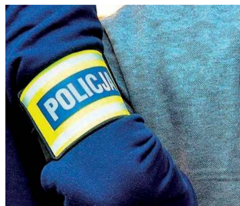
Policjanci zepsuli im dzień

Trwają czynności żuromińskiej policji w sprawie zdarzenia drogowego do który wydarzył się w miniony poniedziałek (13.04) na drodze relacji Syberia - Mleczówka (gm. Lubowidz). Do wypadku doszło około godziny 23:00 na prostym odcinku