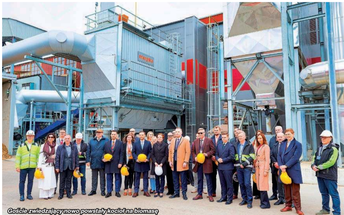
Goście zwiedzający nowo powstały kocioł na biomasę

stwa Klimatycznego - jednego z najważniejszych wydarzeń branżowych w kraju, skupiającego przedstawicieli biznesu, administracji i sektora regulacyjnego.