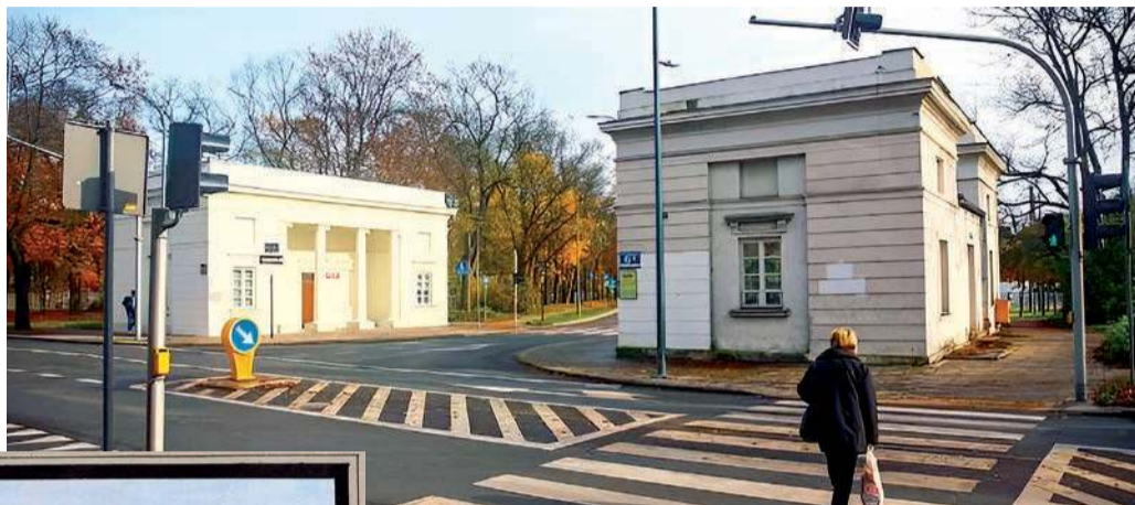
Rogatki warszawskie (wyszogrodzkie)

T ytułowe bramy, baszty i rogatki stanowiły nieodłączny element przestrzeni miejskiej dawnego Mazowsza. Często wznoszone wraz z lokacją miasta lub krótko po niej były ważnym elementem obronnym lub celno-skarbowym (tu pobierano cła przewozowe) dawnych miast i miasteczek, urastając niekiedy do symbolu identyfikacji lokalnej wspólnoty (komuny) miejskiej. Ten ostatni aspekt widać dobrze w herbach Płońsk, Mławy, Wyszogrodu, Czerwińska, Przasnysza, Raciąża czy Bieżunia. Niestety próżno szukać