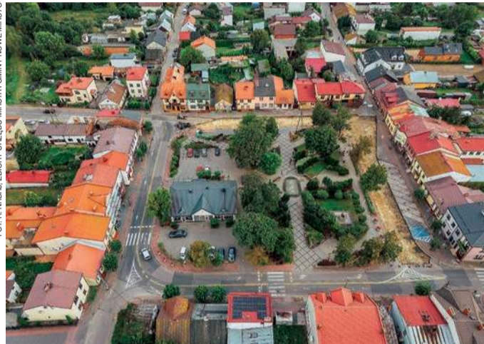
Nowe Miasto, Główny Rynek

Miejscowość przechodziła różne koleje losu. Była stolicą powiatu i dekanatu, z czasem jednak, na skutek pożarów i wojen podupadała ekonomicznie, zmniejszała