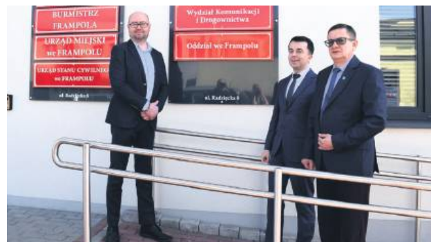
Od 25 marca działa oddział Wydziału Komunikacji i Drogownictwa we Frampolu.

W styczniu Zarząd Powiatu w Biłgoraju zdecydował, że we Frampolu powstanie ten oddział. To ukłon w kierunku mieszkańców północnych gmin powiatu biłgorajskiego, a więc Turobina, Goraja i Frampola. Nie będą oni musieli już jeździć do Biłgoraja, by załatwić sprawy związane m.in. z rejestracją auta czy odebraniem dowodu rejestracyjnego.