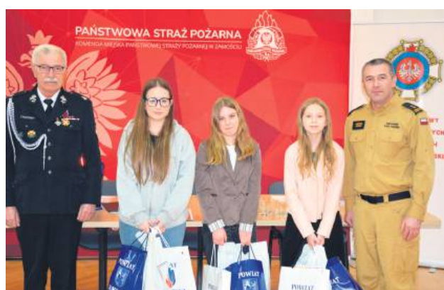
Zwycięzcy turnieju uzyskały prawo reprezentowania powiatu w eliminacjach wojewódzkich.

Do rywalizacji w Komendzie Miejskiej Państwowej Straży Pożarnej w Zamościu przystąpiło 25 najlepszych uczniów szkół podstawowych i ponadpodstawowych z 12 gmin powiatu zamojskiego. Pierwszy etap eliminacji polegał na rozwiązaniu testu jednokrotnego wyboru, składającego się z 20 pytań. Najlepsze osoby z każdej grupy zakwalifikowały się do ścisłego finału, czyli eliminacji ustnych, w których trzeba było udzielić szerszej odpowiedzi na kolejne, coraz trudniejsze pytania.