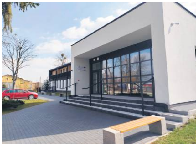
W ośrodku przy ul. Zagłoby 8 przebywa obecnie 36 osób z Ukrainy.

To było w lutym. W połowie marca na Rynku Wielkim odbyła się konferencja prasowa klubu Konfederacji w Zamościu, która dotyczyła centrów integracyjnych dla cudzoziemców. – Mieszkańcy naszego miasta obawiają się