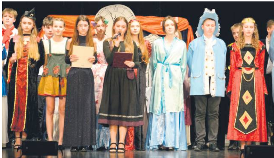
Na scenie było niezwykle barwnie.