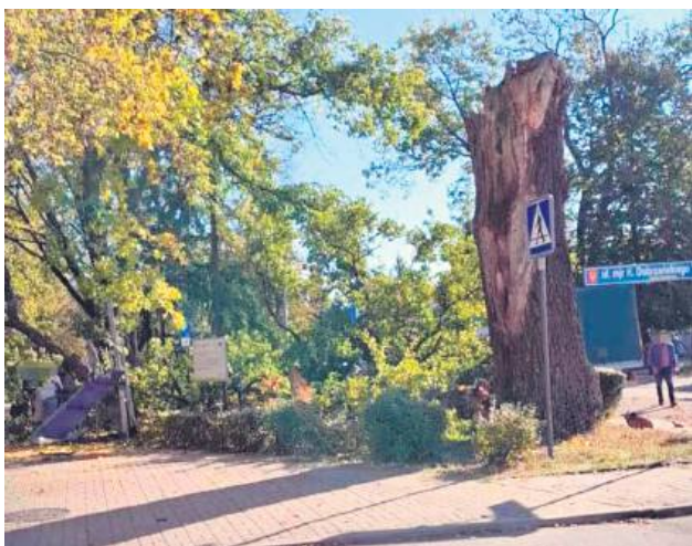
7 października zeszłego roku runęła potężna korona wiekowego, zabytkowego dębu „Wiktor”, który rósł przed Urzędem Miejskim w Hrubieszowie.

Historia zatoczyła koło. Mieszkańcy Hrubieszowa otrzymali wyjątkowy dar – sadzonkę potomka słynnego dębu nazwanego przez hrubieszowian „Wiktorem”. Zabytkowe drzewo przez około 200 lat rósł w sercu miasta, a w ubiegłym roku uległo poważnemu uszkodzeniu. Na szczęście udało się uratować zabytkowy dąb. Prawidłowym wzrostem potomka „Wiktora” wkrótce zajmie się Nadleśnictwo Strzelce.