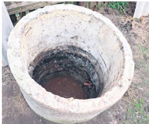
Nie żyje mężczyzna, który wpadł do zbiornika na nieczystości.

– Wstępne ustalenia policjantów wskazują, że 45-letni mężczyzna miał wykonać prace przy udrażnianiu przydomowe-