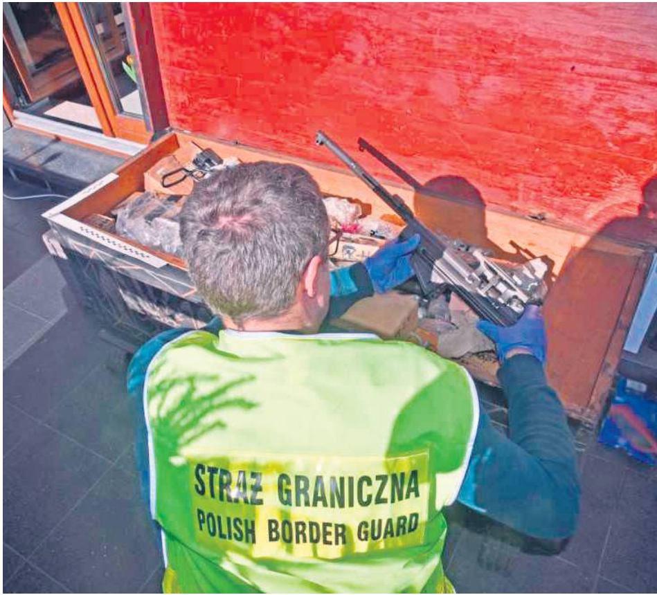
Podczas dwóch przeszukań znaleziono i zarekwirowano pistolety, rewolwery oraz różną amunicję, a także części, z których można złożyć co najmniej 125 kompletnych jednostek broni, w tym karabiny maszynowe.

Podczas przeszukiwania ujawniono prawie 1 tys. sztuk amunicji różnego kalibru, a także