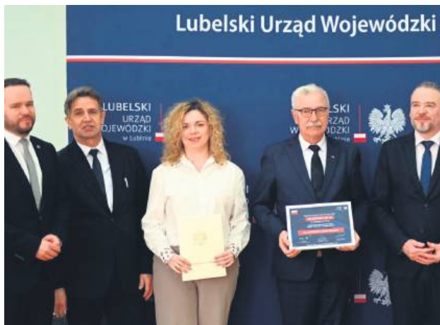
Umowę podpisano 26 marca.

Mieszkańcy powiatu zamojskiego oraz turyści będą mogli wkrótce skorzystać z kolejnej przebudowanej drogi, która połączy znany w całym kraju między innymi z Festiwalu Języka Polskiego Szczepczyszyn z odwiedzanym nie tylko przez amatorów sportów wodnych Nieliszem.