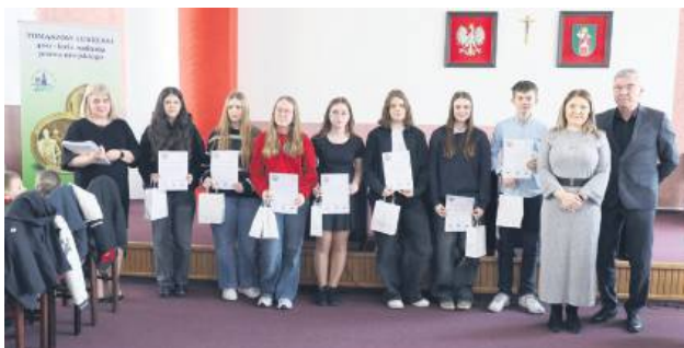
26 marca 2025 r. w Urzędzie Miasta odbyło się podsumowanie zbiórki prowadzonej przez Tomaszowski Sztab 33. Finału WOŚP.

Wśród, 26 marca, w Urzędzie Miasta w Tomaszowie Lubelskim podczas uroczystości podsumowania 33. Finału WOŚP burmistrz Woj-