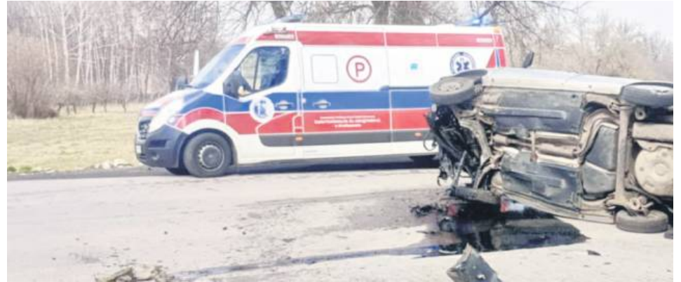
Strażak ochotnik ze Zwierzyńca wyciągnął ze skody rannego kierowcę.

Do tego zdarzenia drogowego doszło 26 marca w godzinach przedpołudniowych w Uchaniach. Skodą Fabią kierował 59-latek z gminy Uchanie. Tak o tym zdarzeniu drogowym napisali na swoim