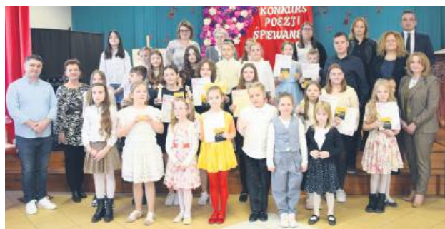
Wszyscy uczestnicy otrzymali nagrody za udział w konkursie, natomiast laureaci nagrody specjalne ufundowane przez Centrum Kultury z Biblioteką w Sitnie oraz LGD Ziemia Zamojska.