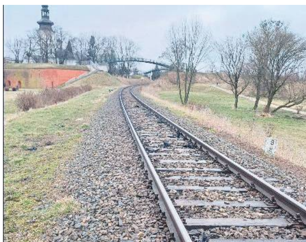
Wymiana rozjazdów to część inwestycji za 129 mln zł z KPO.

Między 24 marca a 14 czerwca br. zaplanowaliśmy wymianę rozjazdów realizowaną etapami na stacjach