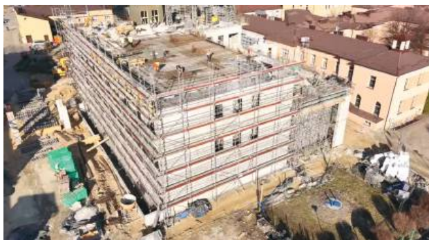
Zdjęcia z filmu zamieszczonego przez Samodzielny Publiczny Zespół Opieki Zdrowotnej w Tomaszowie Lubelskim w mediach społecznościowych. Przedstawiają stan budowy na 25 marca 2025 r.

Na filmie opublikowanym w mediach społecznościowych widać, że nowy budynek, który łączy się ze „starą” częścią szpitala (z Oddziałem Chirurgii), ma już kilka pięter. Wewnątrz murowane są ściany działowe. W piwnicy rozpoczęto prace