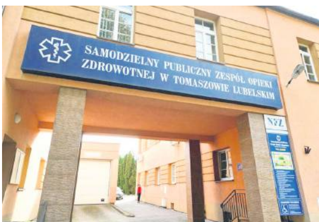
Szpital w Tomaszowie od ponad tygodnia prowadzi diagnostykę bezdechu sennego już przy użyciu dwóch polisomnografów.

Od 20 marca diagnostyka bezdechu sennego w Samodzielnym Publicznym Zespole Opieki Zdrowotnej w Tomaszowie Lubelskim odbywa się przy użyciu dwóch polisomnografów, czyli urządzeń do monitorowania snu, umożliwiających dokładne zdiagnozowanie zaburzeń.