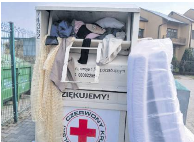
Mobilne zbiórki ubrań, które nadają się jeszcze do noszenia, organizują organizacje charytatywne, a PCK ma na terenie miasta swoje pojemniki na taką odzież.