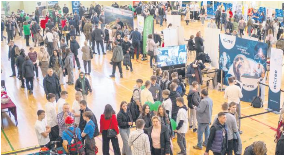
Tomaszowskie Targi Pracy odbyły się w II LO w Tomaszowie Lub.

Tomaszowskie Targi Pracy odbyły się pod hasłem „Edukacja – Praca – Służba”. Ich organizatorem był Powiatowy Urząd Pracy, który w ten sposób