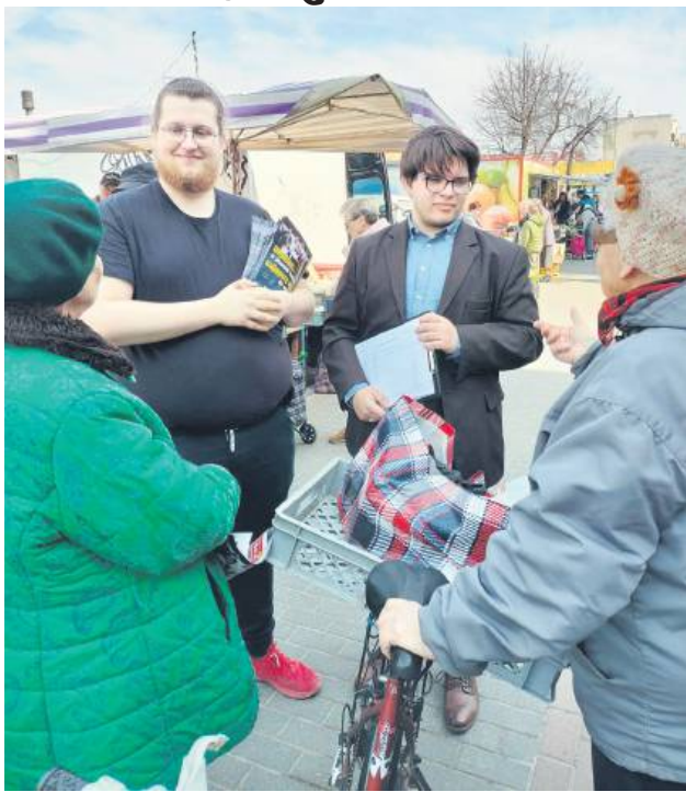
Działacze Konfederacji na zielonym rynečku zbierali podpisy pod petycją „Stop imigrantom w Zamościu”.

Temat uchodźców został wywołany podczas przedostatnich obrad Rady Miasta Zamość. O to, czy miasto analizowało już skutki społeczne i gospodarcze w przy-