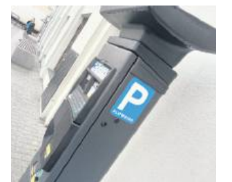
Od 1 kwietnia znowu trzeba płacić za pozostawienie samochodu przy parku albo przy dawnym PZU.

W pierwszej strefie znajdują się dwie podstrefy. Podstrefa A obejmuje obszar zespołu staromiejskiego z zabytkową zabudową i tam płatne parkowanie obowiązuje przez cały rok. Podstrefa B to dwa parkingi – przy Parku Miejskim (ul. Piłsudskiego) oraz przy dawnym PZU (ul. Partyzantów). Zgodnie z uchwałą