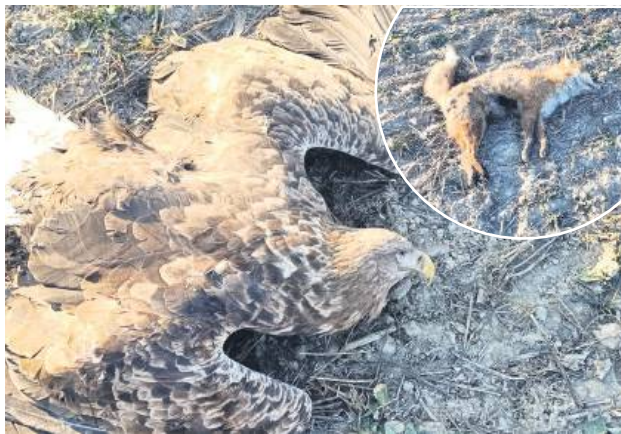
„Biały ogon i jasna głowa świadczą, że jest to dorosły ptak. Na dziobie widać jeszcze resztki sierści lisa” – objaśnia Zamojskie Towarzystwo Przyrodnicze.

– Trucizna, która jest najczęściej używana do otrucia lisa, to