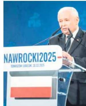
Jarosław Kaczyński w Tomaszowie Lubelskim.

– Dzisiaj stoimy przed wyborem, który naprawdę będzie wyborem naszego narodu (...), czy polska niepodległość będzie incydentem, czy też czymś trwałym – podkreślał.