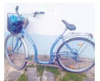
Złodziejem okazał się 28-latek.