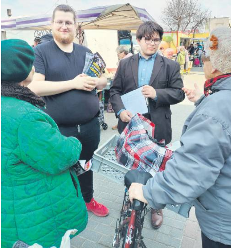
Działacze Konfederacji na zielonym ryneczku zbierali podpisy pod petycją „Stop imigrantom w Zamościu”.