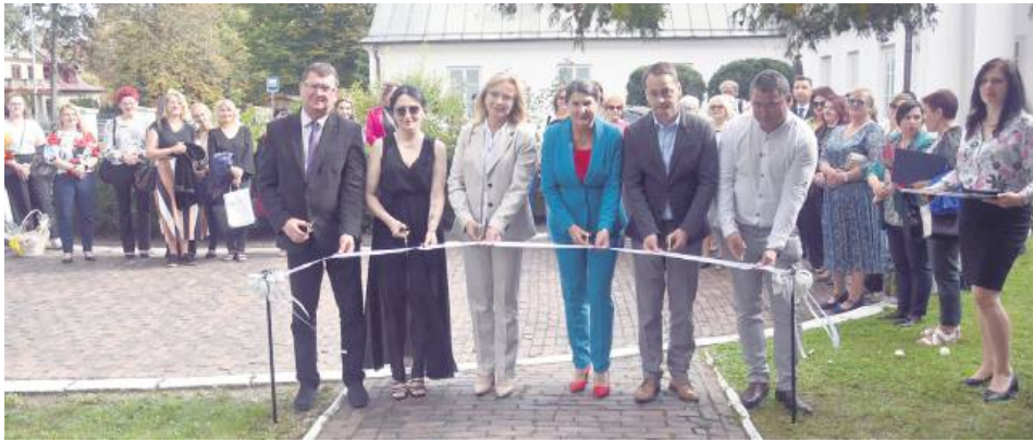
Pod koniec września zeszłego roku Powiatowa Biblioteka Publiczna w Hrubieszowie świętowała 25-lecie działalności oraz 15-lecie nadania jej imienia prof. Wiktora Zina, a ponad miesiąc wcześniej radni powiatowi podjęli uchwałę o zamiarze likwidacji tej placówki.