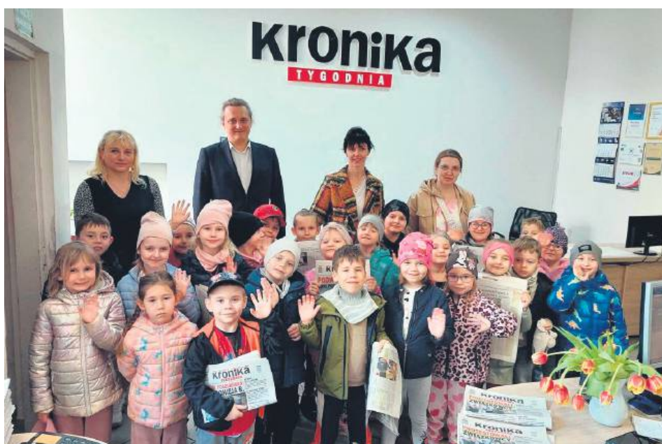
Więcej zdjęć z wizyty przedszkolaków zobaczcie na stronie internetowej www.kronikatygodnia.pl.

W ramach zabawy w dziennikarzy przedszkolaki przeprowadziły między sobą mini wywiady. Dzieci zobaczyły także narzędzia, jakimi na co dzień posługują się dziennikarze. Największą atrakcją okazał się prawdziwy dyktafon!