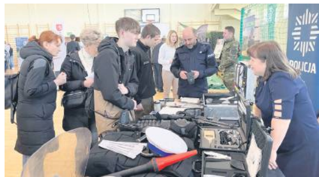
Stoiska służb mundurowych cieszyły się dużym zainteresowaniem młodzieży.