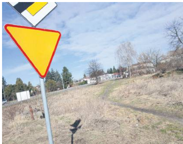
Na tej działce stał kiedyś młyn Bolesława Badziana. Później miała w tym miejscu powstać stacja paliw, a teraz market. Skończyło się na pomysłach.

Chodzi o działkę po młynie przy ul. Lubelskiej, gdzie od 1913 r. do lat 70. ubiegłego