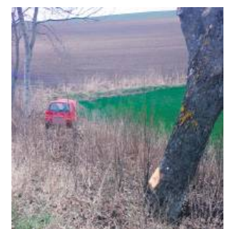
Policjant w czasie wolnym od służby zatrzymał nietrzeźwego kierowcę.

Kierownik Posterunku Policji w Dołhobyczowie w niedzielę 30 marca był świadkiem niebezpiecznego zdarzenia. Nie był wtedy na służbie. Gdy przejeżdżał przez miejscowość Suszów