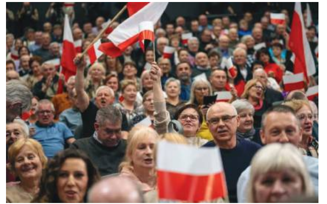
Na spotkaniu pojawiło się wielu sympatyków Prawa i Sprawiedliwości.