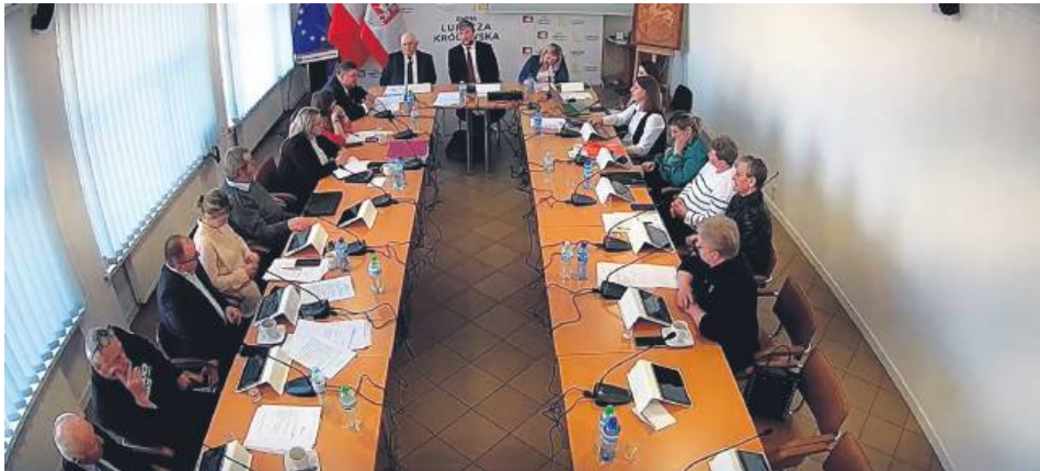
W ubiegłym tygodniu problem wybrzmiał na sesji rady miejskiej.

Tzw. Ustawa Kamilka, czyli nowelizacja Kodeksu rodzinnego i opiekuńczego, weszła w życie 15 lutego 2024 r. Obowiązek wprowadzenia wymienionych w ustawie standardów ochrony małoletnich miał być zrealizowany do 15 sierpnia 2024 r. Ustawa została uchwalona w odpowiedzi na tragiczną śmierć 8-letniego Kamilka z Częstochowy, który zmarł w wyniku brutalnego znęcania się przez ojczyma. Wprowadzone przez nią przepisy nakładają obowiązek stosowania standardów ochrony małoletnich we wszystkich placówkach, które pracują z dziećmi. Zatrudnione w tych placówkach osoby muszą przedstawiać zaświadczenie o niekaralności z Krajowego Rejestru Karnego. Przepisy wprowadzają systemową ochronę najmłodszych przed skrzywdzeniem, w tym regulacje dotyczące sytuacji, w których poniosły one śmierć lub doznały ciężkiego uszczerbku na zdrowiu na skutek działań rodzica albo opiekuna. (źródło: gov.pl)