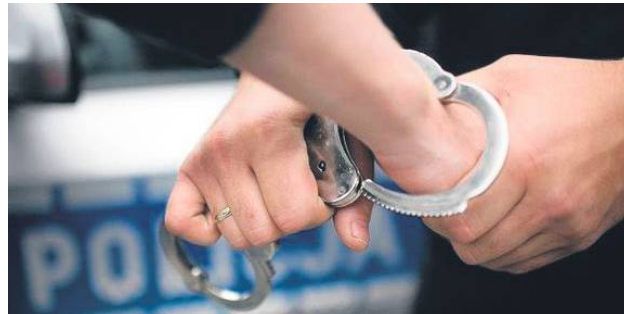
Prokuratura zastosowała dozór dla 17-latkę z gm. Łaszczów za rozbój i uszkodzenie ciała kolegi ze szkoły.

Pierwszy incydent zdarzył się 11 marca przy jednym z sklepów w Tomaszowie Lubelskim. 17-latek podszedł do