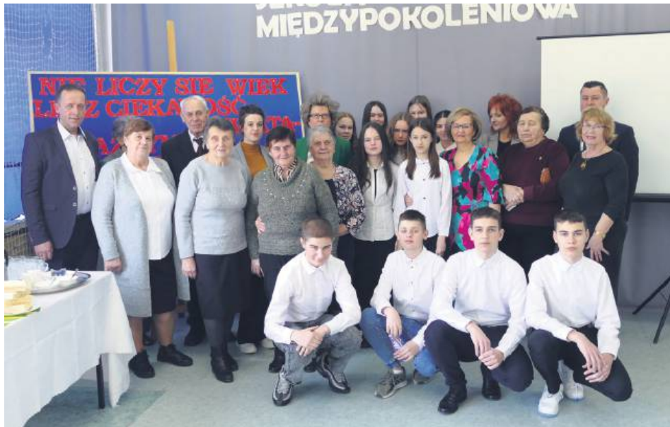
Udział w projekcie przyczynił się do wielu korzyści dla obu stron.

W ramach projektu zorganizowano warsztaty komputerowe