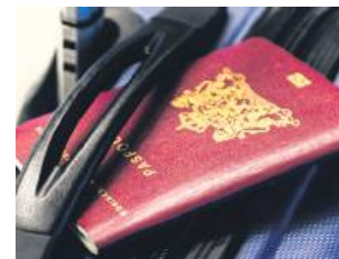
Najpóźniej w czerwcu wniosek o paszport będzie można złożyć w Biłgoraju.

Okazuje się, że wszystkie formalności zostały dopięte, a mieszkańcy niebawem będą mogli korzystać z udogodnień. Jak poinformowała Małgorza-