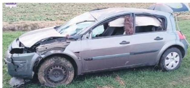
Kierowca samochodu na szczęście wyszedł z kolizji cały i zdrowy.