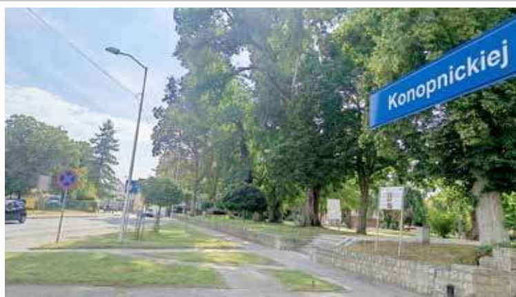
Będzie remont na Konopnickiej

Według dokumentacji przetargowej zakres zamówienia zakłada wymianę nawierzchni jezdni ulicy Marii Konopnickiej w Goleniowie obejmującej odcinek drogi od skrzyżowania z ulicą Szczecińską do skrzyżowania z ulicą Generała W. Andersa o