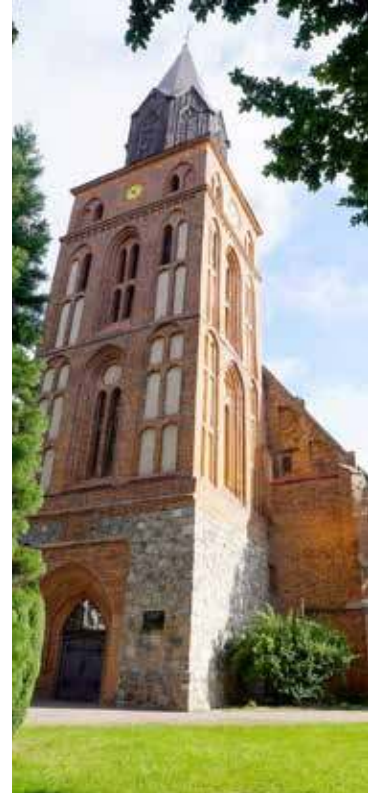
Kościół MB Częstochowskiej w Maszewie

Remont pozwoli zachować kościół w dobrym stanie i ochronić jego historyczną wartość dla przyszłych pokoleń.