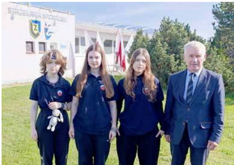
Zawodnicy TARCZY Goleniów z trenetrem

cji 50 m karabin sportowy 3x20 strzałów (trzy postawy) zajęła VII miejsce, w Konkurencji 50 m karabin sportowy 40 strzałów leżąc zajęła VIII miejsce, zaś w konkurencji 10 m karabin pneumatyczny zajęła XI miejsce.