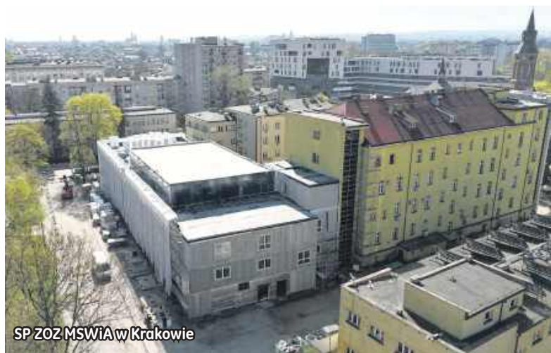
SP ZOZ MSWiA w Krakowie

Firma Climatic, która otrzymała „Żelazne Skrzydła Biznesu” w kategorii Ostrowiecka Innowacyjna Firma Roku, realizuje kolejne inwestycje medyczne w technologii modułowej, pokazując, że szybkie tempo budowy może iść w parze z wysokimi wymaganiami jakościowymi i funkcjonalnymi. Najnowsze projekty w Krakowie i ukraińskich Brodach pokazują, jak prefabrykacja zmienia sposób prowadzenia inwestycji w ochronie zdrowia – zarówno w stabilnych warunkach, jak i tam, gdzie infrastruktura musi odpowiadać na sytuacje nadzwyczajne.