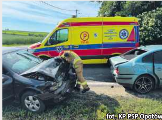
fol. KP PSP Opatów

-Ze wstępnych ustaleń wynika, że 27-latka kierująca pojazdem marki Seat nie zachowała należytej odległości od poprzedzającego pojazdu marki Volkswagena, kierowanego przez 22-latkę, która w tym czasie wykonywała manewr skrętu w lewo i doprowadziła do zderzenia pojazdów -mówi st. asp. Katarzyna Czesna -Wójcik , oficer prasowy KPP w Opatowie. Obie kierujące pojazdami biorącymi udział w tym zdarzeniu drogowym, były trzeźwe. Obie zostały odwiezione do szpitala. W działaniach ratowniczych uczestniczyli strażacy: zastęp z JRG w Opatowie oraz Osp Stodoły