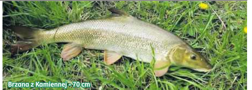
Brzana z Kamiennej - 70 cm

Pamiętam czasy, gdy na stronie wędkarskiej w Gazecie Ostrowieckiej o samej górze były opisane okresy i wymiary ochronne. Tak, były jednakowe dla całej Polski. Było to bardzo proste. Wszystkie ryby miały takie same. I potem przyszedł czas na pięknie nazwane obostrzenia. Jednym z Okręgów, który to zastosował jako pierwszy, był Tarnobrzeski. Od razu w to wszedłem, bo jestem jego sąsiadem. Potem Kielecki nie pozostał dłużny i teraz nie da się porównać, który ma ich więcej? Dodam,