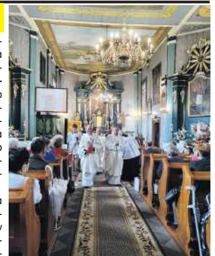
Fotorelacja na www.ostrowiecka.pl

Po zakończeniu uroczystości na wszystkich czekały pyszne wypieki przygotowane przez mieszkańców sołectwa należących do Parafii pw. Zaślubin Najświętszej Marii Panny w Rudzie Kościelnej. /jbo/