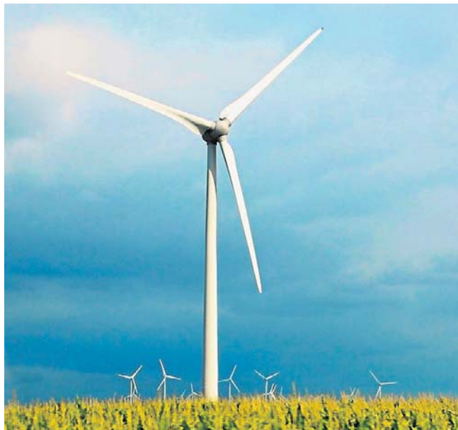
OZE to dziś także kwestia bezpieczeństwa państwa

W debacie publicznej regularnie powracają te same argumenty przeciwników energetyki wiatrowej. Najczęściej dotyczą hałasu, wpływu infra-