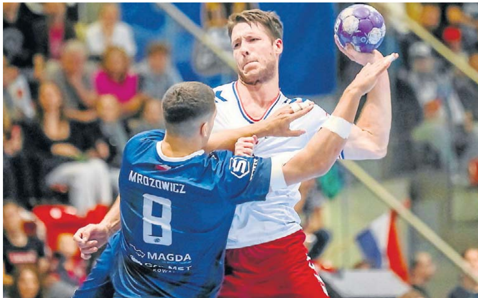
Gdańskie PGE Wybrzeże może stanąć na podium mistrzostw Polski po 25 latach!

Co najmniej 6300 widzów zasiądzie na wygodnych fotelach Ergo Areny, aby oglądać na żywo wielki rewanż PGE Wybrzeża Gdańsk z KPR-em Ostrowią. Klub z Gdańska zgłosił imprezę na maksymalnie 8800 osób, więc warto się pospieszyć, aby nabyć bilety online. Tradycyjne kasy biletowe w obiekcie na granicy Gdańska i Sopotu czynne będą w dniu meczowym od godz. 16. Bilety (zostały do wyboru w zasadzie górne kondygnacje) kosztują 10