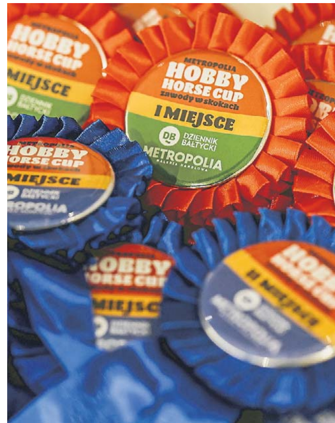
Pamiątkowe flo dla zwycięzców