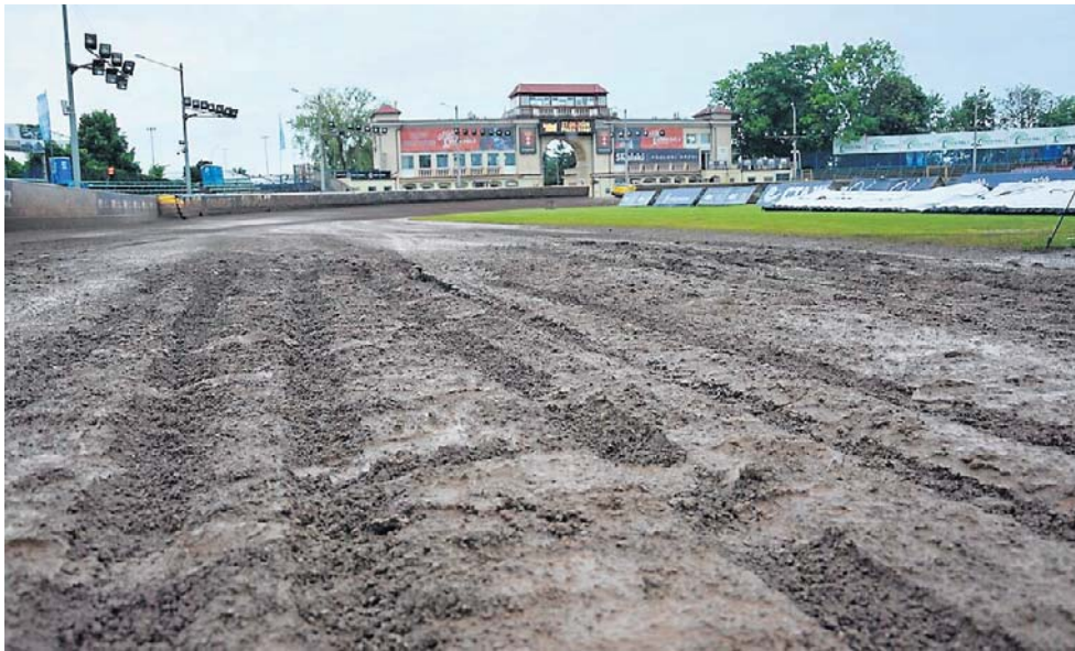
Krótki mecz w Gdańsku miał niespodziewany przebieg. Karty rozdawał... deszcz

Te warunki były przykre do oglądania. Żużlowcy mieli wielki problem, aby nie ryzykować zdrowiem. Sędzia zdecydował się więc przerwać zawody z racji tego, że siąpiący deszcz nie ułatwiał niczego.