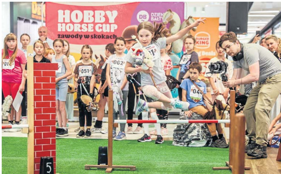
Dyscyplina łączy elementy klasycznego jeździectwa, gimnastyki i lekkiej atletyki

Wybrany model można zamówić w wyspecjalizowanym sklepie lub wykonać go samo-