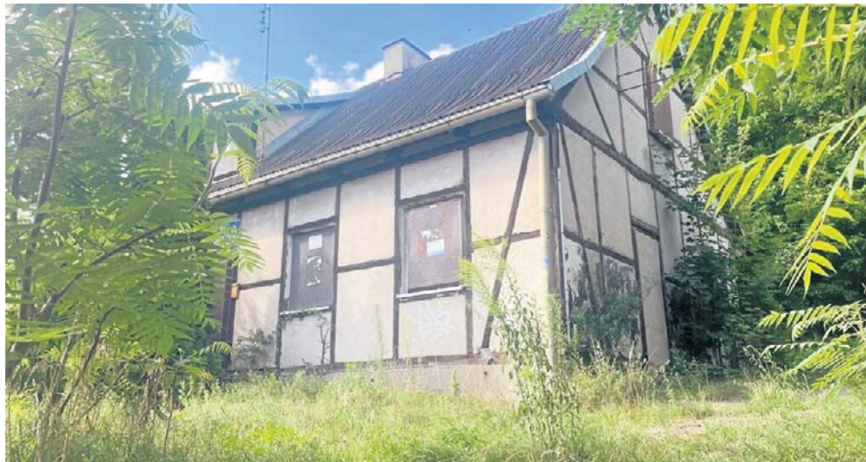
Dom szachulcowy na Oksywiu jest jednym z ostatnich materialnych śladów początków budowy Portu Gdynia i miasta

Jak przekonują społecznicy z Głosu Oksywia, którzy wraz z Towarzystwem Krajobraz Oksywie oraz Radą Dzielnicy Oksywie aktywnie starają się o uchronienie tego obiektu - jego utrata będzie oznaczać utratę „jednego z ostatnich materialnych śladów początków budowy Portu Gdynia i miasta”. Dom szachulcowy miał być bowiem miejscem zamieszkania kierownika żwirrowni, która była częścią początków rozwoju Gdyni.