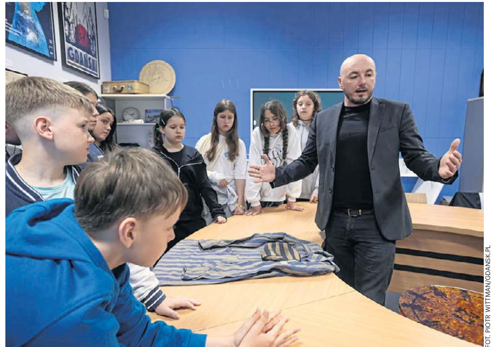
Nie wiadomo, jak pasiak trafił do szkoły nr 27. W odkrycie tajemnicy zaangażowali się uczniowie i nauczyciele