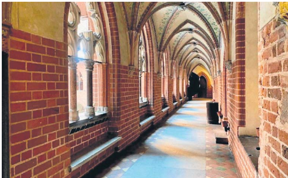
Wykonawca ma pięć miesięcy na odrestaurowanie krużganków południowego (na zdjęciu) i wschodniego. Przed nim m.in. misterna praca przy malowidłach sufitowych

Zamek Wysoki jest w kompleksie dzisiejszego Muzeum Zamkowego w Malborku tą częścią, którą Krzyżacy zaczęli budować najwcześniej, bo w latach 70. XIII wieku jako klasztor. Od tamtego czasu cztery krużganki przechodziły burzliwe koleje losu, tak jak cała warownia. W opracowaniu przygotowanym na potrzeby planowanych prac konserwatorskich Muzeum Zamkowe przypomina, że uszkodzenia spowodowane warunkami atmosferycznymi pojawiały się już w drugiej połowie XV wieku, gdy twierdza należała do Rzeczypospolitej, potem także w okresie „potopu szwedzkiego”. Największa dewastacja nastąpiła po I rozbiórce Polski, gdy decyzją władz pruskich Zamek Wysoki zamieniono w garnizon wojskowy i magazyny. Wówczas okna krużganków zo-