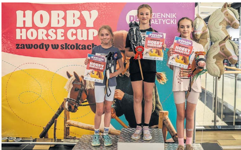
Pasjonatki hobby horsingu na podium

dzielnie, wykorzystując po prostu kawałki różnorodnych tkanin. Kilka dziewczynek podjęło się tego zadania - dzięki pomocy bliskich stworzyły zwierzątka, które są wyjątkowe. Podczas warsztatów zaplatały im kolorowe warkoczyki, ozdabiały koralikami.