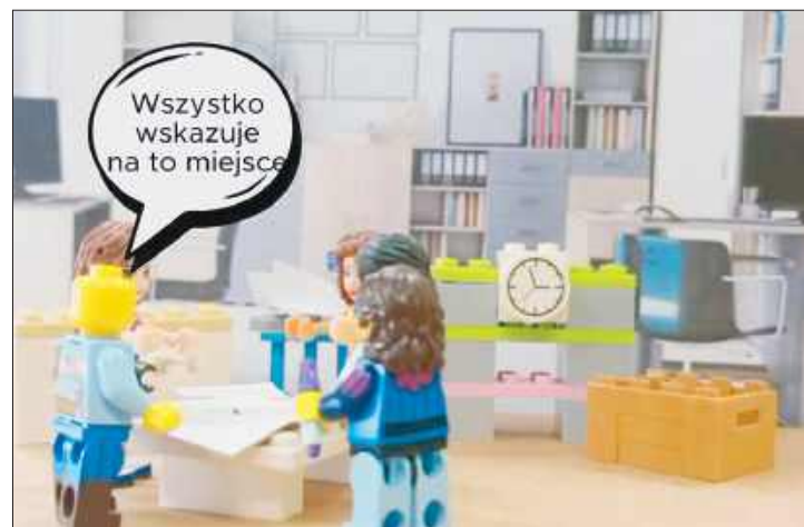
KADR Z NAGRODZONEJ ETUDY