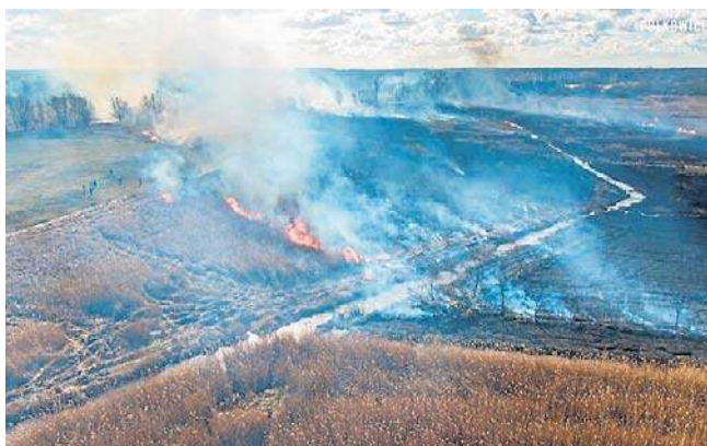
Zdjęcie górne-Kamieniec Ząbkowicki, dolne - Chocianów