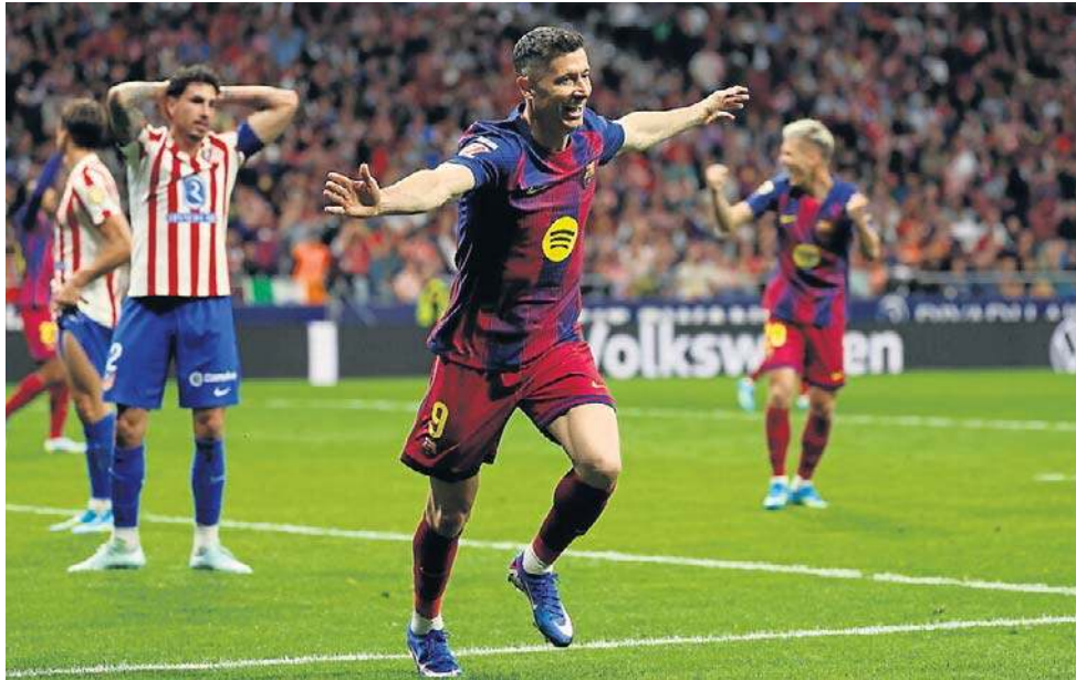
Robert Lewandowski pogrążył Atletico Madryt w sobotnim meczu 30. kolejki LaLiga

Podstawowe elementy wielkiego wieczoru są gotowe. Niestety, składy nie będą najmocniejsze. Bramkarz Realu Madryt Thibaut Courtois pauzuje przez półtora miesiąca z po-