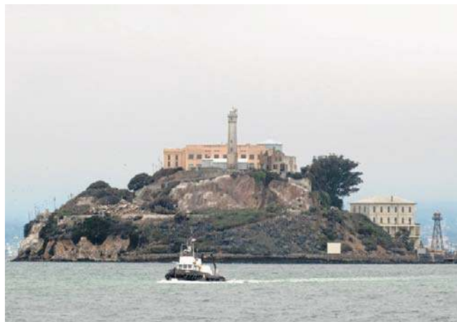
Słynne więzienie Alcatraz jest od wielu lat atrakcją turystyczną

Trump zwrócił się o środki na „przywrócenie Alcatraz jako nowoczesnego i bezpiecznego zakładu karnego”, przy czym podana kwota ma pokryć koszty pierwszego roku. Więzienie o zaostrożnym rygorze na wyspie zostało zamknięte w 1963 roku. Obecnie znajduje się pod zarządem Służby Parków Narodowych i służy jako obiekt turystyczny.