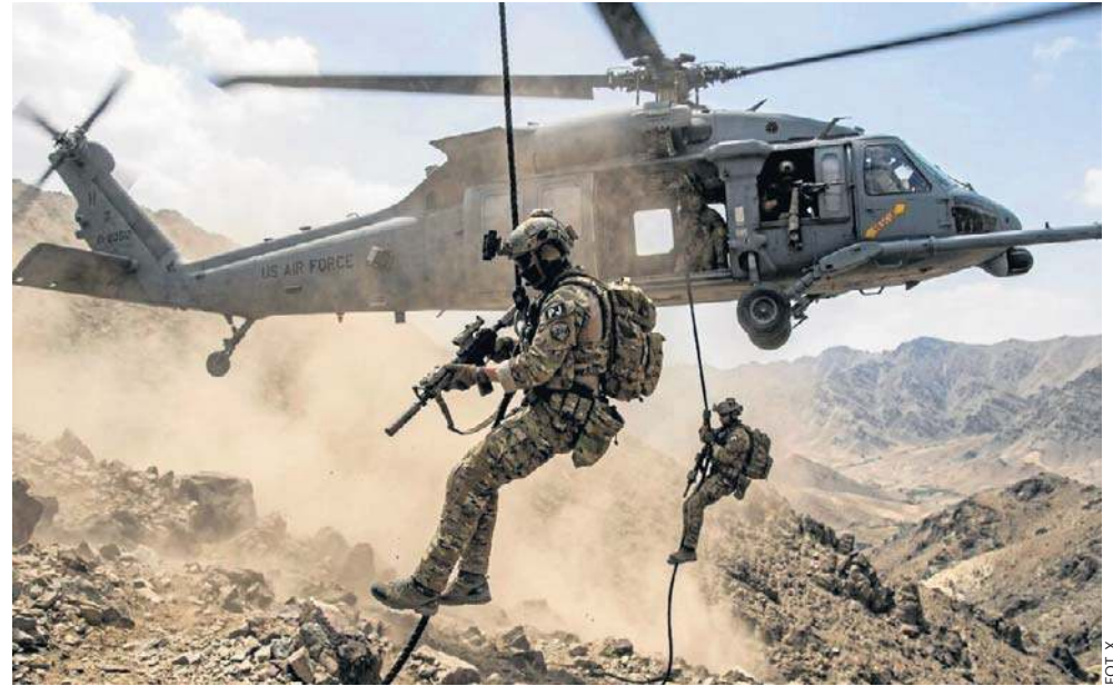
Amerykańscy komandosi zabrali pilota z górzystego terenu w głębi wrogiego terytorium

Komunikat ten, niepotwierdzony dotąd przez władze USA i niemożliwy do zweryfikowania na obecnym etapie, pojawił się krótko po informacji irańskiej Gwardii Rewolucyjnej o zniszczeniu kilku „wrogich obiektów latających” podczas amerykańskiej misji ratunkowej.