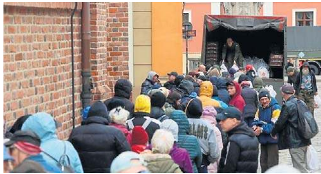
Na Ostrowie Tumskim po paczki ustawiała się długa kolejka