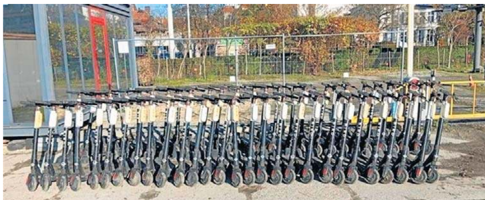
Władze przejęły 57 porzuconych hulajnóg. Chcą je sprzedać hurtem, licząc na firmę, która znów będzie je wypożyczać

Teraz ratusz chce je sprzedać. Pojazdy można oglądać 8 kwietnia w g. 11:00 - 13:00, na terenie parkingu strzeżonego przy Pl. Grunwaldzkim nr 30 we Wrocławiu, po wcześniejszym umówieniu się pod numerem telefonu: 71 777-95-20 lub 71 777-95-57 - czytamy w przetargu.