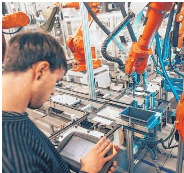
Cięcie kosztów i reorganizacja - tym firmy bardzo często tłumaczą zwolnienia. Sąd może jednak przywrócić zwolnionego do pracy

- Sąd nie analizuje, czy reorganizacja była potrzebna z punktu widzenia bizneso-