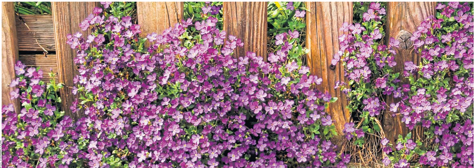
Kwitnie na biało, różowo, fioletowo. Nadaje się na skalniaki, ale też zwykłe rabaty i ich obwódki