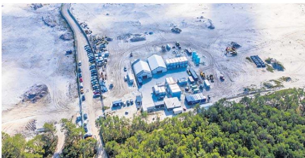
Budowa elektrowni jądrowej w gminie Choczewo wchodzi w kolejny etap

Ponadto wybudowana ma być kanalizacja oraz instalacje