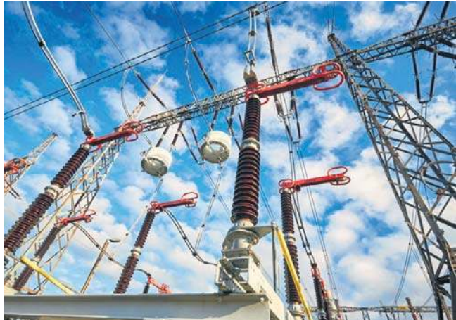
Stacja elektroenergetyczna Błonia zmodernizowana zostanie na potrzeby nowej elektrowni w Gdańsku