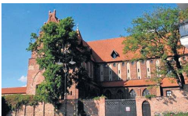
Wielki projekt Muzeum Zamkowego dotyczy zamku, ale też sąsiadującym z nich współczesnych lokali

Obecnie trwają przygotowania do ogłoszenia nie jednego, lecz dwóch przetargów na generalnych wykonawców. Trzeba bowiem podkreślić, że