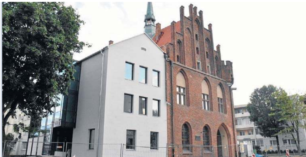
Sredniowieczny Ratusz Staromiejski z XX-wieczną dobudówką na biało

- Fajnie, po wielu latach zrobiliśmy ten remont, ale chodzi o kolor dobudówki. Spoglądałem na te piękne szyby, okna i byłem przekonany, że jak zostanie zdjęte rusztowanie, to tam będziemy mieli odpo-