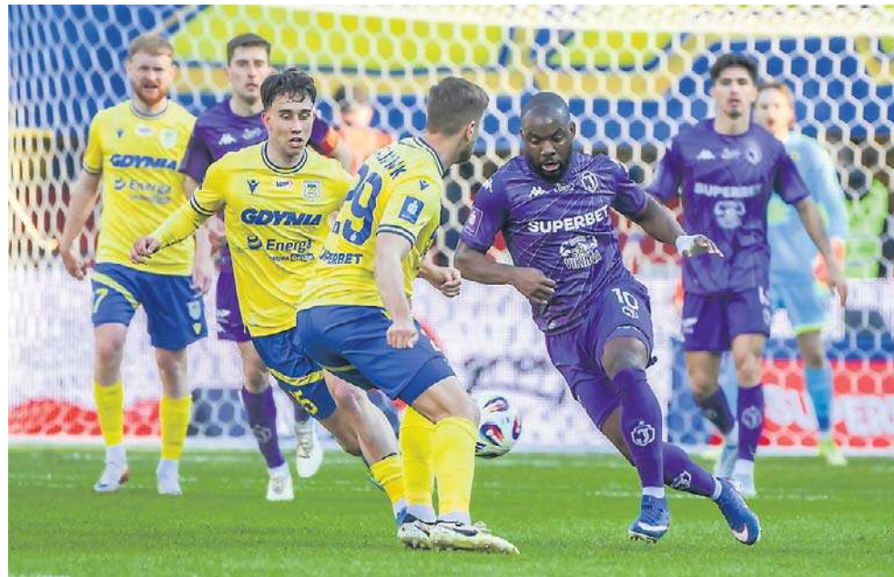
Żółto-niebieski beniaminek PKO Ekstraklasy zainkasował „jedyń” 9 214 064,74 zł

Ekstraklasa SA hojnie rozdawała pieniądze za sezon 2025/2026, a suma rozliczeń z klubami zamknęła się kwotą 301,1 mln złotych.