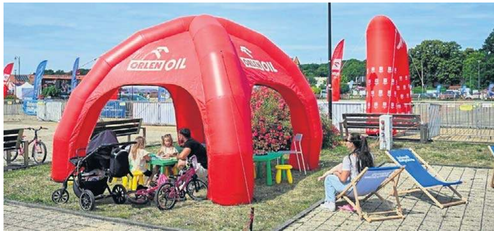
W namiocie Orlen Oil będzie można wziąć udział w warsztatach plastycznych