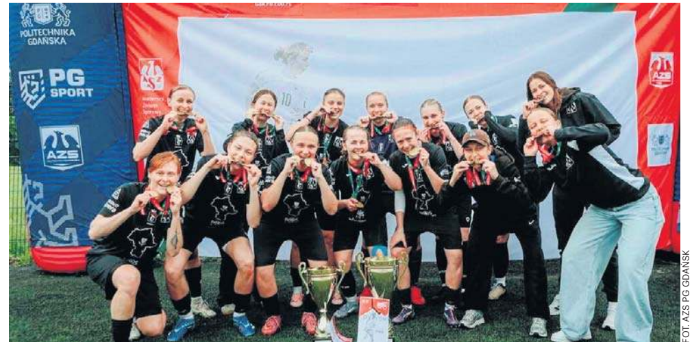
Piłkarskie Akademickie Mistrzostwa Polski zorganizowane były w Gdańsku

- Wynik osiągnięty przez reprezentację Politechniki Gdańskiej przyjmujemy z dużą satysfakcją i dumą. Po historycznych i rekordowych sześciu zwycięstwach z rzędu w klasyfikacji generalnej zajęliśmy drugie miejsce, ustępując wyłącznie Uniwersytetowi Warszawskiemu, z którym walczyliśmy do ostatnich tegorocznych zawodów. Wiemy, jak wymagająca jest to rywalizacja i jak trudno przez lata utrzymać miejsce w ścisłej czołówce sportu akademickiego w Polsce. Dlatego każdy kolejny wynik na podium traktujemy jako bardzo ważne osiągnięcie, potwierdzające konsekwentną pracę studentek i studentów, trenerów oraz Centrum Sportu Akademickiego PG - mówi prof.