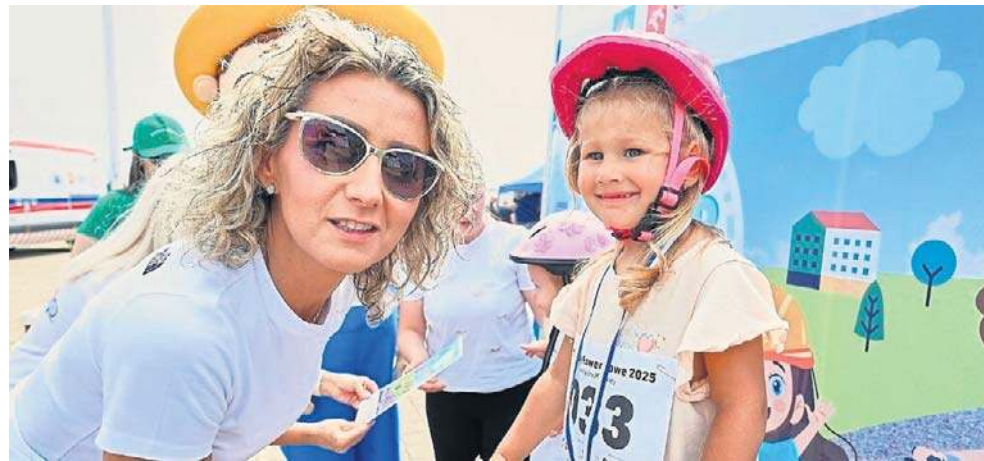
Każde dziecko stanie na prawdziwym podium, otrzyma pamiątkowy dyplom oraz medal

KRYNICA MORSKA SZYKUJCIĘ FORMĘ I REZERWUJCIĘ CZAS NA NIEZAPOMNIANĄ, WAKACYJNĄ PRZYGODĘ!