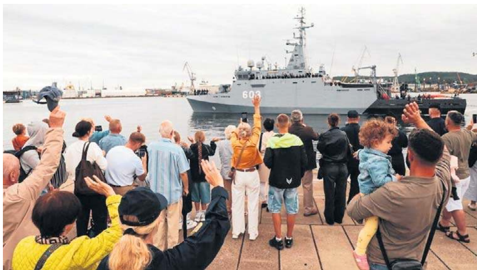
W Gdyni pożegnano ORP Mewa. Okręt Marynarki Wojennej wypłynął na misję PKW Kormoran 2026

Polscy marynarze będą również patrolować szlaki komunikacyjne i oczyszczać podejścia do portów w wyznaczonym rejonie działań. Jednostki stały