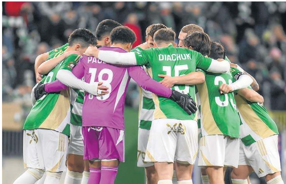
Lechia Gdańsk z Ekstraklasy otrzymała łącznie 11 666 098,42 złotych