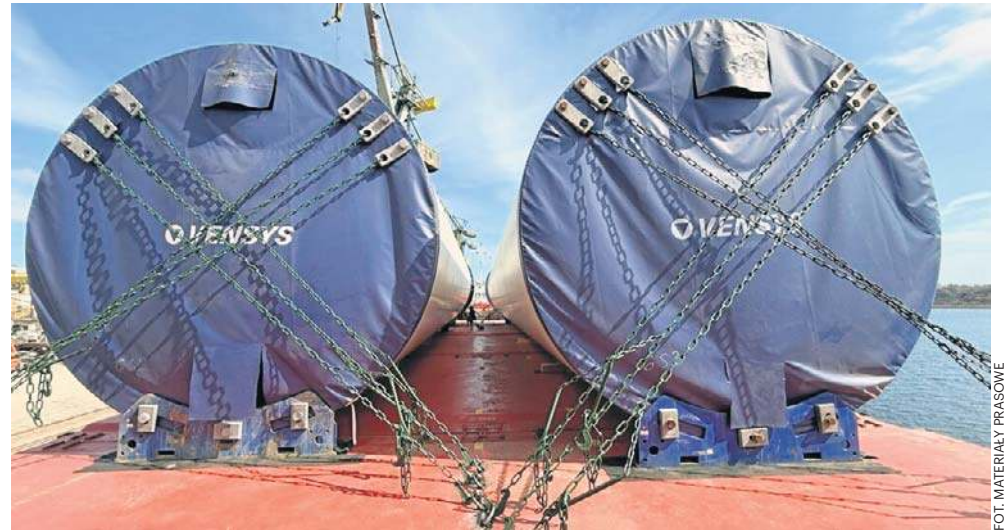
Wieże farm wiatrowych w 80 proc. wykonane z krajowych materiałów i komponentów

Integralnym elementem realizacji była również kompleksowa obsługa procesu dostawy. Załadunek, organizacja transportu oraz dostarczenie gotowych konstrukcji do klienta w niemieckim Husum zostały zrealizowane przez Stocznnię Gdańską. Spółki GPB zrealizowały cały proces - od produkcji i wyposażeń konstrukcji, przez zarządzanie logistyką, aż po dostawę gotowych komponentów do odbiorcy.