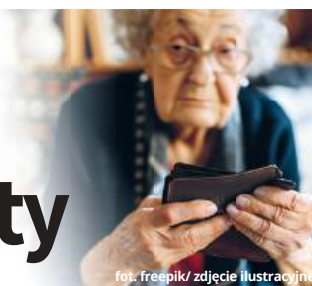
fol. freepik/ zdjęcie ilustracyjne

Pod koniec sierpnia w Zakładzie Ubezpieczeń Społecznych ruszy wypłata tzw. czternastek dla emerytów i rencistów. Do większości z nich pieniądze trafią jednak we wrześniu. ZUS wypłaci je z urzędu, czyli nie trzeba składać w tej sprawie żadnych wniosków.