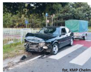
fort. KMP Chełm

● POW. CHEŁMSKI W piątek (15 sierpnia) w Sawinie 65-letni pijany kierowca saaba z przyczepką, wyjeżdżając z drogi podporządkowanej, doprowadził do zderzenia z fordem, za którego kierownicą siedział 50-latek. W wypadku poszkodowanych zostało kilka osób, w tym dzieci. Sprawca miał ponad promil alkoholu w organizmie.