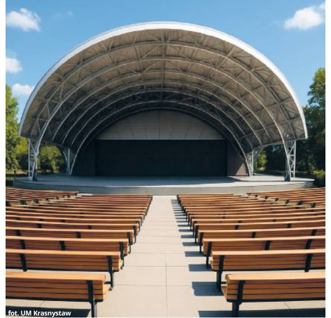
fol. UM Krasnystaw

zacja amfiteatru ma być etapowa. Najpierw powstanie sam obiekt, przewidziany na około 2 tysiące miejsc, z zadaszeniem, łozami VIP, pełnym zapleczem i strefą gastronomiczną. W dalszej kolejności planowane jest zagospodarowanie okolicznego terenu Zaułka Nadrzecznego wraz z linią brzegową rzeki Wieprz. Mieszkańcy będą mogli korzystać z zielonego zaułka z ławkami i leżakami, pergoli, miejsca na grilla i ogni-