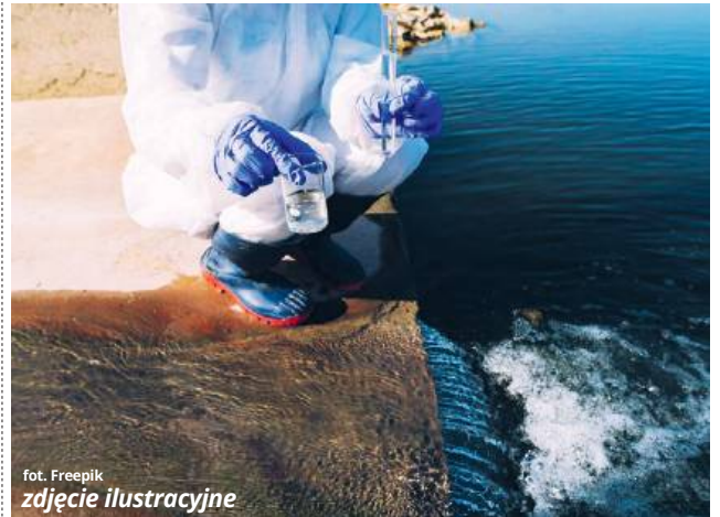
fol. Freepik zdjęcie ilustracyjne

Tymczasem urzędnicy ocenili, że modernizacja instalacji wiązałaby się tak naprawdę z potrzebą wykonania zupełnie nowej instalacji, a co za tym idzie, przedsięwzięcie pociągnęłoby za sobą znaczne koszty. W czasie kolejnych już rozmów w tej samej sprawie zaproponowano więc, że gmina postara się o zmianę nieruchomości z nadleśnictwem i przekaze działkę w dzierżawę lub w czyste użytkowanie mieszkańcom bloków. Co jednak ważne, podjęcie starań związanych