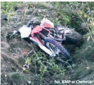
fol. KMP w Chełmie

- Skierowani na miejsce policjanci ustalili wstępnie, że kierujący motocyklem typu cross 22-latek stracił panowanie nad pojazdem, w wyniku czego zjechał z drogi i uderzył w drzewo. Z obrażeniami ciała został przewieziony do szpitala. Badanie stanu trzeźwości