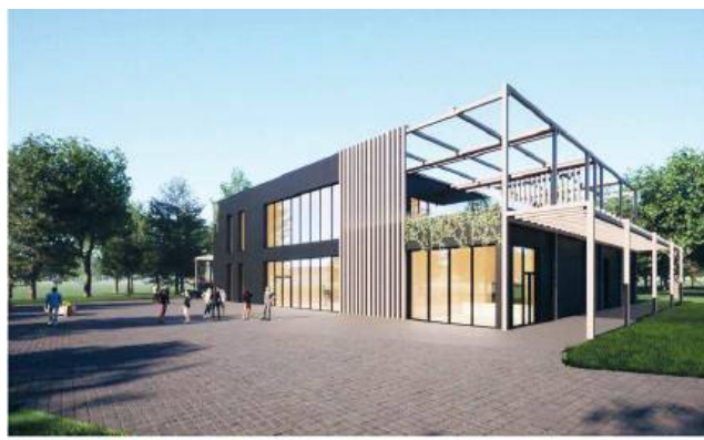
WIDOK NA BUDYNEK USŁUGOWY - ELEWACJA FRONTOWA