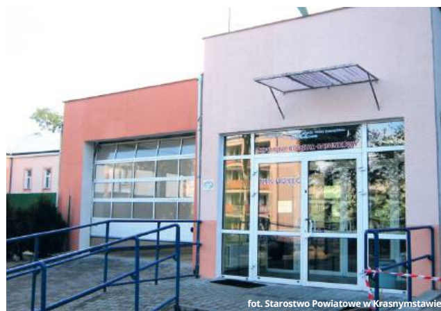
fol. Starostwo Powiatowe w Krasnymstawie

Zakres prac obejmie adaptację i modernizację pomieszczeń Działu Radiologii i Diagnostyki Obrazowej, w których zostaną zainstalowane nowoczesne urządzenia: tomograf komputerowy najnowszej generacji oraz