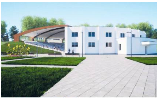
WIDOK NA AMFITEATR OD STRONY BRAMY WEJŚCIOWEJ

Projekt obejmuje m.in. budowę centrum edukacji ekologicznej z restauracją, salami konferencyjnymi i wypożyczalnią nart. Powstaną także tętnie solankowe, trasa spacerowa wśród koron drzew, dwa stoki narciarskie, wodny i tradycyjny plac zabaw, zadaszony amfiteatr, ścieżki edukacyjne, a także