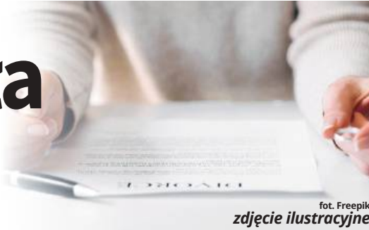
fol. Freepik zdjęcie ilustracyjne

Na co dzień dbają o powierzone im samorządy, ale jak radzą sobie z zarządzaniem własnymi zasobami? Przeglądamy się oświadczeniem majątkowym wójtów z terenu powiatu chełmskiego. To część pierwsza przygotowanego przez nas przeglądu.