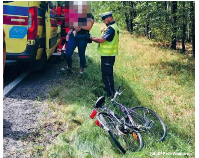
fol. KPP we Włodawie

● GMINA WYRYKI To mogło się skończyć tragicznie!