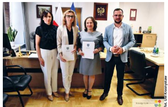
fol. UM Krasnystaw

Nauczycielki zobowiązały się do rzetelnego pełnienia swoich obowiązków, dbania o rozwój uczniów i własny, a także wychowywania młodego pokolenia