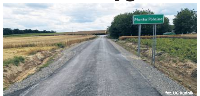
fol. UG Rudnik

- Prowadzone prace obejmowały m.in.: roboty ziemne, wykonanie odwodnienia wraz ze