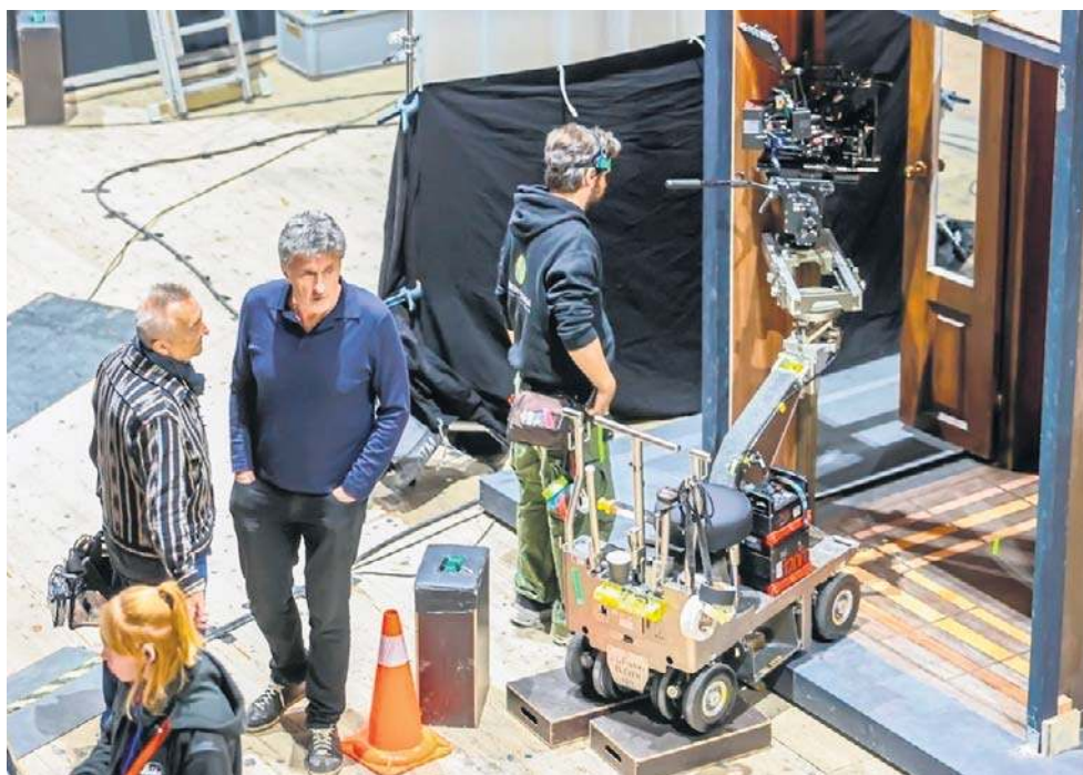
Zdjęcia do filmu były już kręcone w Legnicy, Bielawie, Wrocławiu i w okolicach Kłodzka.

Reżyser „Idy” i „Zimnej Wojny” przeniesie nas do 1949 roku. Na ekranie zobaczymy aktorów Hansa Zischlera i Sandrę Hüller, która wcieli się w rolę jego córki Sandry. Nominowana była do Oscara za „Anatomię upadku”. Towarzyszyć im będą m.in.: August Diehl, Devid Striesow i Theo Trebs.