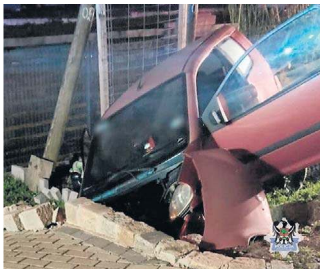
Pijany kierowca wjechał autem do przydrożnego rowu, przez co jego 62-letnia pasażerka trafiła do szpitala.

Przed północą policjanci skontrolowali stan trzeźwości mężczyzny, kierującego hulajnogą elektryczną na ul. 11 Listo-