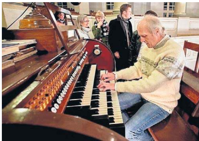
Wałbrzyska scena będzie kręcona w tutejszym Kościele Zbawiciela. I będzie to największa scena w całym filmie.

Film nie będzie opowiadał o życiu Manna, a o pierwszej powojennej podróży pisarza do Niemiec. Wszystko u progu zimnej wojny i podzielonych Niemiec. Obraz będzie czarno-biały i w języku niemieckim.