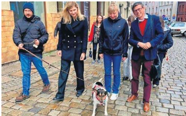
FOT. ZAMEK KSIĄŻ W WAŁBRZYSZU

Ulicami wałbrzyskiego Śródmieścia powędrowała Parada Przyjaciół Schroniska. Wszyscy byli zadowoleni!