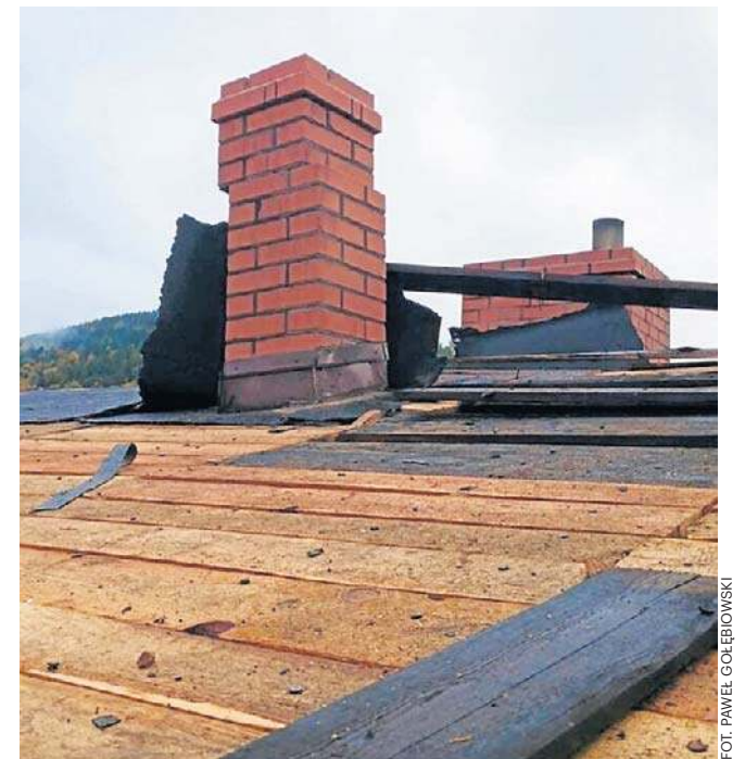
Wybuch gazu doprowadził do obrażeń u dwóch osób, zniszczył komin i uszkodził poszycie dachowe budynku.

- Obiektem zarządza prywatny zarządca, są tam mieszkania mieszane, komunalne i prywatne. Poza poszkodowaną rodziną mieszka w nim jeszcze sześć innych rodzin.