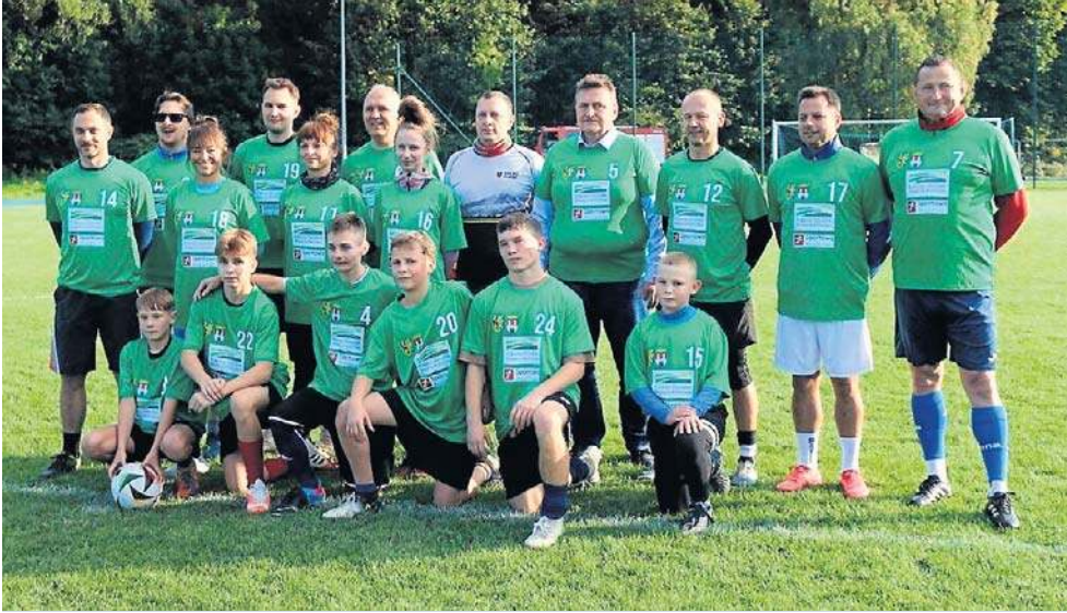
Dopisała pogoda, przyjechało wiele osób, które pragnęły jednego - wesprzeć akcję.