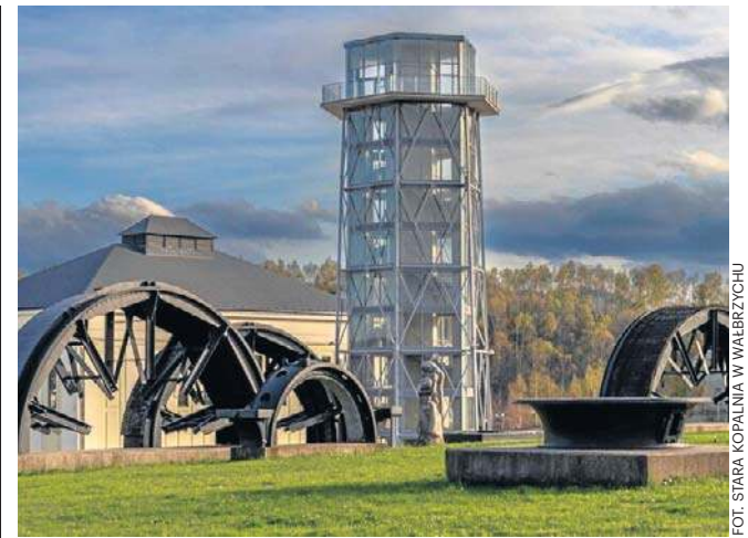
FOT. STARA KOPALNIA W WAŁBRZYCHU

Bluesowy Wałbrzych w Starej Kopalni w Wałbrzychu rozpocznie się 14 listopada o godzinie 19.00. Bilety są dostępne na internetowej stronie: www.biletyonline.starakopalnia.pl . ©