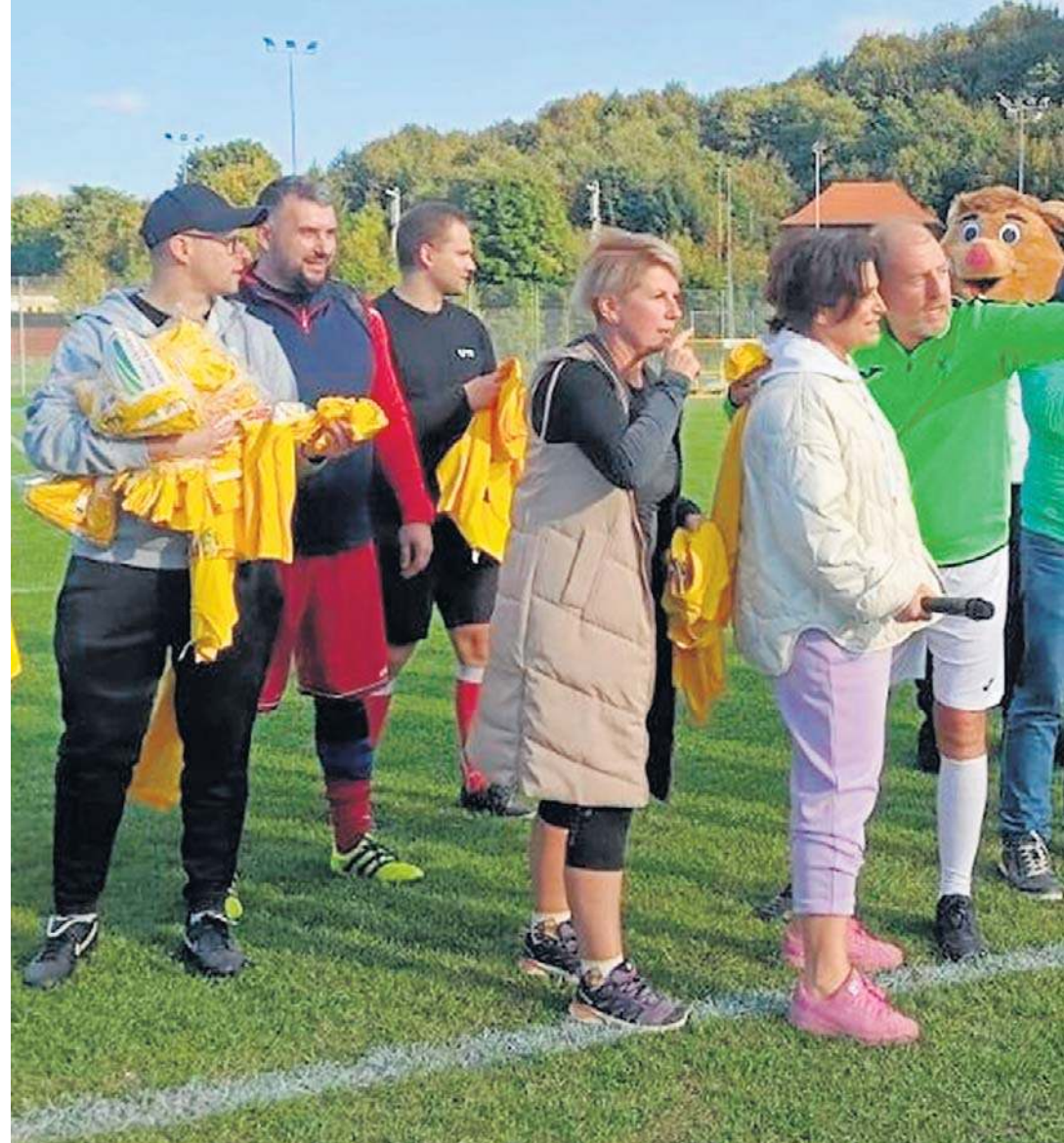
Celem charytatywnego meczu piłkarskiego w Mieroszowie było zebranie środków na wyposażenie