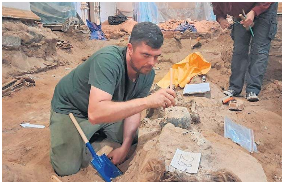
Archeolodzy datują cegłowskie pochówki od połowy XVI do połowy XVIII wieku.

Cegłów, czy też Cebrów lub Cembrów, jak go wtedy nazywano, nie należał do szczególnie znaczących miejscowości wschodniego Mazowsza. Gdzie