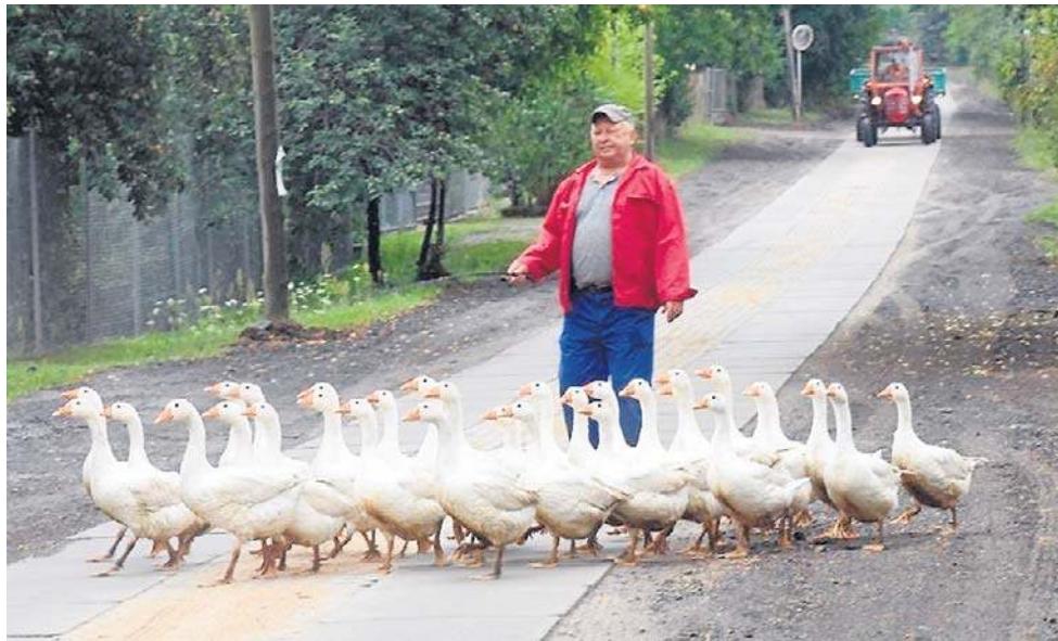
Służby apelują do rolników, aby przydomowe kury i inne ptactwo trzymać w zamknięciu.

Sześć martwych łabędzi znaleziono w zbiorniku wodnym „Jawornik” w Jaworze pod koniec września. Cztery z nich zostały przebadane pod kątem wirusa ptasiej grypy. Wynik: pozytywny. W związku z tym wojewoda dolnośląska