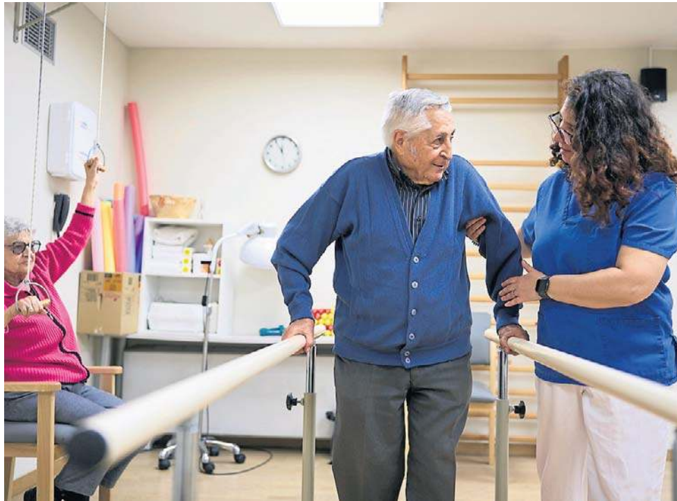
W sanatorium na NFZ możesz korzystać za darmo z wielu zabiegów.

Przeciwwskazania do pobytu w sanatorium: choroby zakaźne i pasożytnicze, choroby weneryczne, ogniska zapalne, choroby onkologiczne oraz stan po leczeniu onkologicznym, WZW, żółtaczkę, niewydolność wątroby, niewydolność krążenia i oddychania, choroby o ostrym przebiegu z przewodu pokarmowego, przepukliny, niektóre choroby psychiczne, skazy krwotoczne, zaburzenia osobowości, uzależnienie od alkoholu lub środków psychoaktywnych, choroby układu, ciężka i karmienie piersią.