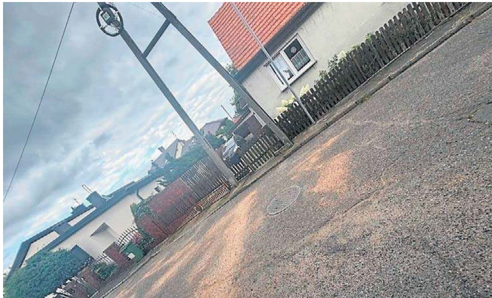
W tym miejscu rozegrała się tragedia na ulicy Cichej. Nie żyje matka dwojga dzieci.

Mężczyzna od dnia śmierci do teraz był nieuchwytny. O tym, że zniknął i jest poszukiwany pisały lokalne media. Przy jego domu znajdowały się kamery, skierowane na ulicę, gdzie doszło do tragedii.