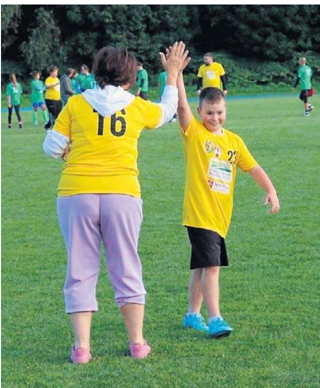
Wiek, płeć ani stopień wytrenowania graczy nie miały żadnego znaczenia. Liczyła się tylko wspólna idea.