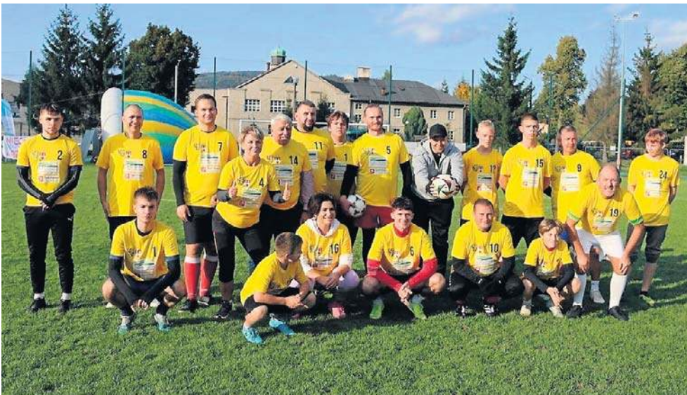
Naprzeciw siebie stanęły do towarzyskiego boju dwie drużyny - Zielonych i Żółtych.