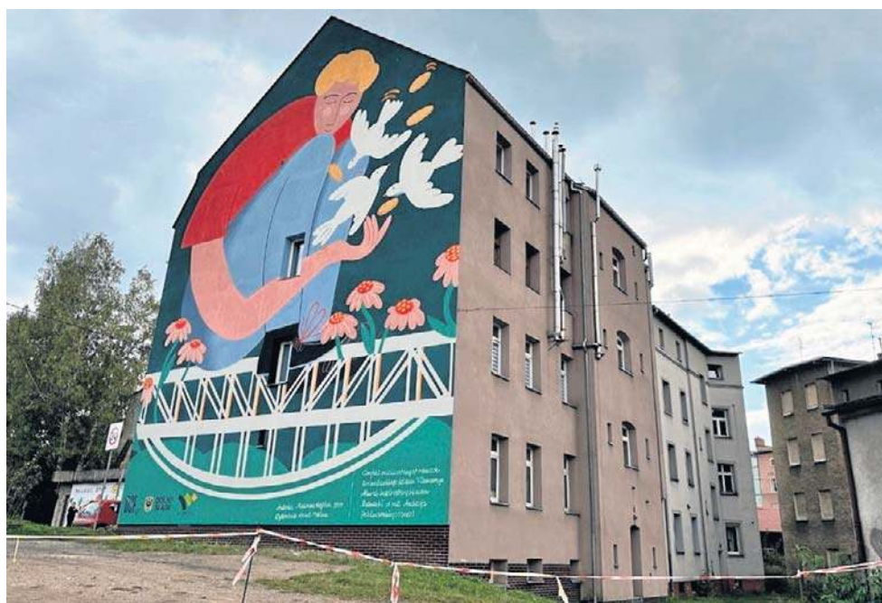
W Wałbrzychu odsłonięto nowy mural, inspirowany kultowym dziś filmem „Sztuczki”.