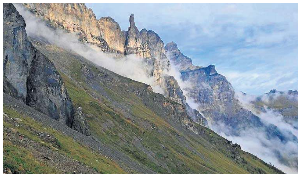
- To ogromna satysfakcja walczyć o zwycięstwo. Prawdziwa przygoda. Plusem jest czas, spędzony na rowerze, jazda w wysokogórskim terenie z pięknymi widokami - mówi.