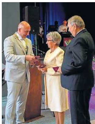
Wyróżnienia wręczyli jubilatów władze gminy.