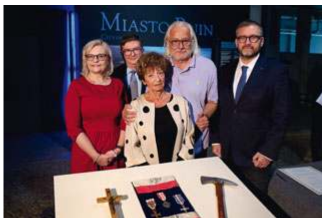
fol. mat. pras. Muzeum Powstania Warszawskiego

Oddział PWB/17 (Podziemna Wytwórnia Banknotów) powstał w 1940 r. Jego założycielem był mjr Mieczysław Chyżyński „Pełka”. Główną bazą oddziału była Polska Wytwórnia Papierów Wartościowych przy ul. Sanguszki. Od-