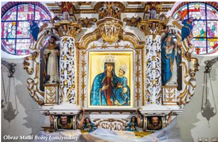
Obraz Matki Bożej Łomżyńskiej