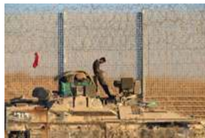
fol. PAPIEPA/Atef Saifadi