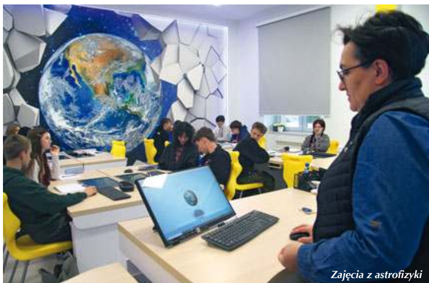
Zajęcia z astrofizyki

W szkole pracuje 83 nauczycieli i 130 innych pracowników. A 35 proc. kadry to absolwenci szkoły.