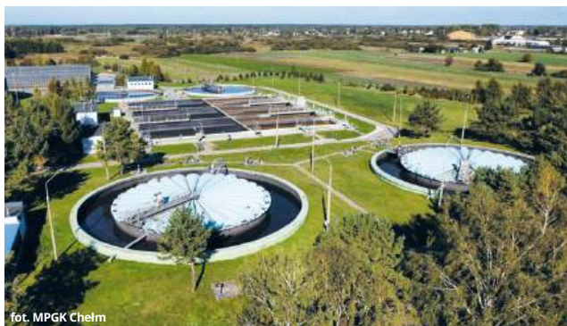
fol. MPGK Chełm