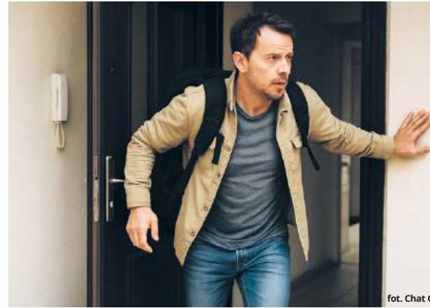
fol. Chat GPT

W momencie alarmu i konieczności ewakuacji działaj według z góry ustalonej kolejności.