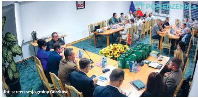
fot. screen sesji gminy Gorzków

Ta gmina może wkrótce wzbogacić się o nową formę ochrony przyrody – mowa o Kraszczadach, które zaczynają się w ostatnim czasie intensywnie rozwijać. Pomysł został przedstawiony podczas ostatniej sesji rady gminy, jednak na razie pozostaje w fazie ogólnych założeń.