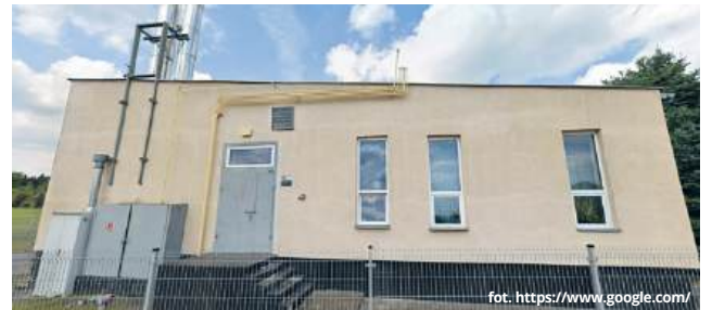
Obiekt ciepłowni miejskiej w Rejowcu Fabrycznym, która zlokalizowana jest przy ul. Wschodniej

W roku, który pojawił się na liście jako pierwszy, czyli 2014, ciepłownia wygenerowała niecałe 17 900 zł nadwyżki. W kolejnym, 2015 roku, nadwyżka ta wyniosła już nieco ponad 25 000 zł. Rok 2016 przyniósł kolejny wzrost. Z poziomu wspomnianych 25 000 zł zakład przeszedł na poziom niecałych 75 000 zł. Podobną, chociaż nieco niższą kwotę (niecałe 71 500 zł), udało się odnotować w roku 2017. Gwałtowny spadek nastąpił w roku 2018, kiedy nadwyżka wyniosła niecałe 36 600 zł. Jeszcze niższe wartości odnotowano w 2019 roku – wówczas nadwyżka wyniosła „tylko” niespełna 22 600 zł. Odbić od tego poziomu ciepłownia zdoła-