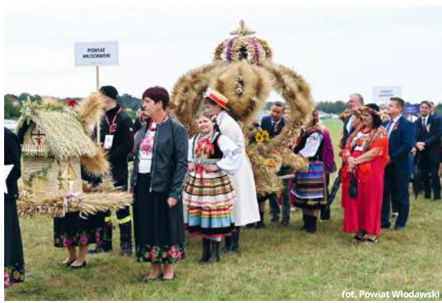
fol. Powiat Włodawski

Wyjątkowy okazał się wieniec mieszkańców Sołectwa Bobrowe z powiatu krasnostawskiego. W kategorii wieniec tradycyjny zdobył zaszczytne pierwsze miejsce.