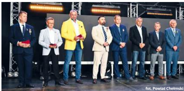
fol. Powiat Chełmski

bochenek chleba, wypieczony z tegorocznego ziarna, będący znakiem obfitości i wdzięczności za plony.