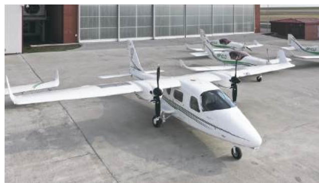
fol. PANS Chełm

uczelnia, nowa infrastruktura znacząco podniesie komfort i jakość kształcenia przyszłych pilotów oraz mechaników lotniczych, a także zwiększy niezależność operacyjną ośrodka. Inwestycja powstanie na te-