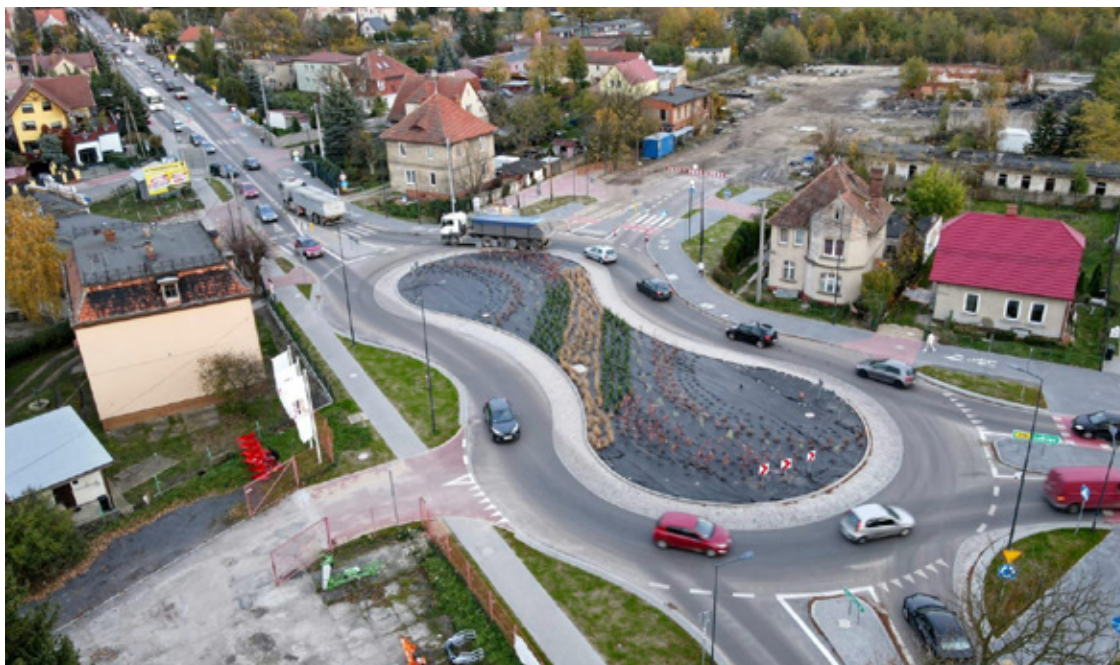
Zdjęcie archiwalne pokazujące jak dzięki zapisom w Planie powstają duże inwestycje.

Czy działka rolna będzie mogła stać się budowlaną? Czy obok domu może powstać nowe osiedle? A może przeciwnie. Część terenów straci możliwość zabudowy? Plan ogólny gminy Wołów będzie jednym z najważniejszych dokumentów wpływających na rozwój gminy w najbliższych latach. O tym, jakie zmiany przyniesie mieszkańcom, właścicielom nieruchomości i inwestorom, rozmawiamy z Anną Brodziak-Cisak, sekretarzem gminy Wołów. To druga część naszego cyklu poświęconego pracom nad nowym dokumentem planistycznym.