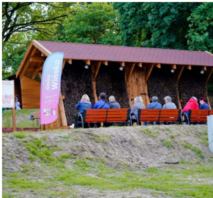
Tęźnia w Wińsku.

Radość z nowej inwestycji warto jednak zderzyć z oficjalnym stanowiskiem Głównego Inspektoratu Sanitarnego, który wydał wytyczne dotyczące małej