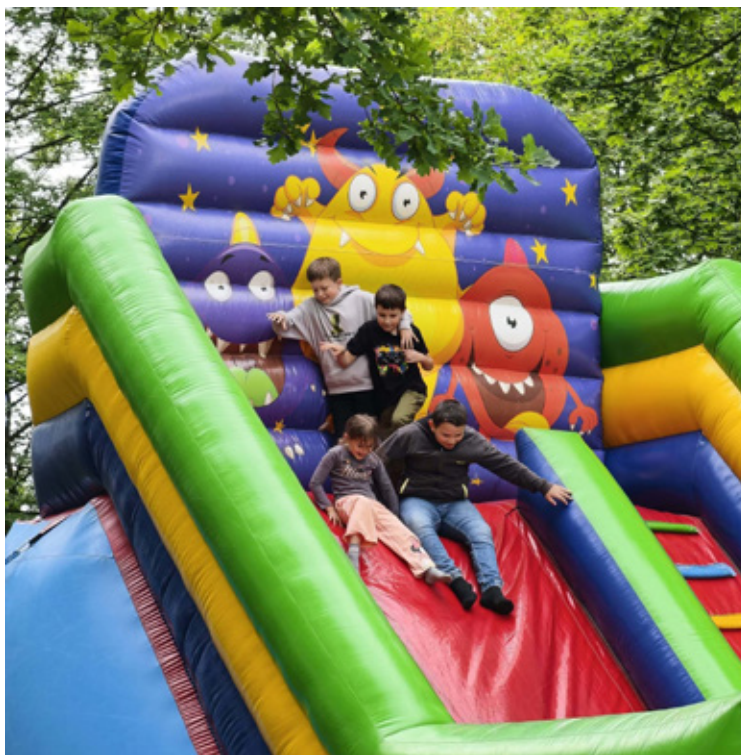
Zabawy na dmuchańcu.

coś, co chcemy dalej rozwijać. Zależy nam, aby Ośrodek w Wałach był miejscem otwartym, aktywnym i dobrze znanym lokalnej społeczności – zaznacza Widuliński.