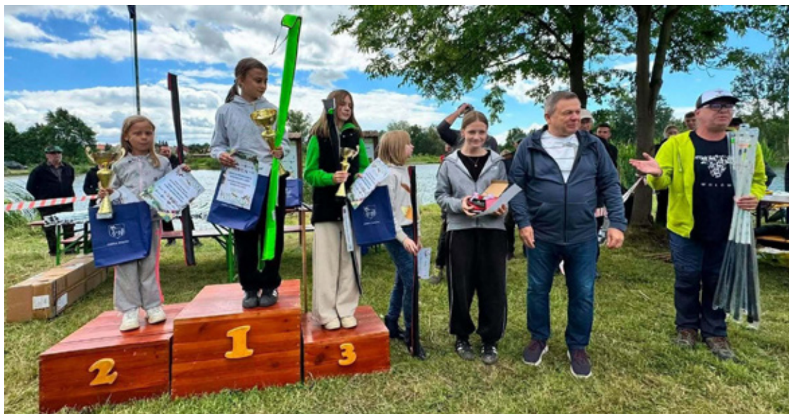
Dziewczyny- rakiety! Brawo!