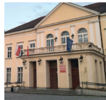
Dolnobrzezki Ośrodek Kultury.

kopercie z dopiskiem informującym o starcie w konkursie. Zgłoszenia można dostarczać do Urzędu Miejskiego w Brzegu Dolnym przy ulicy Kolejowej 29. Można to zrobić osobiście w biurze podawczym, wysłać pocztą tradycyjną lub dostarczyć elektronicznie przez ePUAP. Ostateczna data wpływu dokumentów mija 30 czerwca o godzinie 15:30. Wszystkie szczegóły oraz wzory niezbędnych oświadczeń znajdują się w Biuletynie Informacji Publicznej brzeskiego urzędu.