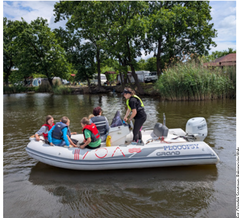
Pływanie motorówką - to jedna z atrakcji.

zajęcia i półkolonie żeglarskie dla dzieci i młodzieży, oferta dla szkół, projekty edukacyjne dotyczące bezpieczeństwa oraz kolejne wydarzenia integrujące społeczność wokół aktywności nad wodą. Co już się zadziało w minionym tygodniu. Na ośrodku pojawili się uczniowie ze szkół, kończący rok szkolny zabawą i wodnym szaleństwem. a.k.