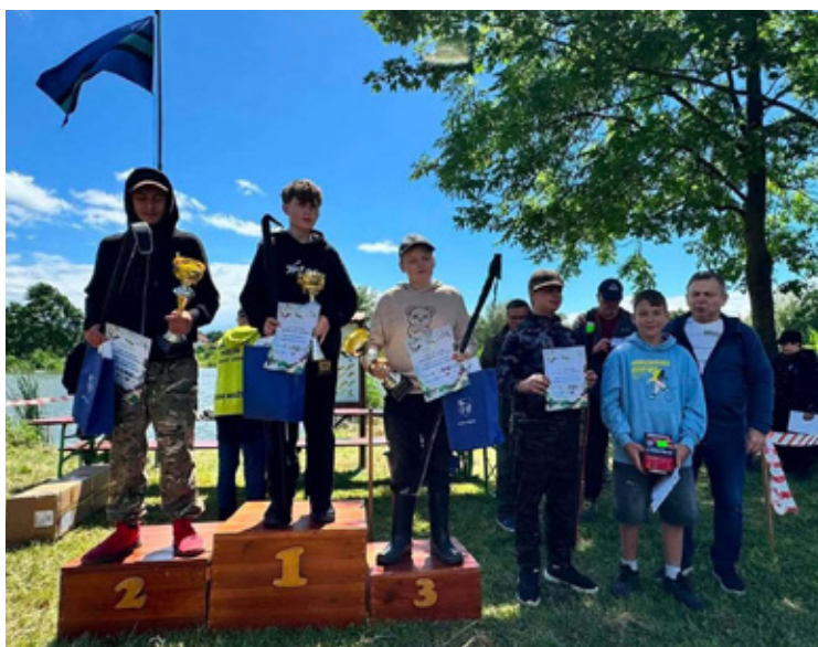
Młodzież woli wędkowanie niż smartfony.

Dla wielu najmłodszych, zwłaszcza ośmiolatków stawiających swoje pierwsze wędkarskie kroki, była to wspaniała lekcja kontaktu z przyrodą i nauki wyciszenia. Jak to w sporcie wędkar-