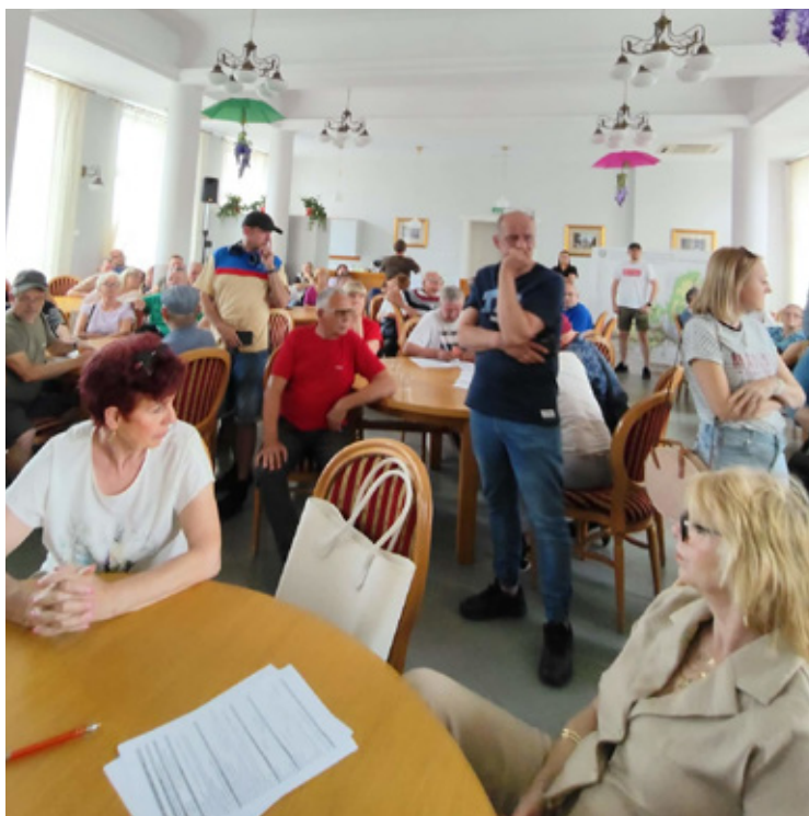
Mieszkańcy gminy złożyli swoje wnioski do Planu.

Tak, ale nie samodzielnie i nie na obecnym etapie. Plan ogólny jest dokumentem strategicznym określającym kierunki rozwoju gminy. Nie zmienia on automatycznie przeznaczenia poszczególnych działek. Aby doszło do