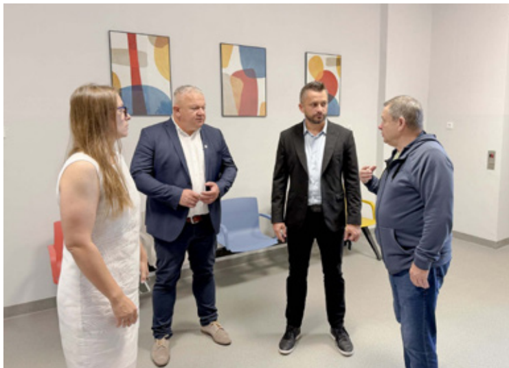
Rozmowy na wysokim szczeblu.

Przychodnia w Wołowie przechodzi gruntowną metamorfozę. Dzięki unijnym dotacjom oraz środkom własnym pacjenci mogą już korzystać z nowoczesnej poradni okulistycznej i pracowni RTG. Trwają kolejne prace na trzecim piętrze, które mają na celu poprawę komfortu leczenia i pełne dostosowanie placówki do potrzeb osób z niepełnosprawnościami. Włodarze powiatu i gminy zapowiadają dalszy rozwój Powiatowego Centrum Medycznego.