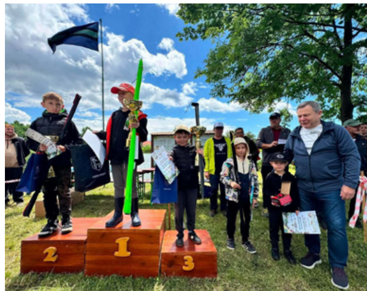
Duma i satysfakcja!