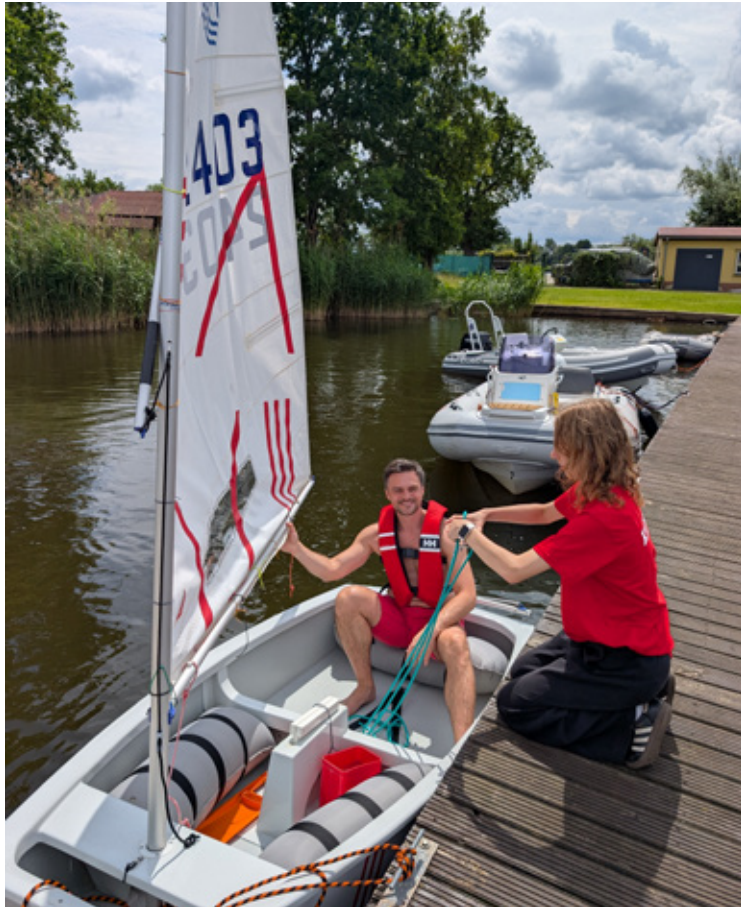
Bezpieczeństwo przede wszystkim na żaglówkach.

– To wydarzenie pokazało, jak duży potencjał ma współpraca lokalna. Gmina, sołectwo, organizacje, mieszkańcy, partnerzy i wolontariusze stworzyli razem