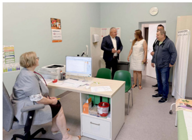
Czyste, komfortowe gabinety to ważna rzecz.