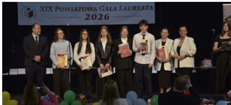
Uśmiech i duma.

Na szczególne uznanie zasługują konkursy promujące posta-