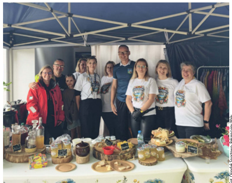
Wspólne zdjęcie nad wodą z dobrym jedzeniem.