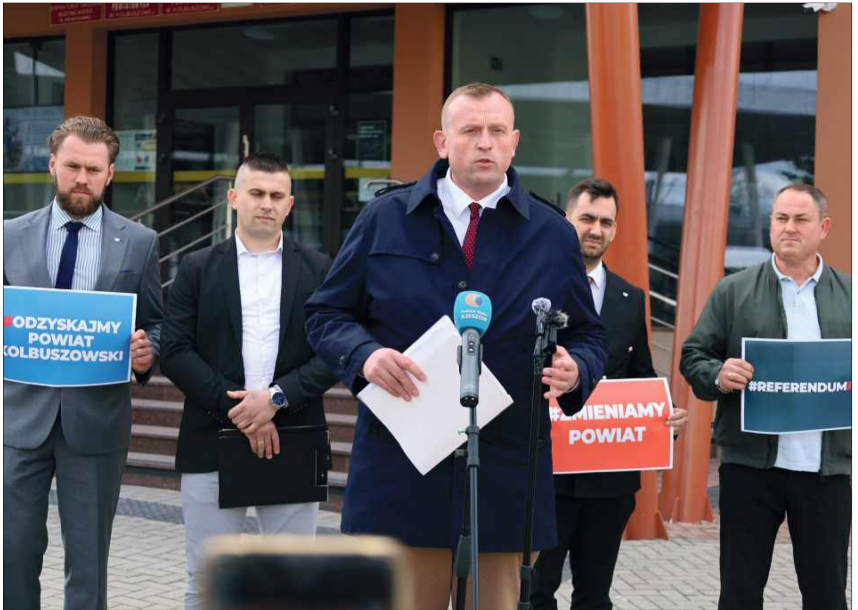
Inicjatorzy referendum mówią głośno i dosadnie, że obecna władza musi zostać zmieniona.

To politycy PiS-u dzielący karty na powiecie od wielu lat wiedzą, że sytuacja w powiecie mocno się zmieniła i ich monopol i bezkarność wyparowała w dniu, w którym objąłem mandat posła do PE. W miniony piątek minęła połowa czasu przewidzianego ustawą na przeprowadzenie zbiórki podpisów. Mamy poło-