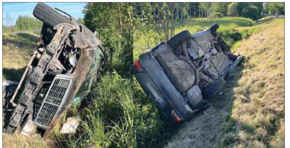
Samochód marki Mercedes dachował w rowie przy drodze relacji Wola Raniżowska - Raniżów.

chał na przeciwny pas ruchu, wpadł do przydrożnego rowu i dachował. Na miejscu pracowały służby ratunkowe, a policja wyjaśnia okoliczności tego zdarzenia. Zdarzenie zakończyło się mandatem dla kierującego.