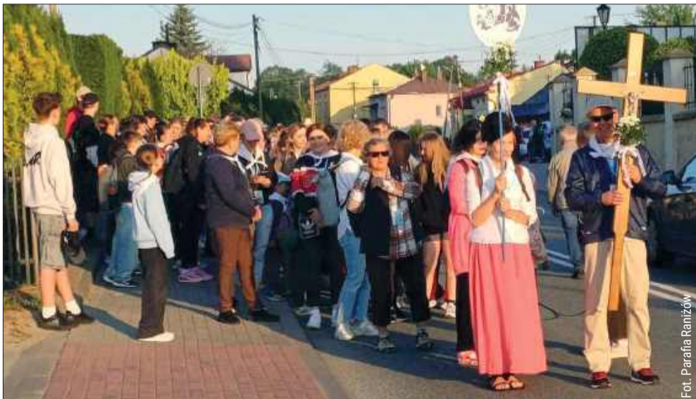
Parafianie z Raniżowa wyruszyli skoro świt na pieszą pielgrzymkę.