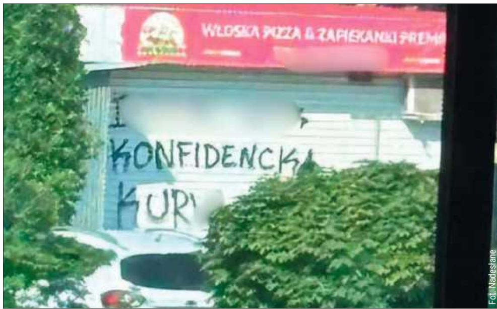
Wulgarne napisy na elewacjach. Fala wandalizmu w Kolbuszowej.

Mieszkańcy Kolbuszowej przecierają oczy ze zdumienia i irytacji. W ostatnich dniach na terenie miasta doszło do serii aktów wandalizmu. Nieznani sprawcy, używając czarnej farby w sprayu, zniszczyli elewacje budynków, w tym punktów gastronomicznych oraz obiektów użyteczności publicznej. Sprawą zajmuje się już policja.