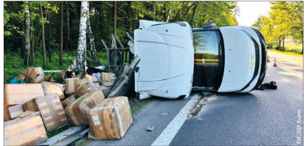
Siła uderzenia podczas zderzenia na DK9 była bardzo duża.