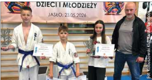
Kolbuszowianie przywieźli z Jasła pięć medali.

Znakomity występ zanotowali reprezentanci Kolbuszowskiego Klubu Kyokushin Karate podczas XXVI Mistrzostw Podkarpacia Dzieci i Młodzieży w Jaśle. Młodzi sportowcy z Kolbuszowej wywalczyli aż pięć srebrnych krążków, udowadniając, że należą do ścisłej regionalnej czołówki.