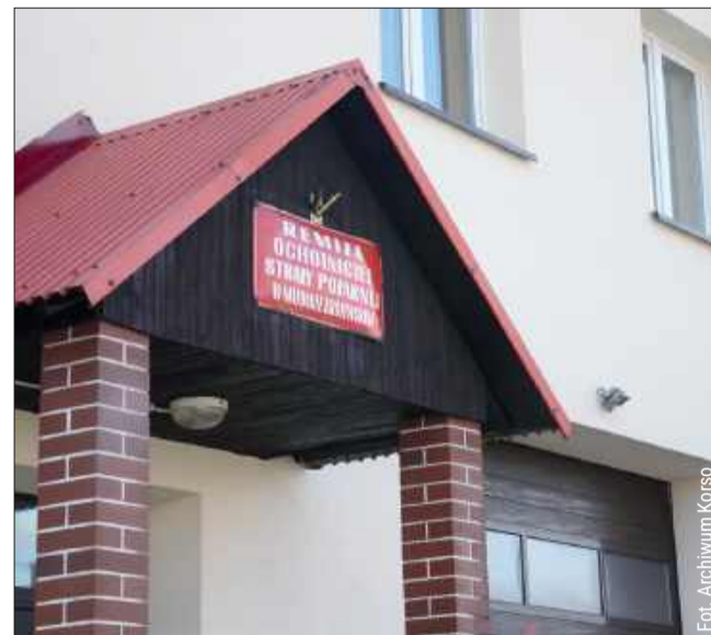
Druhowie już niedługo zyskają nową siedzibę.

Cała inwestycja obejmie teren o powierzchni blisko 3800 mkw. Gmina pozyskała na zadanie 1 156 171 zł dofinansowania w ramach Programu Ochrony Ludności i Obrony Cywilnej. Środki te zostaną przeznaczone na część związaną z magazynem ochrony ludności.