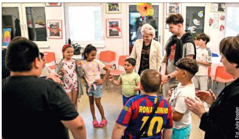
Projekt ruszył końcem 2025 roku. Nasze działania podsumowaliśmy podczas spotkania zorganizowanego 20 maja w Placówce Wsparcia Dziennego „Radosna Żyrafa” w Mielcu.

Aby ten głos wybrzmiał jak najgłośniej, uruchomiliśmy całą maszynę redakcyjną. Przez ostatnie miesiące zrealizowaliśmy