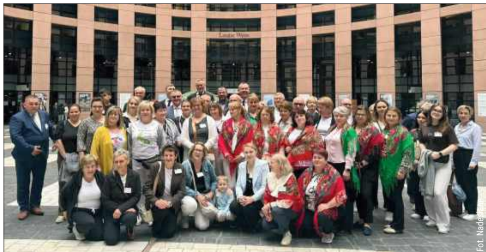
Z powiatu kolbuszowskiego do serca Europy. Mieszkańcy z wizytą w Strasburgu.