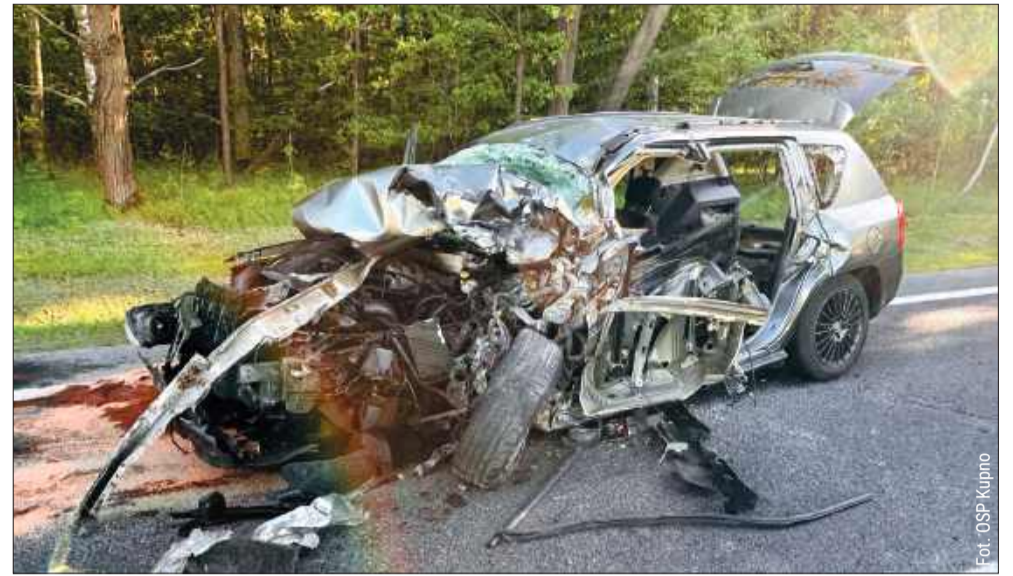
Strażacy przez kilkanaście minut wydobywali kierowcę ze zmasakrowanego pojazdu.

Młody, 31-letni kierowca mercedesa, z nieustalonych dotąd przyczyn stracił panowanie nad pojazdem. Samochód zje-