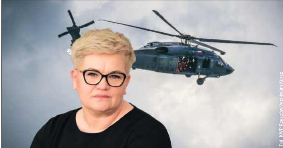
Radni, sołtys i mieszkańcy mają pretensje do wójta.

- Elegancja i koleżeństwo w relacjach z urzędem nie