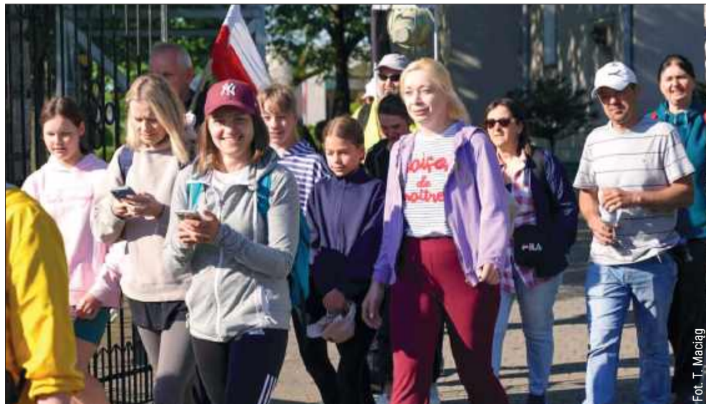
Pielgrzymi z Cmolasu wyruszyli w dwudniową pielgrzymkę.