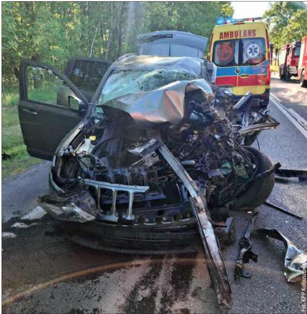
Pojazdy biorące udział w wypadku na drodze krajowej nr 9 uległy niemal całkowitemu zniszczeniu.