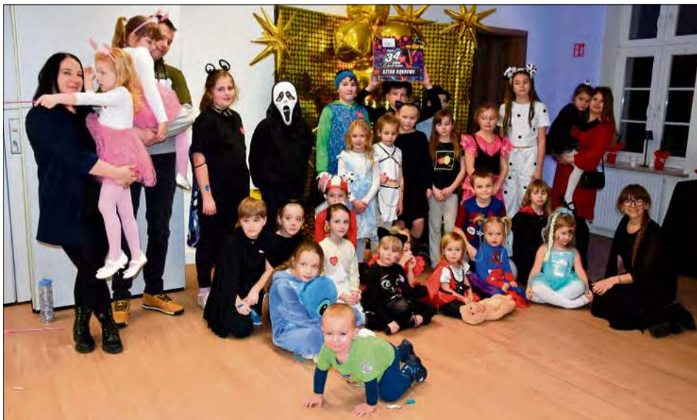
Bal karnawałowy dla dzieci w Chróście był wydarzeniem wspierającym dąbrowski finał WOŚP.