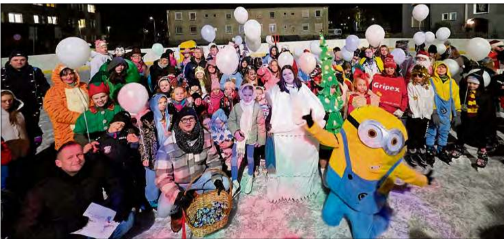
Zimowa atrakcja Ozimka już działa - otwarcie bezpłatnego lodowiska przy MOSiR cieszyło się dużym zainteresowaniem mieszkańców.

W piątek, 16 stycznia, Ozimek oficjalnie rozpoczął zimowy sezon na lodzie. Przy Miejskim Ośrodku Sportu i Rekreacji uruchomiono bezpłatne lodowisko, które już od pierwszych godzin funkcjonowania stało się magnesem dla mieszkańców gminy. Na otwarcie przybyły setki osób, a frekwencja - jak zgodnie podkreślają organizatorzy - przerosła wszelkie oczekiwania.