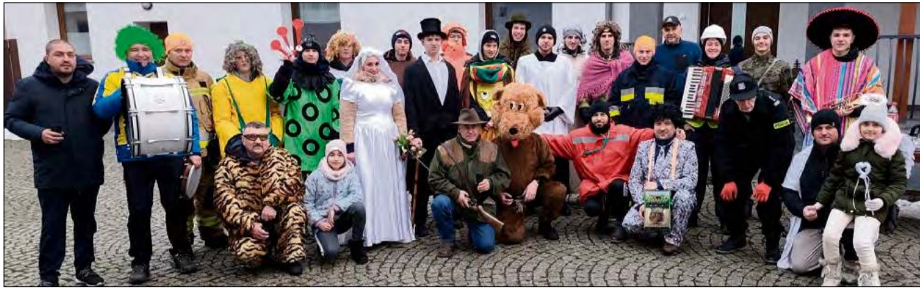
Sportowcy z Orła Żlinice odwiedzili 250 domostw.

Wodzenie niedźwiedzia to jeden z najbardziej rozpoznawalnych zwyczajów ludowych Opolszczyzny, kultywowany w okresie karnawału. Wywodzi się z dawnych obrzędów pożegnania zimy i zapewnienia pomyślności. Centralną postacią pochodu jest „niedźwiedź” - zwykle męczyzna przebrany w słomiany lub futrzany strój - któremu towarzyszą barwne postacie, takie jak myśliwy, baba z dziadem, policjant czy kominiarz. Uczestnicy odwiedzają domy mieszkańców, składając życzenia i tańcząc na szczęście w zamian za poczęstunek lub datki.