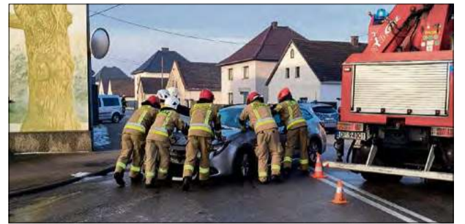
Zdarzenie zakwalifikowano jako kolizja.

Do pierwszego zatrzymania doszło na terenie powiatu opolskiego. Policjanci skontrolowali 50-latkę kierującą audi, która w miejscu, gdzie obowiązywało ograniczenie do 50 km/h, poruszała się z prędkością 115 km/h. Kobieta została ukarana mandatem karnym w wysokości 2 000 złotych oraz 14 punktami karnymi, a jej prawo jazdy zostało zatrzymane. Kolejny przypadek dotyczył 59-letniego kierowcy, który pędził przez obszar zabudowany z prędkością 118 km/h. Za popełnione wykroczenie otrzymał również wysoki mandat karny, punkty i stracił uprawnienia do kierowania na trzy miesiące. Trzeci raz policjanci interweniowali wobec 47-letniej kobiety kierującej peugeotem. Mundurowi odnoto-