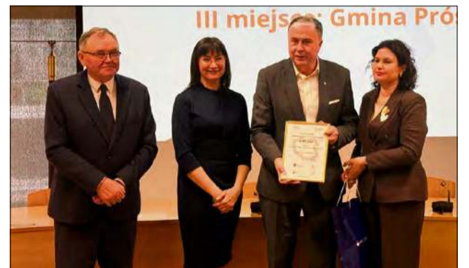
Władze gminy Prószków podkreślają, że ranking ma dużą wiarygodność, jeśli chodzi o metodykę.

Wiarygodność rankingu wynika z oparcia go na ogólnodostępnych danych statystycznych. Wszystkie