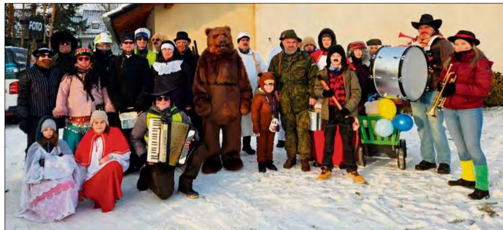
Tak bawiono się w Niwkach.

Tradycja wodzenia niedźwiedzia po raz kolejny ożywiła ulice gminy Chrzastowice. Ten zwyczaj związany karnawalem jest wciąż z pietyzmem kultywowany przez lokalne społeczności.