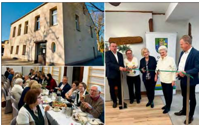
19 stycznia oddano w ręce seniorów pomieszczenia znajdujące się w budynku przy Rynku w Kup.

Klub powstał jako odpowiedź na zdiagnozowane potrzeby mieszkańców. Realizacja zadania trwała od 1 kwietnia do 31 grudnia 2025