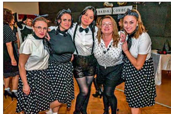
W Ciepeliowicach babski comber miał biało-czarny motyw przewodni.

dyń Wiejskich „Gospodarni z Ciepeliowic”.