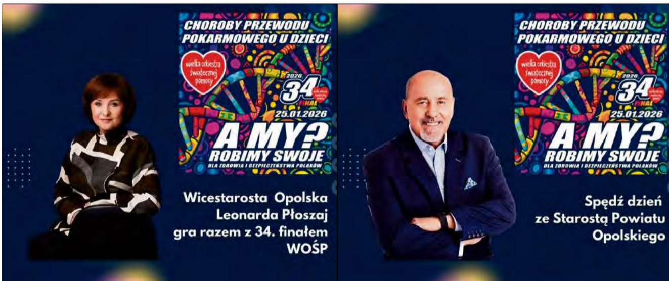
Ciekawe licytacje w tym roku przygotował powiat opolski w ramach WOŚP.