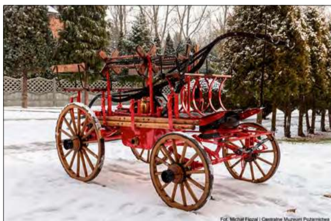
Muzeum zakończyło wszystkie niezbędne prace przy zabytkowej sikawce wyprodukowanej w 1931 roku przez firmę G.A. Fischer.

Muzeum pomyślnie zakończyło wszystkie niezbędne prace przy zabytkowej sikawce konnej na podwoziu czterośladowym, wyprodukowanej w 1931 roku przez firmę G.A. Fischer. Warto wspomnieć, iż eksponat został przekazany przez jednostkę z Suchego Boru już w styczniu 2025 roku i od razu trafił w ręce specjalistów. Druhowie nie kryją swojej satysfakcji z wykonanych prac.