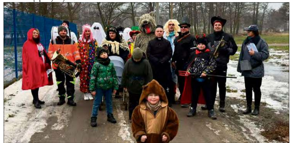
W Ligocie Prószkowskiej korowód przebierańców liczył 23 osoby.