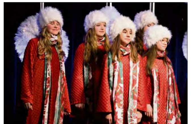
Zespół dziecięcy „Akces” został doceniony w Ogólnopolskim Festiwalu Kolęd i Pastorałek „Hej Kolęda, Kolęda” w Komprachcicach.

Zespół dziecięcy „Akces” został wyróżniony na Ogólnopolskim Festiwalu Kolęd i Pastorałek „Hej Kolęda, Kolęda” w Komprachcicach. To wy-