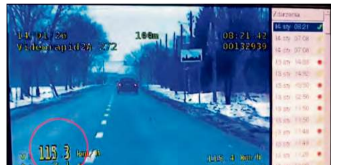
Kierująca audi poruszała się z prędkością 115/km/h w terenie zabudowanym.

wali przekroczenie prędkości o 57 km/h w obszarze zabudowanym. Ona także poniosła surowe konsekwencje swojego zachowania.