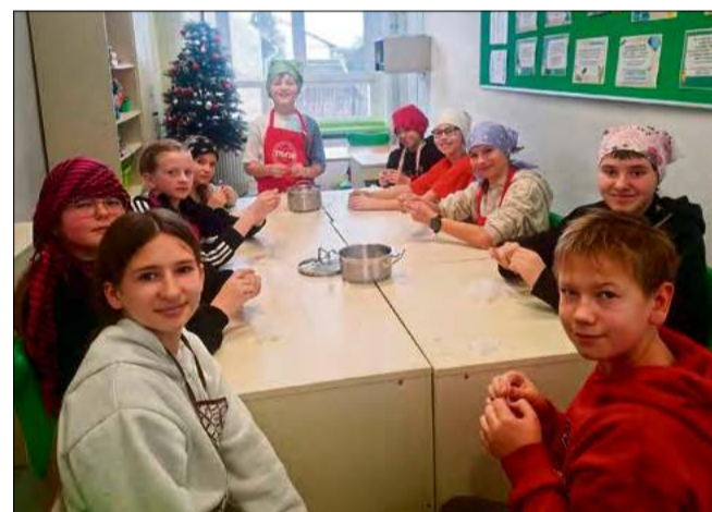
Zamiast piłowania czy klejenia, w powietrzu unosiło się pierze.

Zajęcia były praktyczną nauką cierpliwości i precyzji. Zebrane pierze zostanie wykorzystane do wykonania poduszek. Uczniowie uszyją je samodzielnie w kolejnym etapie projektu. Grono pedagogiczne podkreśla, że taka forma zajęć to połączenie nauki z poznawaniem dawnych tradycji. Dzięki temu uczniowie mogą doświadczyć, jak powstają przedmioty od podstaw.