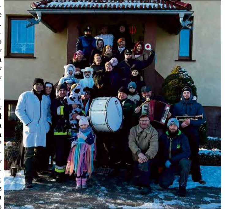
W Chobiu członkowie ochotniczej straży pożarnej wodzą niedźwiedzia w dwóch terminach.

W Chobiu członkowie OSP wodzą niedźwiedzia w dwóch terminach. 10 stycznia bery odbywały się w Mni-