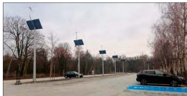
Nie brakuje też miejsc parkingowych dla samochodów. Całość jest dobrze oświetlona.

autobusowa. W ramach zadania pojawiło się także nowoczesne wyposażenie, w tym ławki, stojaki i wiata rowerowa, a także lampy solarno-hybrydowe zapewniające efektywne oświetlenie terenu.