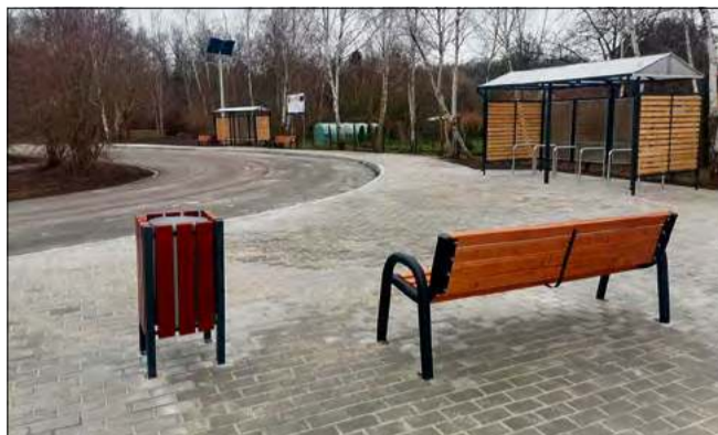
W ramach zadania pojawiło się także nowoczesne wyposażenie, w tym ławki, stojaki i wiata rowerowa.

Obiekt został zaprojektowany z myślą o wygodzie i bezpieczeństwie mieszkańców. Jego kluczowe elementy to: funkcjonalny parking dla samochodów osobowych z wydzielonymi miejscami dla osób niepełnosprawnych, peron dla pieszych oraz zmodernizowana pętla