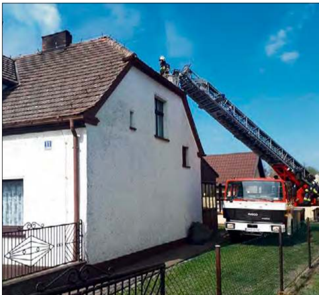
W sezonie grzewczym strażacy często wyjeżdżają do kominowych pożarów.

Chodzi m.in. o montowanie czujek dymu w mieszkaniach i domach. Urządzenia monitorujące poziom tlenu węgla powinny być zamontowane w miejscach, gdzie