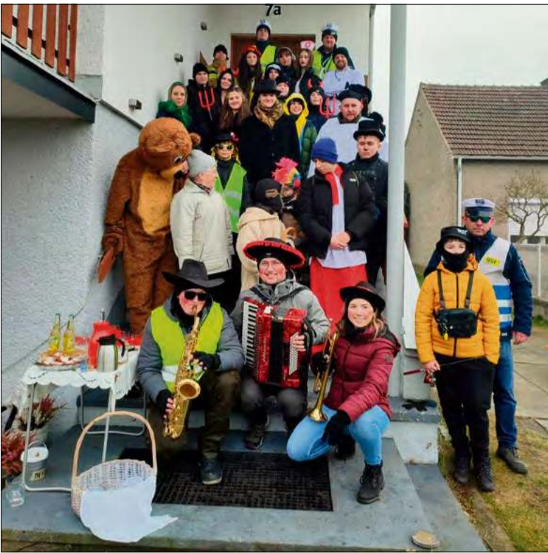
W Antoniewie bery reaktywowano ponad dwadzieścia lat temu.

W Antoniewie bery reaktywowano ponad dwadzieścia lat temu. Od tamtej pory organizowaniem tego karnawałowego wydarzenia zajmują się strażacy z lokalnej jednostki straży pożarnej. Początki nie należały do łatwych, ale ponad dwie dekady wodzenia niedź-