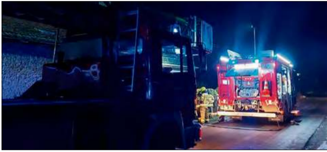
W działaniach brały udział zastępy JRG nr 1 Opole, OSP Stare Budkowice, OSP Zagwizdzie, OSP Jełowa.

Do zdarzenia doszło 17 stycznia po godzinie 21.00. Służby zostały zaalarmowane o pożarze w budynku mieszkalnym w Nowych Budkowicach. Po dojeździe na miejsce zlokalizowano miejsce zadymienia i przepro-