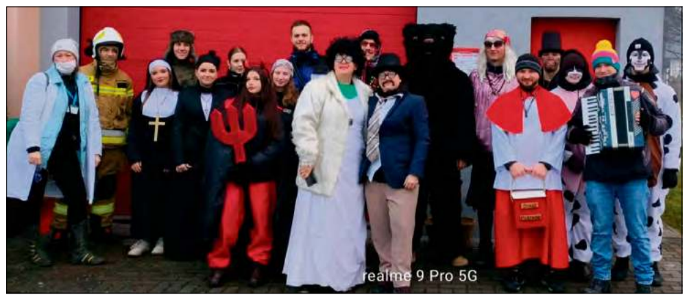
W wodzeniu niedźwiedzia w Pustkowie wzięła udział grupa 24 osób.

W Pustkowie też odbyło się tradycyjne wodzenie niedźwiedzia, zorganizowane przez miejscową OSP. To zwyczaj kultywowany od wielu lat, zarówno przez organizatorów, jak i mieszkańców, którzy z entuzjazmem przyjmują przebierańców. W tym roku w grupie wodzących pojawili się