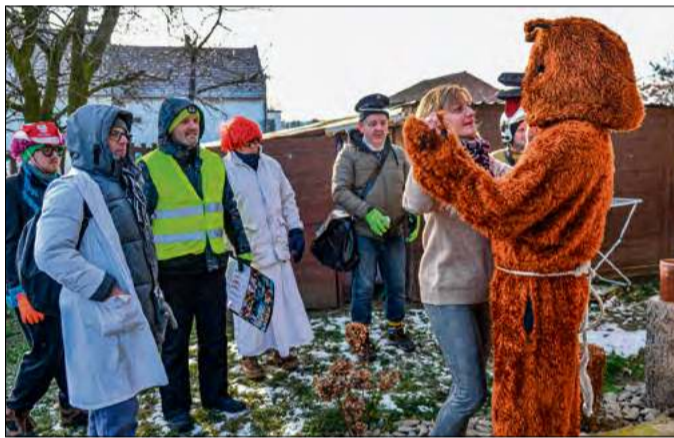
W Niewodnikach zorganizowano wodzenie niedźwiedzia.

W tym roku po raz pierwszy w Ciepeliowicach zorganizowano zabawę dedykowaną wyłącznie kobietom. Babski comber, którego inicjatorami było Koło Gospo-