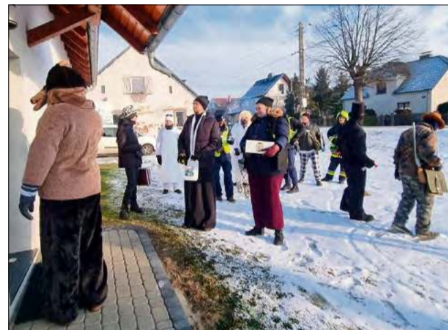
W Falmirowicach też ekipa bawiła się znakomicie.

W ostatnich dniach kolorowe orszaki z muzykantami i przebierańcami przeszły już przez Falmirowice oraz Niwki. To jednak dopiero początek tegorocznych obchodów. Jak zapowiadają organizatorzy, tradycyjne bery odbędą się jeszcze w innych miejscowościach. Niedźwiedzia będzie można spotkać w: Dębskiej Kuźni, Suchym Borze, Dańcu, Dębciu oraz Chrzastowicach.