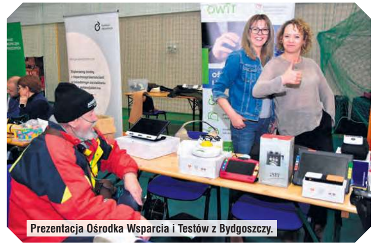
Prezentacja Ośrodka Wsparcia i Testów z Bydgoszczy.