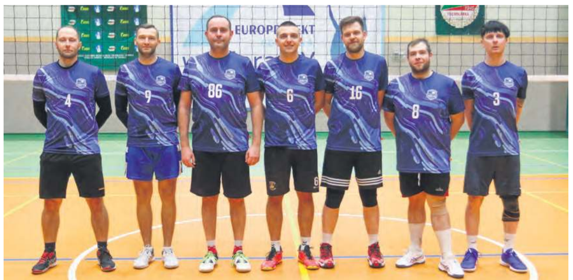
Cekcyńskie Orły nie miały problemu, by wywalczyć trzecią lokatę w lidze.