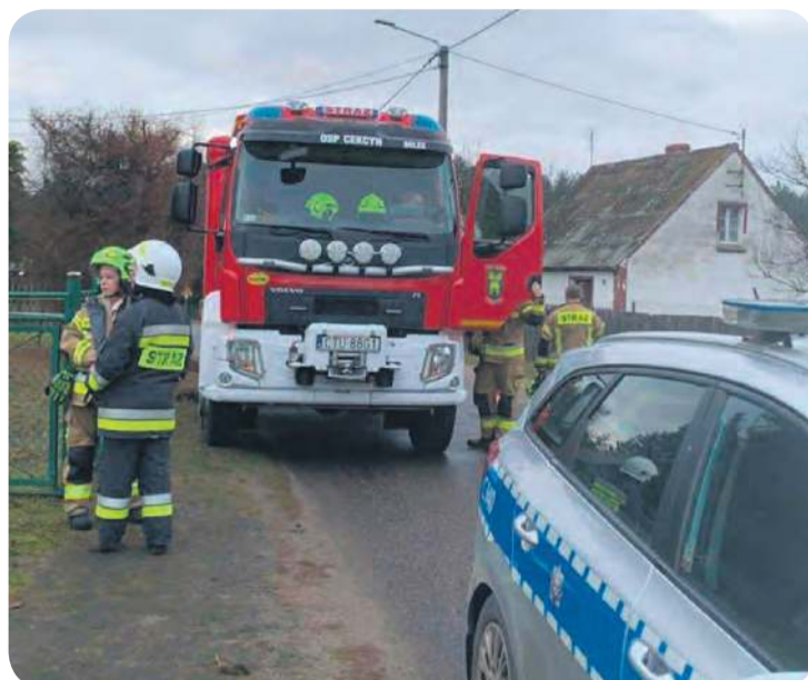
Ochotnicza Straż Pożarna w Cerkynie relacjonowała sobotnie wydarzenia w swoich mediach społecznościowych.

Według naszych nieoficjalnych ustaleń po pomoc zgłosili się zaniepokojeni mieszkańcy miejscowości, którzy od kilku dni nie widzieli swojego sąsiada. Ciało mężczyzny natomiast podczas akcji ratowniczej zostało znalezione w piwnicy domu, do której miał wpaść 76-latek.