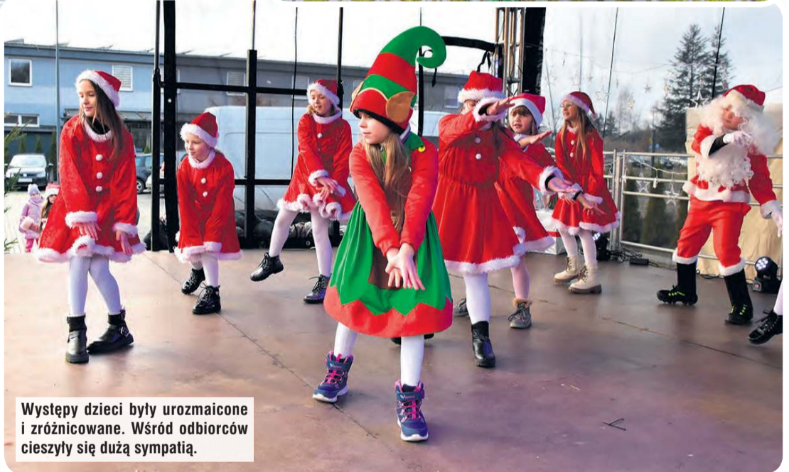
Występy dzieci były urozmaicone i zróżnicowane. Wśród odbiorców cieszyły się dużą sympatią.

Piosenki. Liczne stoiska rękodzielników, których stoły uginały się od świątecznych upominków. Kola Gospodyń Wiejskich z terenu gminy Śliwice: Brzeźna, Kręga, Lasek, Łąskiego Pieca, Okonin Nadjeziornych i Śliwiczek serwowały wyśmienite, swojskie potrawy. U pań można było również zakupić bożonarodzeniowe ozdoby. Podczas wydarzenia świąteczne stroiki można było nabyć także u rękodzielniczek z naszego regionu czy okolic Czerska. Niektórzy jarmark opuścili z choinką. Dla dzieci przygotowane było stanowisko zdobienia pierników. Najmłodszy mieli również okazję spotkać się ze Świętym Mikołajem.