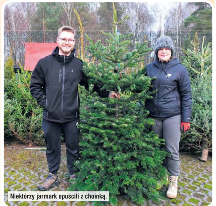
Niektórzy jarmark opuścili z choinką.