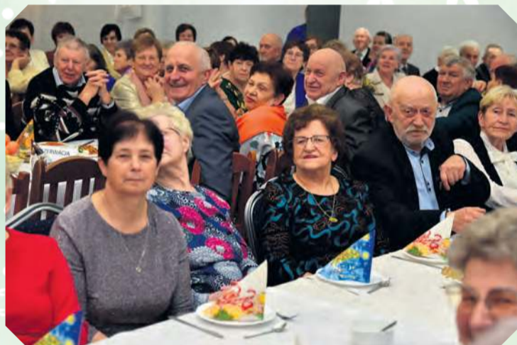
Uczestnikom wydarzenia dopisały humory.