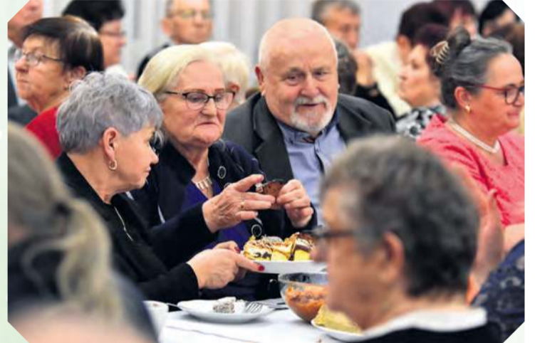
Czas na pyszne, domowe wypieki!