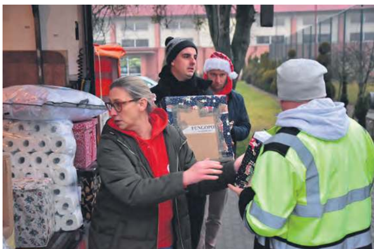
Szlachetna Paczka to wiele tygodni planowania i poświęcenia wolontariuszy.