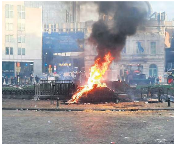
Protest przybrał bardzo intensywną formę. Dochodziło do starć z policją.