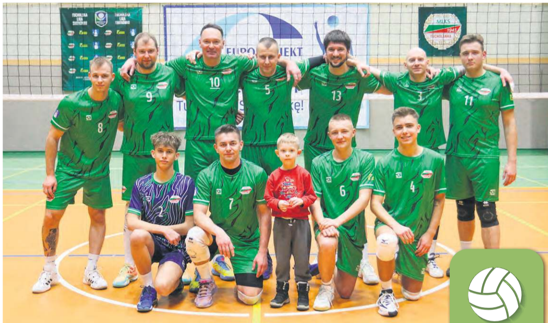
MLKS Tucholanka pokazała w finale skuteczną, spokojną grę.

Młody zespół z TL-u musiał stawić czoła doświadczonym graczom i już pierwszy set wskazał lepszą