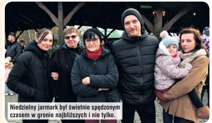
Niedzielny jarmark był świetnie spędzonym czasem w gronie najbliższych i nie tylko.