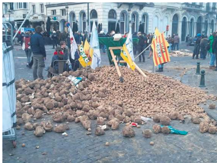
Na znak tego, że europejscy rolnicy mają problem ze sprzedażą swoich produktów, na ulicach Brukseli rozsypano m.in. ziemniaki i baloty słomy.

18 grudnia miało miejsce posiedzenie Parlamentu Europejskiego. Kilka dni później przewodnicząca Komisji Europejskiej Ursula von der Leyen miała polecić