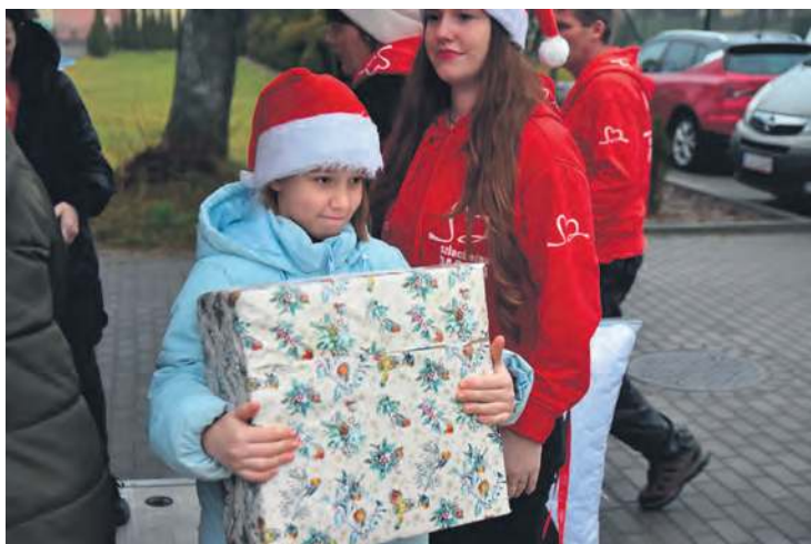
W Szlachetnej Paczce liczy się najmniejszy dar, najmniejszy gest. Znaczenie tego wszystkiego jest jednak bezcenne.