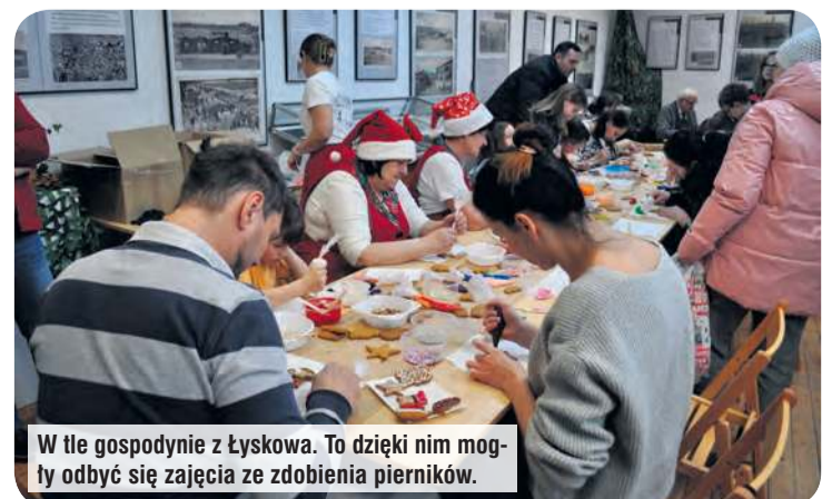
W tle gospodynie z Łyskowa. To dzięki nim mogły odbyć się zajęcia ze zdobienia pierników.