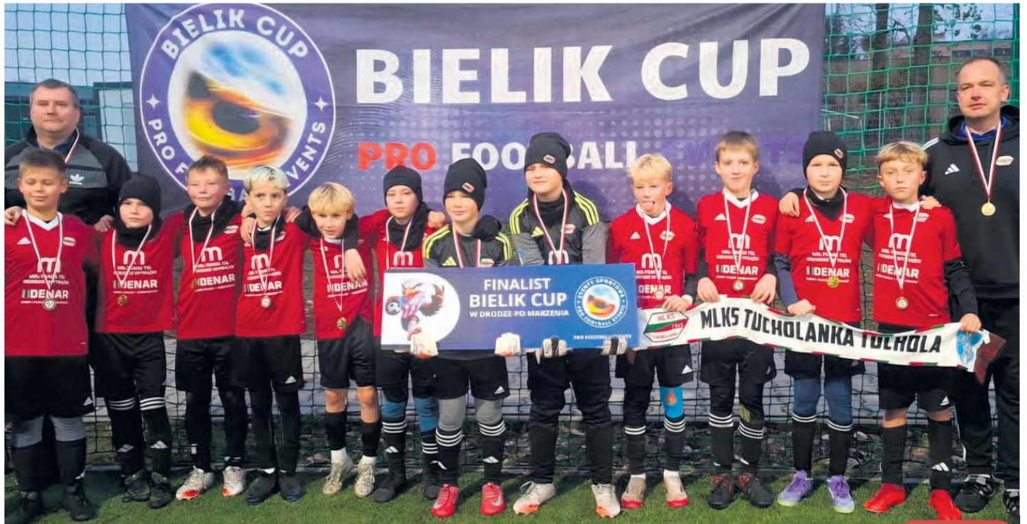
Triumf w eliminacjach turnieju Bielik Cup to kolejny sukces małych piłkarzy.

Świetnie spisali się w kolejnej grupie tucholanie, bo przyszło im na tym etapie rozgrywek zmierzyć się znów z angielskim Not-