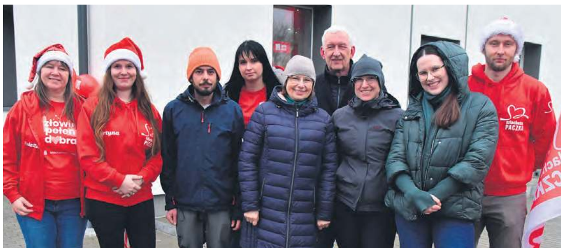
Do Tucholi osobiście przyjechali darczyńcy z Gdańska.