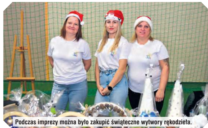
Podczas imprezy można było zakupić świąteczne wytwory rękodzieła.

Campanella jest w regionie doskonale znana od wielu lat, to akurat w samej Tucholi nie gra zbyt często. Tucholanie mieli więc szansę nadrobić braki, zwłaszcza, że orkiestra się nie zatrzymuje. Wręcz przeciwnie, od niedawna ma na koncie kolejny album. Skład orkiestry ewoluuje, bo w Tucholi znów mieliśmy okazję usłyszeć kilka debiutów najmłodszych orkiestrantów.