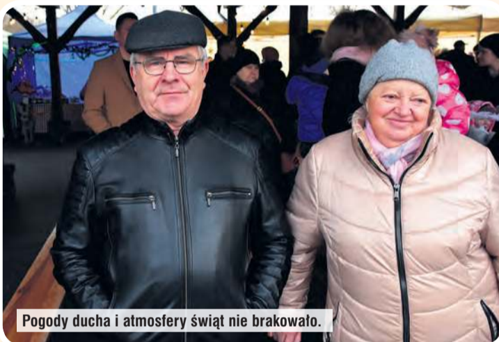
Pogody ducha i atmosfery świąt nie brakowało.