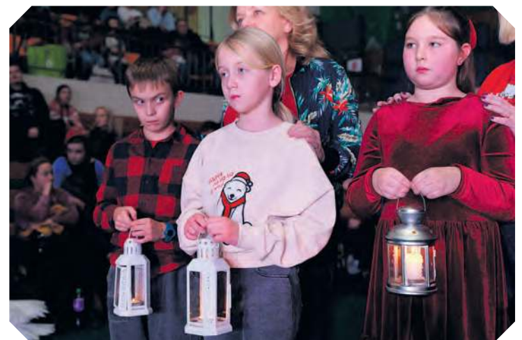
Betlejemskie Światelko Pokoju dzieci odebrały od harcerzy tucholskiego hufca.