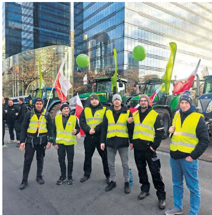
Do Brukseli wybrała się kilkusobowa grupa rolników z naszego powiatu – dokładnie z gmin Gostycyn i Lubiewo.

do Brazylii, gdzie planowano podpisać umowę handlową. Dziś już wiemy, że do tego nie doszło. Według Sassa manifestacja wywarła presję na Komisję Europejską.