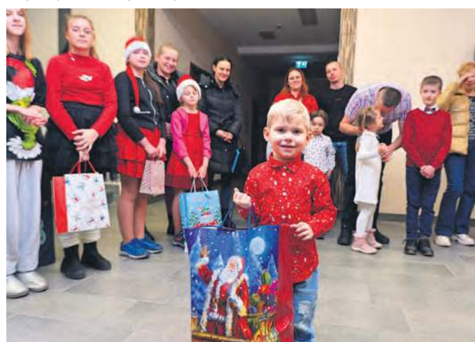
Nagrody otrzymali wszyscy (ci podpisani pod listami) uczestnicy przedświątecznej zabawy.