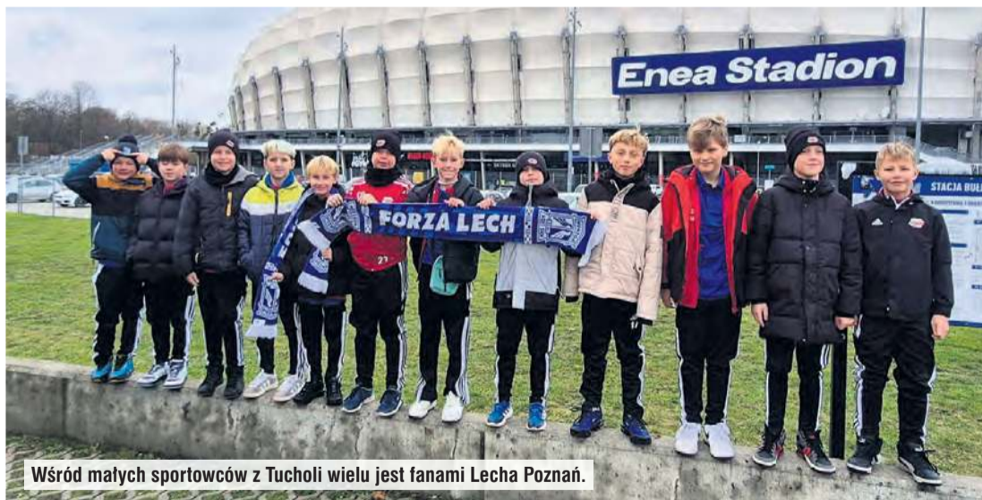
Wśród małych sportowców z Tucholi wielu jest fanami Lecha Poznań.