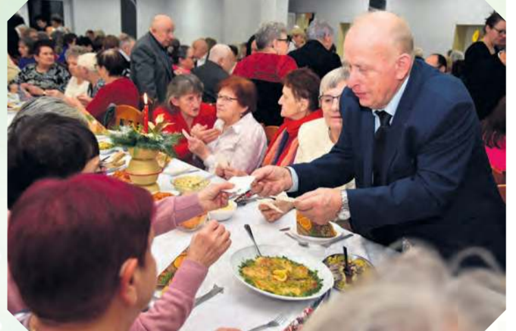
Seniorzy chętnie dzielili się opłatkiem i składali sobie życzenia.

więcej zdjęć na tygodnik.pl filmy na facebook.com/tygodniktucholski