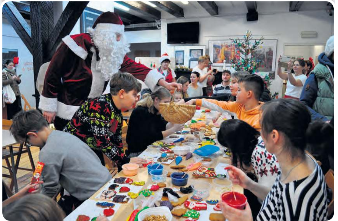
Muzealne warsztaty odwiedził św. Mikołaj. Często zaglądał też tutaj Borowiacki Gwiazdor.