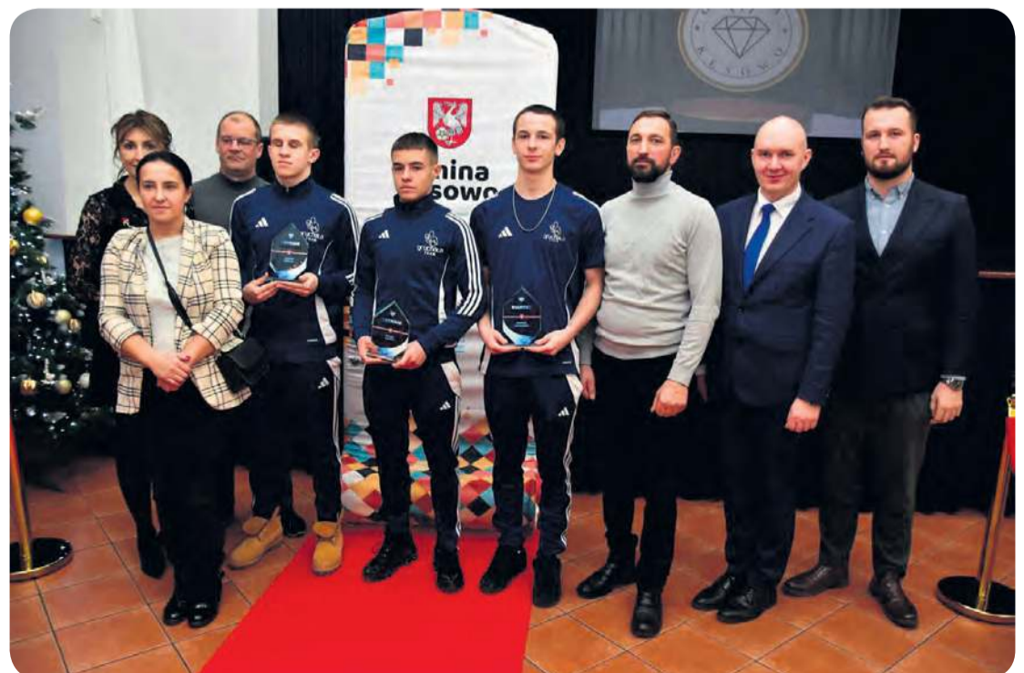
Nagrodzonym w tak ważnym wydarzeniu towarzyszyli rodzice. Wszyscy, wraz z samorządowcami, stanęli do pamiątkowego zdjęcia.

– Ta nagroda jest podziękowaniem za wasze dotychczasowe sukcesy, ale diament to także pewne zobowiązanie, aby nie ustawać w swoim rozwoju. Sięgajcie jaj najwyżej, zabiegajcie o kolejne sukcesy.