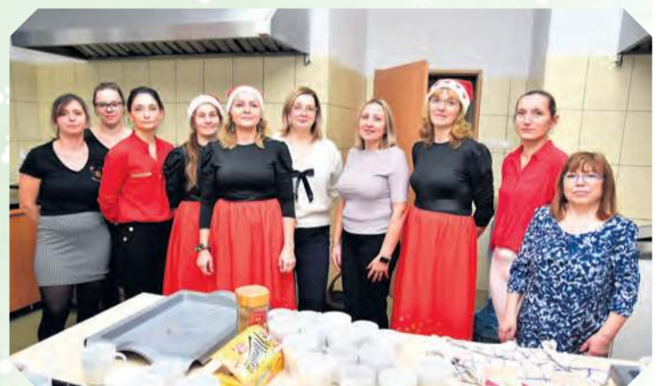
Członkinie KGW i pracownice B-CK po raz kolejny spisały się znakomicie przy obsłudze wydarzenia.