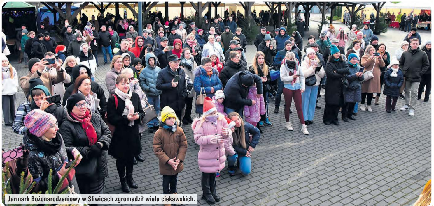
Jarmark Bożonarodzeniowy w Śliwicach zgromadził wielu ciekawskich.