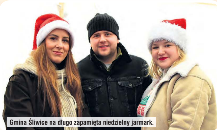
Gmina Śliwice na długo zapamięta niedzielny jarmark.

Podczas kiermaszu rozstrzygnięto konkurs na szopkę bożonarodzeniową. W rywalizacji udział wzięło 14 prac.