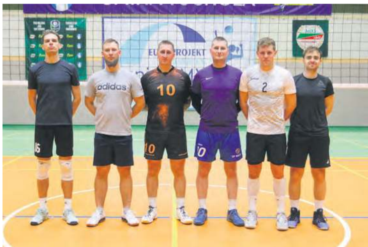
Chwała zwyciężonym. Chojnice Team nie znalazł recepty na skuteczną grę w finale.