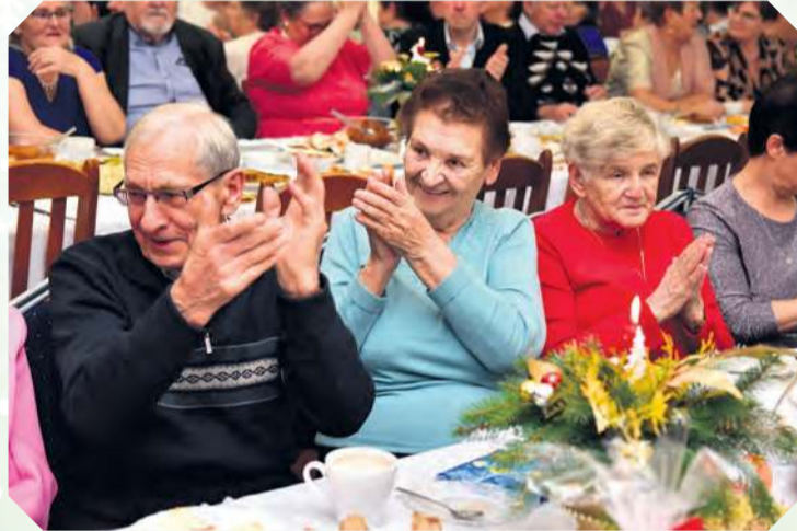
Seniorzy nie żalowali braw wykonawcom.

W trakcie spotkania nie mogło zabraknąć wspólnego śpiewania koled. Zachęcił do niego sam wójt, który niejednokrotnie zasiadał za klawiszami. Bardziej skoczne melodie zaprezentowa-