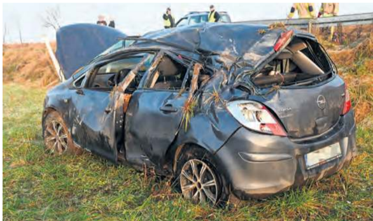
Stary Sumin. Corsą, która wypadła z drogi i dachowała, podróżowały trzy osoby. Dwie zostały zabrane na obserwację do szpitala.

● We wtorek 16.12 o godz. 7:50 w Cekcynie na ul. Szkolnej kierujący peugeotem, wyjeżdżając z drogi podporządkowanej, nie ustąpił pierwszeństwa przejazdu i uderzył w audi. 72-latek z gm. Cekcyn został pouczony. Poszkodowaną jest 23-latka z tej samej gminy.