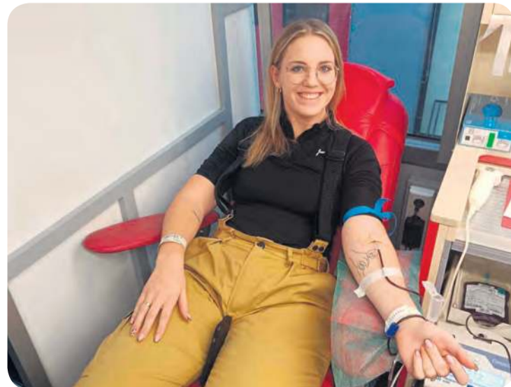
W gronie krwiodawców liczną grupę stanowili druhowie z różnych jednostek OSP z terenu gminy Kęsowo.

Na każdego, kto oddał krew, czekały do wyboru: żywa choinka lub świąteczny upominek z logo tegorocznej akcji. A dla wszystkich, którzy choć spróbowali oddać krew (nawet jeśli nie zostali zakwalifikowani) panie z KGW Piastoszyn przygotowały domową grochówkę, a strażacy z Piastoszyna słodki poczęstunek oraz aromatyczną kawę i herbatę. Stoły, na których zagodziły wymienione pyszności, rozstawiono we wnętrzu remizy, co też sprzyjało zatrzymaniu się na moment w przedświątecznym biegu.