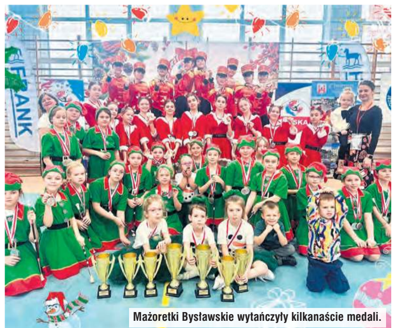
Mażoretki Byławskie wytańczyły kilkanaście medali.

Anna Lipska, fot. ze zbiorów prywatnych grup