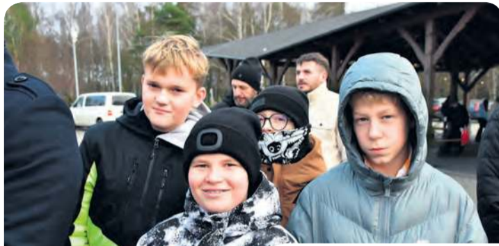
Wydaje się, że jarmark niejednokrotnie powróci do Śliwic.

Co czekało na gości jarmarku? Taneczne i muzyczne występy dzieci z Przedszkola Samorządowego „Borowiacek” i Szkół Podstawowych z Lińska, Śliwic oraz Śliwiczek, a także Zespołu Pieśni i Tańca „Śliwiczanie” i przedstawicieli Regionalnej Akademii