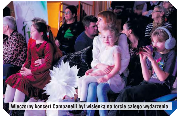
Wieczorny koncert Campanelli był wisienką na torcie całego wydarzenia.