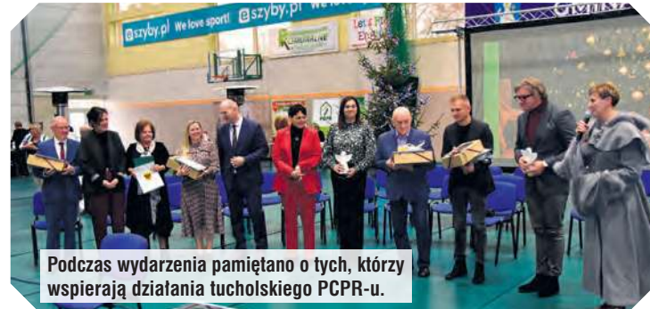
Podczas wydarzenia pamiętano o tych, którzy wspierają działania tucholskiego PCPR-u.