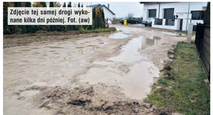
Zdjęcie tej samej drogi wykonane kilka dni później.

W sprawie kontaktujemy się z kierownikiem Wydziału Infrastruktury i Planowania Przestrzennego w Urzędzie Miejskim w Tucholi, któremu też przekazujemy uwagi mieszkańców.