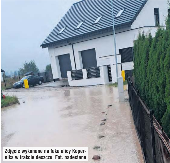
Zdjęcie wykonane na łuku ulicy Kopernika w trakcie deszczu.

Tucholanie mieszkający przy ul. Kopernika w Tucholi zwracają uwagę na fatalny stan drogi. Po opadach deszczu praktycznie nie da się tutaj przejść suchą nogą. W bardziej pogodne dni stan traktu także pozostawia wiele do życzenia.