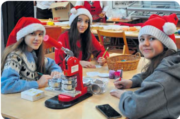
Dziewczęta podczas tworzenia przypinek świątecznych.

Dodajmy, że warsztaty muzealne realizowane były z udziałem środków Kujaw-