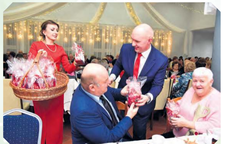
Do każdego uczestnika Wigilii trafił upominek przygotowany przez GOPS. Ich wręczeniem zajęł się m.in. wójt ze swoją zastępczynią.

ła kapela Jucha, która bawi publiczność już od 30 lat. Seniorzy bardzo ciepło przyjęli oba występy: i ten bardziej nastrojowy, i ten wywołujący całą masę wspomnień. Tego wieczoru uśmiech długo gościł na ich twarzach, a prowadzonym rozmowom towarzyszyło rytmiczne bujanie.