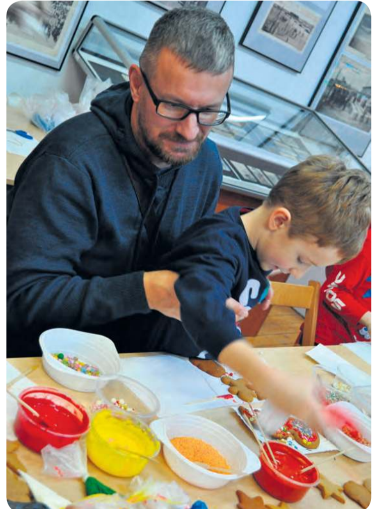
W trakcie jarmarku muzeum odwiedzały rodziny z dziećmi. To była świetna opcja, aby odpocząć od zgiełku na rynku w Tucholi.