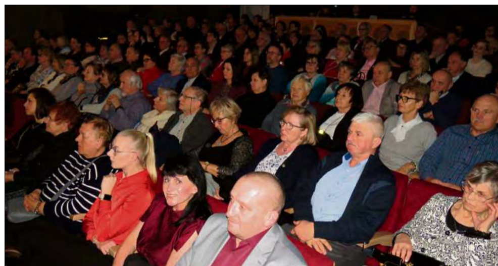
W czasie koncertu widzowie mogli choć na chwilę przenieść się w świat muzyki.

Publiczność miała okazję usłyszeć kultowe motywy muzyczne znane z najsłynniejszych produkcji kinowych. W programie znalazły się dzieła takich mistrzów jak: Wojciech Kilar (Suita z filmu „Pan Tadeusz”), Ennio Morricone („Obój Gabriela” z filmu „Misja”), John Williams (Temat z filmu „Lista Schindlera”) czy Henry Mancini (Temat z filmu „Różowa Pantera”). Nie zabrakło również niezapomnianych piosenek Franka Sinatry, Louisa Armstronga oraz utworów z musicali,