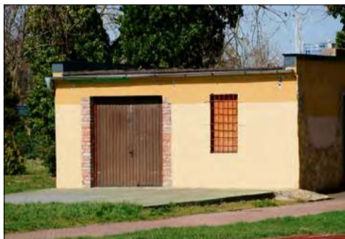
Tak obecnie prezentuje się tzw. zielona chatka.

Opuszczony budynek w parku przy ul. Ligonie w Gogolinie znów będzie tętnił życiem. Jeszcze w tym roku tzw. „Zielona chatka” zostanie zmodernizowana i oddana w ręce młodzieży.