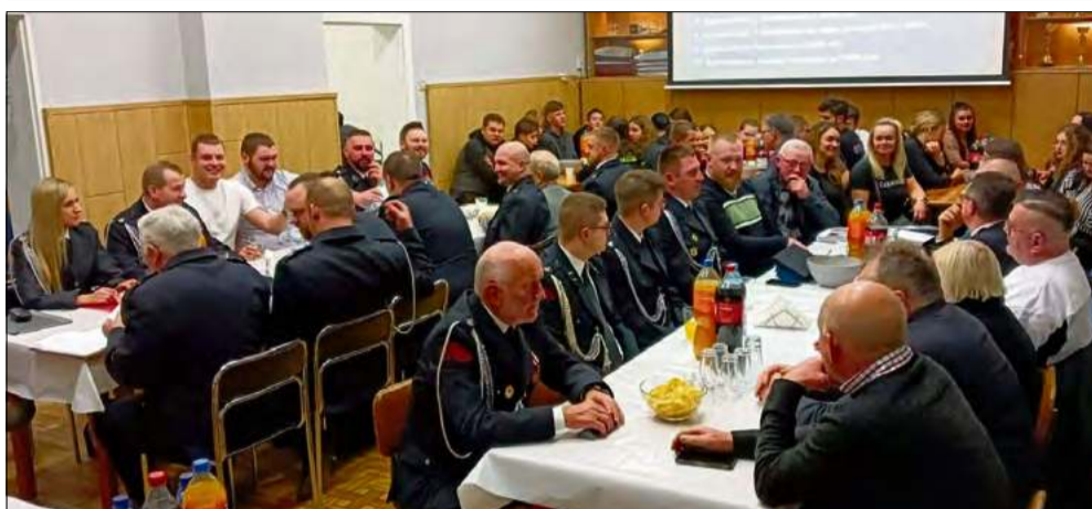
W Ochotniczej Straży Pożarnej w Steblowie wybrano nowy zarząd.

Podczas corocznego zebrania sprawozdawczo-wyborczego, które odbyło się 10 stycznia, członkowie Ochotniczej Straży Pożarnej w Steblowie podsumowali miniony okres działalności i wybrali nową władzę jednostki na kolejną kadencję.