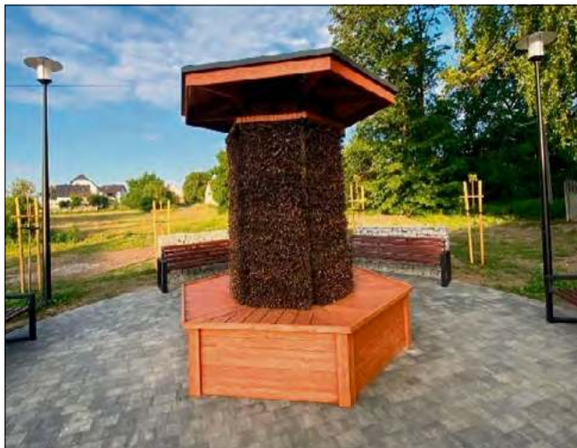
Nowa tężnia solankowa przy Gminnym Ośrodku Kultury w Walcach powstała w ramach inwestycji w przestrzeń publiczną.

Inwestycja objęła także teren wokół: utwardzenia, stację ładowania rowerów, ławki, kosze, lampy solarne i nowe nasadzenia. Koszt całego zadania wyniósł 3 472 200,31 zł.