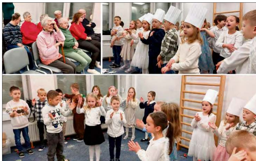
Przedstawienie okazało się prawdziwym darem dla serc – wypełnionym dobrem, radością i życzliwością.

14 stycznia Środowiskowy Dom Samopomocy w Krapkowicach z Filią na Polnej odwiedziła wyjątkowa grupa artystów. Mali aktorzy z Przedszkola nr 4 w Krapkowicach zaprezentowali wzruszające przedstawienie, które na długo pozostanie w pamięci uczestników placówki.