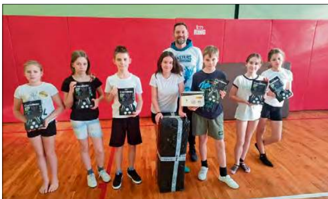
Przekazany sprzęt został wybrany bezpośrednio przez szkołę.

Dla działaczy i członków Masters Zdzieszowice było to źródło ogromnej satysfakcji. Podkreślali, że wspólnymi