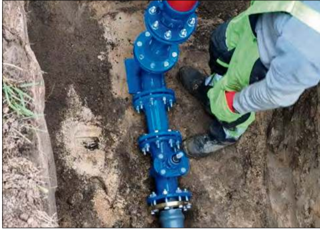
Przeprowadzone działania służą optymalizacji zarządzania zasobami wodnymi oraz podniesieniu standardów eksploatacji sieci.

lokalnego samorządu, ukie-runkowaną na kompleksowe usprawnianie infrastruktury wodno-kanalizacyjnej na terenie całej gminy. Realizowane inwestycje, zarówno modernizacyjne, jak i roz-budowujące, mają na celu