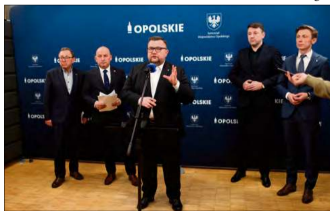
Szczególną uwagę podczas konferencji poświęcono budowie wiaduktu w Gogolinie – inwestycji regularnie opisywanej na łamach „Tygodnika Krapkowickiego”.

rzeczy w tym budżecie od inwestycji infrastrukturalnych, bo z dróg i kolei korzystają wszyscy, niezależnie od tego, na kogo głosują – dodał, krytykując jednocześnie opozycję w sejmiku, która głosowała przeciwko całemu budżetowi, a tym samym – jak zaznaczył – przeciwko inwestycjom w drogi i kolej.