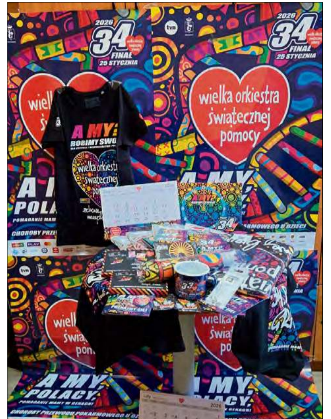
Strzeleczyki są już prawie gotowe na finał Wielkiej Orkiestry Świątecznej Pomocy.

Organizatorzy zwracają się z apelem do osób prywatnych, przedsiębiorców, firm i organizacji o wsparcie inicjatywy. Poszukiwane są przedmioty, bony, vouchery i usługi na licytację. Mile widziane są również propozycje artystycznych występów, pokazów lub innych prezentacji. Wszystkie osoby zainteresowane współpracą proszone są o kontakt z Gminnym Ośrodkiem Kultury w Strzeleczykach. Szczegółowe informacje