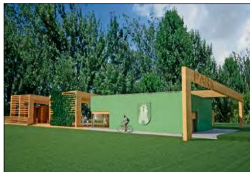
A tak obiekt będzie wyglądał po modernizacji.

Inwestycja jest pokłosiem deklaracji złożonej przez burmistrza Gogolina Krzysztofa Reinerta, dotyczącej utworzenia miejsca dedykowanego gogolińskiej młodzieży. Samorząd gminy Gogolin ogłosi przetarg na wyłonienie wykonawcy przebudowy jeszcze w pierwszym kwartale tego roku.