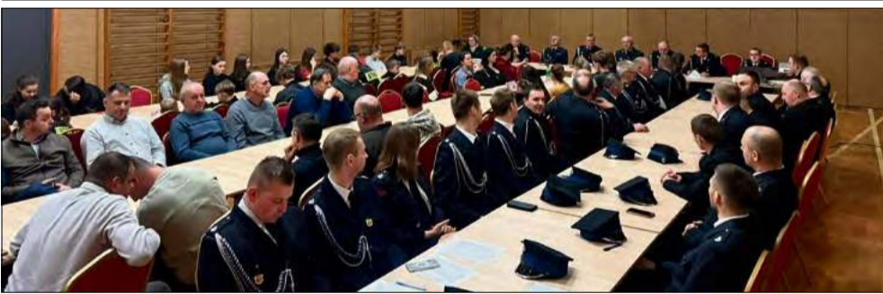
W wydarzeniu uczestniczyli członkowie czynni, wspierający i honorowi jednostki, Drużyna Dziecięca oraz Młodzieżowa Drużyna Pożarnicza.

We wtorek 6 stycznia odbyło się Walne Zebranie Sprawozdawczo-Wyborcze Ochotniczej Straży Pożarnej w Łowkowicach. Spotkanie służyło podsumowaniu pięcioletniej kadencji ustępujących władz oraz wyborowi nowego zarządu na kolejną kadencję.