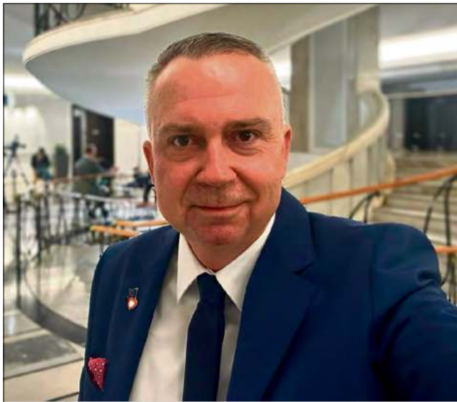
„Pozostaję wierny swoim ideałom.” – senator dr Piotr Woźniak podkreśla ciągłość wyznawanych wartości mimo politycznych zmian.

- Odpowiadając na to pytanie nie będę zbyt oryginalny, ale i nie chcę. Bezpieczeństwo narodowe z uwagi na dynamizm zdarzeń geopolitycznych jest bezapelacyjnie najważniejszym wyzwaniem. Polska funkcjonuje w ciągłym zagrożeniu ze strony Rosji