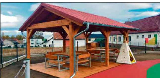
Przy Gminnym Żłobku w Walcach powstał nowy, bezpieczny plac zabaw z nawierzchnią syntetyczną i bogatym wyposażeniem, w tym huśtawkami, zjeżdżalnią, altaną i kąciakiem ogrodniczym.