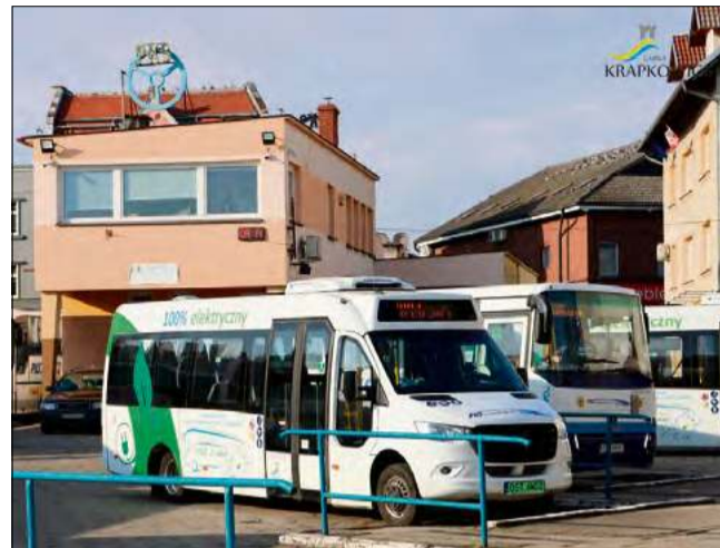
Obecny dworzec w Krapkowicach nie spełnia już oczekiwanych standardów.

Planowany czas realizacji inwestycji wynosi około 1,5 roku, a jej zakończenie przewidywane jest do maja 2027 roku. Centrum Przesiadkowe będzie jedną z największych inwestycji infrastrukturalnych realizowanych w Krapkowicach w najbliższych latach.