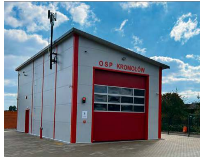
Przy remizie Ochotniczej Straży Pożarnej w Kromołowie wybudowano nowy, jednostanowiskowy garaż z zapleczem sanitarnym i magazynowym.

Choć wiele inwestycji to milionowe kwoty, ich efekt widać w drobnych sprawach dnia codziennego: jaśniejszych ulicach, suchych jezdniach po ulewie, nowych