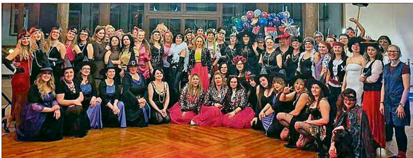
Frekwencja podczas zabawy dopisała.

W sobotę 17 stycznia odbył się babski comber w Górażdżach. Impreza zgromadziła kilkadziesiąt pań. Tego dnia atrakcji nie brakowało.