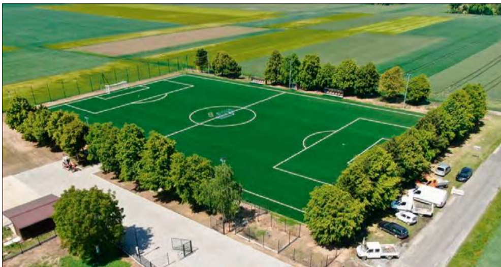
Pełnowymiarowe boisko piłkarskie w Brożcu powstało na miejscu dawnego boiska trawiastego.

Równoległe gmina za-inwestowała w coś, czego na pierwszy rzut oka nie widać, ale co ma ogromne znaczenie przy intensywnych opadach – kanalizację deszczową. Nową sieć wykonano na ulicach Reymonta, Hauptmana, Miłosza i Sienkiewicza. Łączna długość sieci wyniosła 1,48 km. Koszt całego zadania drogowo-kanalizacyjnego to 2 807 469,02 zł.