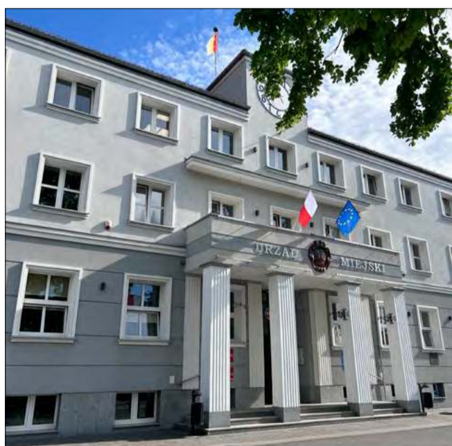
Rok 2025 przyniósł w gminie Gogolin pewne zmiany na lepsze. Liczba urodzeń wzrosła do 80 (45 dziewczynek i 35 chłopców).

Mimo zauważalnej poprawy między rokiem 2024 a 2025 (wzrost uro-