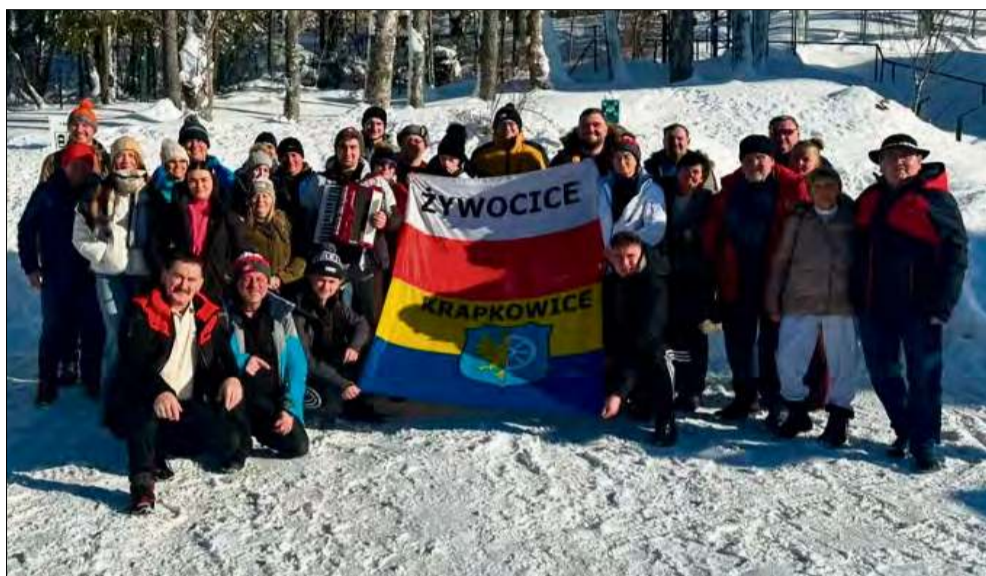
Kibice z gminy Krapkowice z biało-czerwoną oraz flagą gminy dopingowali polskich skoczków podczas zawodów Pucharu Świata w Zakopanem.

Tegoroczne zawody miały jednak szczególny wymiar. Po raz ostatni na zakopiańskim obiekcie w ramach Pucharu Świata wystartował Kamil Stoch – trzykrotny indywidualny mistrz olimpijski, jeden z najwybitniejszych polskich sportowców XXI wieku. Skoczek z Zębu już przed rozpoczęciem sezonu zapowiedział, że będzie to jego ostatni rok