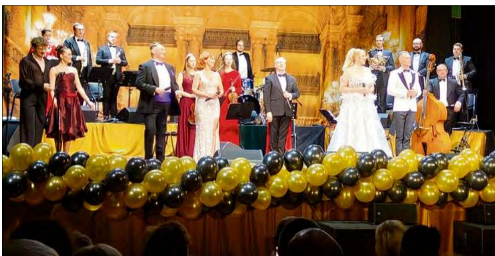
(matt), fot. solectwo Oleszka

Dwa koncerty Wielkiej Gali Wiedeńskiej stanowiły piękne rozpoczęcie Nowego Roku. Wydarzenie okazało się eleganckim i pełnym wspaniałej muzyki wieczorem, który na długo pozostanie w pamięci uczestników. Koncerty potwierdziły, że lokalne inicjatywy kulturalne mogą przybierać formę profesjonalnych i wzruszających artystycznych przeżyć.