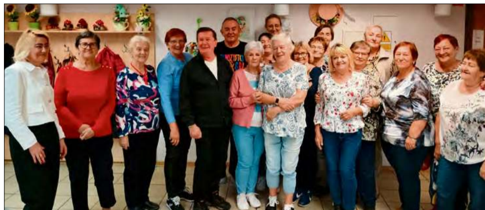
Domy Dniennego Pobytu „Jarzębina” i „Stokrotka” to placówki, gdzie codzienność można wypełnić aktywnością, rozwojem osobistym i wartościowym towarzystwem.

Miejsko-Gminny Ośrodek Pomocy Społecznej w Zdieszowicach zaprasza w nowym roku starszych i niepełnosprawnych mieszkańców gminy do skorzystania z bogatej oferty zajęć w Domach Dniennego Pobytu „Jarzębina” i „Stokrotka”. Ośrodki oferują terapię, aktywność rekreacyjno-kulturalną oraz wsparcie w integracji społecznej.