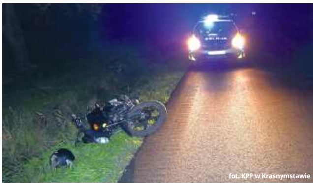
fol. KPP w Krasnymstawie

● GM. IZBICA W wypadku drogowym w Izbicy ranny został 39-letni motorowerzysta. Jak się okazało, mężczyzna był nietrzeźwy oraz posiada aktywny sądowy zakaz prowadzenia pojazdów mechanicznych.