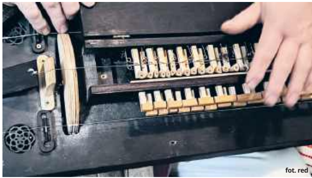
Mechanizm liry jest niby prosty, ale nastrojenie instrumentu wymaga wiedzy i dobrego słuchu

Zastępowała początkowo organy, a za jej obsługę odpowiadał nie jeden, a dwóch muzyków. Jeden poruszał korbką i napędzał kołowy smyczek, a drugi wydobywał, przy pomocy klawiatury instrumentu, odpowiednie tony. To prawda - w lirze odnaleźć moż-