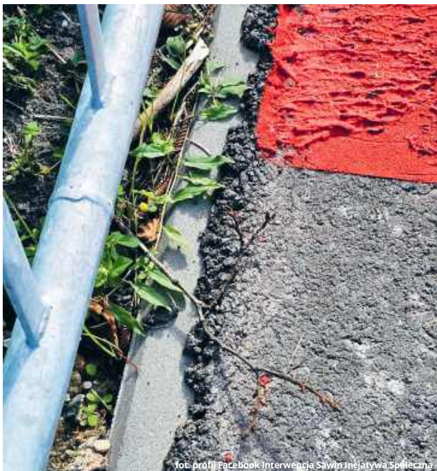
Niektóre elementy zostały wykonane niedokładnie

Kolejne rysy na nowej nawierzchni, spękane betonowe obrzeża i czarne, asfaltowe „plamy wstępu”. Ci mieszkańcy gminy, którzy wnikliwie obserwują przebieg prac przy ścieżce pieszo-rowerowej w ciągu drogi wojewódzkiej nr 812, wskazują na kolejne zjawiska, które z dnia na dzień wzbudzają w nich coraz większy niepokój. Pojawiają się też, oczywiste w tym kontekście, pytania o przyszłość. Niektórzy uważają, że nowa ścieżka nie przetrwa nawet kilku lat.