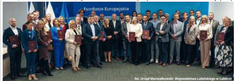
fol. Urząd Marszałkowski Województwa Lubelskiego w Lublinie

Łączna wartość projektów objętych umowami to niemal 132 miliony złotych, z czego prawie 62 miliony stanowi dofinansowanie z Unii Europejskiej.