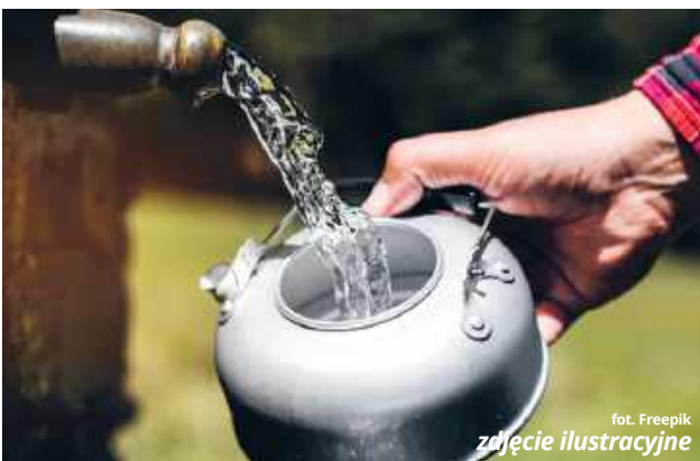
fol. Freepik zdjęcie ilustracyjne

● GM. CHEŁM W jednym z naszych ostatnich artykułów na temat założeń „Programu Ochrony Ludności i Obrony Cywilnej na lata 2025-2026” informowaliśmy o tym, że gmina Chełm zamierza kupić agregaty prądotwórcze, beczkowozowy do przewożenia wody pitnej, kontenery, radiotelefony cyfrowe, przenośne banki energii oraz kuchnię polową. Teraz przyszedł czas na to, aby zapisać na papierze plany wprowadzić w życie.