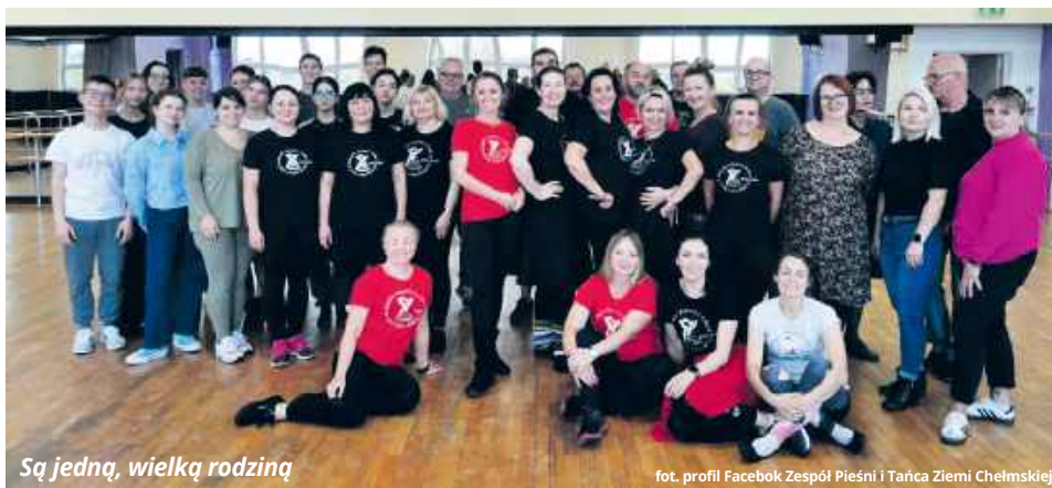
Są jedną, wielką rodziną

- To jedno z najpiękniejszych doświadczeń, jakie towarzyszy mi w prowadzeniu zespołu.