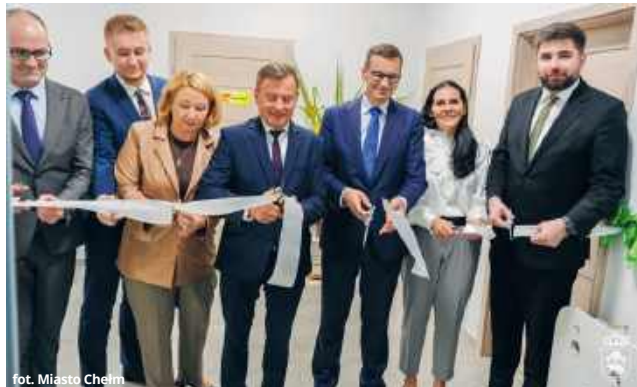
fol. Miasto Chełm

Poziom wsparcia zależał od wielkości firmy - mikro i małe przedsiębiorstwa mogły liczyć na 70% dofinansowania, średnie - na 60 procent. W ramach naboru złożono 71 wniosków na ponad 136 milionów złotych. Ostatecznie dofinansowanie otrzymały 33 projekty. (apm)