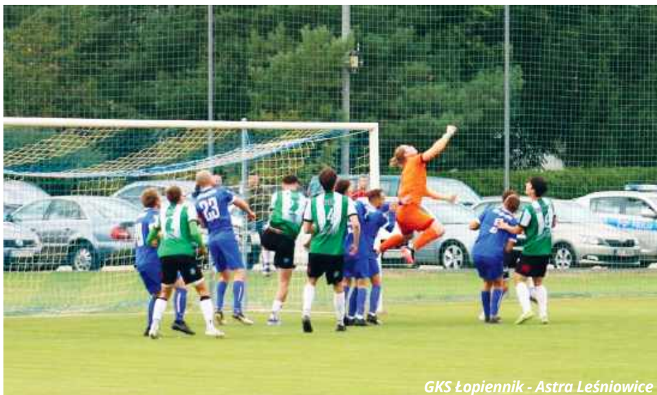
GKS Łopiennik - Astra Leśniowice

Na drugie miejsce w okręgowej tabeli wskoczył Brat Siennica