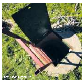
fol. OSP Urszulin

Do zdarzenia doszło w piątek (26 września) około godzi-