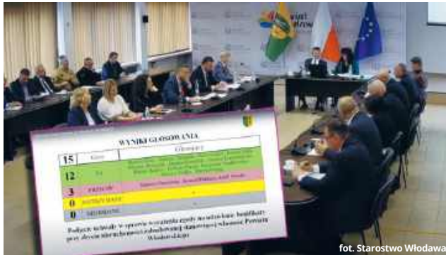
WYNIKI GŁOSOWANIA 15 12 3 0 0

W poniedziałek, 29 września, rada powiatu podjęła uchwałę dotyczącą udzielenia bonifikaty przy zbyciu nieruchomości przy ul. Sztabowej we Włodawie na rzecz Wojska Polskiego. Decyzja, choć budząca pewne dyskusje, została przyjęta większością głosów i ma na celu wzmocnienie bezpieczeństwa regionu oraz wsparcie lokalnej gospodarki.