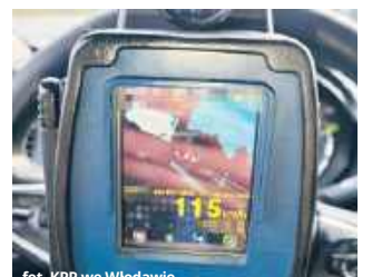
fol. KPP we Włodawie

● GM. WŁODAWA Policjanci włodawskiej drogówki zatrzymali 19-letnią kierującą, która w obszarze zabudowanym pędziła z prędkością 115 km/h. Jak się okazało, tego dnia obchodziła urodziny, a prawo jazdy posiadała zaledwie od roku.