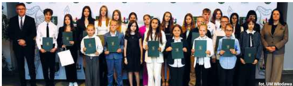
fol. UM Włodawa

2024/25 trafiły do uczniów, którzy wyróżnili się nie tylko wzorowymi wynikami w nauce, ale także sukcesami w konkursach przedmiotowych, olimpiadach, zawodach sportowych oraz przedsięwzięciach artystycznych.