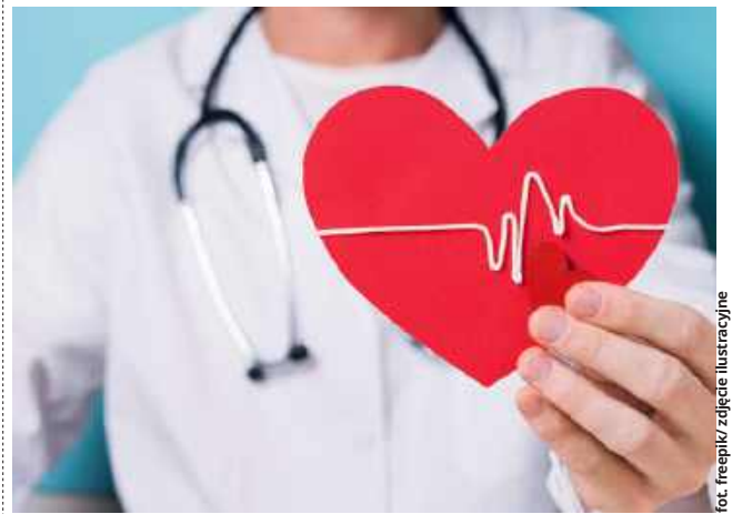
fol. freepik/zdjęcie ilustracyjne