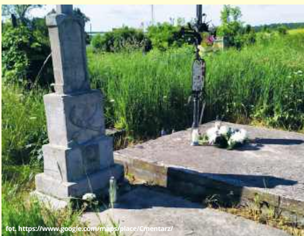
Grupa będzie mogła zadbać między innymi o takie mogiły