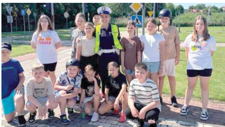
Dzieci przystępujące do egzaminu na kartę rowerową wykazały dobrą znajomość przepisów ruchu drogowego i wszystkie zdały egzamin wzorowo

Egzamin odbywał się na specjalnie przygotowanym miasteczku ruchu drogowego przy Szkole Podstawowej nr 1 w Opolu Lubelskim. Uczniowie, którzy wcześniej zaliczyli część teoretyczną, musieli wykazać się również praktyczną znajomością zasad poruszania się po drogach - skrętami, zatrzymywaniem się, sygnalizowaniem manewrów oraz odpowiednią reakcją na znaki drogowe.