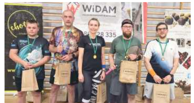
(Warszawa / UKS Badminton Puławy)