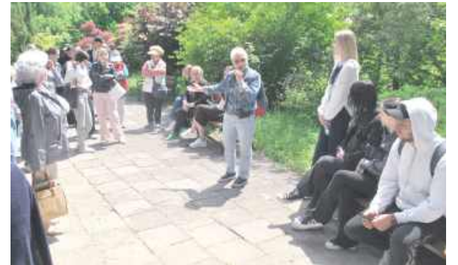
Jedną z części projektu była wycieczka do Muzeum Stefana Żeromskiego w Nałęczowie

Projekt „UTW dla Społeczności” realizuje Towarzystwo Inicjatyw Twórczych „ę” w ramach programu „Uniwersytety Trzeciego Wieku - Seniorzy w Akcji” Polsko-Amerykańskiej Fundacji Wolności.