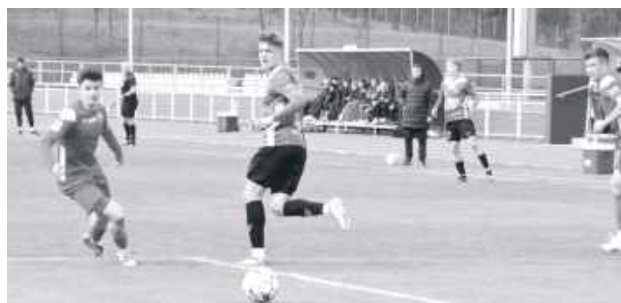
Wiele na to wskazuje, że w nowym sezonie Wisła Puławy zagra w Klasie A

To koniec pewnej epoki. Wisła Puławy - klub, który jeszcze niedawno rywalizował na zapleczu Ekstraklasy, w nadchodzącym sezonie wystąpi w... Klasie A.