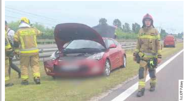
Kobieta kierująca hyundaiem chciała uniknąć zderzenia z renault, ale straciła panowanie nad autem, uderzyła w bariery energochłonne, a następnie w scianę, którą wyprzedzał kierowca renault

Do zdarzenia doszło w poniedziałek, 23 czerwca, po południu na drodze ekspresowej S17 na wysokości Markuszowa. W kierunku Lublina jechała ciężarówka, za nią osobowe renault, którego kierowca - 30-latek z powiatu białobrzeskiego (woj. mazowieckie), postanowił wyprzedzić ciężarówkę. Mężczyzna przestawił się na drugi pas ruchu. Jadąc nim swoim hyundaiem 24-latką z Warszawy, widząc manewry kierowcy renault i chcąc uniknąć zderzenia z pojazdem, który znalazł się na jej pasie, wykonała manewr, wskutek którego straciła panowanie nad autem i uderzyła w bariery energochłonne. Hyundai odbił się od nich i uderzył w scianę.