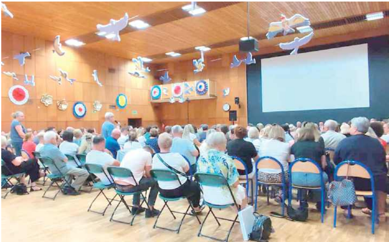
Jak widać, lokalna społeczność jest mocno zainteresowana sprawą. Aula Szkoły Podstawowej w Poniatowej wypełniła się niemal po brzegi

Jednak, jak przyznał burmistrz, temat wojska w Poniatowej