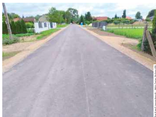
Nowy odcinek drogi w Łęce. Teraz tędy jedzie się komfortowo

Generalnym wykonawcą robót była renomowana firma STRABAG Sp. z o.o. Całkowity koszt inwestycji wyniósł 789 550,74 zł, z czego aż 538 473,60 zł (68,20 proc.) pochodziło z dofinansowania w ramach „Polskiego Ładu”. Dzięki temu znaczną część kosztów pokryto ze środków zewnętrznych, co znacząco odciążało budżet gminy.