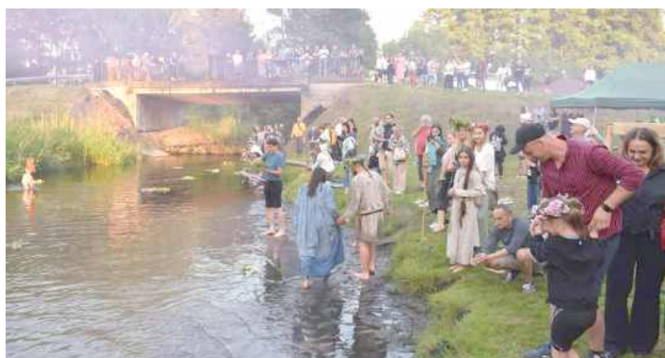
W klimatycznym otoczeniu grodziska uczestnicy mogli przenieść się w czasie i poczuć ducha dawnych tradycji

Wydarzenie zgromadziło wielu mieszkańców i gości, a organizatorzy już zapowiadają kolejną edycję.