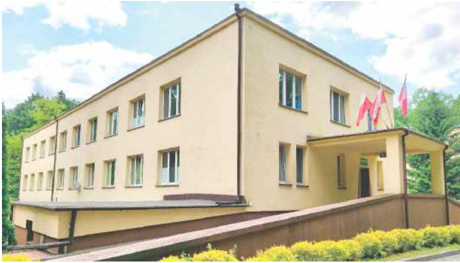
W Poradni Gruźlicy i Chorób Płuc w Poniatowej rozpoczął się generalny remont. To pierwsza od przeszło 30 lat taka kompleksowa inwestycja

Intymność i bezpieczeństwo w czasie badań zapewnić ma pacjentom nowoczesny gabinet zabiegowo-diagnostyczny. Wydzielone zostanie