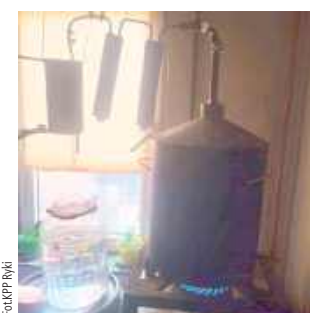
Podczas przeszukania ujawniono aparaturę do domowego wytwarzania alkoholu oraz wyprodukowany alkohol, jak i zacier

Gdy mundurowy podszedł bliżej, okazało się, że jest to faktycznie uruchomione urządzenie właśnie produkujące alkohol. Podczas przeszukania przeprowadzonego wspólnie z policjantem z pionu kryminalnego ujawniono aparaturę do domowego wytwarzania alkoholu