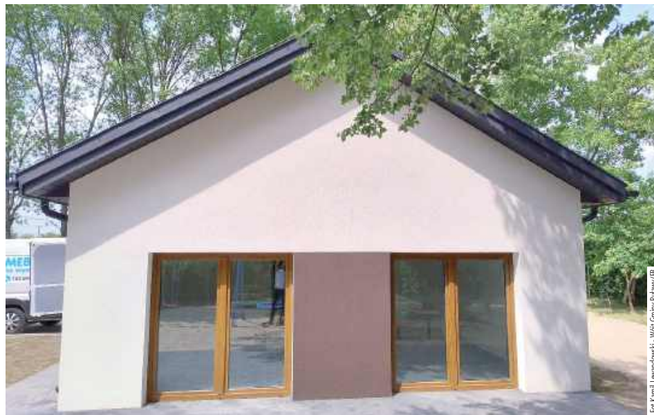
Budynek nowej świetlicy w Piskorowie nie przypomina obiektu sprzed remontu

Mieszkańcy Łęki w gminie Puławy mogą już korzystać z nowego, asfaltowego odcinka drogi gminnej. Inwestycja o wartości blisko 790 tys. zł została zrealizowana dzięki dofinansowaniu z „Polskiego Ładu”. Zakończono również budowę nowej świetlicy wiejskiej w Piskorowie. Obiekt powstał w miejscu niszczonego budynku dawnej remizy, który przez lata stracił funkcje użytkowe.