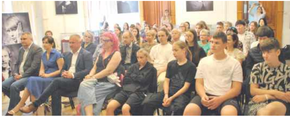
W spotkaniu udział wzięli uczniowie ZSZ w Opolu Lubelskim, ale również ze Szkoły Podstawowej nr 1 im. Kornela Makuszyńskiego i Szkoły Podstawowej nr 2 im. Oskara Kolberga w Opolu Lubelskim

W wydarzeniu uczestniczyli członkowie UTW w Opolu Lu-