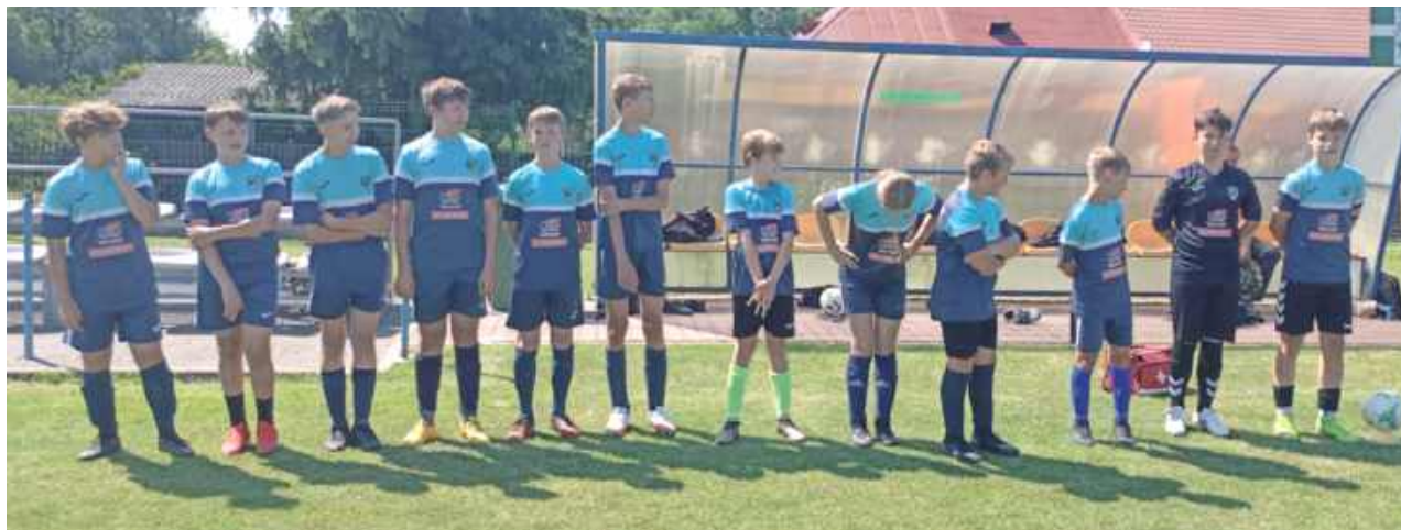
Orzełki z Łazisk sięgają po mistrzostwo Lubelskiej Ligi Młodzików Starszych