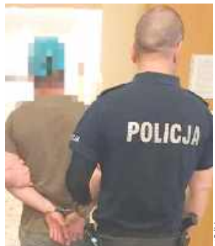
Mężczyzna trafił do aresztu

Policjanci zatrzymali 39-latkę. Jednocześnie wdro-