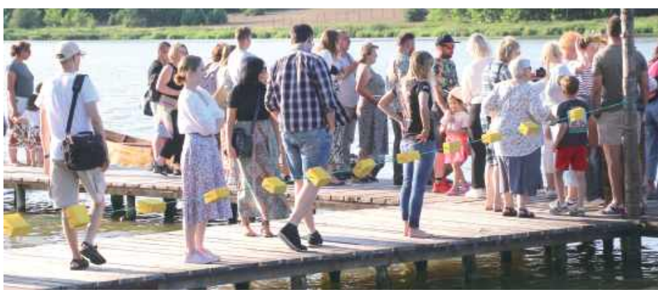
Jednym z najbardziej wyczekiwanych momentów wieczoru było puszczanie wianków na wodzie – rytuał zakorzeniony w ludowej tradycji, który jak co roku przyciągnął tłumy uczestników

W sobotę, 21 czerwca w malowniczym otoczeniu Zalewu w Janowicach już po raz trzeci odbyły się tradycyjne Sobótki Janowieckie – wydarzenie nawiązujące do dawnych słowiańskich obrzędów Nocy Kupały. To święto światła, ognia, wody i kwiatów po raz kolejny zgromadziło licznie mieszkańców i turystów pragnących poczuć ducha słowiańskiej tradycji.