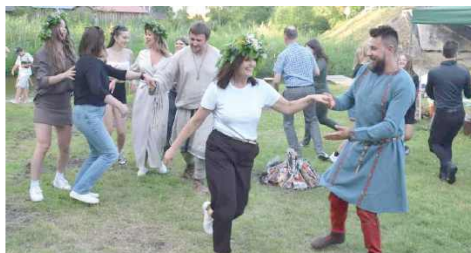
Tańce to jedna z najważniejszych i najbardziej charakterystycznych części Nocy Kupały

Publiczność mogła podziwiać koncert zespołu „Baba na Niedźwiedziu”, pokaz wczesnośredniowiecznej sztuki walki w wykonaniu Bielskiej Drużyny Najemnej „Svantevit”, wziąć udział w warsztatach plecienia wianków, podziwiać inscenizację Nocy Kupały i skosztować