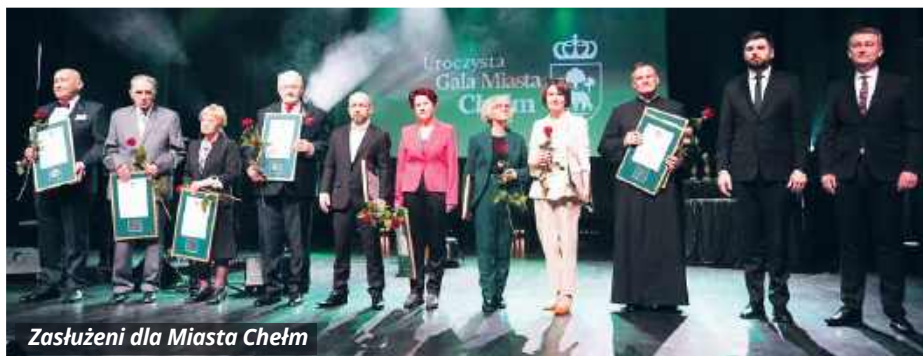
Zasłużeni dla Miasta Chełm