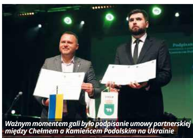
Ważnym momentem gali było podpisanie umowy partnerskiej między Chełmem a Kamieńcem Podolskim na Ukrainie