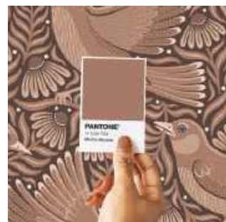
Mocha Mousse został wybrany przez Instytut Pantone na kolor roku 2025

Mocha Mousse to także doskonała baza do eksperymentów z innymi kolorami. Jego neutralny charakter pozwala na łączenie go zarówno z delikatnymi pastelami, jak i z moc-