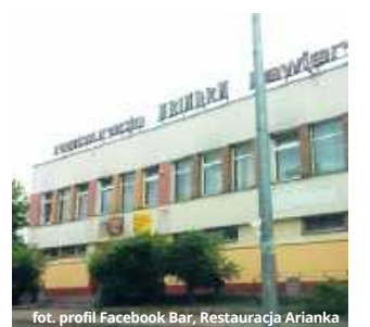
W znanej restauracji powstanie teraz centrum lokalnej integracji i azyl dla ludzi kultury

- Początkowo właściciel wycenił obiekt na kwotę 1,2 mln