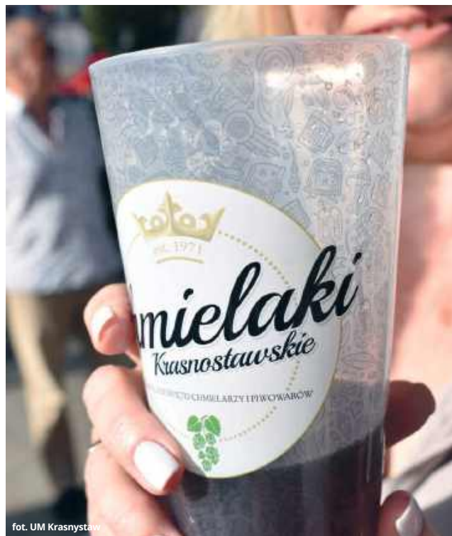
fol. UM Krasnystaw

- Chmielaki Krasnostawskie to nie tylko koncerty, tradycje chmielarskie i twórczość ludowa, ale również wydarzenia sportowe. Półmaraton Chmielakowy to świetna okazja, by połączyć sportową pa-