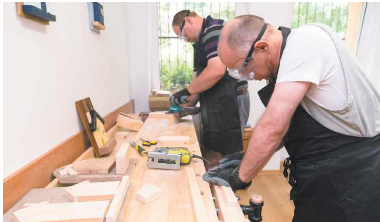
Realizacja projektu „ZA KROKIEM KROK” w ramach Działania 11.2 Usługi społeczne i zdrowotne RPO WL 2014-2020 w Powiatowym Centrum Pomocy Rodzinie w Kraśniku

Wspieranie aktywnego włączenia społecznego w celu promowania równości szans, niedyskryminacji i aktywnego uczestnictwa w życiu społecznym oraz zwiększanie zdolności do zatrudnienia, w szczególności grup w niekorzystnej sytuacji – to cel szczególny naboru w ramach Działania 8.1 Aktywizacja społeczna i zawodowa programu Fundusze Europejskie dla Lubelskiego 2021-2027. Na przedmiotowe wsparcie zabezpieczono środki w wysokości blisko 2,7 mln zł!