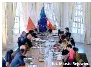
radni. Miasto Rejowiec

- Te dokumenty nie ujrzały tak naprawdę światła dziennego. Z pewnością są osoby, np. nauczyciele, którzy chcieliby