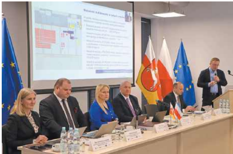
Prezydium Komitetu Monitorującego FEL 2021-2027 podczas XX posiedzenia w dniu 17 marca 2025 r. w Lublinie