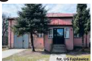
fol. UG Fajslawice

GM. FAJSŁAWICE Wojewódzki Fundusz Ochrony Środowiska i Gospodarki Wodnej w Lublinie przyznał dotację w wysokości 500 tys. zł na termomodernizację budynku remizy OSP w Suchodołach w ramach inicjatywy „Bitwa o remizy”.