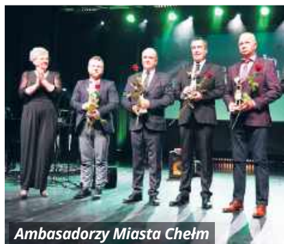
Ambasadorzy Miasta Chełm