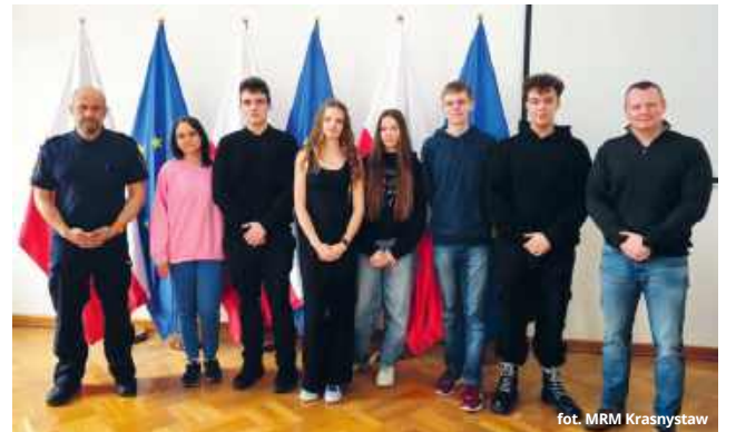
fol. MRM Krasnystaw

- Spotkanie było wynikiem ustaleń z ostatniej sesji młodzieżowej rady i dotyczyło