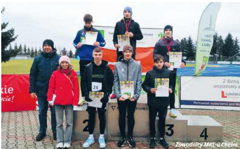
Zawodnicy MKL-u Chełm