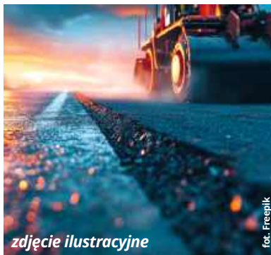
zdjęcie ilustracyjne

● GM. CHEŁM Wydaje się, że przebudowa drogi powiatowej, która łączy Okszów-Kolonię ze Srebrzyszcem, to jedno z tych zadań inwestycyjnych, jakie zarząd powiatu musi tymczasem odłożyć „ad acta”. Nie po myśli inwestora poszły działania związane z opracowaniem dokumentacji projektowej, a i gmina ma wątpliwości związane z wydaniem niezbędnej decyzji o środowiskowych uwarunkowaniach dla tego przedsięwzięcia.