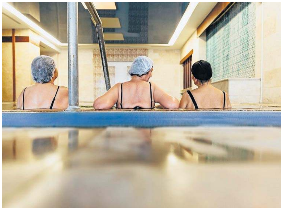
Aby leczyć się w sanatorium za granicą, trzeba spełnić określone warunki

NFZ zwraca kuracjom koszty wszystkich zabiegów w ramach standardowego leczenia sanatoryjnego, czyli tych, które byłyby refundo-