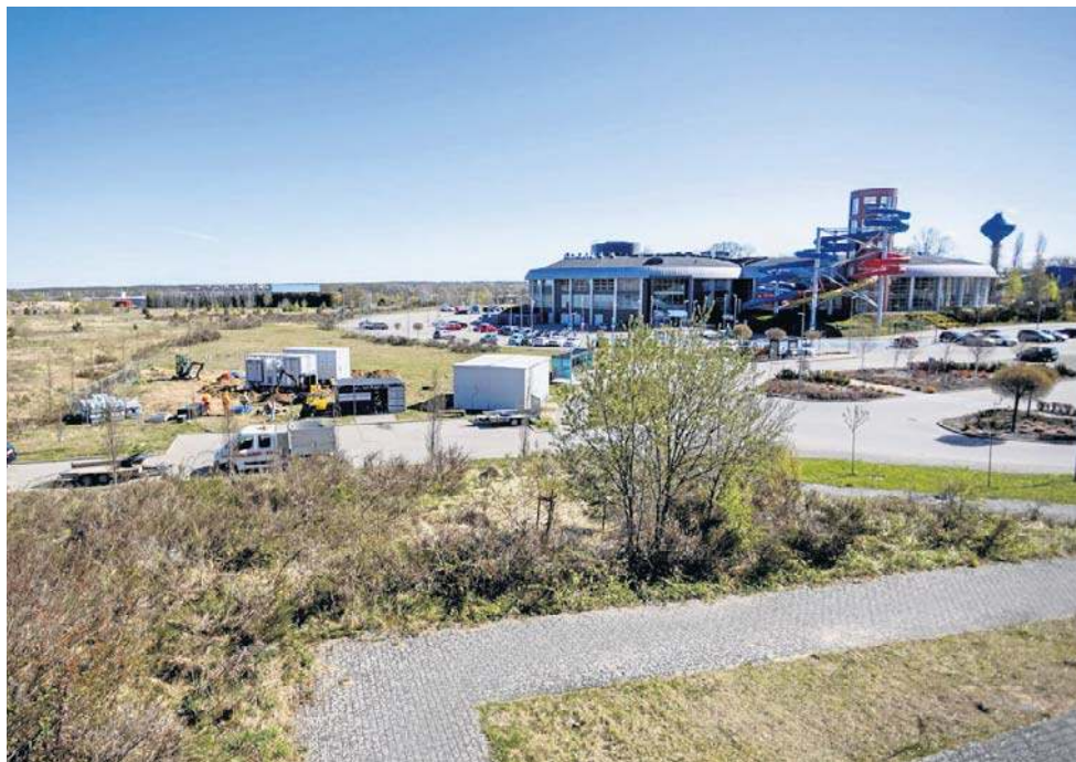
Mimo niekorzystnych wyników badań budowa nowej hali przy Parku Wodnym Trzy Fale nie jest wykluczona