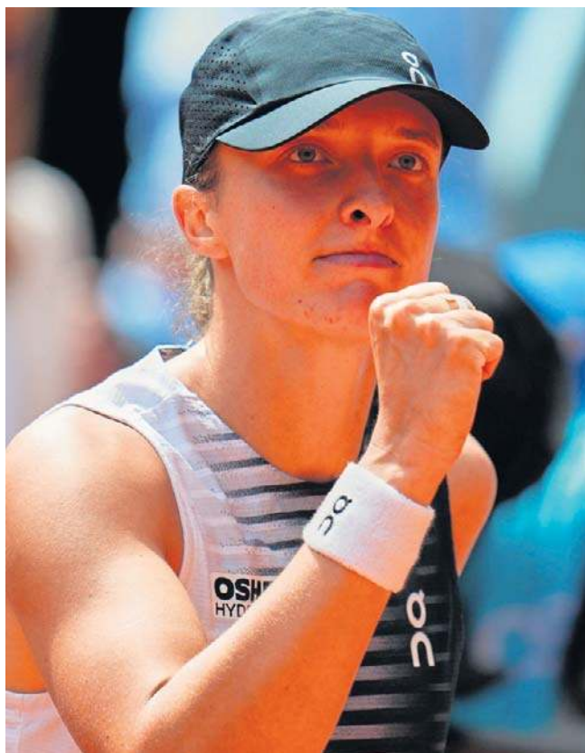
Iga Świątek wciąż myśli o powrocie na szczyt rankingu tenisistek. Kolejnym krokiem będzie Rzym

Przyczyną dolegliwości zdrowotnych był najprawdo-