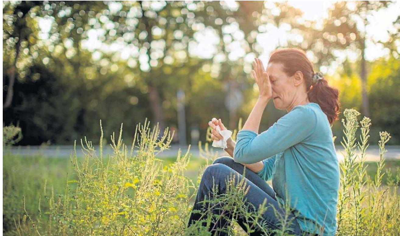
Osoby, które regularnie i intensywnie trą oczy, są nawet pięć razy bardziej narażone na rozwój stożka rogówki. To postępująca choroba, która może skutkować pogorszeniem jakości widzenia

Szczególnie zagrożone są osoby z chorobami alergicznymi oczu, m.in. alergicznym zapaleniem spojówek, atopowym zapaleniem spojówki lub rogówki czy kontaktowym zapaleniem skóry powiek. Ryzyko wzrasta także u osób z egzemą, atopowym zapaleniem skóry (zwłaszcza obejmującym powieki) oraz astmą.