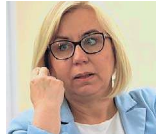
Paulina Hennig-Kloska, min. klimatu i środowiska

Premier Donald Tusk podkreślił, że głosowanie nad wotum nieufności dla ministra klimatu będzie testem