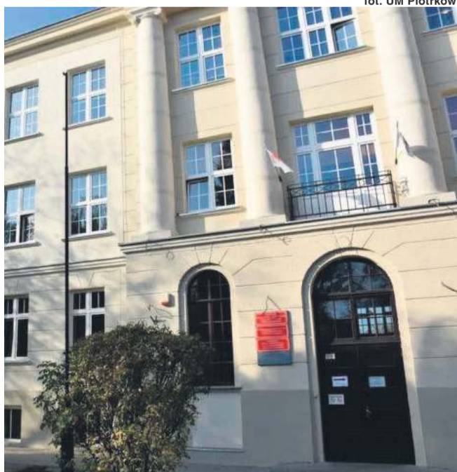
fol. UM Piotrków