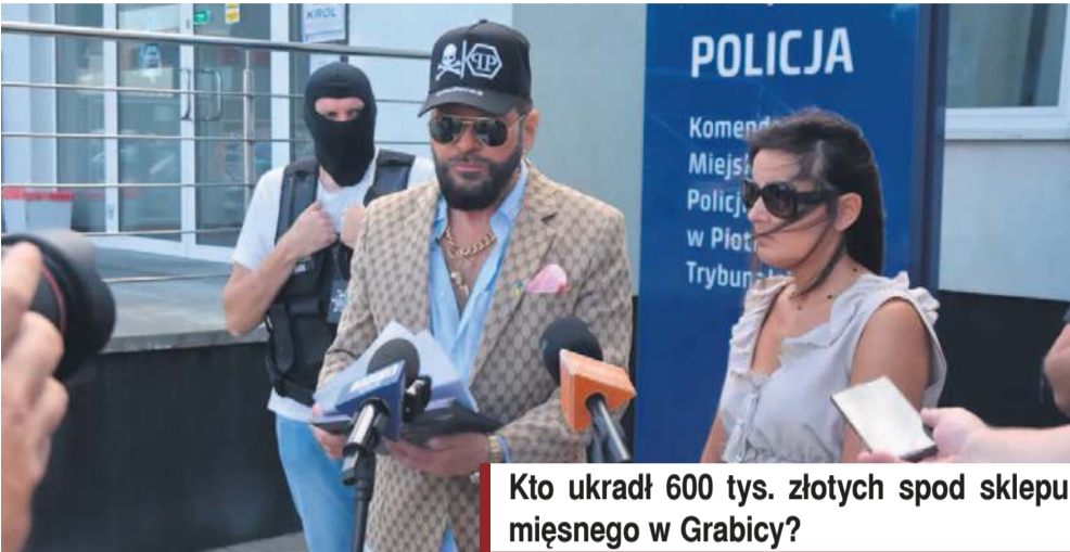
Kto ukradł 600 tys. złotych spod sklepu mięsnego w Grabicy?

Kiedyś detektyw, poseł po prostu Krzysztof Rutkowski zajął się sprawą zuchwałej kradzieży w gminie Grabica. Chodzi o 600 tysięcy złotych. Pan Krzysztof zorganizował coś na wzór konferencji prasowej przed budynkiem KMP w Piotrkowie. Niestety w czapce więc nie można było podziwiać jego słynnej fryzury zwanej potocznie gniazdem.