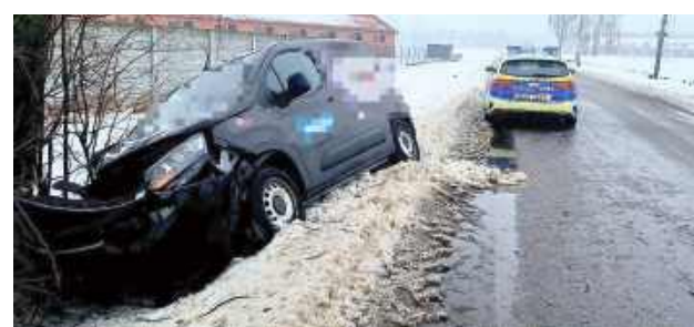
We wtorek (27 stycznia) rano w miejscowości Radcze pojazd automatycznie powiadomił służby o kolizji drogowej

We wtorek (27 stycznia) rano w miejscowości Radcze pojazd automatycznie powia-