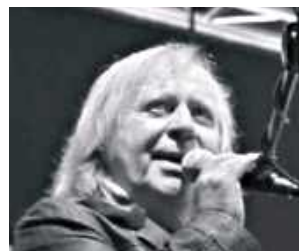
Romuald Lipko (1950 - 2020) lider budki Suflera związany był z Kazimierzem Dolnym, gdzie mieszkał wraz z żoną. Często można było spotkać go na kazimierskim Rynku. Przegrał z chorobą nowotworową

W niedzielę, 8 lutego o godzinie 13 kazimierski Rynek wypełni się muzyką jednego z najwybitniejszych polskich kompozytorów - Romualda Lipko.