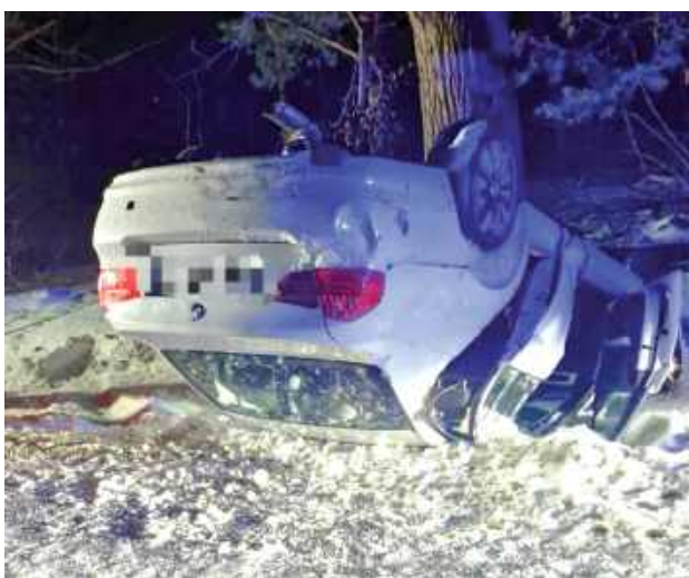
Kierowca podróżował sam i wyszedł z wypadku bez obrażeń