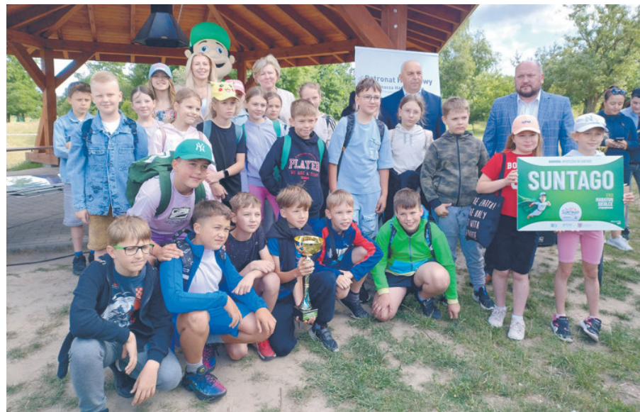
Zwycięzca ex aequo w kategorii klas I-III klasa III a z SP nr 10.