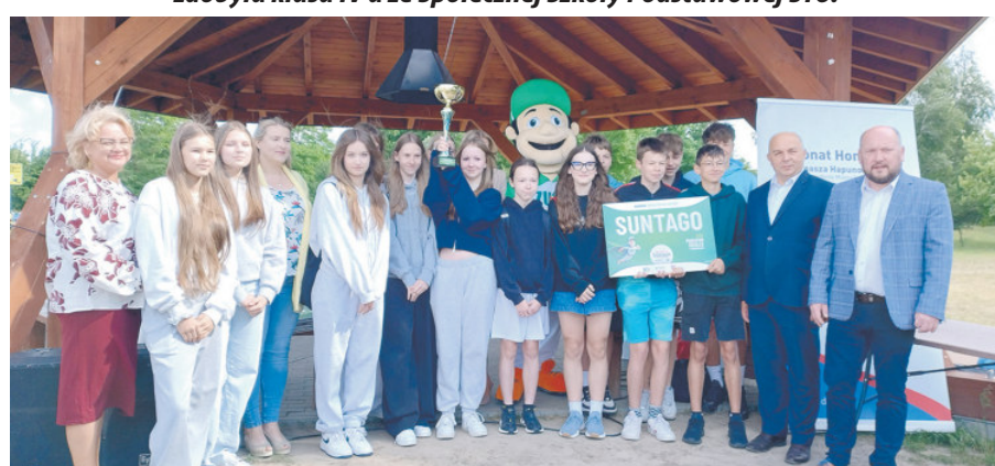
Zwycięzcą w kategorii klas VII-VIII została klasa VII b z SP nr 11.