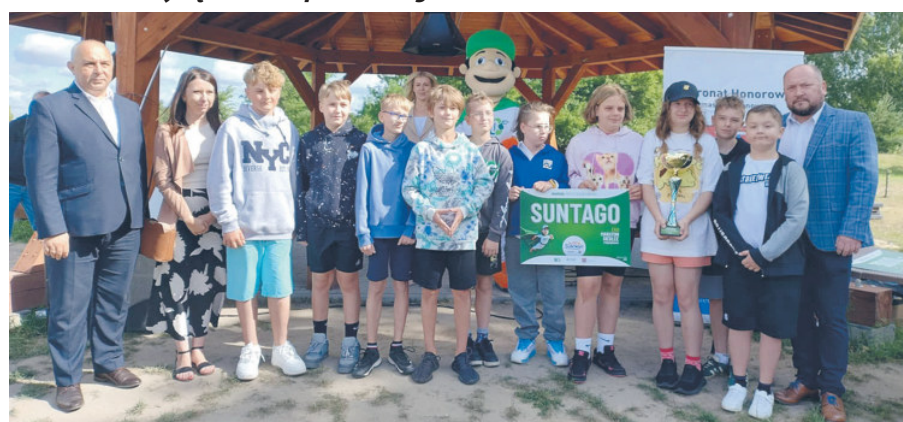
W kategorii klas IV-VI pierwsze miejsce zdobyła klasa IV a ze Społecznej Szkoły Podstawowej STO.