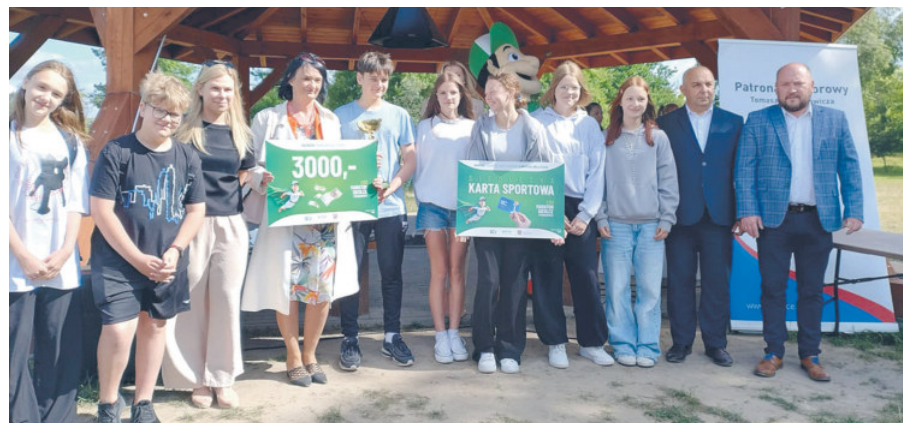
Szkoła Podstawowa nr 12 wygrała w kategorii najlepsza szkoła i otrzymała 3 tys. zł.

Jak podkreśla, już pierwsza edycja przyniosła spodziewany efekt. – Najlepsza inwestycja to inwestycja w dzieci. Obecnie są one bardziej wyedukowane niż dorośli. Słyszymy, że to dziecko zwraca uwagę rodzicom, żeby zakreślili kran czy segregowali odpady. Bardzo nas to cieszy – podsumowuje wiceprezes ZUO.