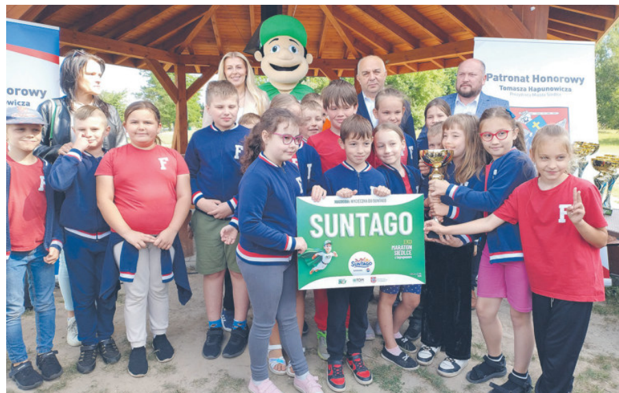
Zwycięzca ex aequo w kategorii klas I-III klasa II f z SP nr 8.