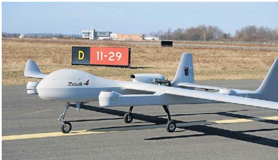
Uczestnicy warsztatów mieli okazję zobaczyć bezzałogowy statek powietrzny ZEUS VTOL, który wykonał próbę kołowania po pasie startowym krośnieńskiego lotniska

- Naszym partnerem mogą być uczelnie wojskowe, które