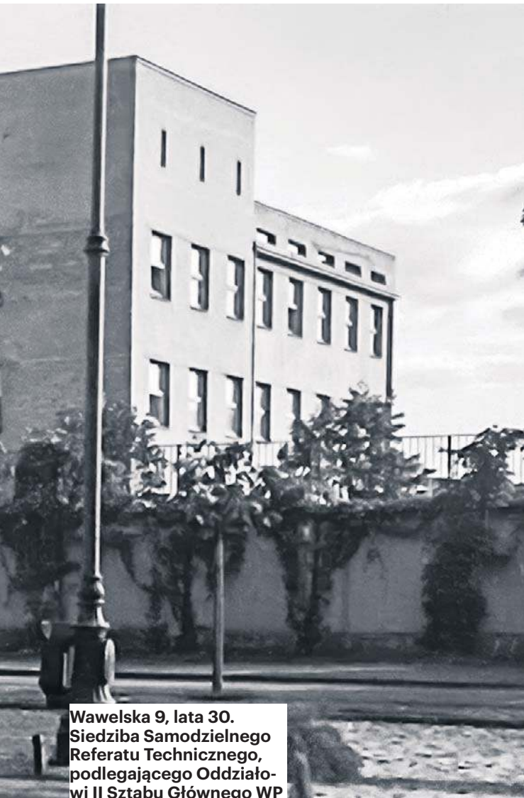
Wawelska 9, lata 30. Siedziba Samodzielnego Referatu Technicznego, podlegającego Oddziałowi II Sztabu Głównego WP

nad różnego rodzaju substancjami toksycznymi, gazami bojowymi.