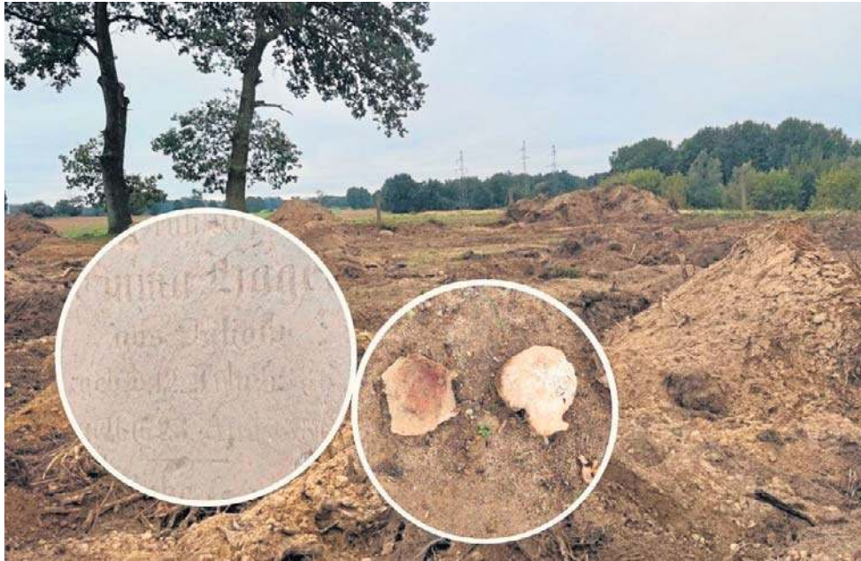
W połowie listopada prokuratorzy podjęli decyzję o wszczęciu postępowania w ramach art. 261§1 kodeksu karnego, czyli znieważenia zwłok i prochów ludzkich

Na finalne decyzje prokuratury czekają też w Urzędzie Gminy Biesiekierz. Od początku tej sprawy wójt Tomasz Hołowaty nie krył swojej dez-