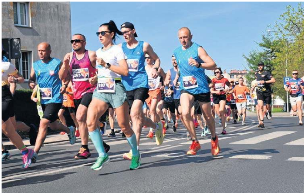
273 osoby ukończyły Bieg Eryka w Darłowie

W Darłowie miało miejsce majowe szkolenie Polskiej Organizacji Ashihara Karate (POAK) w którym uczestniczyli zawodnicy i instruktorzy z woj. zachodniopomorskiego i pomorskiego oraz 4 zawodników z Ukrainy. Umiejętności doskonalili na 6 treningach z udziałem na grupę dzieci i dorosłych. Zajęcia prowadził prezes