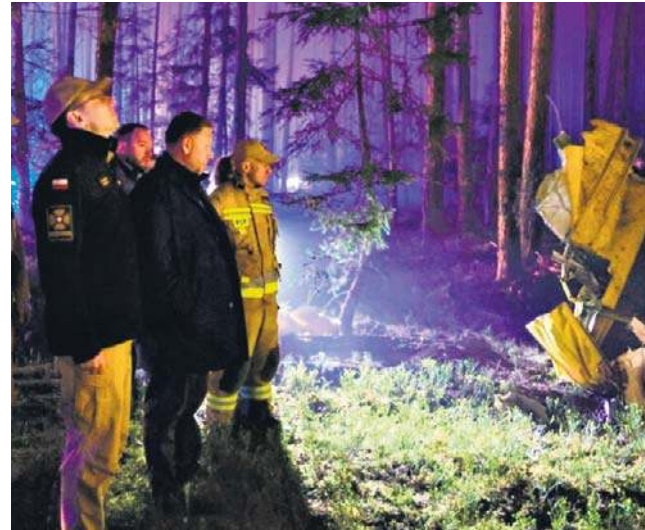
Podczas akcji gaśniczej w biłgorajskich lasach zginął pilot sterujący Dromaderem

W związku ze śmiercią pilota leśnicy, służby i przedstawiciele rządu, samorządów, premier i prezydent złożyli wy-