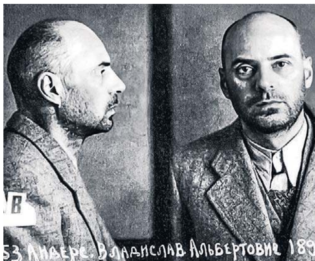
Władysław Anders na zdjęciu wykonanym po aresztowaniu przez NKWD, 1940 rok

Potem historia przyspieszyła. 10 sierpnia 1941 roku gen. Anders otrzymał nominację na stanowisko dowódcy Armii Polskiej w ZSRR i został awansowany do stopnia generała dywizji ze starszeństwem z 11 sierpnia.