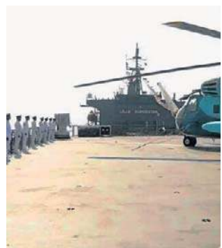
W wyniku irańskich ataków na statki handlowe zginęło dotąd 10 marynarzy USA

Według niego USA zrealizowały wszystkie założone cele,