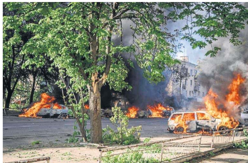
W ciągu doby w rosyjskich atakach zginęło 27 osób, 120 zostało rannych

Władze obwodu charkowskiego podały w środę w godzinach porannych, że Rosjanie zaatakowali jedną z dzielnic Charkowa. Uszkodzone zostały