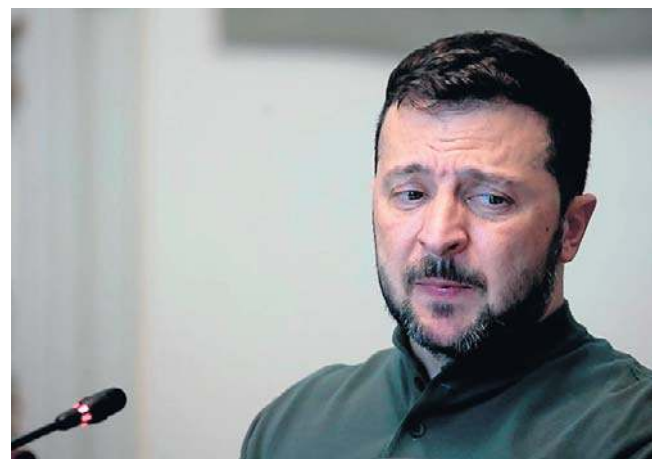
Prezydent Zelenski zaproponował podzielenie się doświadczeniem w walce z dronami

Ukraiński przywódca odwiedził w ciągu ostatnich dwóch miesięcy kilka państw Bliskiego Wschodu, w tym dwukrotnie Arabię Saudyjską, Zjednoczone Emiraty Arabskie, Katar czy Syrię. Zelenski informował wcześniej, że Ukraina rozpoczęła współpracę z państwami tej części świata, dzieląc się z nimi doświadczeniem w walce z irańskimi dronami.