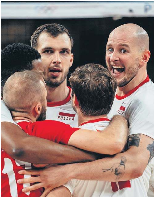
Wszystko wskazuje na to, że tych panów nie zobaczymy w tym sezonie w naszych barwach narodowych...